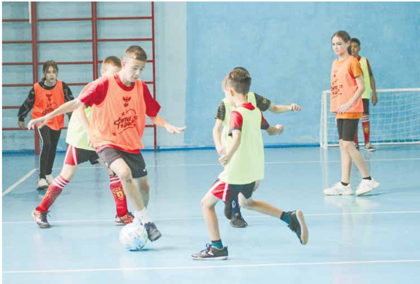
С новым инвентарем даже рядовая тренировка становится интереснее.