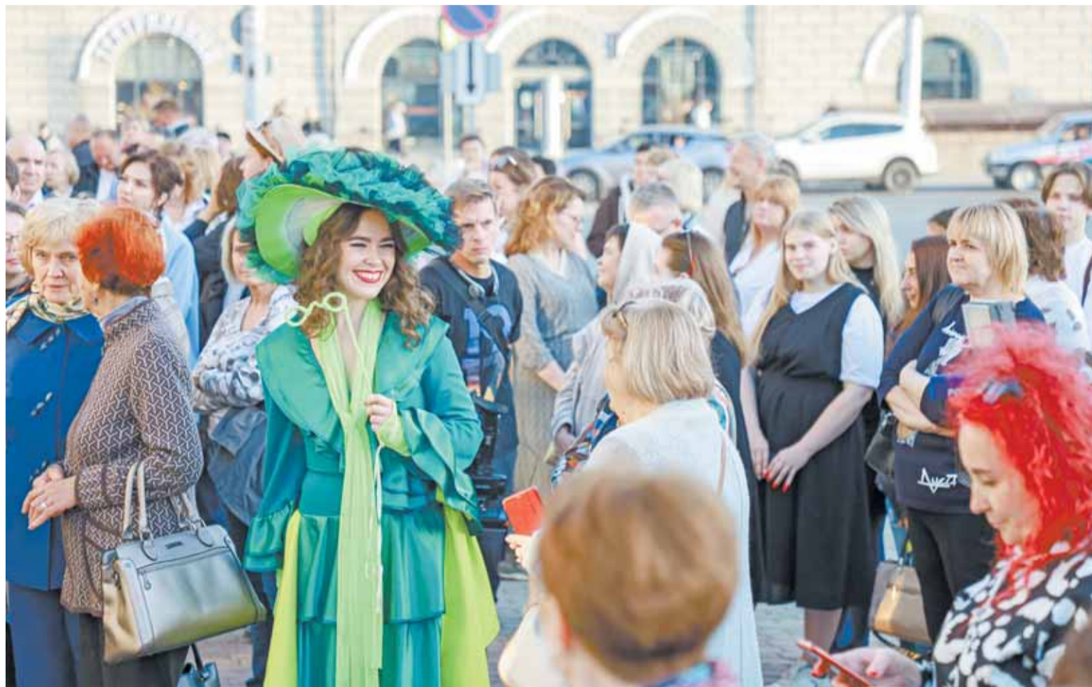
Золотухинский фестиваль стал ярким явлением для зрителей - билеты на него были раскуплены задолго до начала показов.