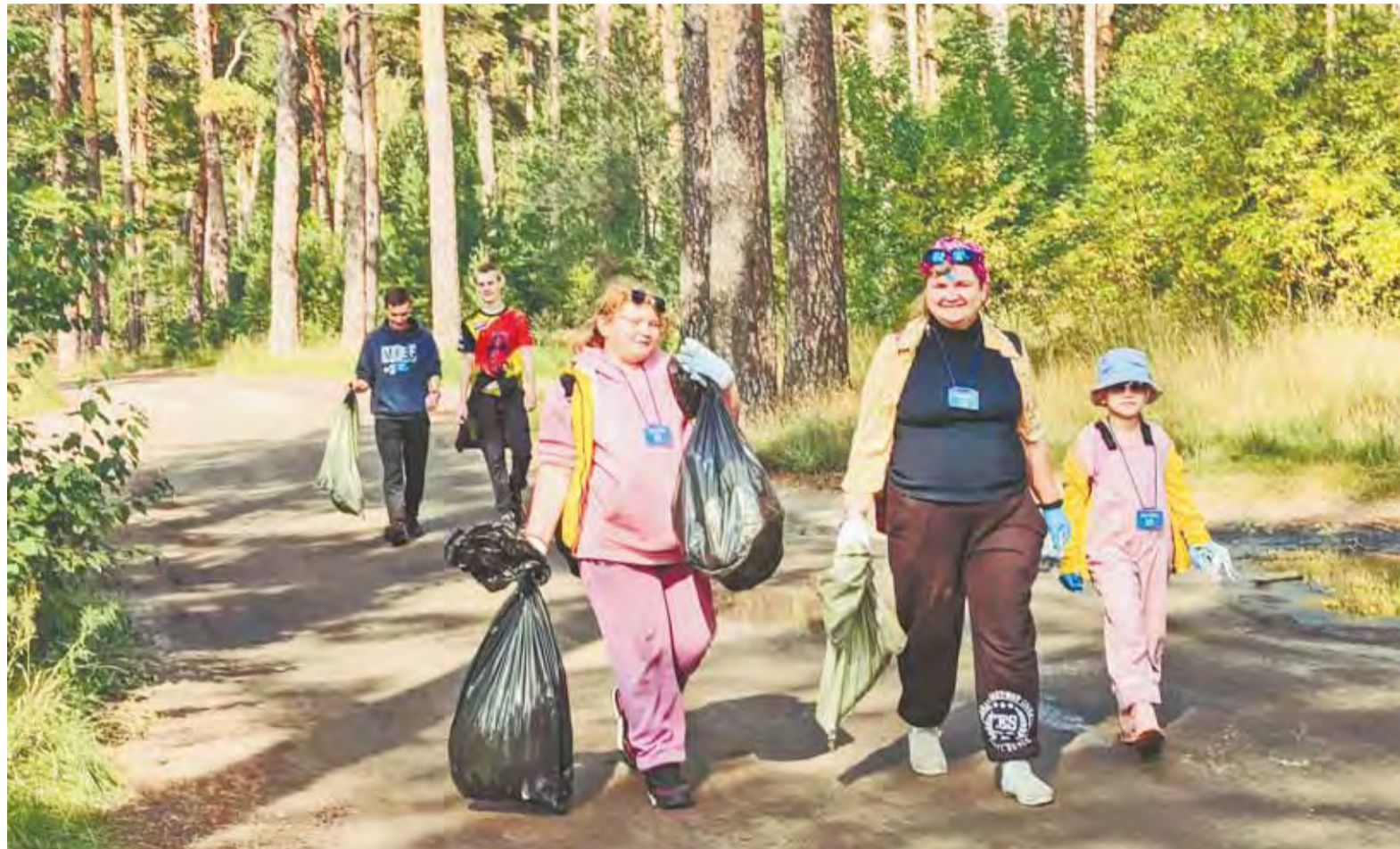
86 игроков распределили на 21 команду, которые за полтора часа собрали 272 мешка с мусором – это почти 2,3 тонны.

– Не смотрите, что я седой и пожилой, на самом деле я студент третьего курса АГУ, –