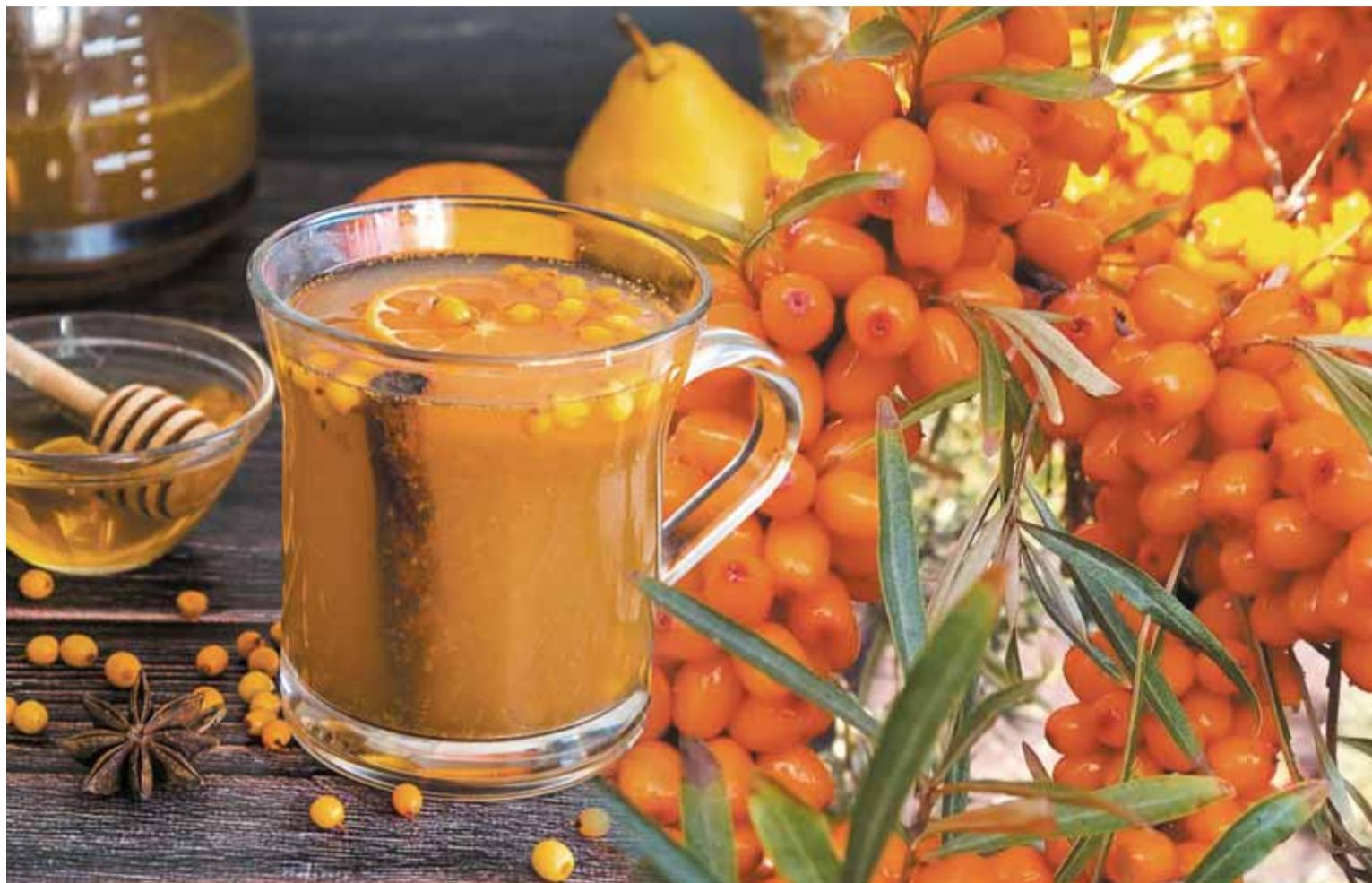
Коллаж Александра ЕРМОЛОВИЧА

Плоды облепихи можно сушить, при этом полезные свойства сырья хорошо сохраняются. Зимой такую ягодку можно будет использовать в качестве основы для чая, а также как начинку для любых кулинарных изделий.