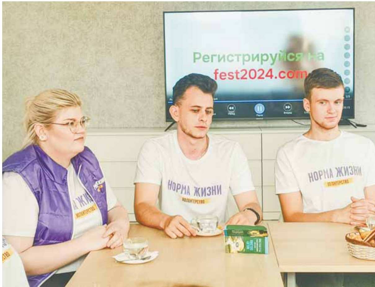
Участие в фестивале – это бесценный опыт для каждого волонтера.

Наш край вошел в 20 регионов страны, где будут