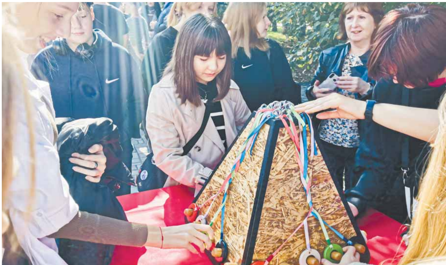
Игровыми форматами фестиваль не ограничился.