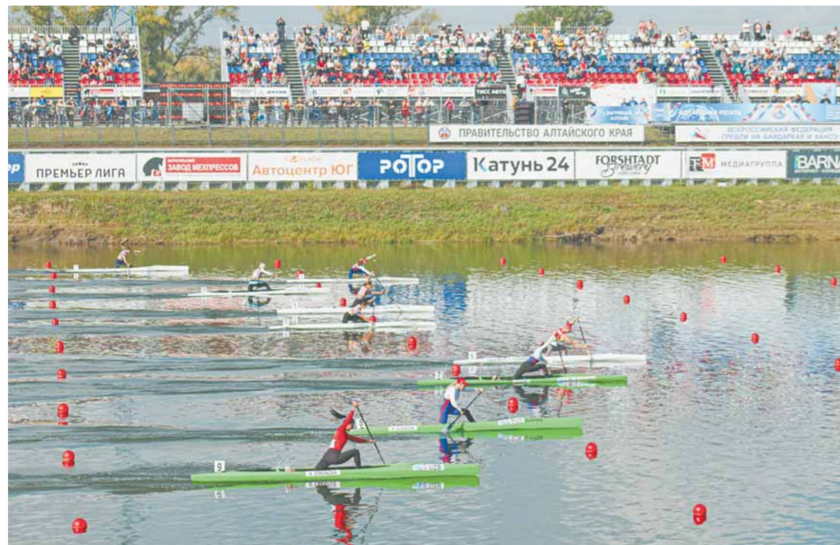
Больше трехсот спортсменов приняло участие в Кубке ААА, из них почти 40 – в основных соревнованиях байдарочников и каноистов.

Подводя после закрытия итоги, организаторы отметили, что не ошиблись с выбором.