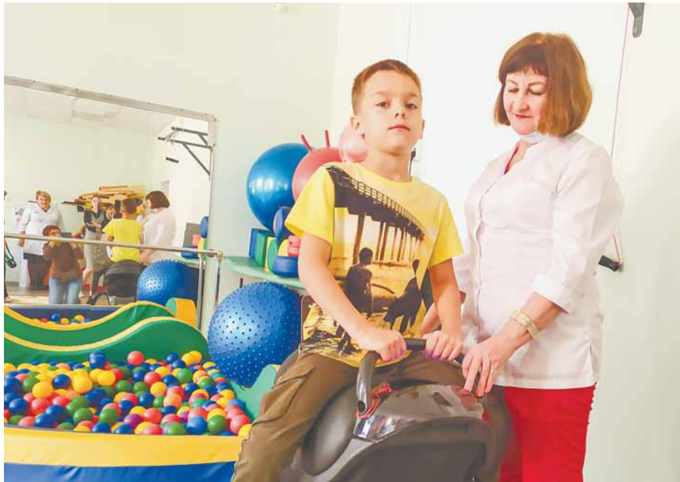
Иппотренажер помогает ребятам с нарушением опорно-двигательного аппарата укрепить мышцы спины и ног.

Отделение реабилитации детской поликлиники № 5 пополнилось новой медтехникой