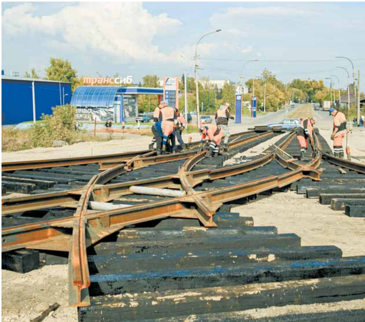
Укладку трамвайных путей начали с улицы Кулагина.

Пятница, 22 сентября 2023 г. № 140 (5813)