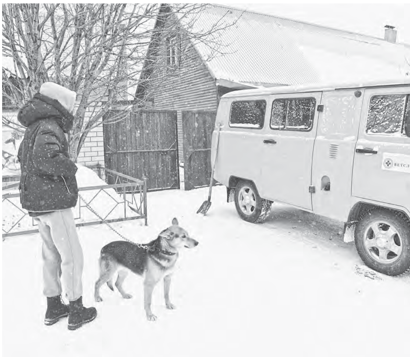
Несмотря на мороз, горожане активно приводили питомцев в мобильный пункт.

В краевой столице продолжается чипирование собак