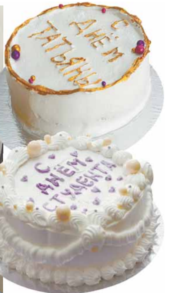
Студенты в ходе мастер-класса сами пропитали коржи, разместили на них ягодную начинку и белковый крем, украсили торты в разных стилях.