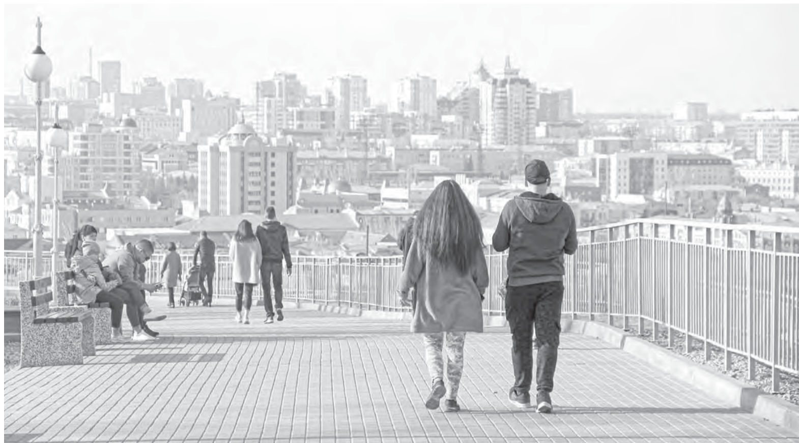
Большинство законодательных нововведений касается социальной сферы.

Нововведения в Закон «О транспортном налоге в Алтайском крае» расширили льготы по транспортному налогу для многодетных семей, ветеранов боевых действий, а также членов семей погибших