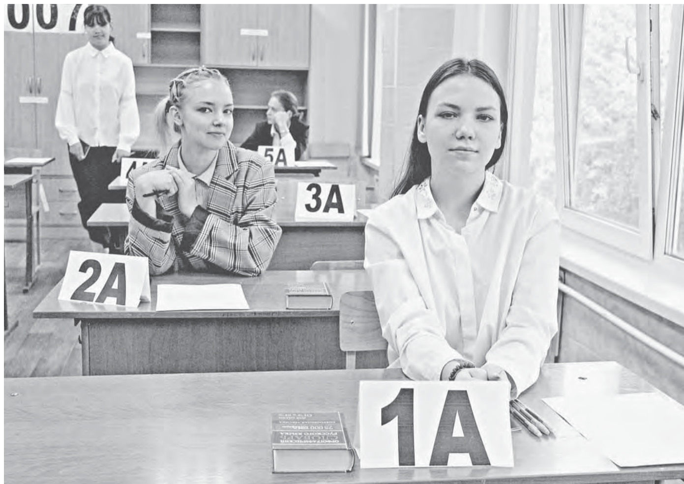
На экзаменах по отдельным предметам допускается использование справочных материалов. Они предоставляются организаторами.