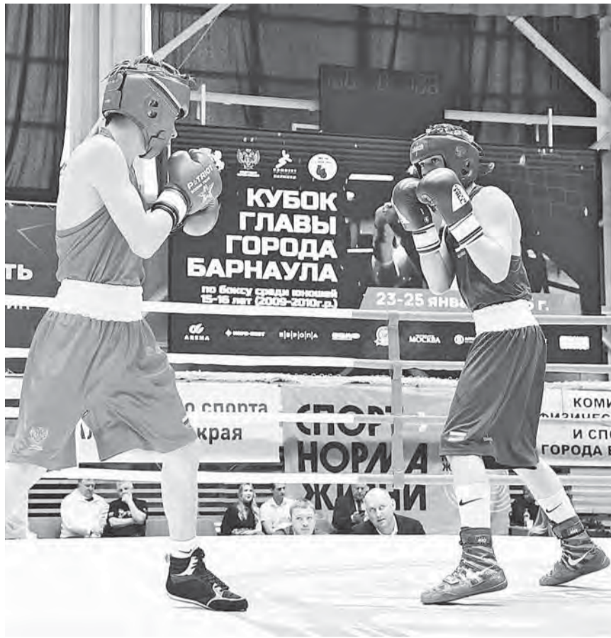
Участники соревнований проявили характер и волю к победе.