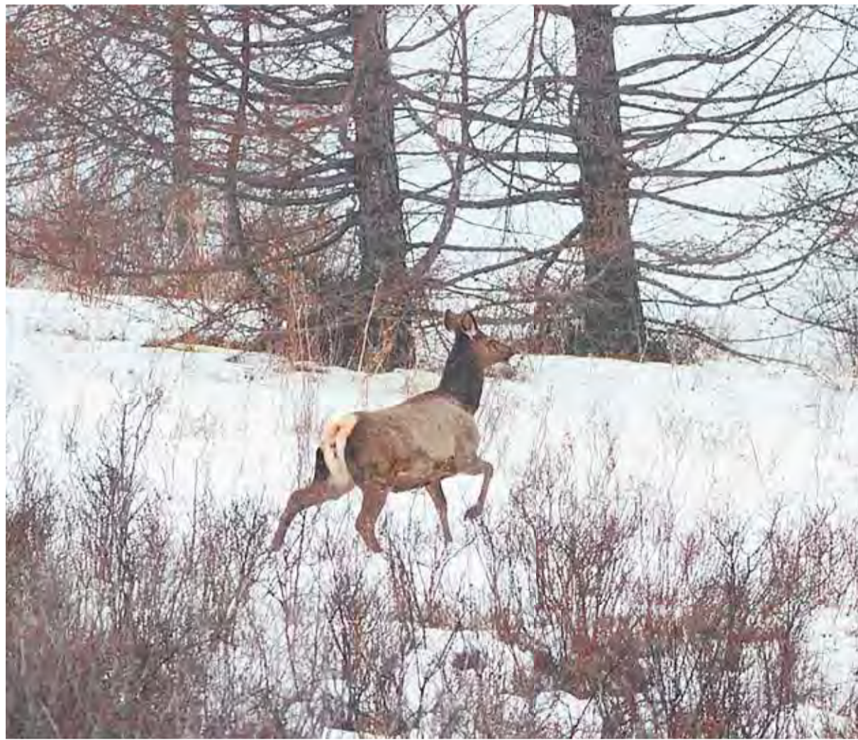
Сейчас в Тигирекском заповеднике проходит зимний учет копытных.

– Сомневаюсь. На самих маршрутах и околотуристиче-