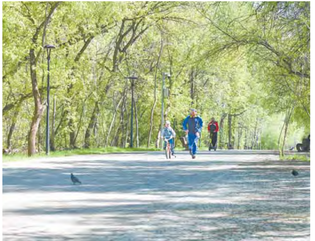
Мониторинг позволяет оценить состояние зеленых насаждений.

В результате обследовано более 62 тыс. зеленых насаждений. В ходе мониторинга оценивалось состояние корневой системы, положение ствола и веток, наличие на деревьях трещин и повреждений. По результатам осмотра принималось решение о санитарной обрезке, частичном кронировании или о сносе дерева, если оно уже аварийное, не приносит пользу и представляет опасность. Полученные сведения были переданы в профильный комитет для формирования перечня деревьев, подлежащих омолаживающей, формовочной обрезке, сносу и удалению пней.