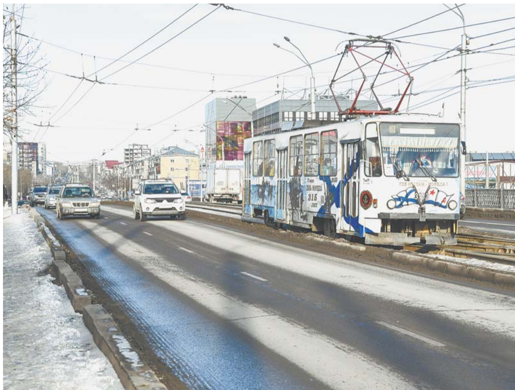
Реконструкция путепровода – назревшее мероприятие.

7 декабря мы приняли замечания по проекту реконструкции и сейчас их исправляем, чтобы к 14 декабря, как и планировали, могли получить положительное заключение экспертизы, – доложил