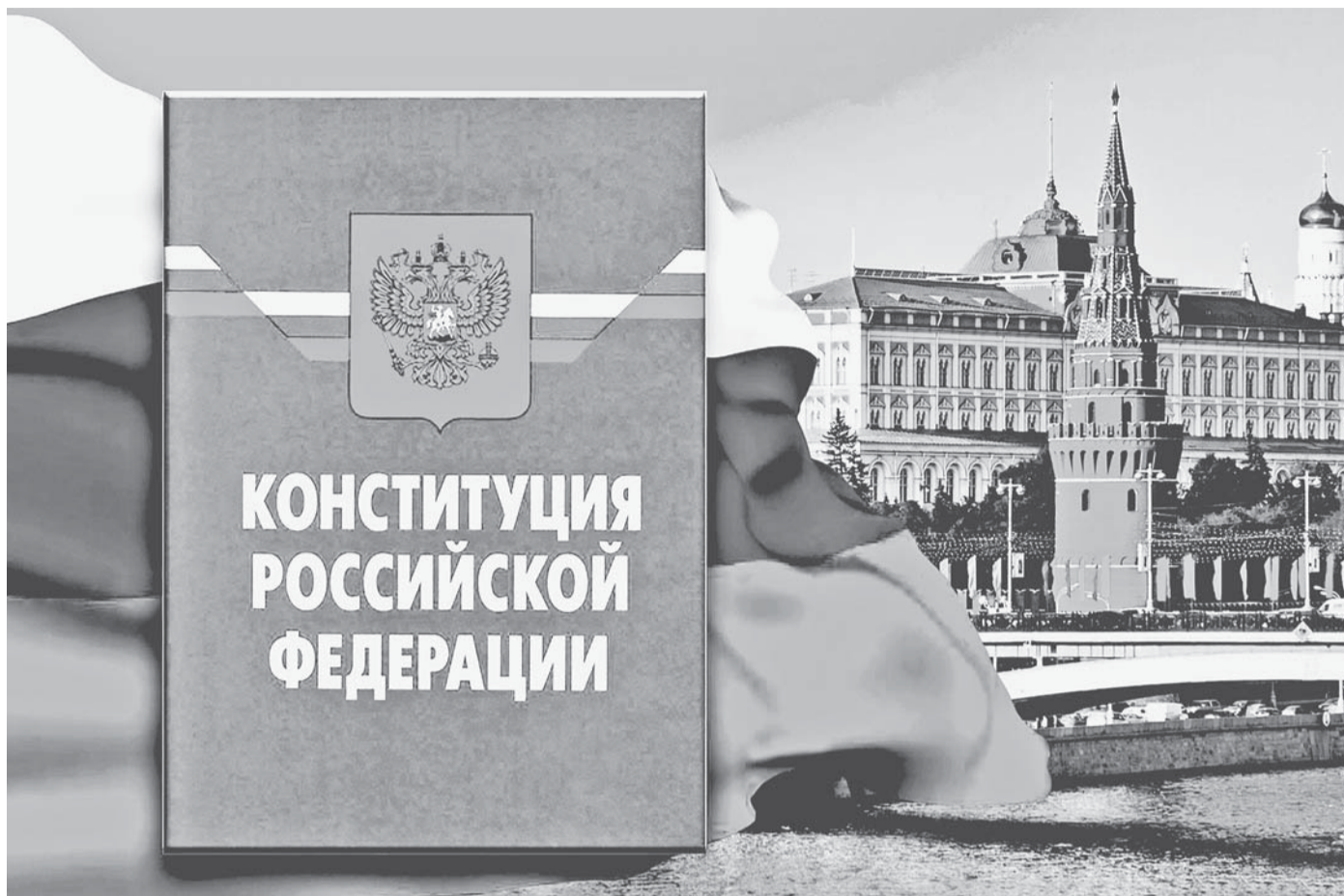
Коллаж Александра ЕРМОЛОВИЧА