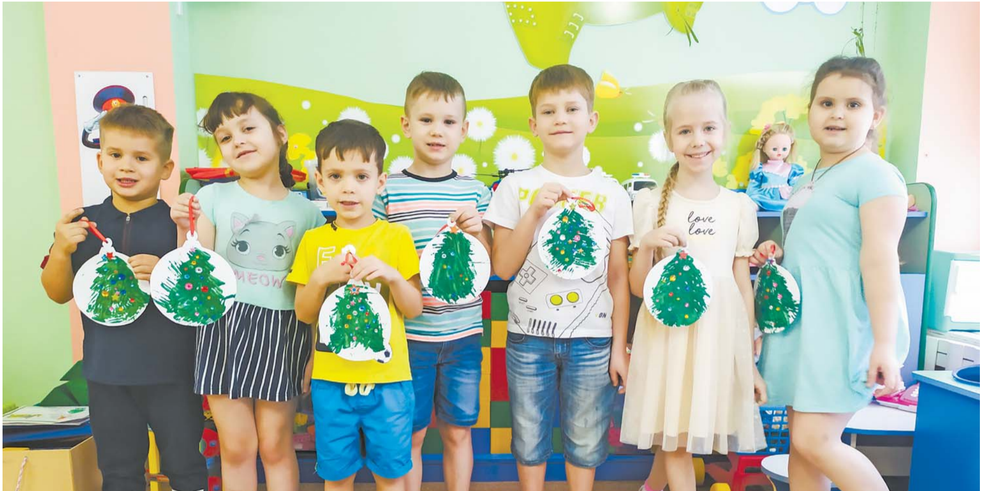
Ребята из подготовительной группы «Полянка желания» знают толк в новогодних поделках.