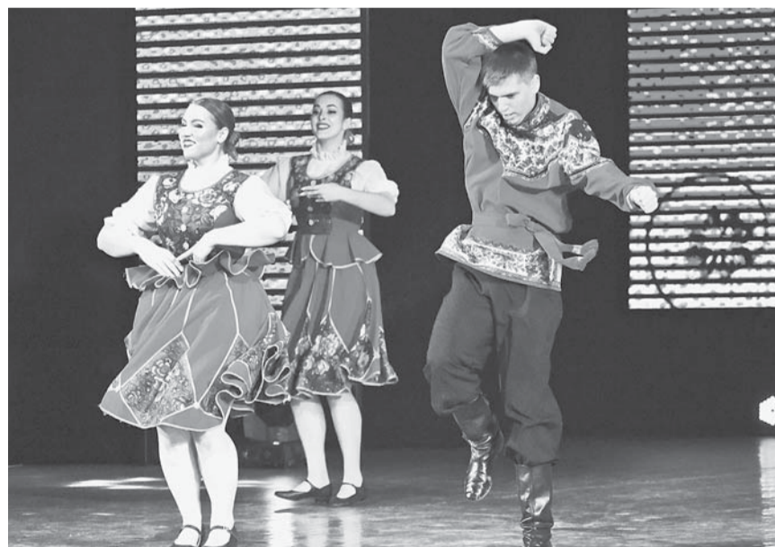
Лучшие коллективы города приняли участие в праздничном концерте.

Многовековая история России научила нас помнить имена своих героев от момента зарождения государственности до наших дней. Поэтому участники концерта с восторгом слушали песню времен Первой мировой войны «Но не дрогнула Русь», исполненную Барнаульским детским хором акапельно, аплодировали за зажигательному танцу «Проводы казака» в исполнении студентов АГИК, детским посиделкам от образцового детского коллектива «Звонница», современным песням о России.