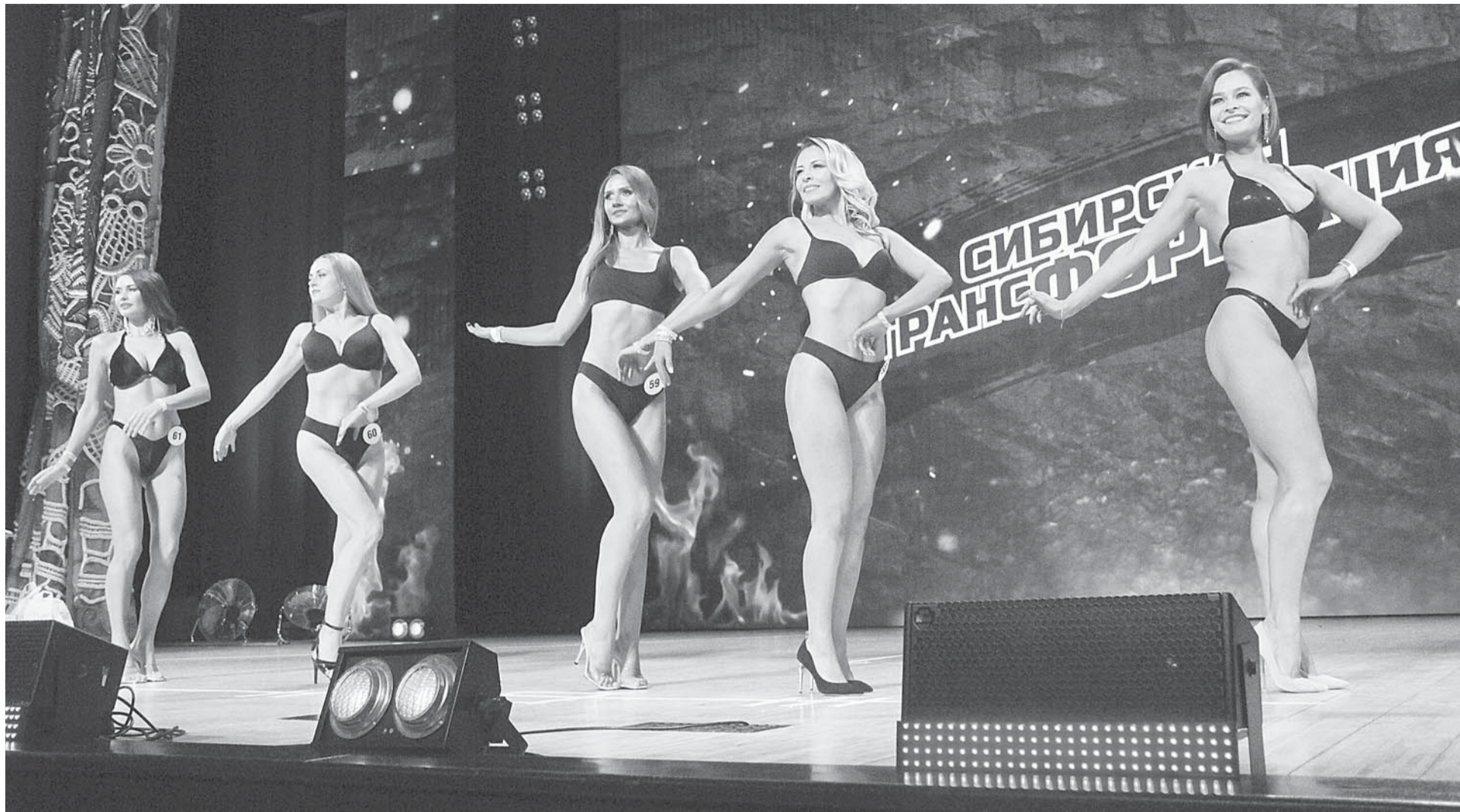
На сцене любители, но обстановка на соревнованиях профессиональная.