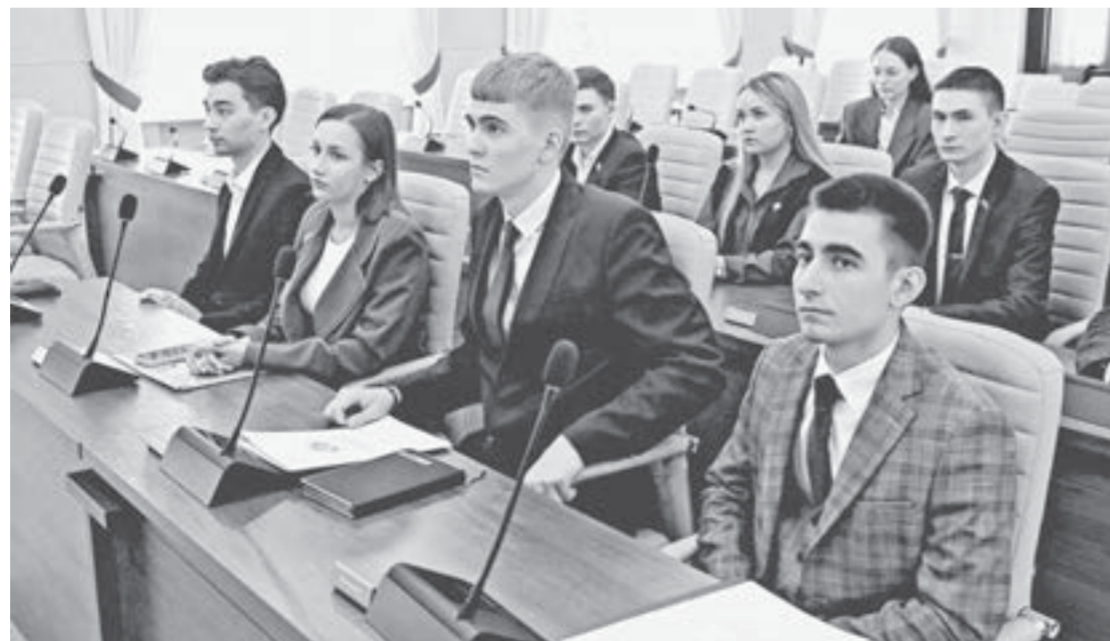
Депутаты Молодежного парламента Барнаула запланировали на лето новые проекты.

Относительно темы ВИЧ-инфекции молодежь заинтересовал вопрос рискованных ситуаций, например, для медицинских работников, которые могут контактировать с кровью пациента, и мер экстренной постконтактной профилактики. Специалисты Центра по профилактике и борьбе со СПИДом ответила на вопросы.