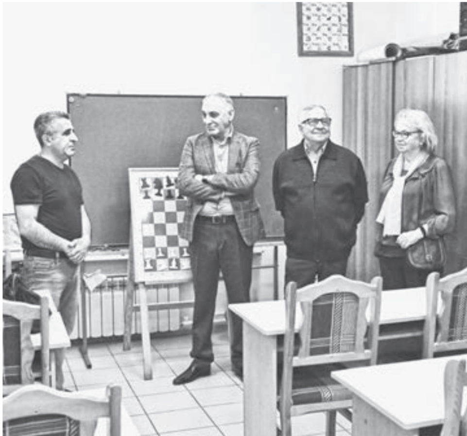
В центрах национальных культур растут новое поколение, которое знает свои корни.