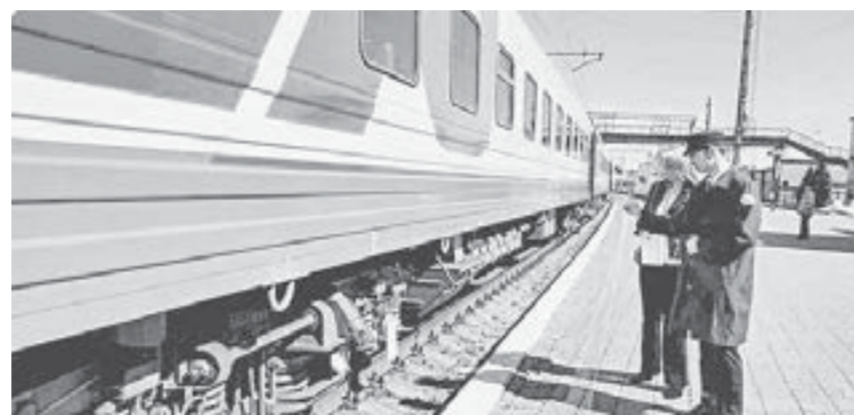
В профессиональном конкурсе проводников принимали участие как опытные специалисты, так и начинающие.