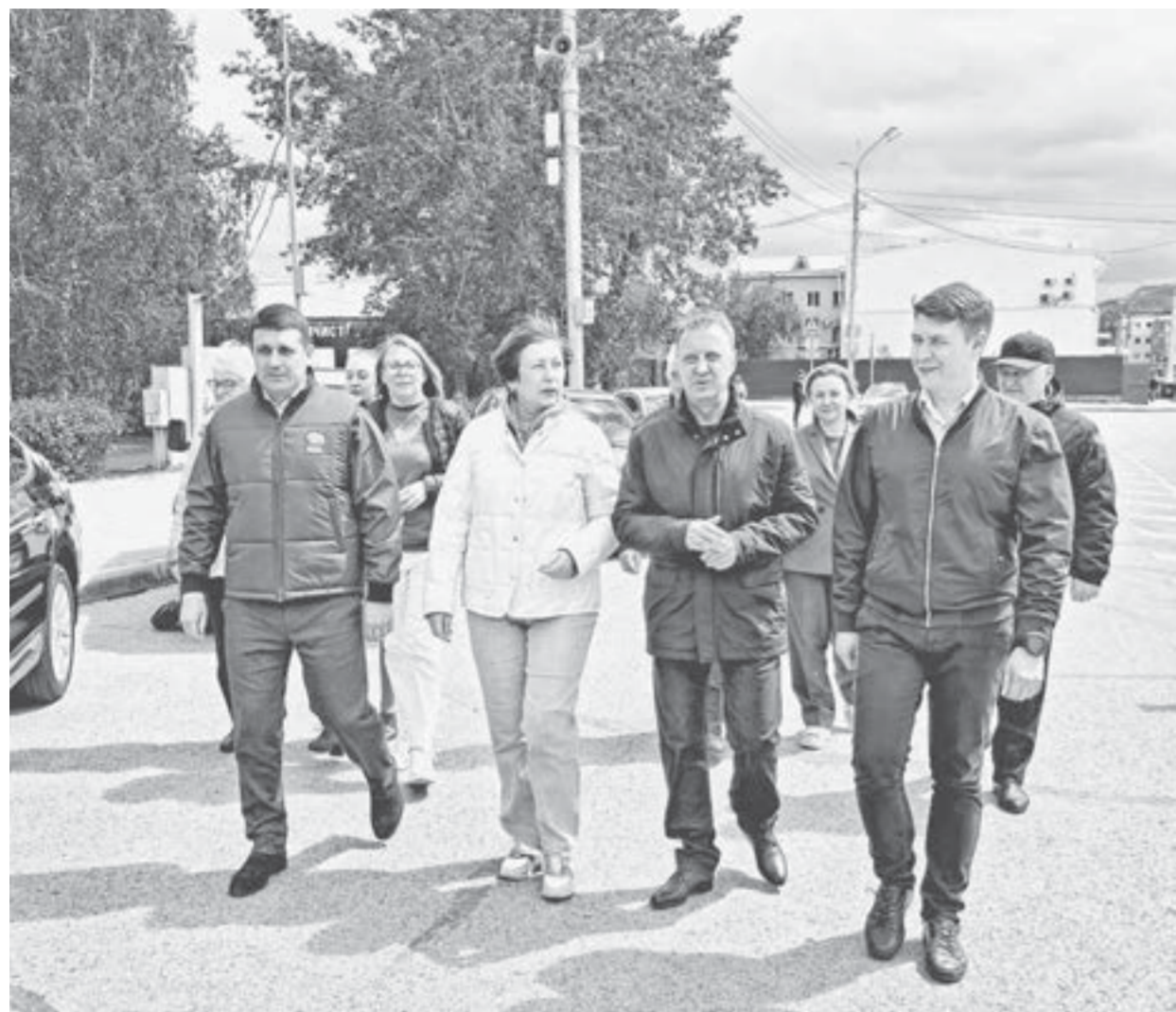
В состав очередного гумгруза вошли шесть автомобилей, их отправили в ЛНР.

Из Барнаула в зону СВО отправили очередную партию автомобилей