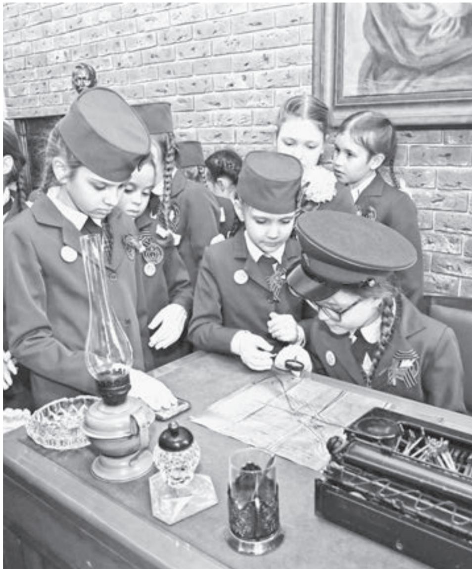
Дети с особым интересом изучали представленные экспонаты и охотно включались в активности.