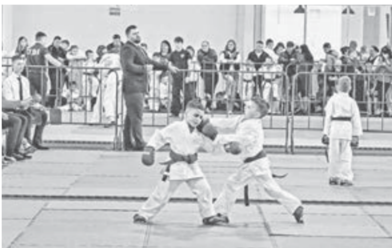
С каждым годом фестиваль единоборств собирает все больше участников.