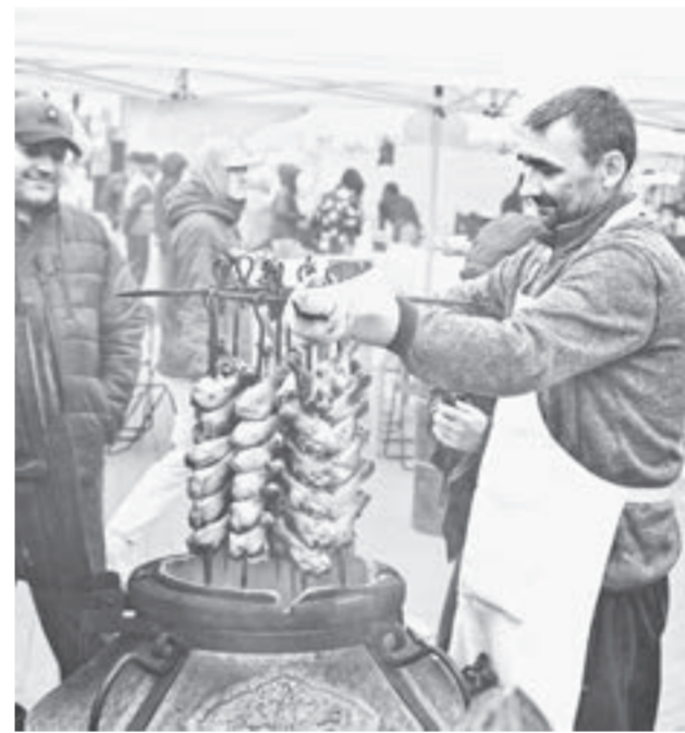
Ярмарка всегда востребована и у предпринимателей, и у горожан.