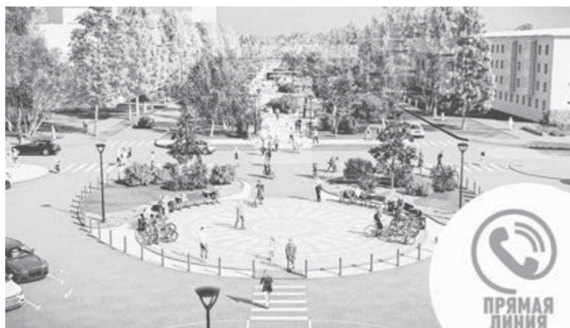
Проект благоустройства аллеи им. А.И. Чепурко.