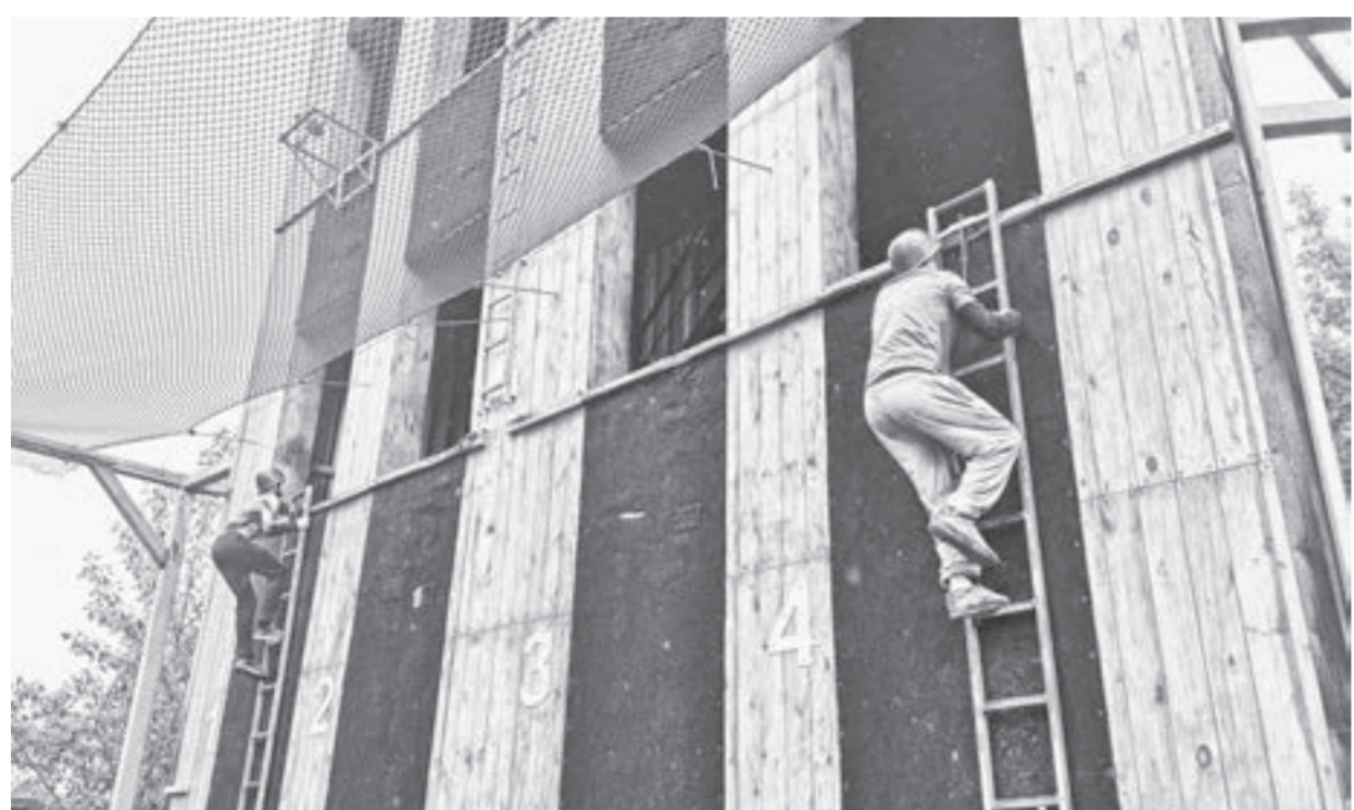
Спортсмены на время пробежали дистанцию и взбирались на второй этаж учебной башни.