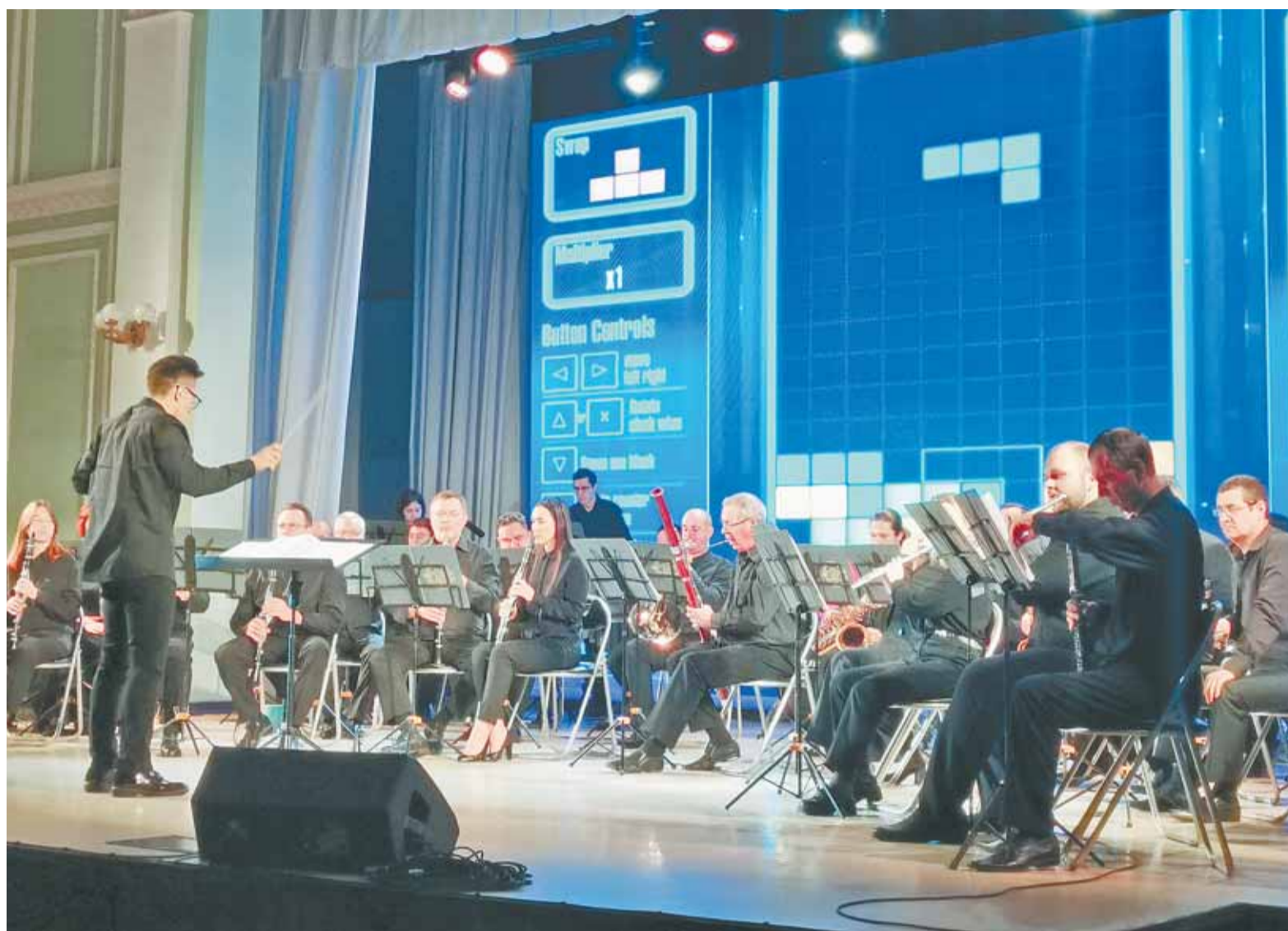
Оркестр исполнил мелодию из тетриса под видеоряд с демонстрацией процесса игры.

Часто саундтреки компьютерных игр обретали самостоятельную популярность и выходили в формате отдельных альбомов или исполнялись на концертах.