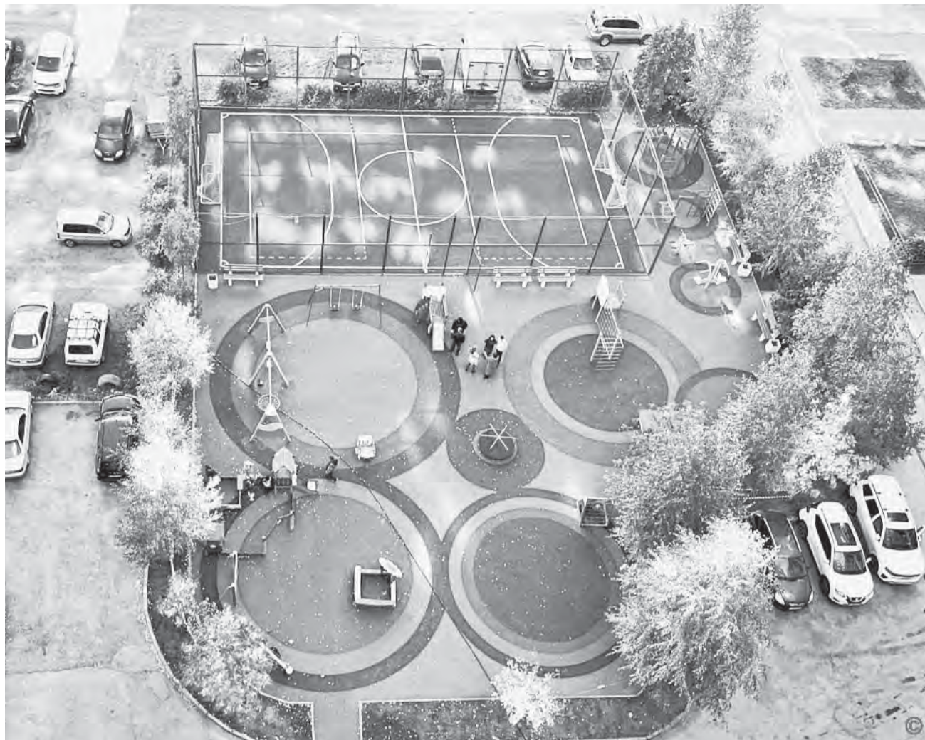
Благодаря инициативным проектам в городе становится больше благоустроенных территорий, площадок, как на улице Сиреневой, 4.