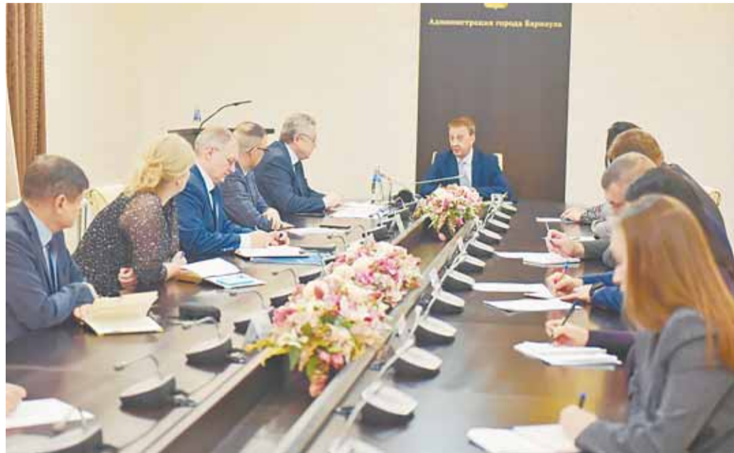
На совещании говорилось о необходимости создания городского оргкомитета по вопросам празднования юбилея города.

Традиция ежегодно праздновать Дни города берет начало с 1980 года.