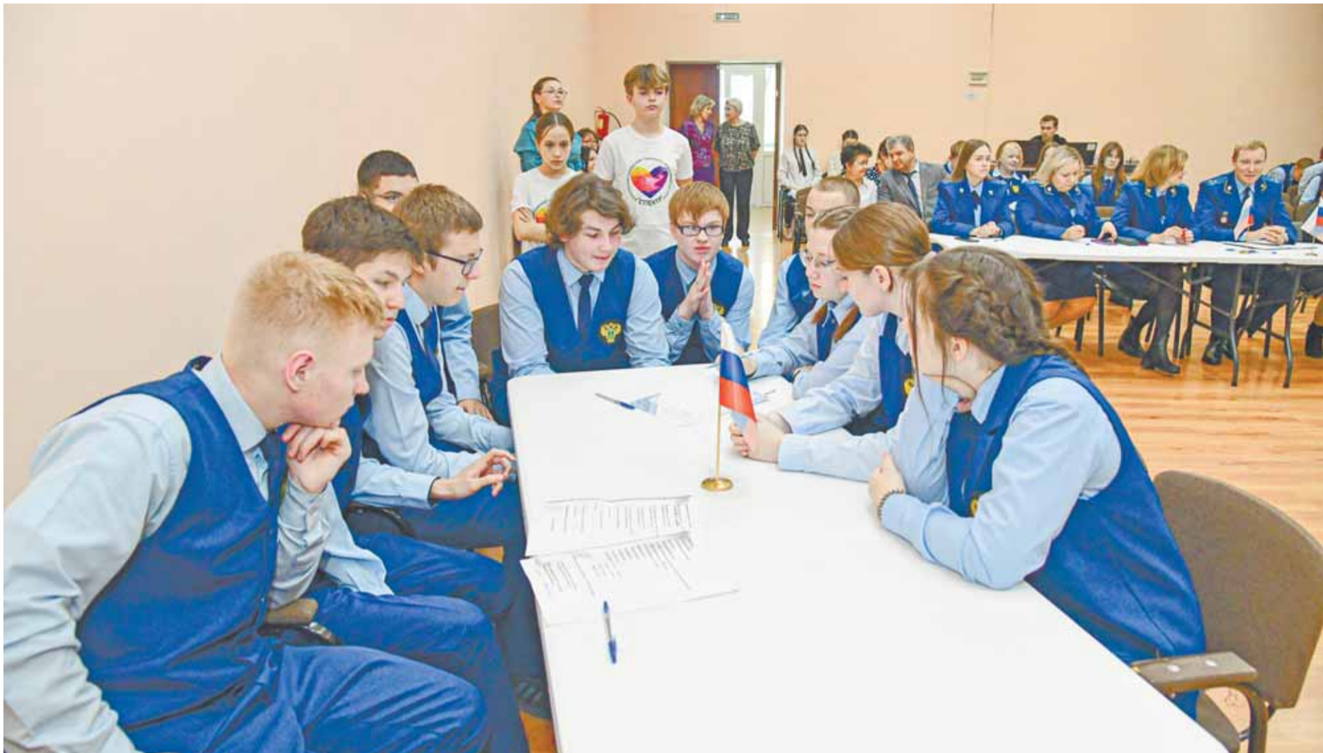
Отвечая на вопросы квиза, команды устроили настоящий мозговой штурм.