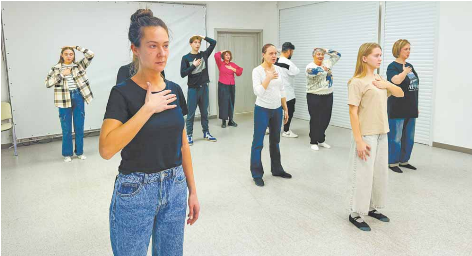
На мастер-классе барнаульцы научились правильно дышать и говорить.