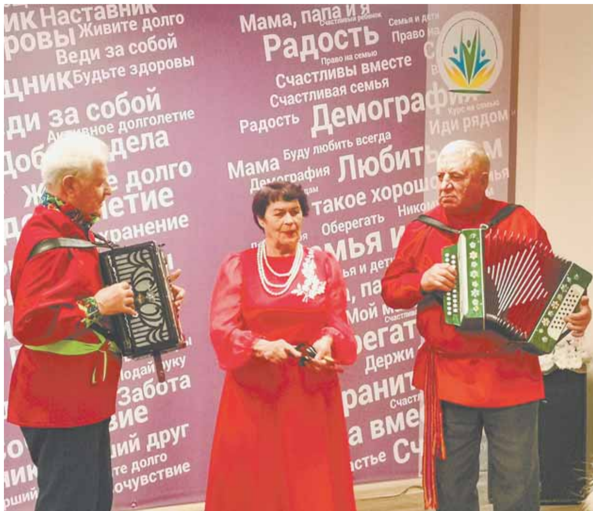
На финальном концерте месячника выступили ветеранские творческие объединения.

Пожалуй, особо приятными и поднимающими настроение стали регулярные музыкальные концерты и конкурсы, где пожилые люди могли и себя показать, и на других посмотреть. Именно в таком