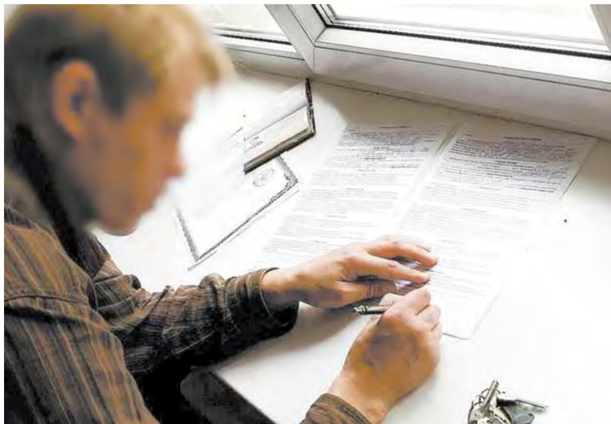
Коллаж из сети Интернет

Вдохновившись, мужчина решил расширить свою деятельность. План в его голове созрел простой – находить одиноких людей, владеющих жилплощадью и любящих выпить, ну а потом – по ситуации. В одиночку действовать уже было сложно, поэтому он привлек к своей криминальной работе целую бригаду. У каждого была своя роль – одни подыскивали «клиентов», другие втирались к ним в доверие, по несколько дней осушая бутылку за бутылкой, третьи организовывали сделку. Были здесь и «актеры», изображающие покупателей, и силовая поддержка для убеждения не