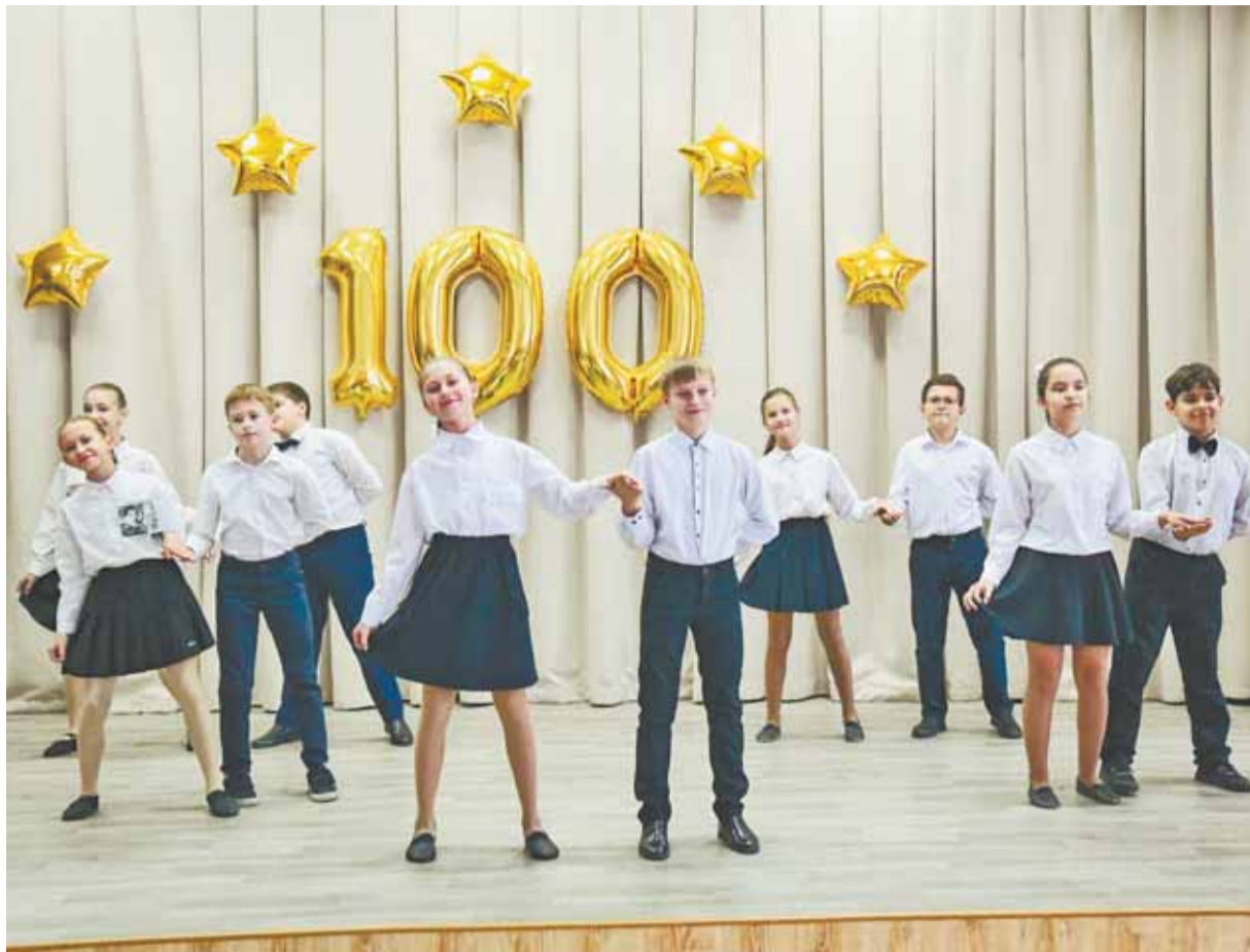
В школе № 103 чтят традиции, заложенные первыми учителями и педагогами.