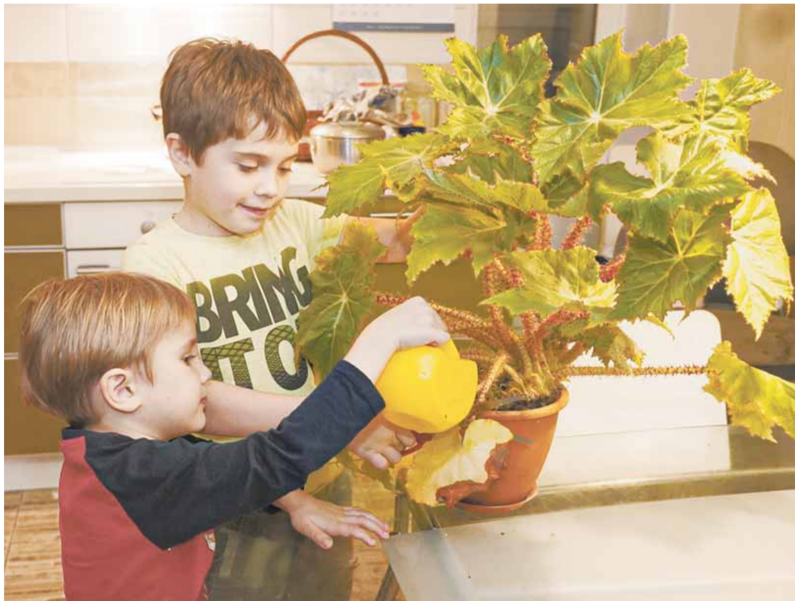
Бурые и ломкие листья растения говорят о недостатке влажности или чрезмерно высокой температуре.

– Клубневые бегонии отличаются прекрасными и яркими цветками. Они могут радовать своего обладателя не только все лето, но и зимой, но вслед за шикарным цветением у них всегда на-