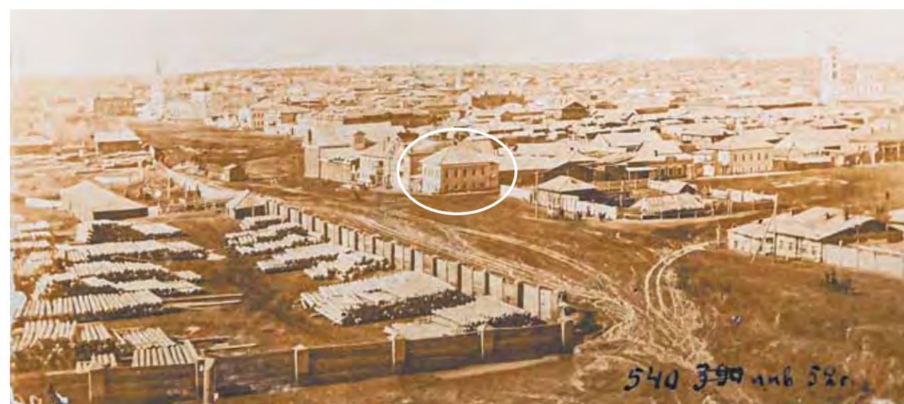
1. «Спорный» дом Зубова. 2. Фото 1902 года, где стоит совсем другое здание. 3. Рисунок барнаульского художника Юрия Гребенщикова.