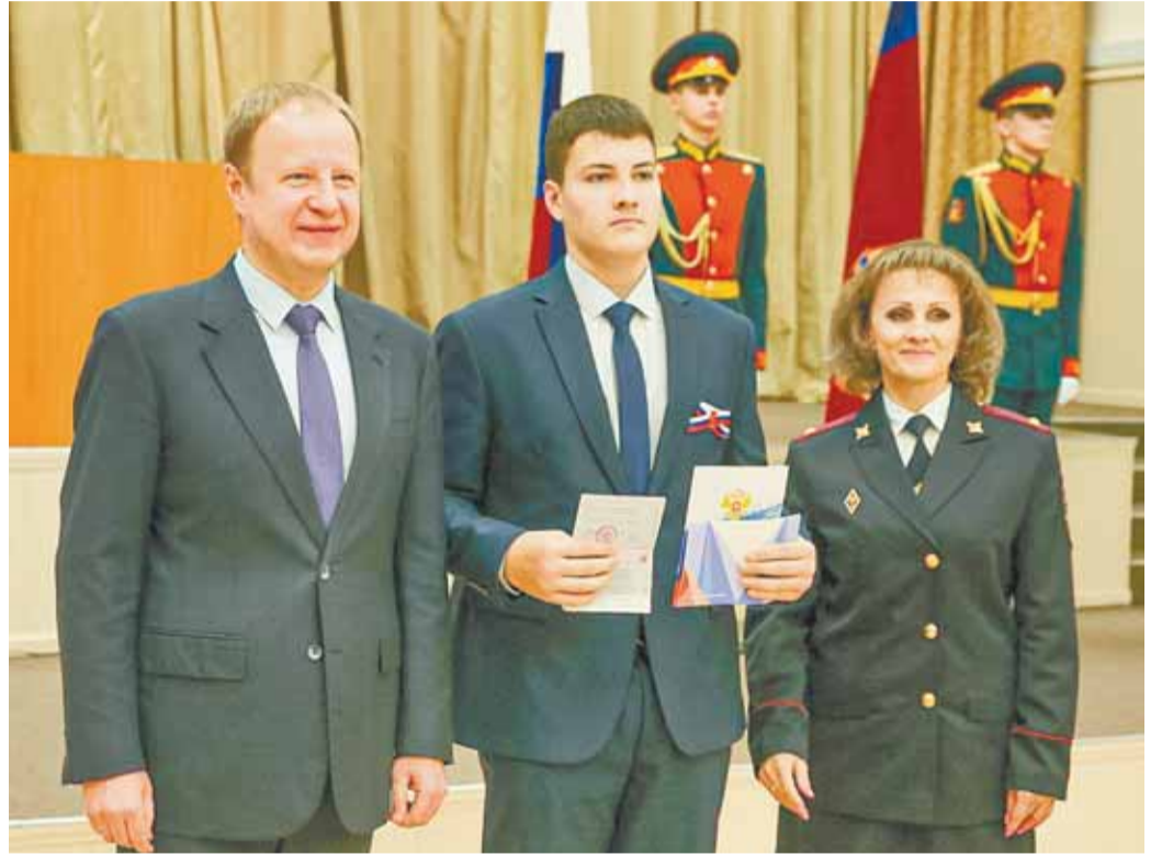
Торжественная церемония вручения паспорта запомнится ребятам навсегда.

– На Алтае растет «Движение Первых» – при поддержке федеральных властей и лично Президента РФ молодые люди по всей стране получают возможности для развития своих талантов, – отметил глава региона. – С удовольствием лично принимаю участие в различных мероприятиях движения, поддерживаю наших ребят! «Хранители истории» – это новый проект движения, направленный на изучение исторического пути нашей Родины, сохранение традиций и воспитание патриотизма.