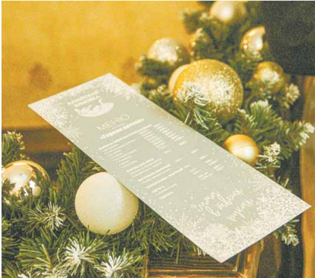
Рестораны края по традиции готовят к «Алтайской зимовке» особое меню.

Через месяц в регионе состоится традиционный праздник, посвященный началу зимнего туристического сезона, – «Алтайская зимовка». Чем он будет примечателен?