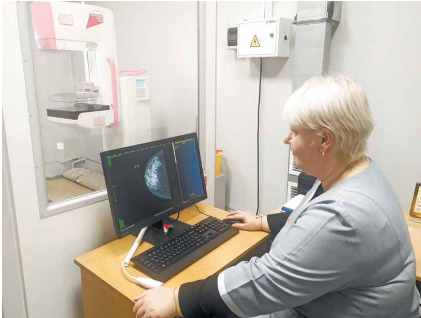
Новый цифровой маммограф стоимостью 14,2 млн руб. приобретен в рамках нацпроекта «Здравоохранение».