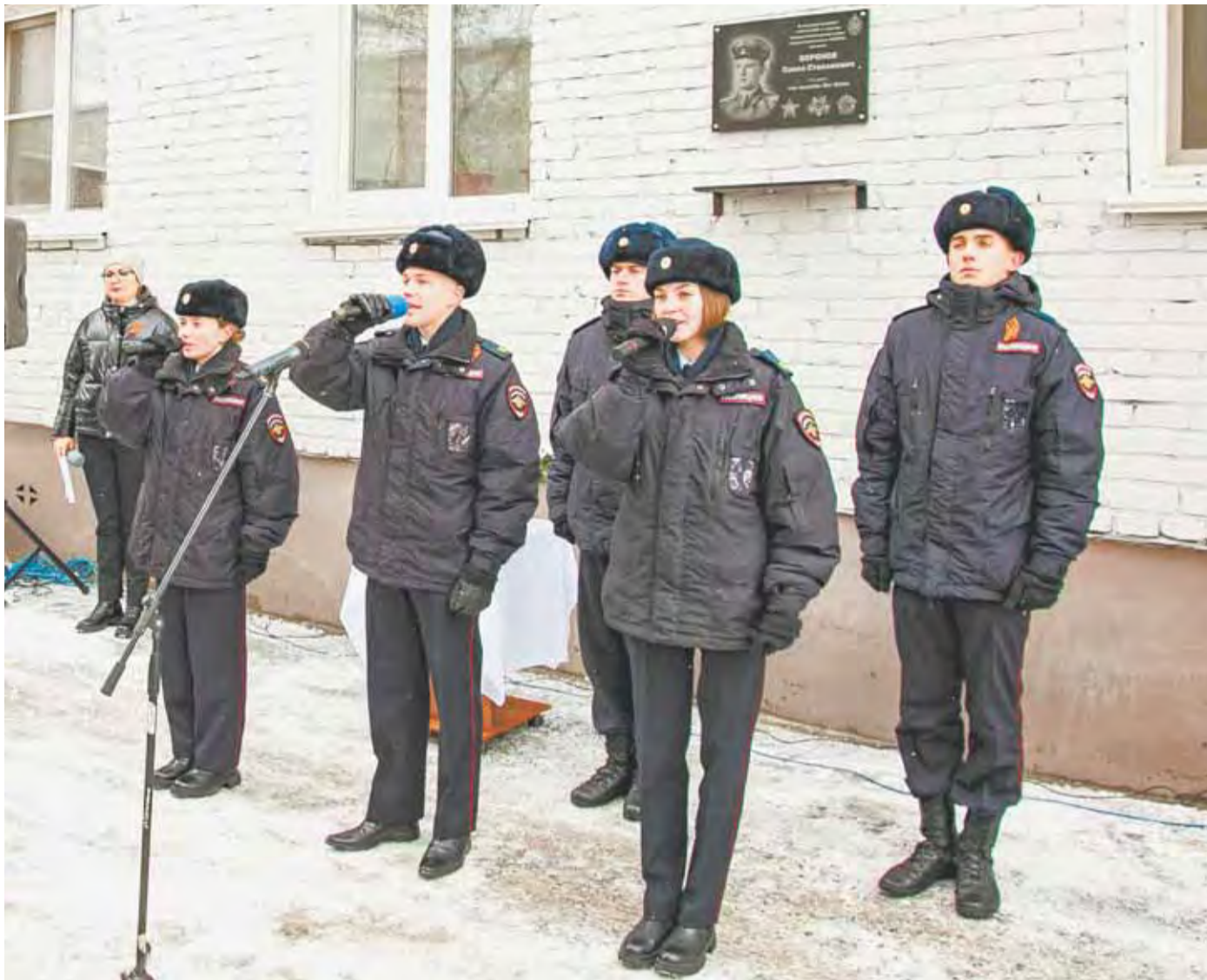
Нынешние и будущие сотрудники органов правопорядка учатся на примере героев.