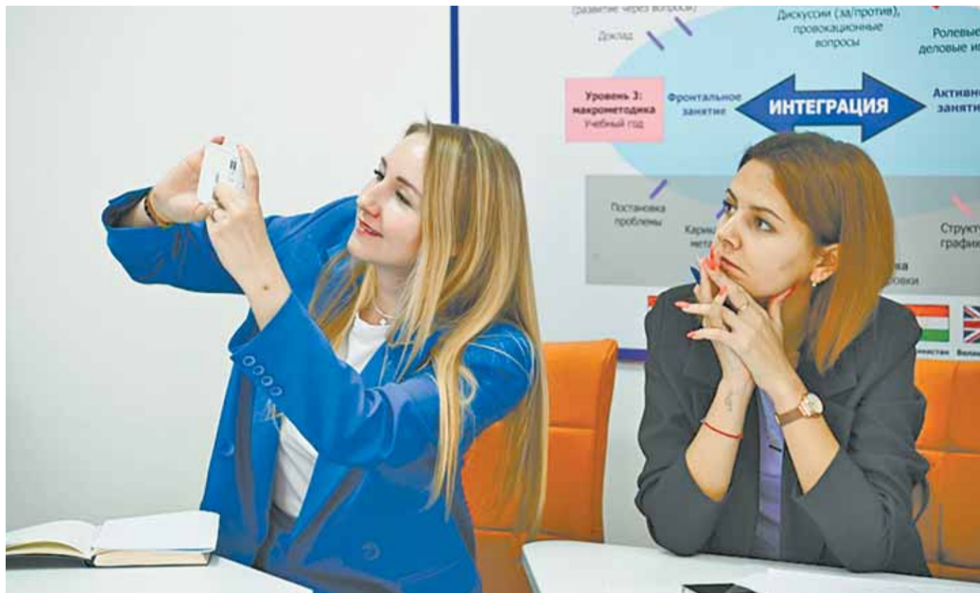
Участвуя в форуме, педагоги приобрели новые знания, которые планируют внедрить в свою практику.