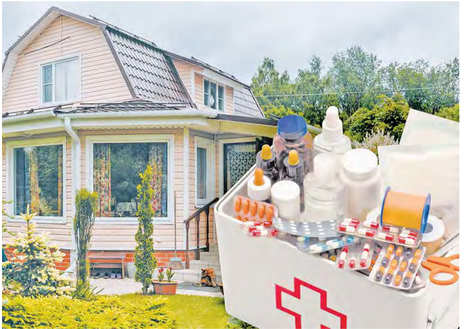
Коллаж Александра ЕРМОЛОВИЧА

При формировании дачной аптечки обязательно обратите внимание на сроки годности препаратов. Антибиотики и противовирусные препараты можно употреблять исключительно по назначению врача.