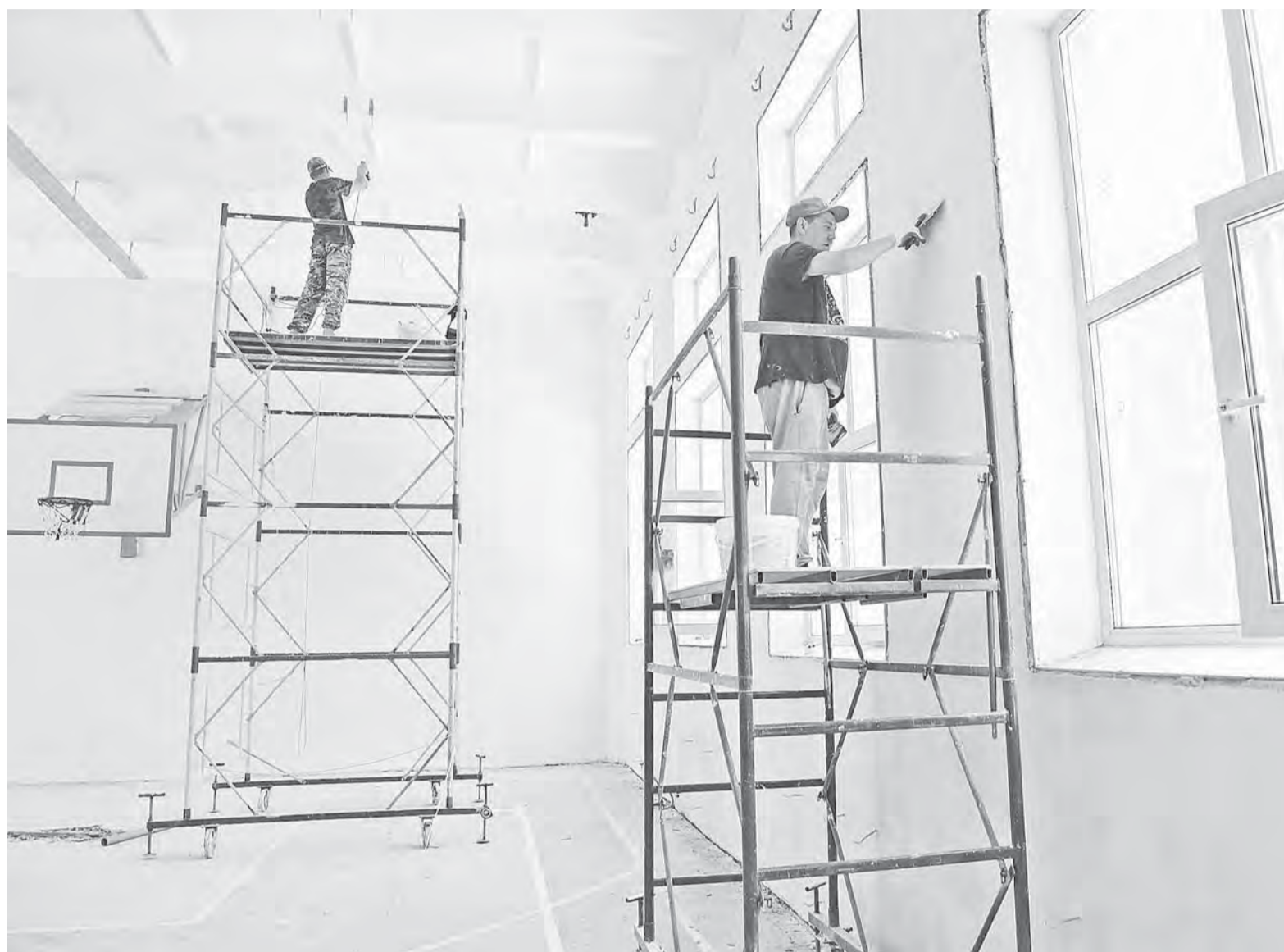
Во втором спортивном зале строители уже завершают подготовку стен под покраску.

Общий объем финансирования проекта капитального ремонта спортивных залов школы № 127 превышает 6,7 млн руб.