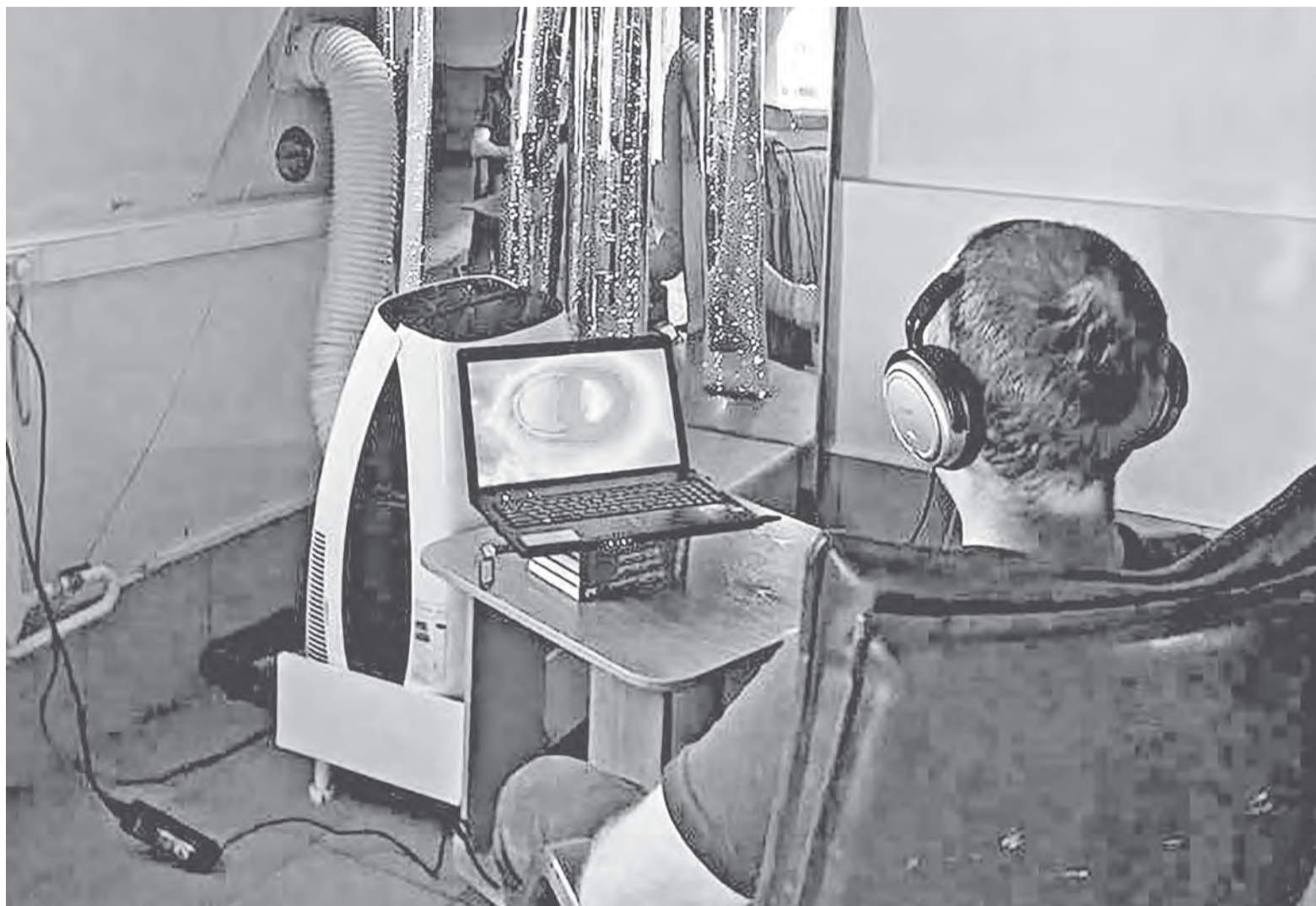
В краевом наркологическом диспансере на протяжении 11 лет в психокоррекционной работе активно применяется аудиовизуальный комплекс «ДисНет».