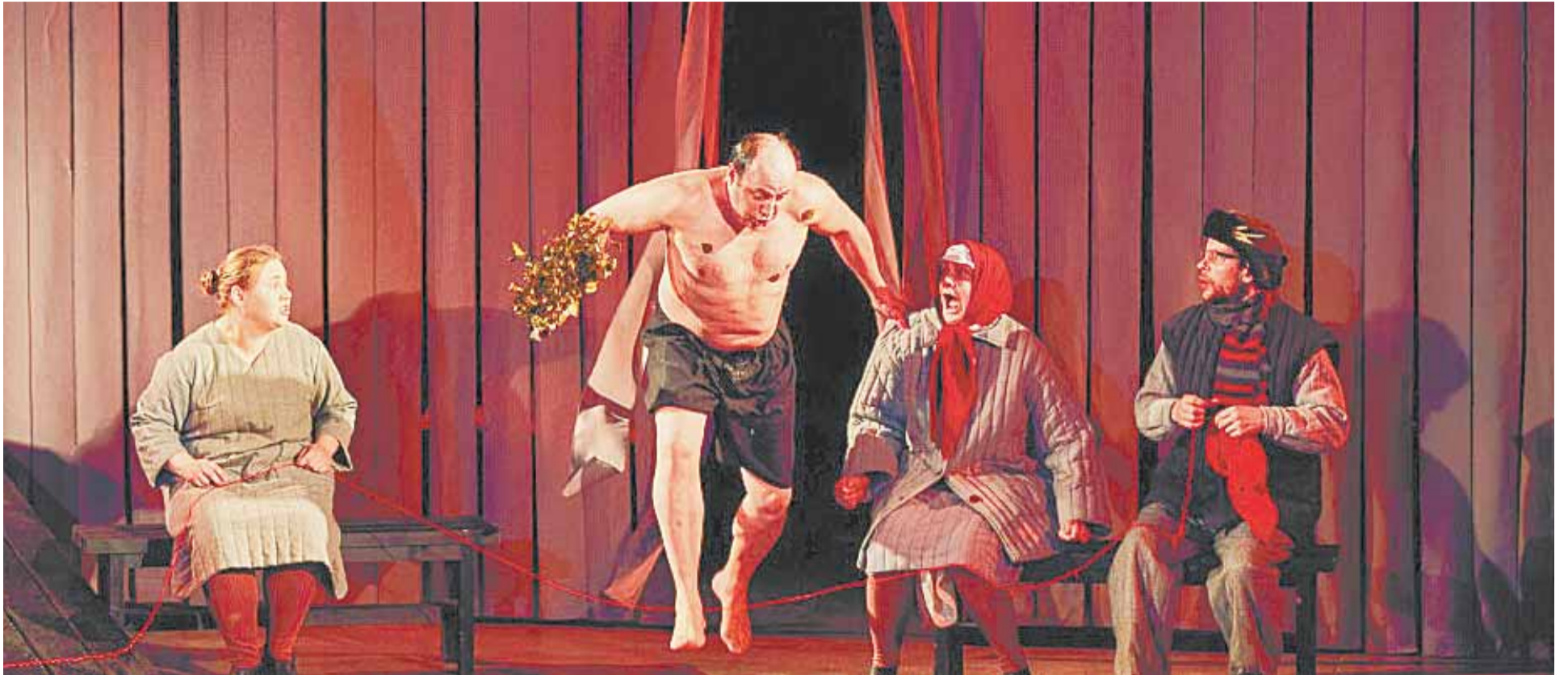
Спектакль «Калина красная», Мотыгинский драматический театр. С подробной афишей фестиваля можно ознакомиться на официальном сайте Театра драмы.