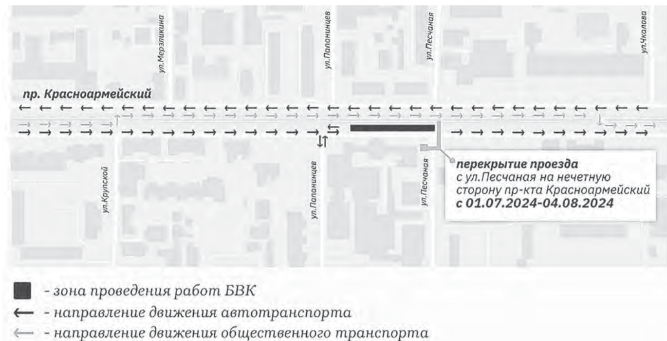
Схема движения на участке пр. Красноармейского от ул. Крупской до ул. Чкалова с 1 июля по 4 августа.