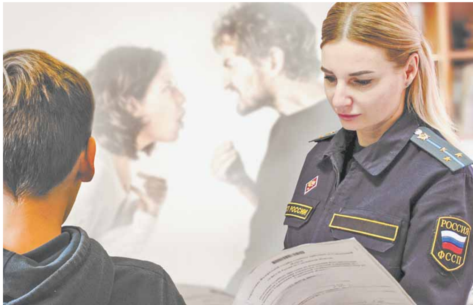
Коллаж Александра ЕРМОЛОВОЙ

Проект был реализован на площадке отделения судебных приставов по исполнению исполнительных документов о взыскании алиментных платежей по г. Барнаулу с использованием терминалов справочной информации кадрового