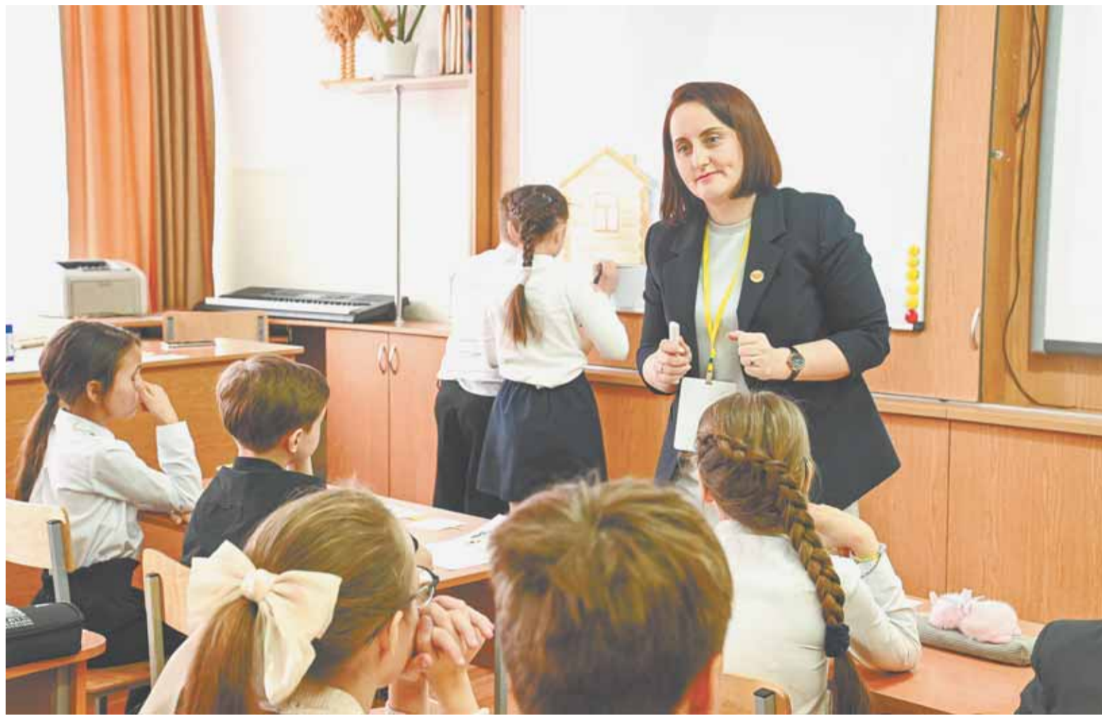
Изменения в новом учебном году ощутят как педагоги, так и учащиеся.