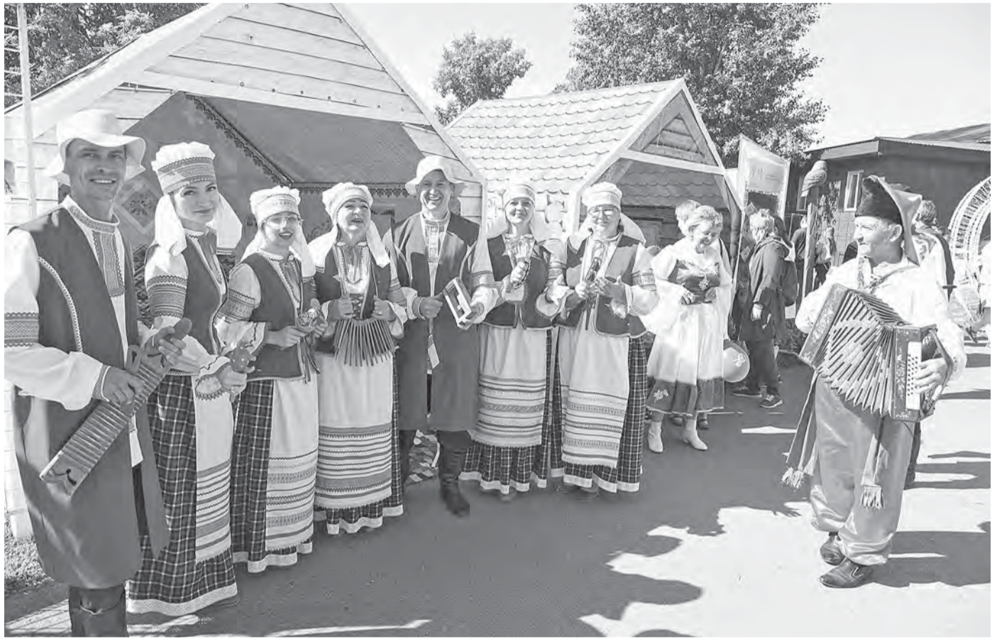
Фестиваль национальных культур – яркое событие программы празднования дня рождения города.

В Барнауле идет активная подготовка к Дню города