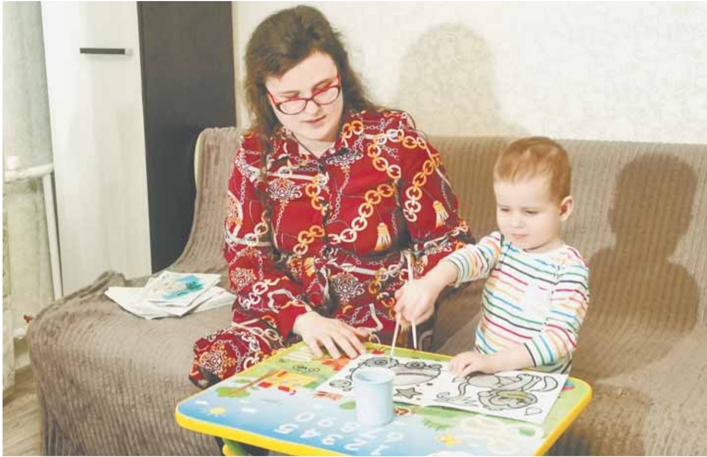
Работа семейного МФЦ направлена в первую очередь на поддержку семей с детьми.