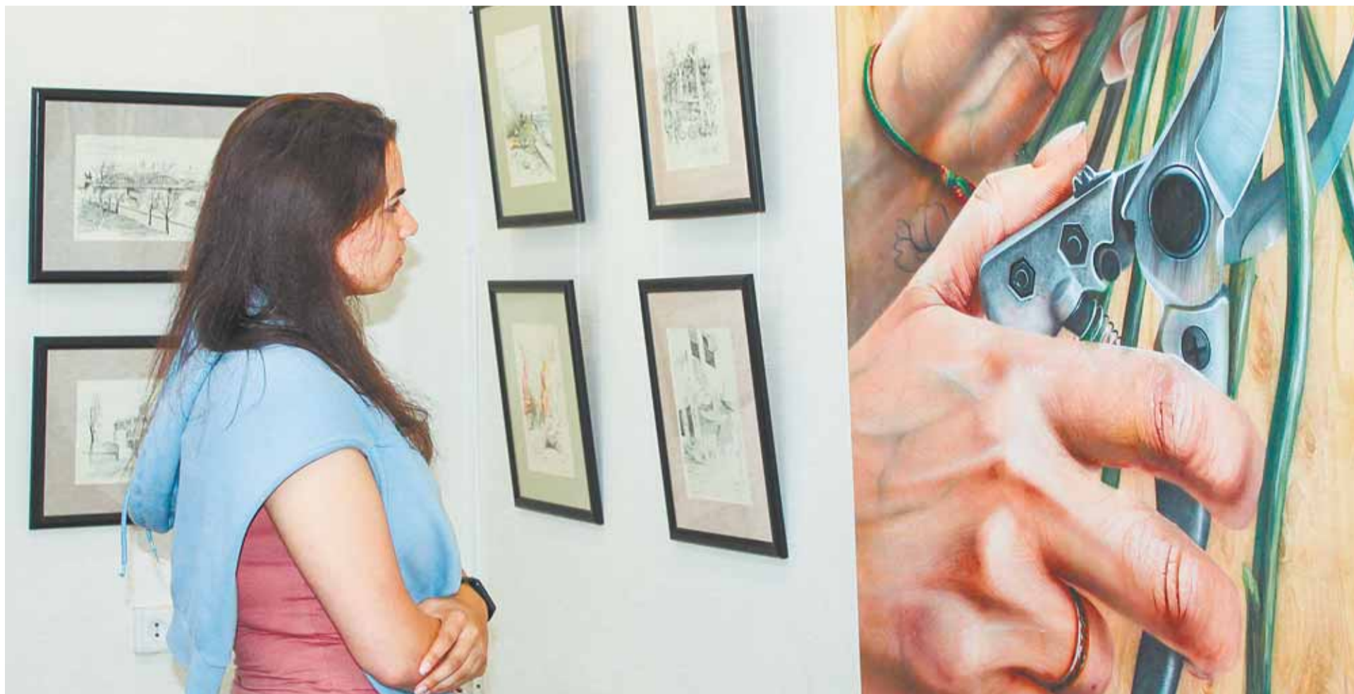
На выставке представлены сотни работ – от набросков до крупноформатных полотен.