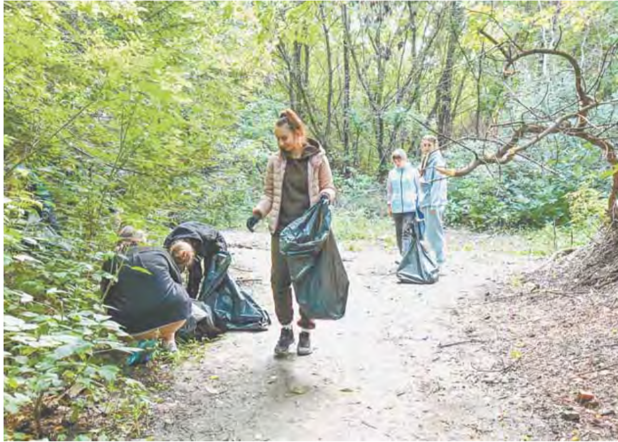
Экологический десант в окрестностях Октябрьского района.

Многие из ребят, входящих в состав «Рыси», в прошлом —