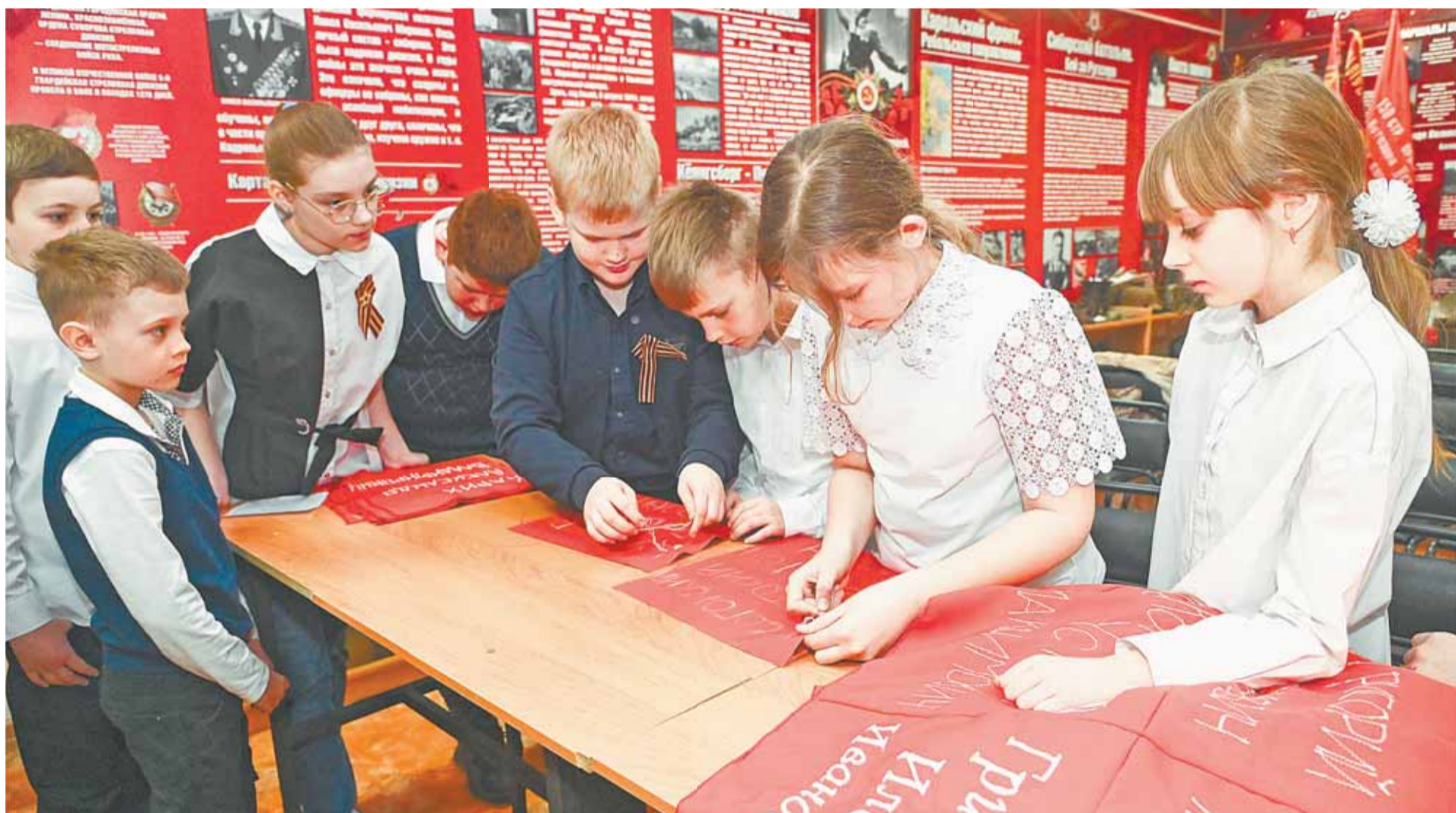
В акции «Знамя Победы» активно участвуют учащиеся 3–11-х классов школы № 24 поселка Кирова Центрального района.

Знамя Победы, которое создают учащиеся школы № 24, пополнилось именами героев