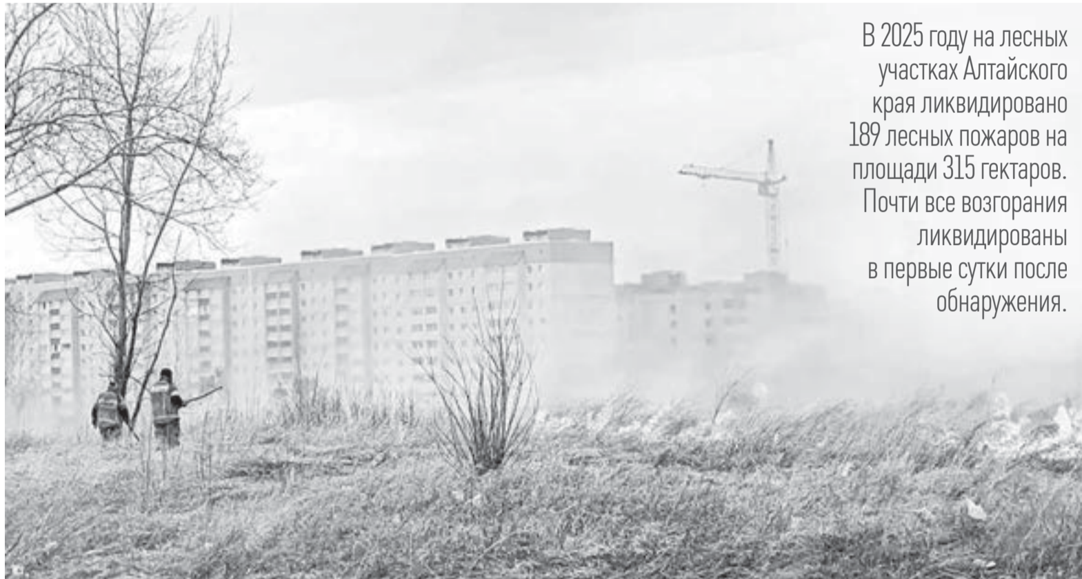
За нарушение правил пожарной безопасности предусмотрена административная или уголовная ответственность.

На втором этапе отработаны практические мероприятия силами городского звена РСЧС и взаимодействующих федеральных и краевых структур и организаций. По легенде учений, на территории Барнаульского лесничества в районе действует низовой пожар, из-за усиления ветра возник верховой пожар, площадь пожара увеличилась до 20 га, скорость распространения огня составила 47 м/мин, создавалась угроза перехода лесного пожара через железнодорожное полотно на жилые дома.