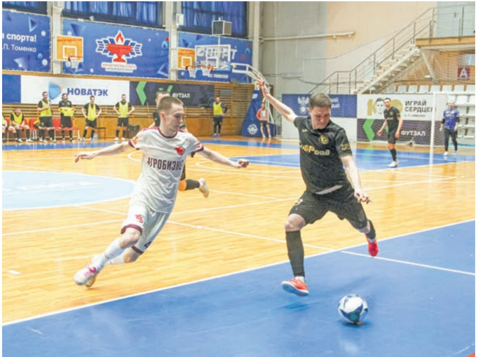
«АлтПолитеху» не хватило совсем немного, чтобы попасть в призеры.