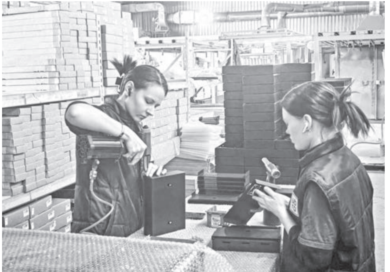
Почтовые ящики барнаульских бизнесменов входят в топ онлайн-продаж в России.

Для барнаульских предпринимателей открываются новые возможности онлайн-торговли