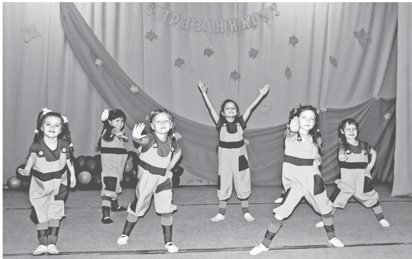
Каждое выступление коллектива «Непоседы» на сцене клуба села Гоньба — это яркий, незабываемый номер.