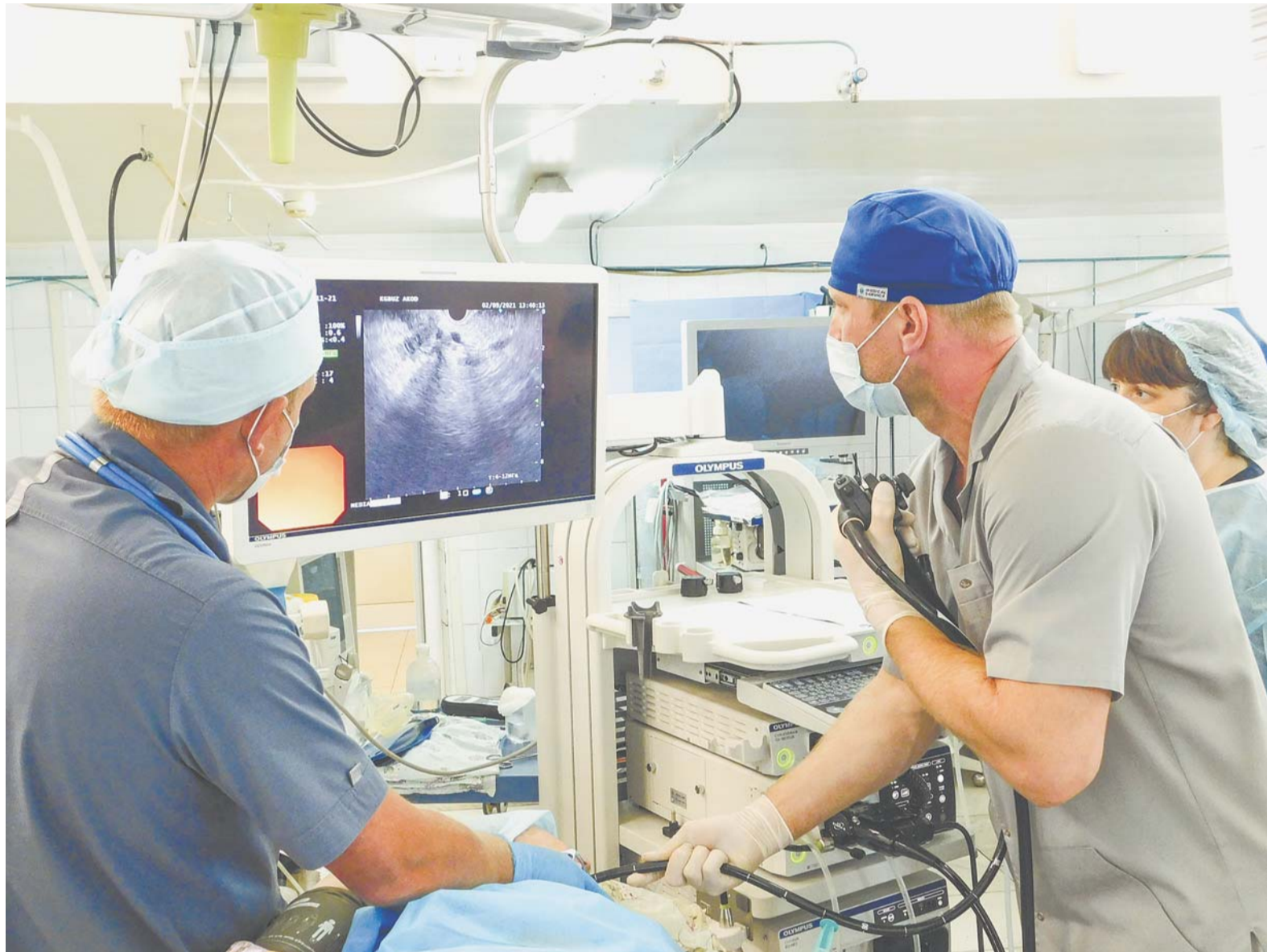
Современные малотравматичные операции через проколы помогают пациентам быстрее восстанавливаться после болезни.

Сегодня анестезиологи обладают почти космической техникой, множеством следящих систем, которые позволяют врачу оценивать глубину наркоза и состояние пациента в ходе операции. Со-