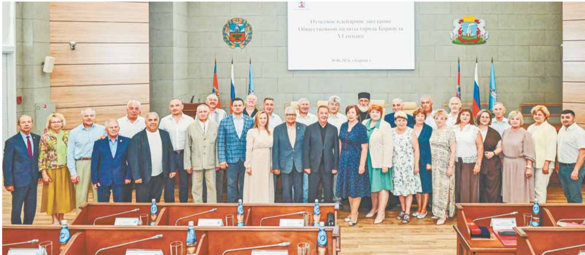
Общественная палата Барнаула вносит весомый вклад в городское сообщество, живёт интересами города и его жителей.