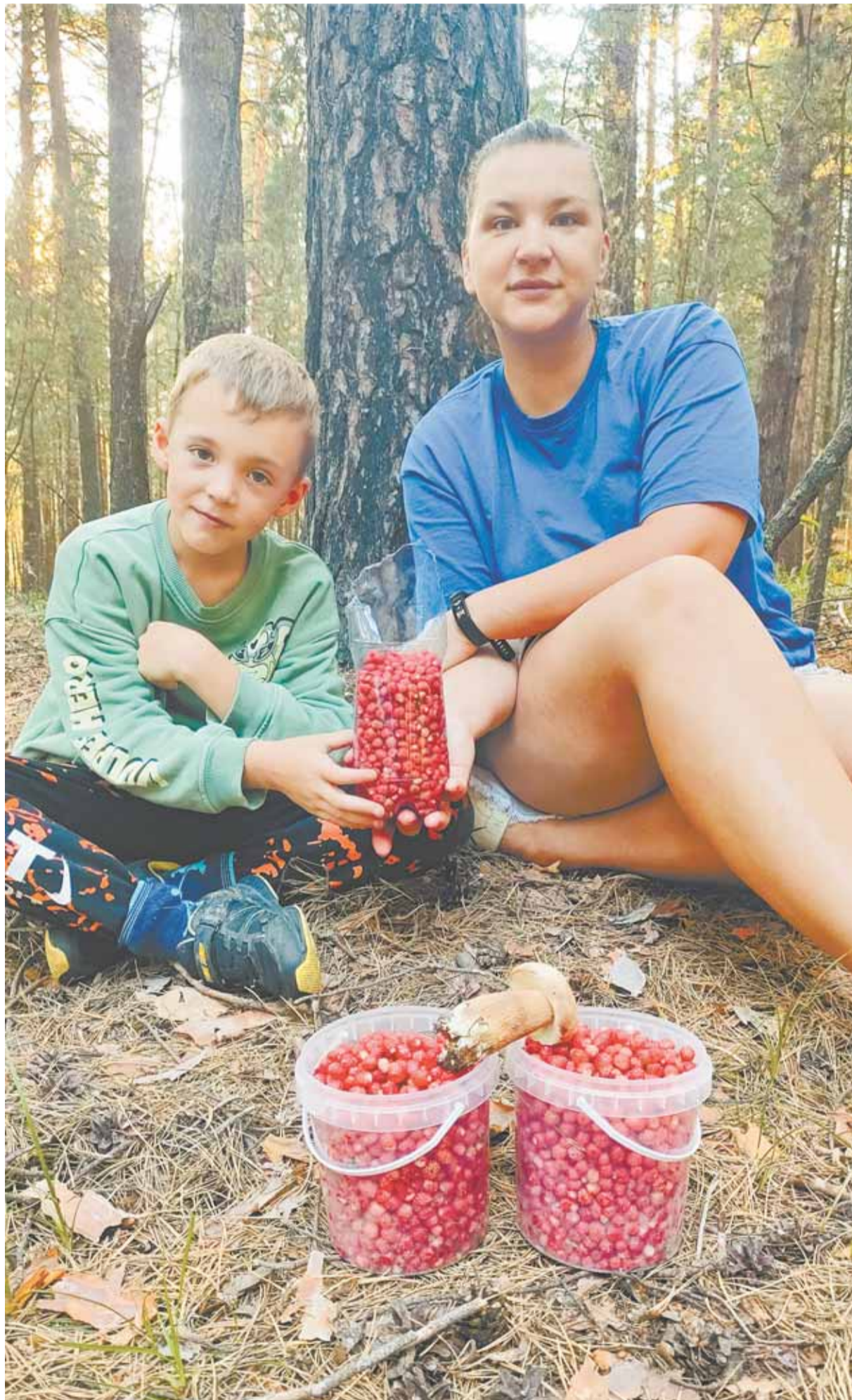
За два часа – три литра ягоды и грибок.