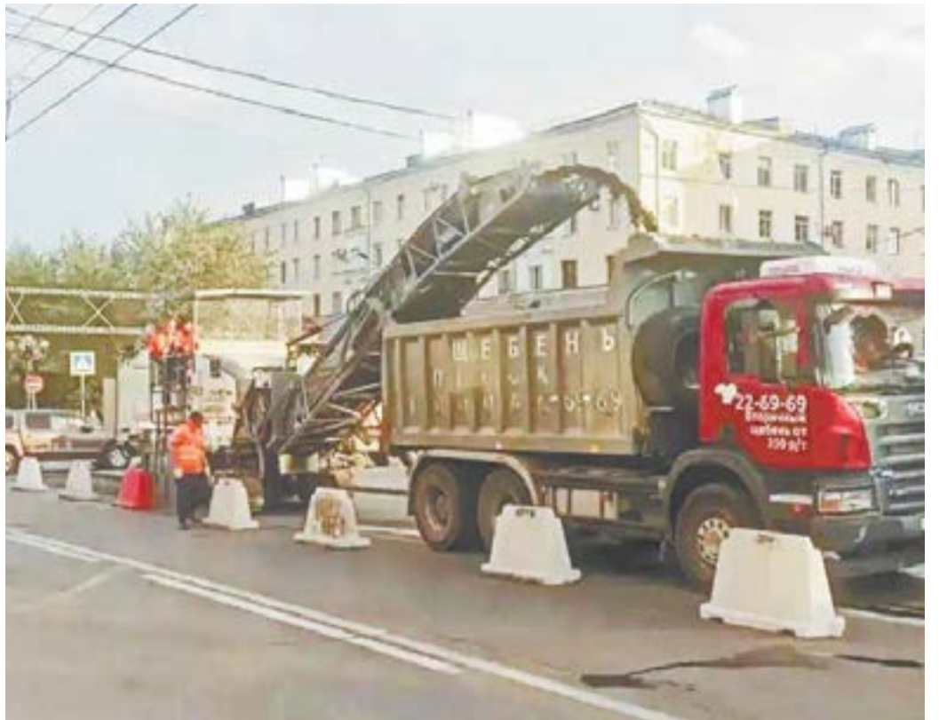
Работы на проспекте Ленина ведутся без перекрытия движения.

Стоит отметить, что в 2019 году в рамках нацпроекта