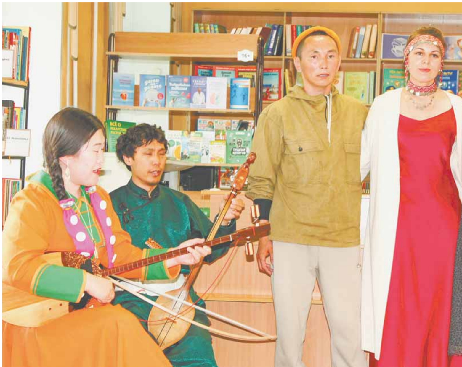
Каждый из участников проекта представил своё творчество на суд барнаульской публики.