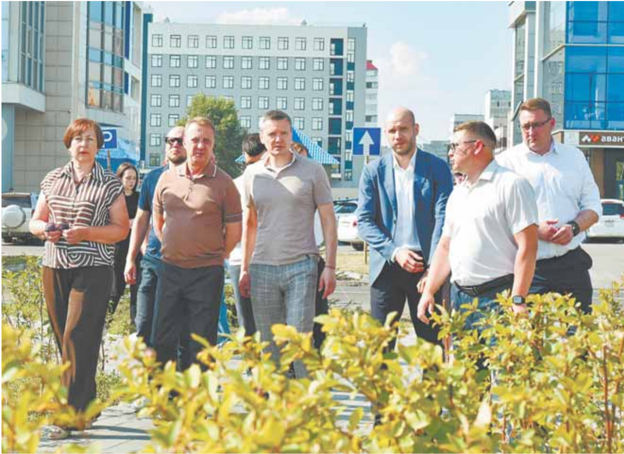
Название нового парка выберут вместе с жителями.