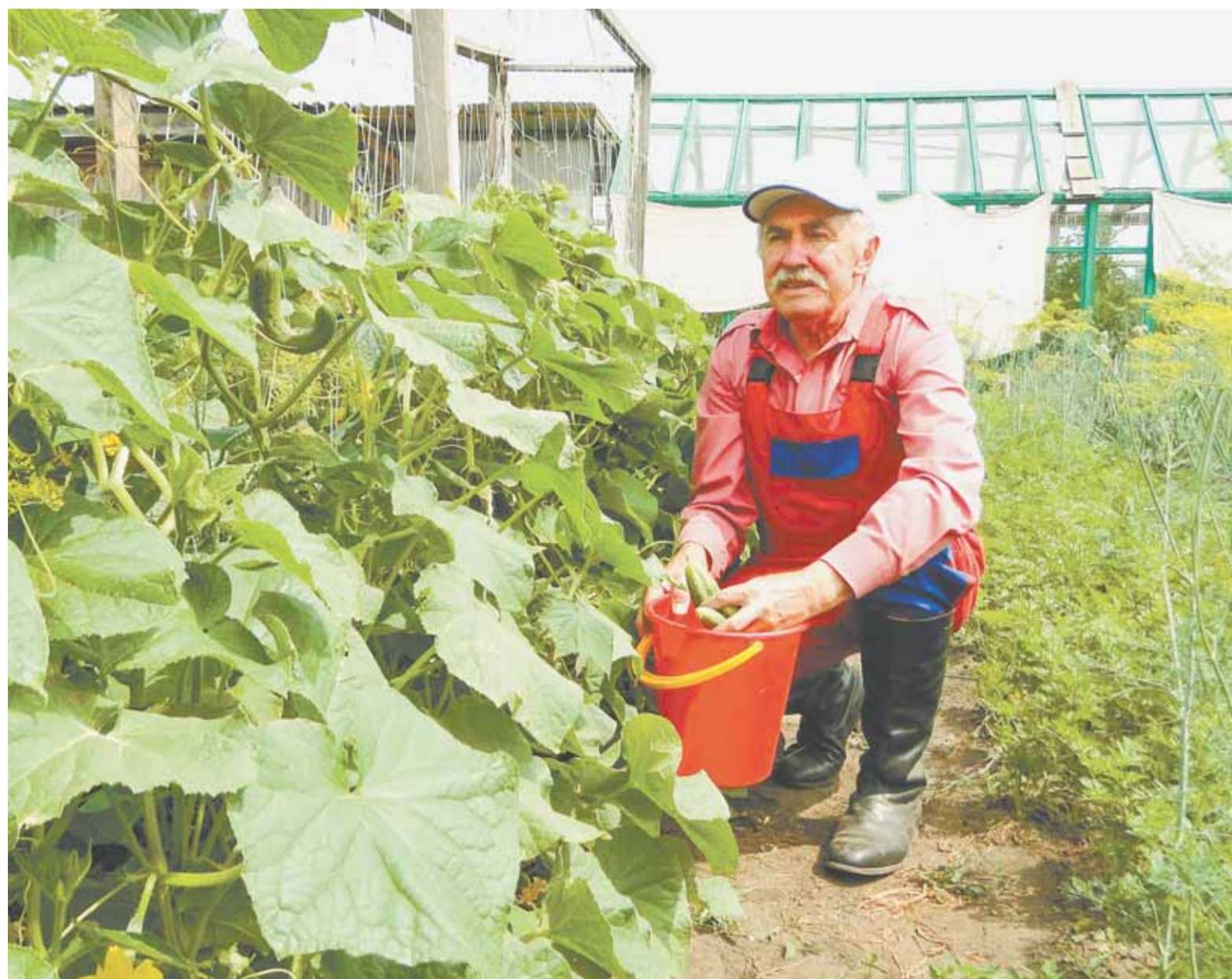
В июльский зной садовые растения нуждаются в особой заботе.

— Винить тут можно и качество препарата, и адаптивность вредителя. Отступить некуда — нужно спасать урожай. На этой неделе поедим на участок вуза обрабатывать картофелем «Актарой». Кстати, всем садоводам рекомендую в дополнение к спецсредствам использовать и так называемые прилипатели — вещества, которые добавляются к водному раствору с «химией». Они защищают растение в