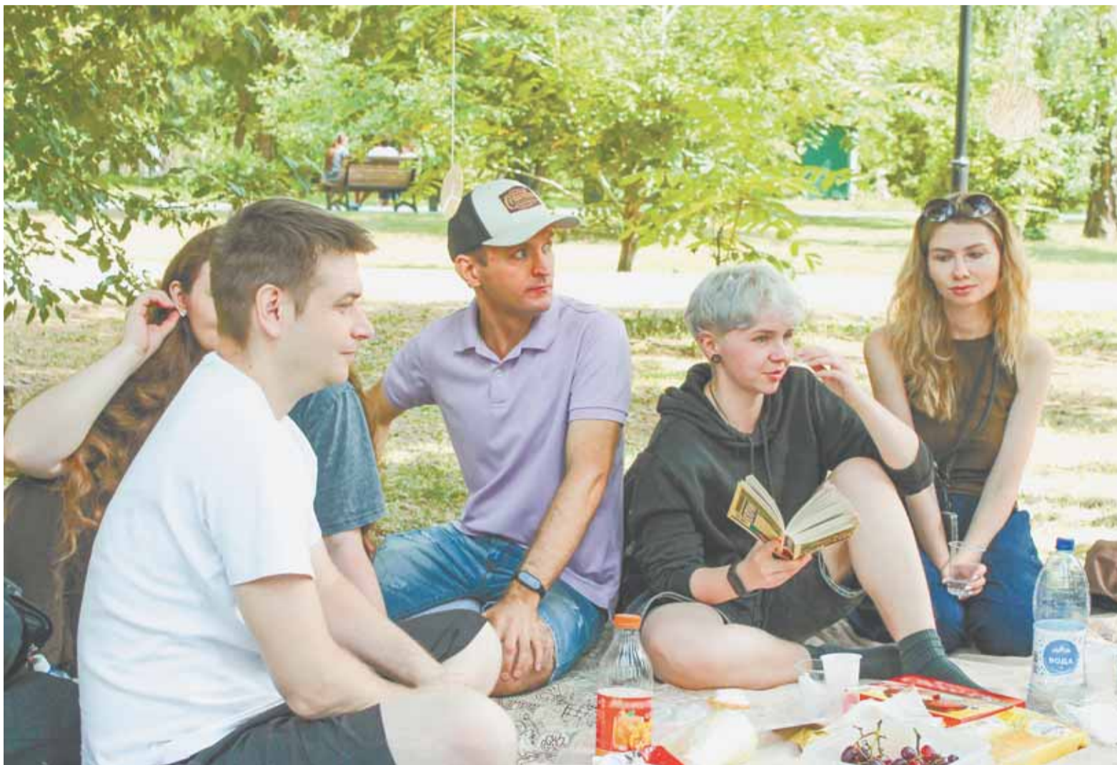
Большая часть мероприятий проходила в формате пикников.