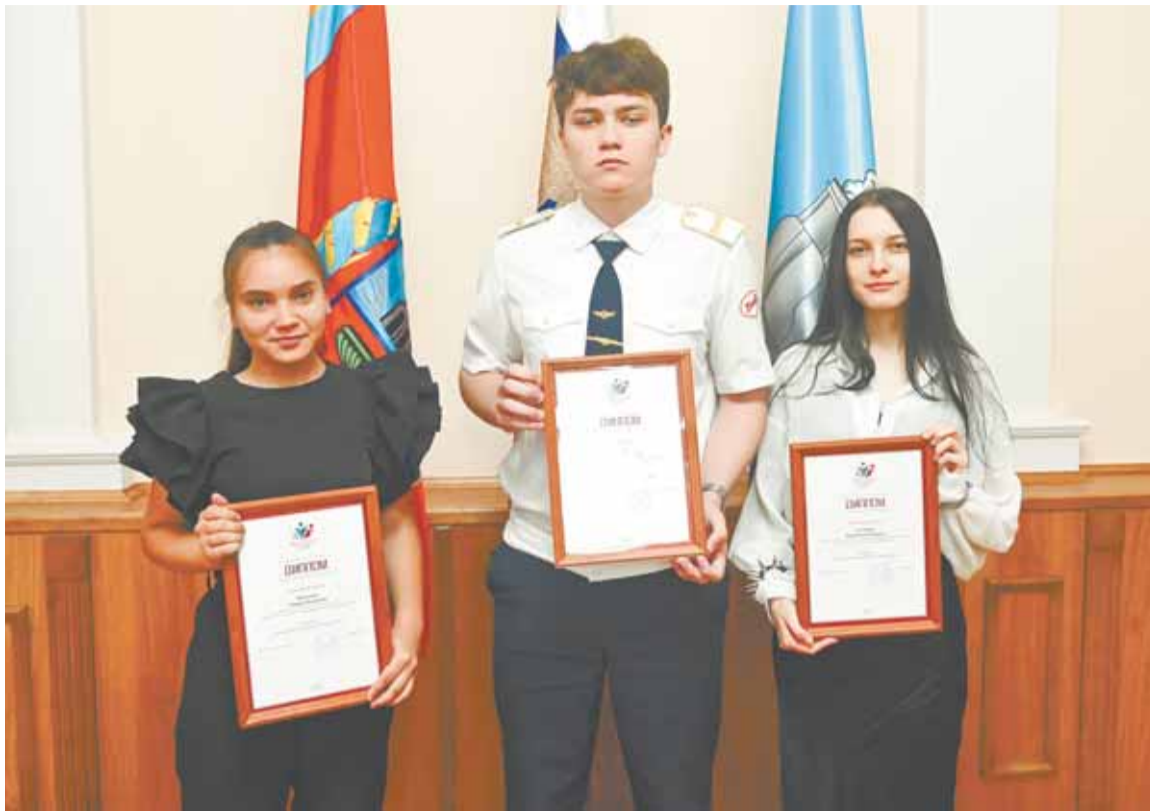
Жюри отметило качество и детализацию работ победителей.