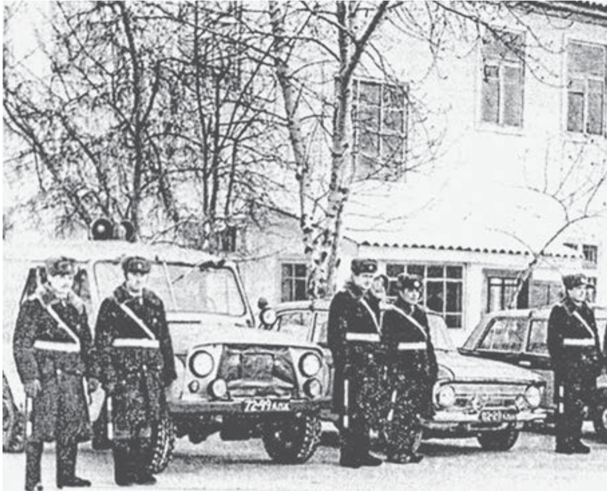
В 1969 году были разработаны и утверждены типовые штаты строевых подразделений дорожного надзора и отделения организации движения.

В 1936 году в Барнауле насчитывалось 280 грузовых автомобилей, 28 легковых, 14 автобусов и шесть транспортных средств специального назначения. 6 июня 1938 года по улицам Барнаула пошли легковые такси общего пользования. Четыре автомобиля М-1 («эмки») развозили пассажиров с восьми часов утра до трёх часов ночи со стоянками на пл. Свободы, Жилплощадке, железнодорожном вокзале. В этом же году в регионе резко увеличился поток автотранспорта. Только на линии Барнаул — Славгород курсировали