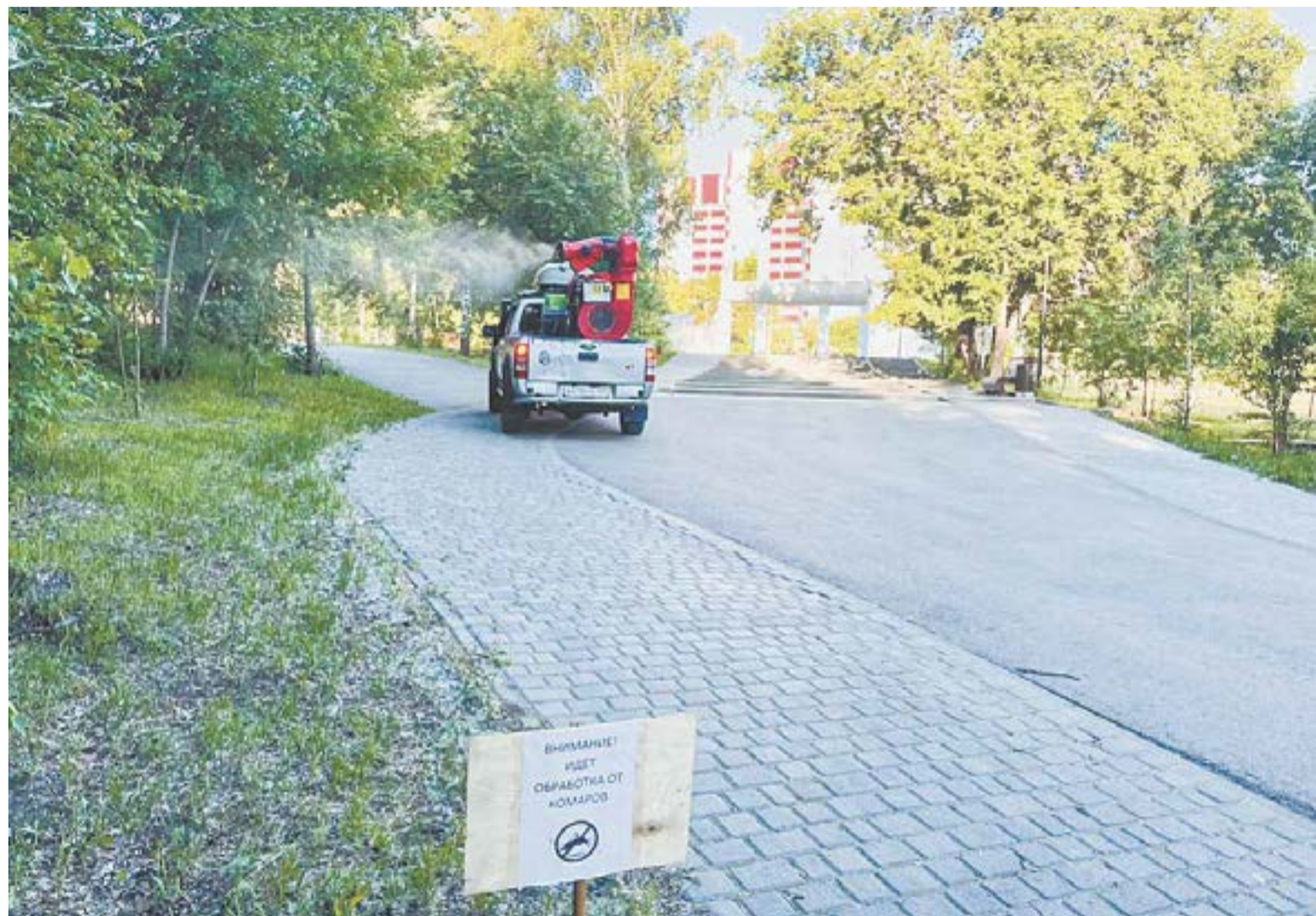
Обработка улиц и скверов от насекомых проводится с помощью специального оборудования, позволяющего добиться максимального эффекта.

– Основной подрядчик – дезинфекционный центр «Биоальтернатива». Для обработки применяется современное