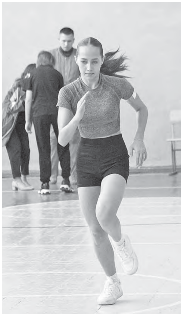
Преодолевая военно-спортивную полосу, ребята проверили себя на прочность.