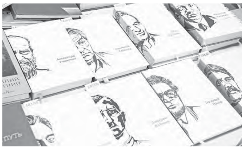
В рамках фестиваля можно приобрести книги, вышедшие в свет по губернаторским издательским проектам.