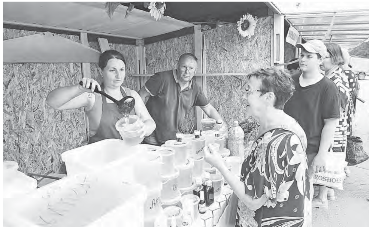
Фестиваль алтайского меда собирает в Барнауле десятки пчеловодов со всего региона.

Большую роль в позиционировании алтайского меда играют не только вкус и качество, но и современные инструменты продвижения. Например, на сайте «Алтайские продукты» организации могут размещать информацию об ассортименте. На информационном портале «От Био к Био» освещают все новинки продукции и технологий, участие и награды краевых производителей в вы-