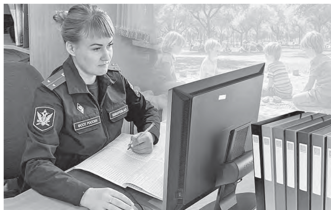
Коллаж Александра ЕРМОЛОВИЧА

– Это направление работы одно из самых ответственных. Порой бывшие супруги пытаются манипулировать друг другом при помощи сыновей и дочерей. В прошлом году четверо детей, которых увезли родители, были объявлены в розыск и успешно найдены. Но помимо мер принудительного воздействия мы пытаемся сделать так, чтобы конфликтующие стороны договаривались друг с другом. При поддержке Фонда президентских грантов реализовали три: по трудоустройству должников, «С детьми не разводятся», «Роди-