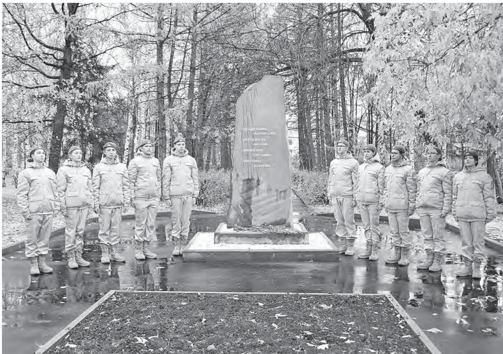
В открытии благоустроенного памятного места в 2024 году участвовали барнаульские юнармейцы.

Перед Днем Победы у Памятного камня пройдет торжественная церемония возложения цветов и митинг.