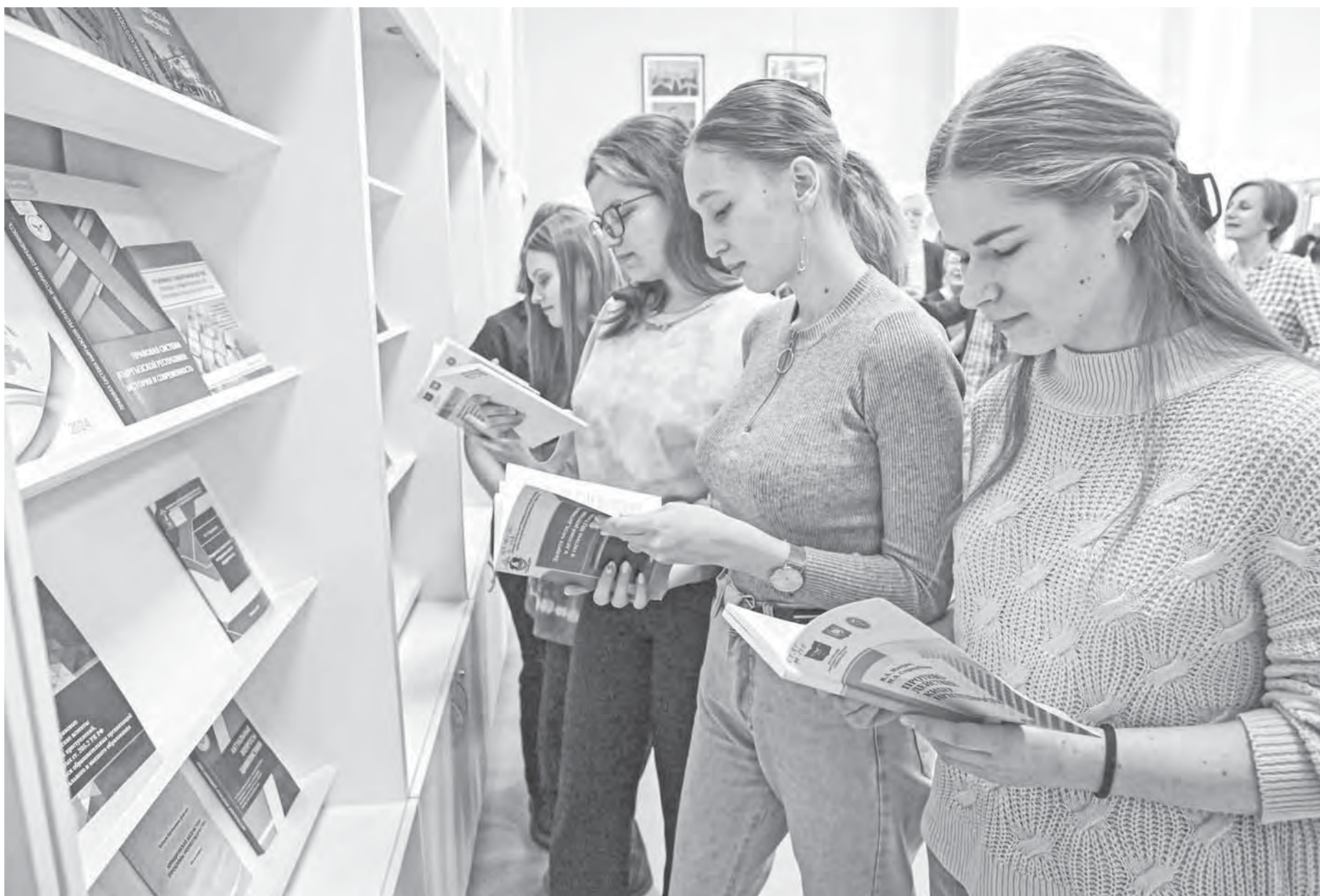
Титульная выставка фестиваля «Издано на Алтае» включает в себя свыше 400 изданий.