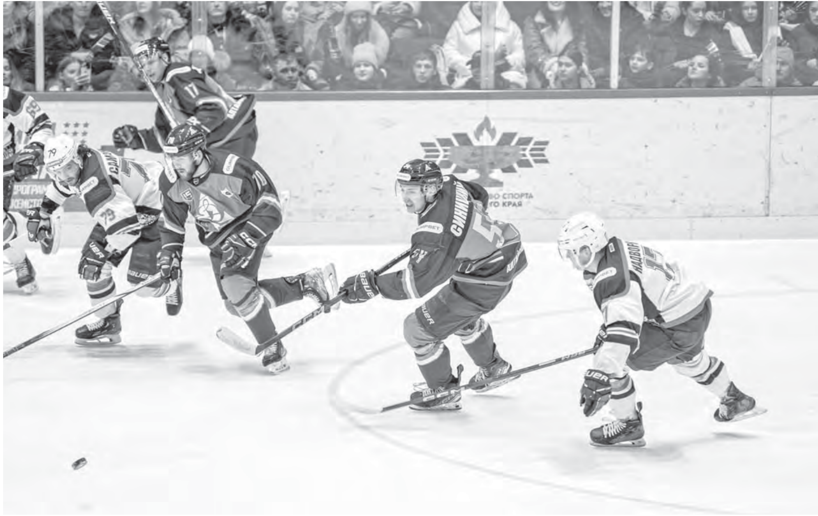
На финише регулярки динамовцы порадовали болельщиков и сделали заявку на плей-офф.

Но преимущество было недолгим. Едва составы уравнились, Константин Пархоменко