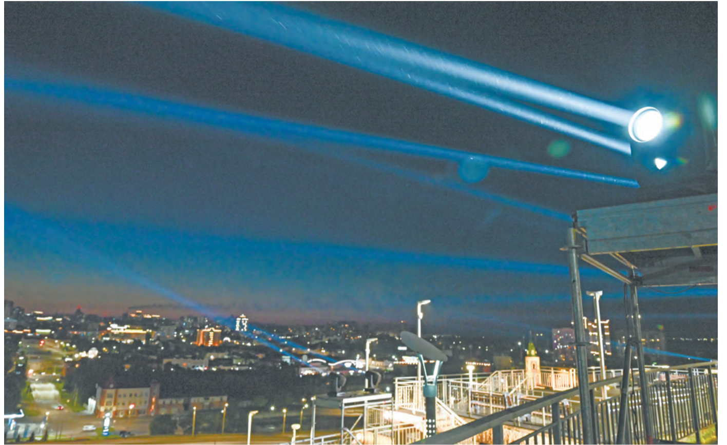
Световые лучи были видны из многих районов города.