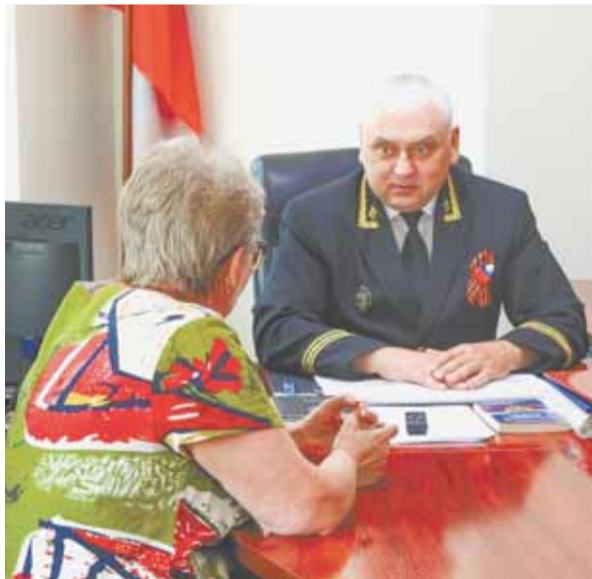
День открытых дверей в судах Алтайского края позволил познакомиться с историей и сложной работой служителей Фемиды.