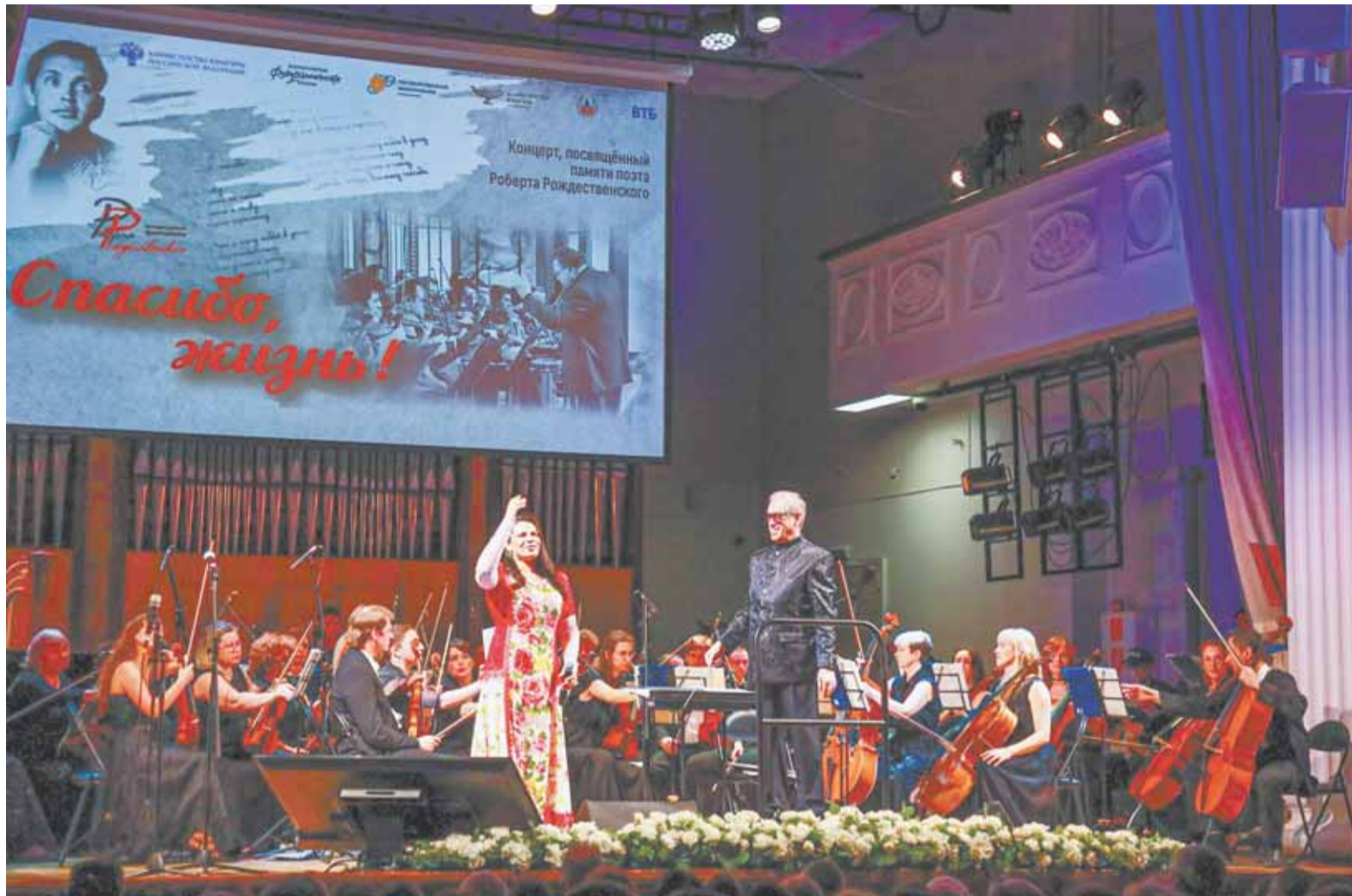
Оркестр имени Юрия Силантьева впервые стал участником фестиваля.