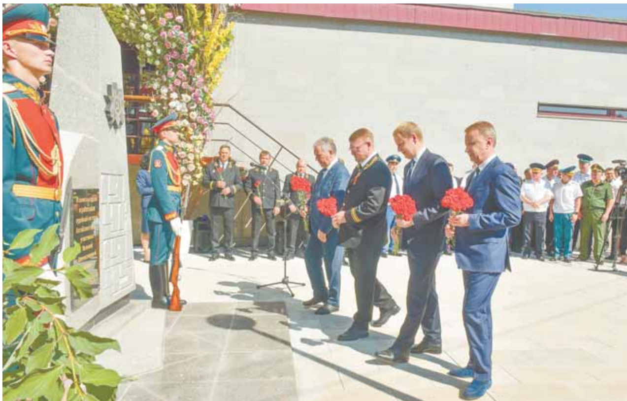
На проспекте Ленина появилось еще одно памятное место в честь героев Великой Отечественной войны.