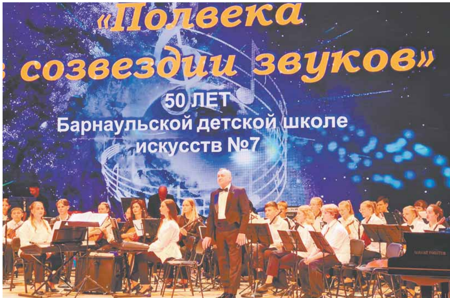
«Сибирский сувенир» дал путевку в большие оркестры многим музыкантам.

В декабре 2024 года оркестру русских народных инструментов «Сибирский сувенир» было присвоено звание «Образцовый самодеятельный коллектив Алтайского края».