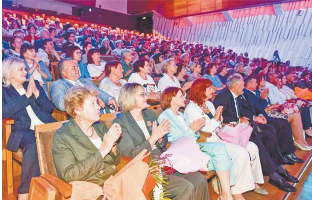
Ведущие сотрудники больницы в этот день получили заслуженные награды.

– Круглосуточный стационар, неотложная помощь, две поликлиники – наши медики каждый день возвращают людям здоровье, ставят на ноги, спасают жизни. Только в этом году мы выделили из краевого