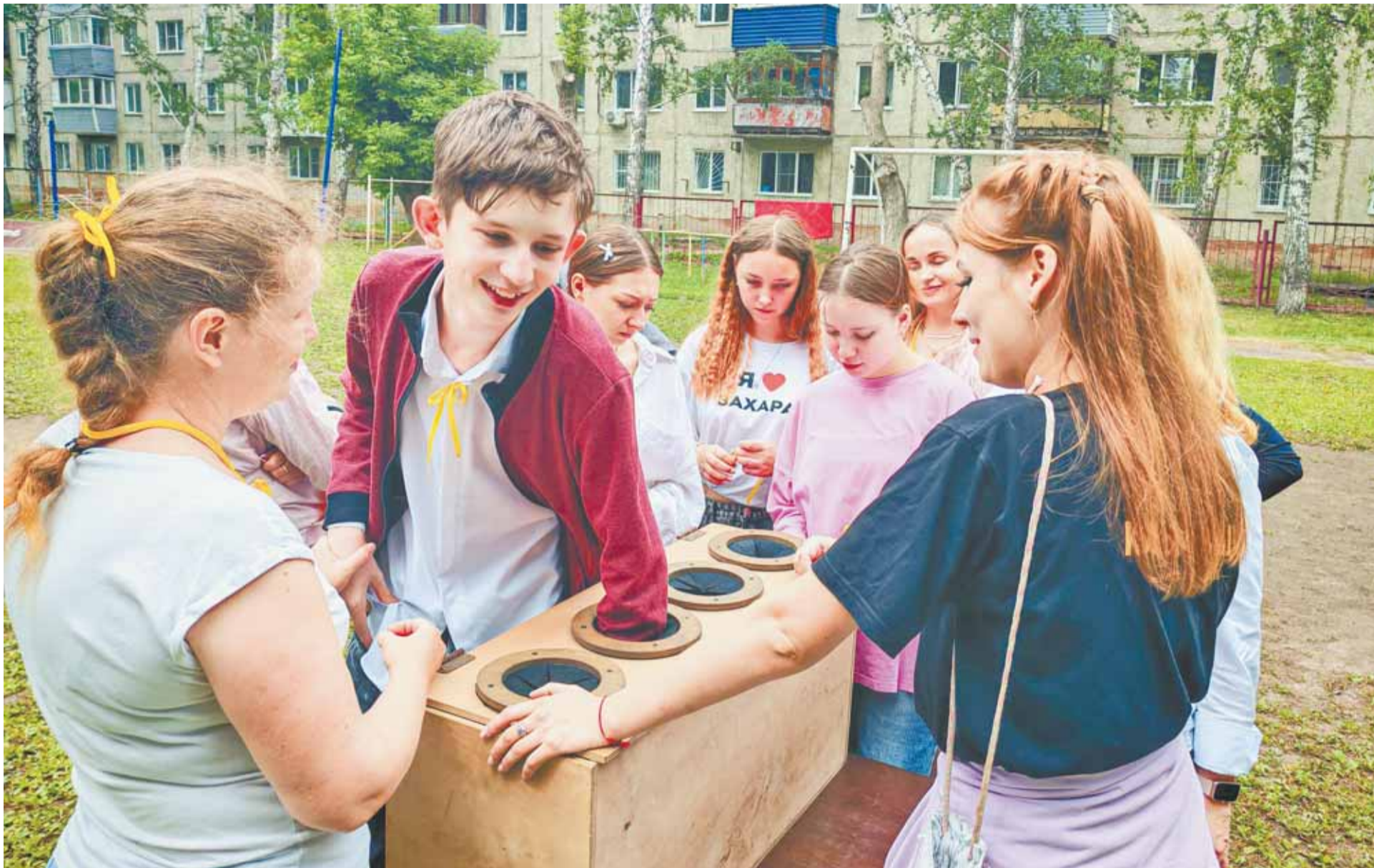
Ребята с азартом включились в предложенную им игру.