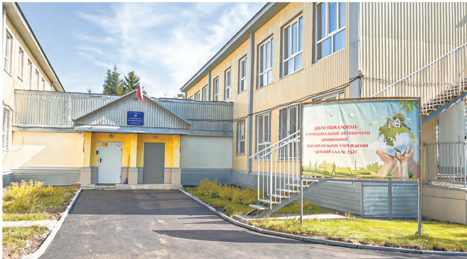
После благоустройства территория детского сада № 257 в поселке Южном стала комфортной и безопасной.

Накануне реализацию проекта на территории дет-