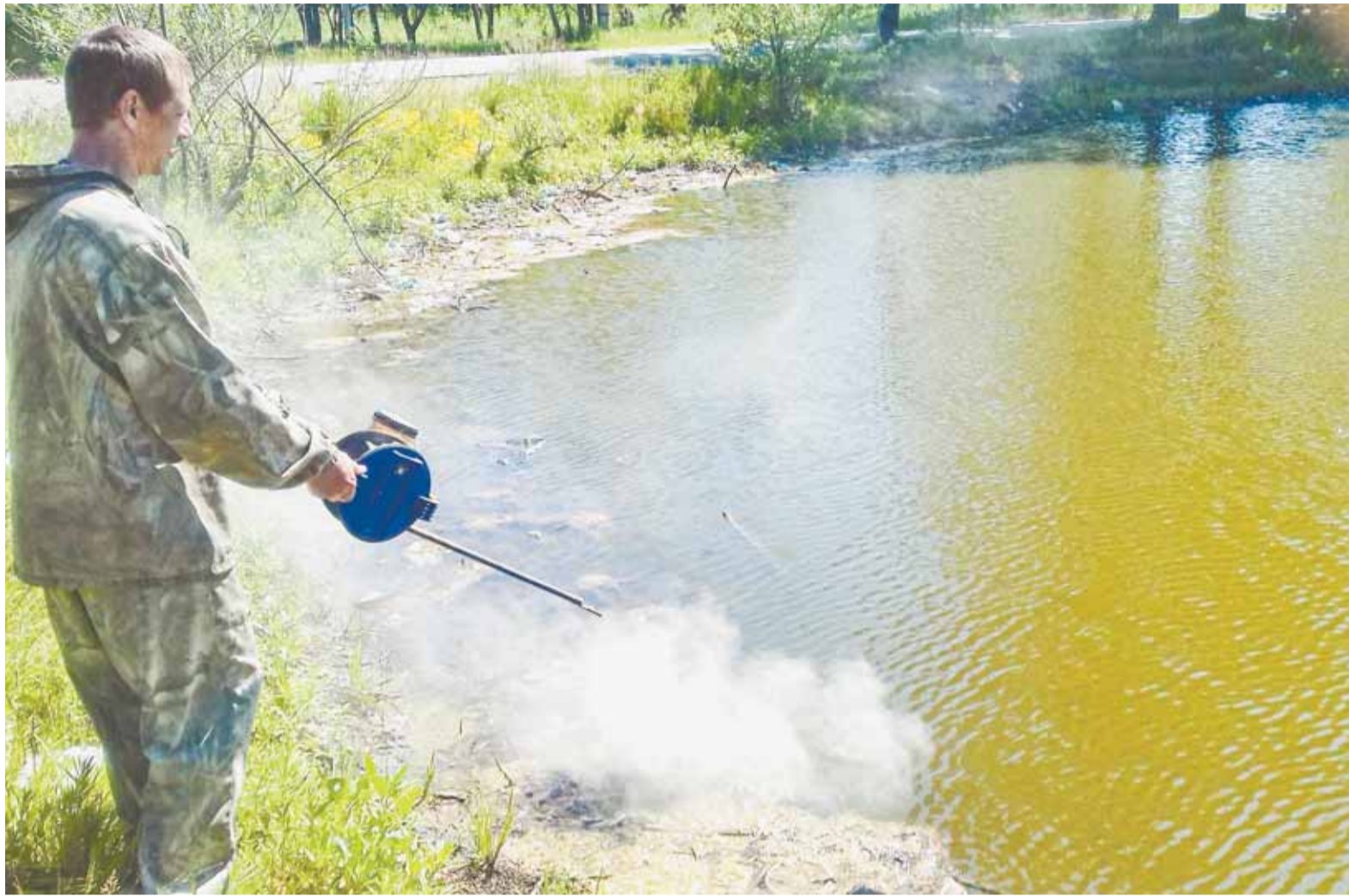
В Барнауле ведется обработка от комаров зеленых зон и водных объектов.

– Проводимые обработки приносят кратковременный эффект, поэтому меры индивидуальной защиты имеют решающее значение, – обращает внимание эксперт. – Чтобы обезопасить себя от укусов комаров и мошек, необходимо нанести на одежду или на тело репеллент согласно инструкции на флаконе. Противомоскитная сетка на окнах