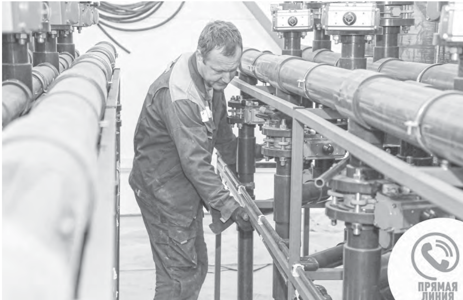
Реконструкция артезианского водозабора в рамках нацпроекта «Чистая вода» позволила улучшить качество воды для 2,5 тыс. потребителей.

– Всего в текущем году планируется провести 19 продовольственных ярмарок, семь из них – на пригородной территории. На них представлен широкий ассортимент продукции алтайских производителей. В осенний период традиционно будет организована дополнительная площадка для торговли овощами. Кроме этого, комитетом по развитию предпринимательства и потребительскому рынку в осенний период планируется проведение конкурса «Дары осени».