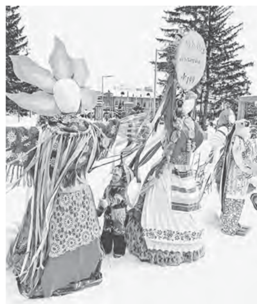
В парке культуры и отдыха «Центральный» на масленичных гуляниях горожан радовали традиционными играми и хороводами.