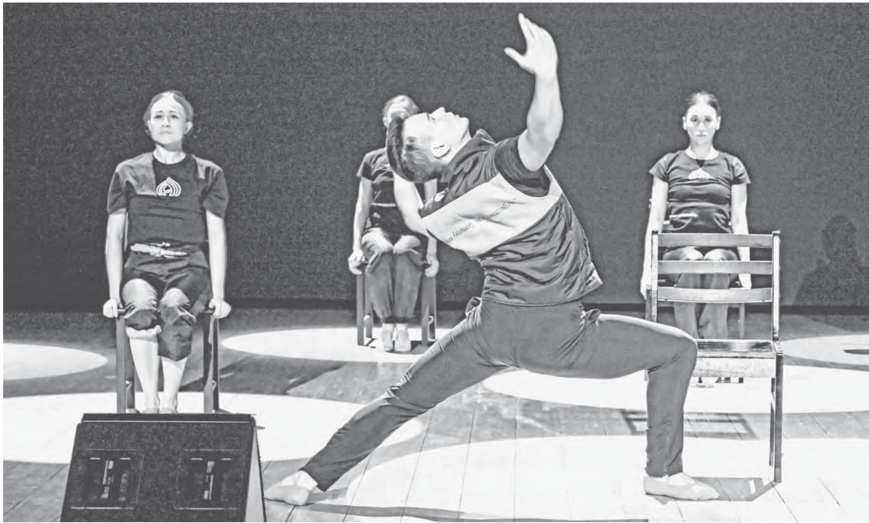
В спектакле «Край возле самого неба» задействовано около 30 артистов.

Спектакль разросся до двух отделений с антрактом, каждая из четырех частей постановки