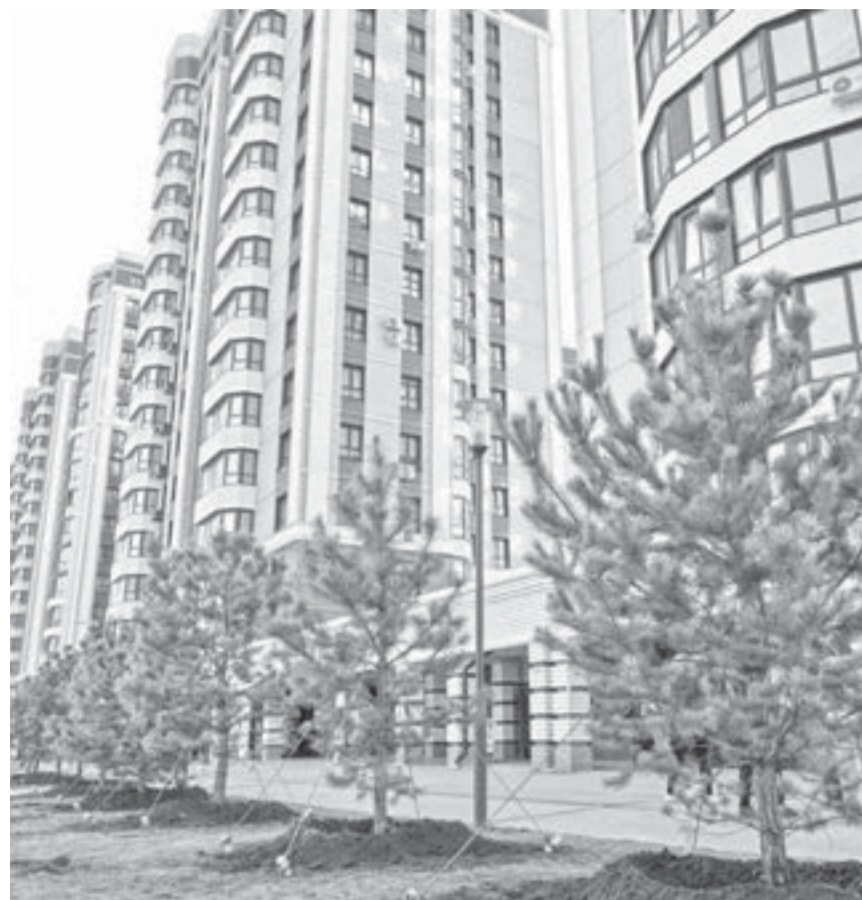
Новые сосны будут по-прежнему радовать глаз жителей микрорайона.

В Барнауле восстановили аллею по адресу: ул. 65 лет Победы, 1