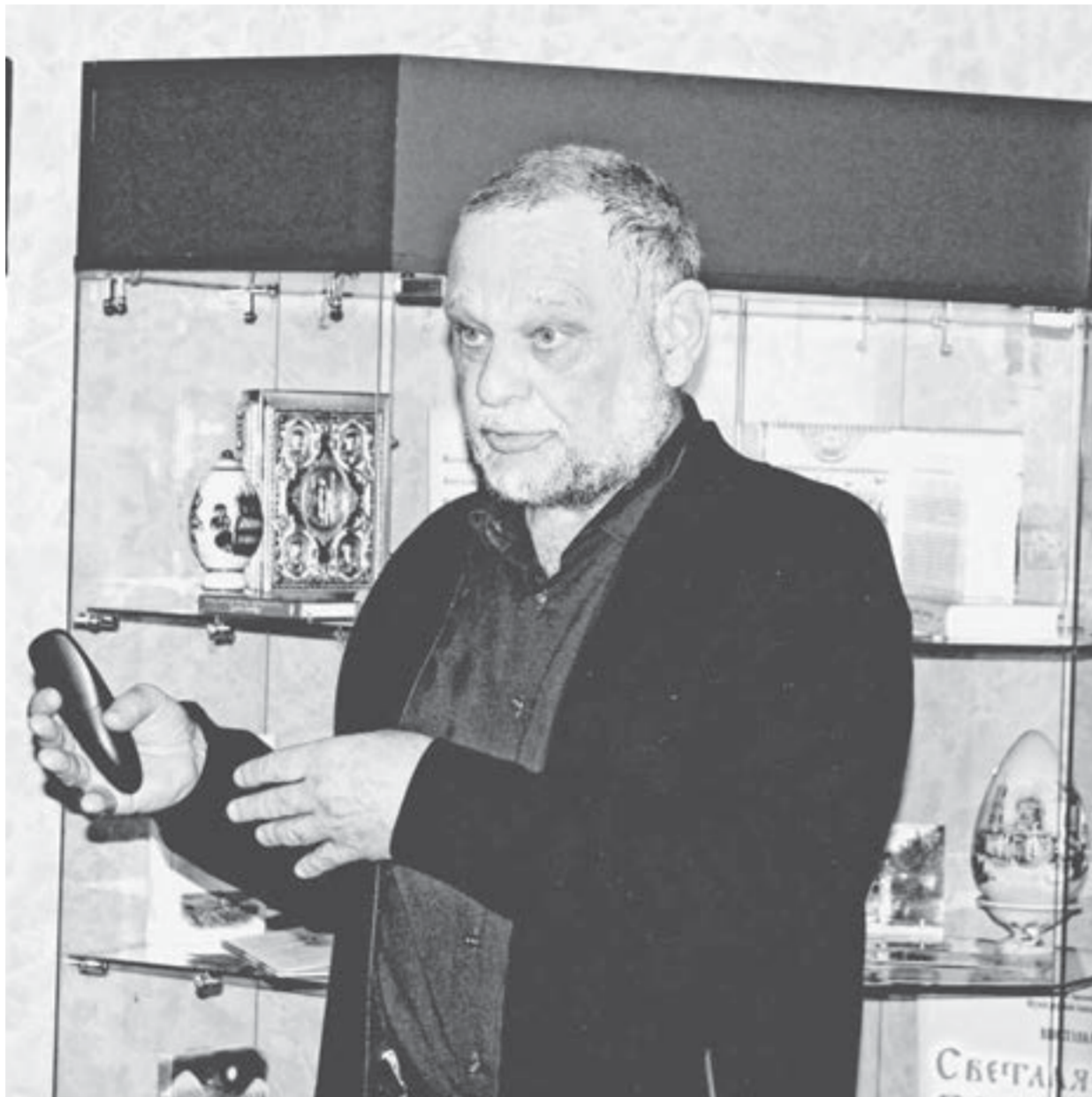
Благодаря барнаульским ученым алтайский шаманизм довольно хорошо изучен.

– К примеру, все птицы, кроме водоплавающих, являлись представителями верхнего мира, – поясняет Артур Леонидович. – Потому что вода считалась гранью между мирами, порталом в нижний мир. Вообще, у древних людей отношения с водой складывались непросто. Так, у алеутов, которые полжизни проводили в воде на байдарках, считалось, что если человек упал в воду, то его нельзя спасать, ведь у него поменялась сущность. А вот другие птицы у наших предков были в почете. Причем у шаманов самой главной птицей считался ворон, по их представлениям – демидур, вы-