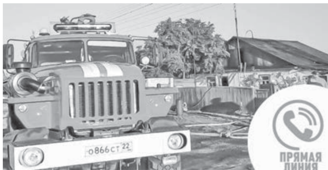
С 25 апреля на территории Алтайского края введен особый противопожарный режим, во время которого повышенное внимание уделяется профилактическим рейдам в садоводческих товариществах и частном секторе.

Хочу отметить, что сотрудники МЧС России не уполномочены осуществлять контрольно-надзорные и профилактические мероприятия на территории лесов