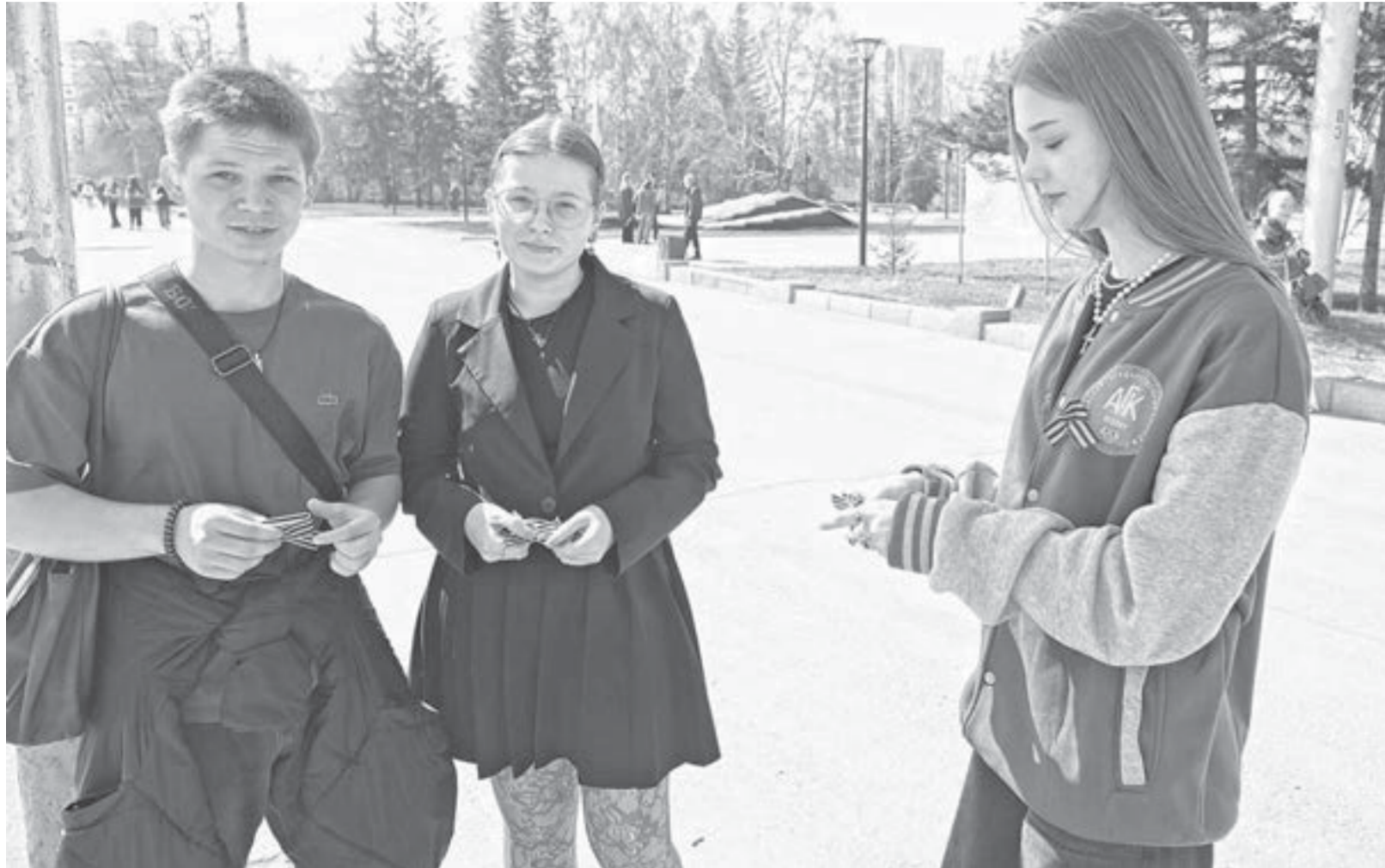
Волонтеры рассказывали о правилах ношения ленты, а также помогли горожанам закрепить ее на одежде.

Ежегодная акция, приуроченная к Дню Победы, стартовала на улицах и площадях краевой столицы