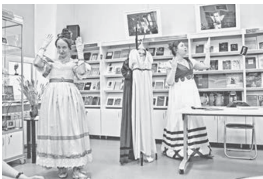
От лекций и интеллектуальных батлов до музыкальных экспериментов и модных показов – вот чем запомнится «Библионочь-2026».