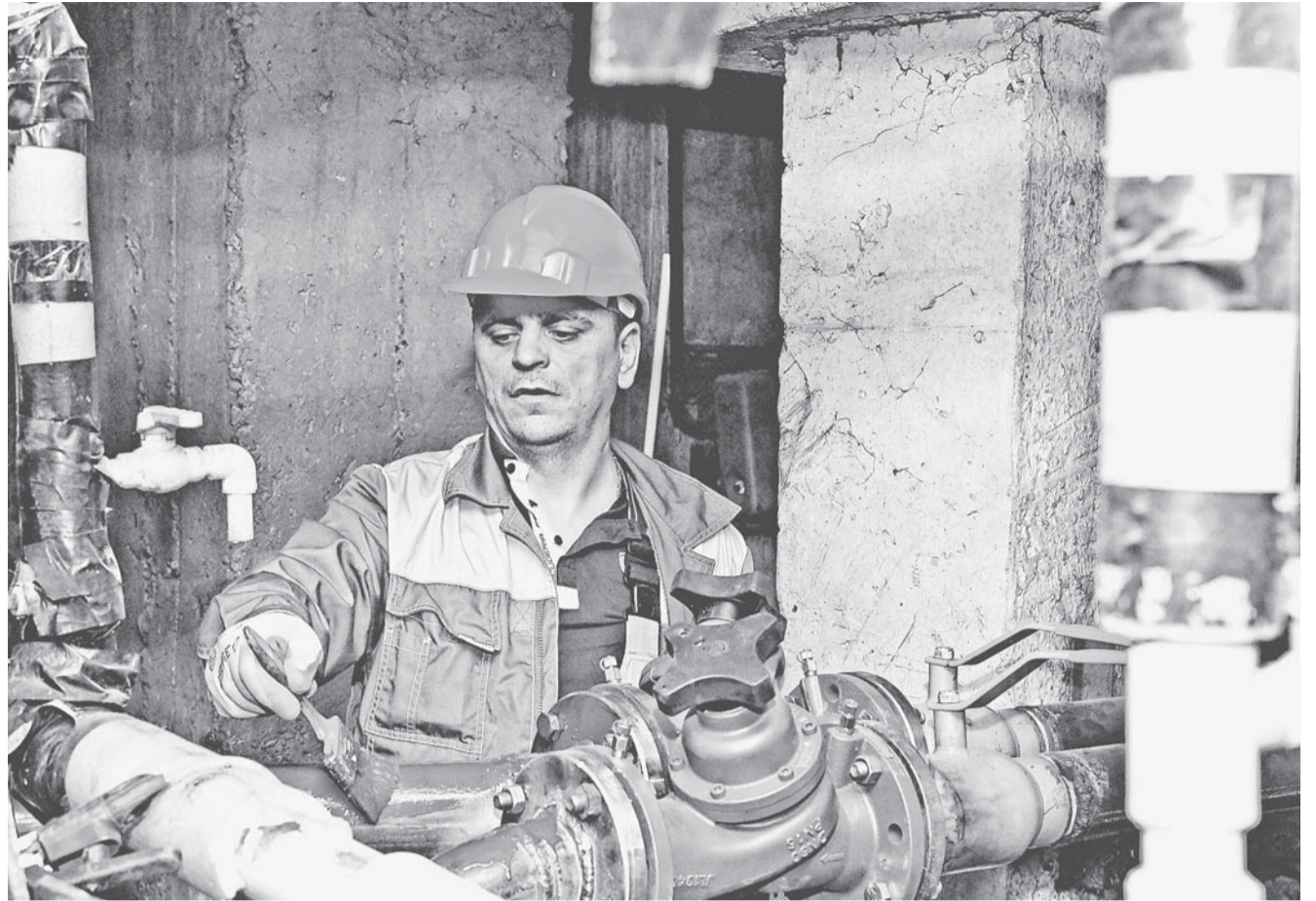
Покраска инженерных сетей предотвращает в том числе образование коррозии металла.