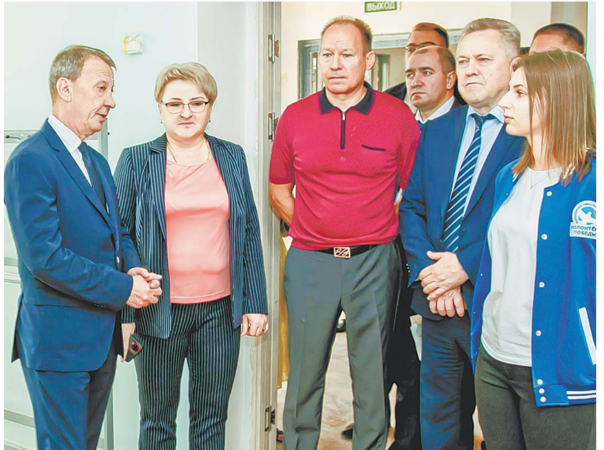
Участники выездного совещания оценили степень готовности объекта.