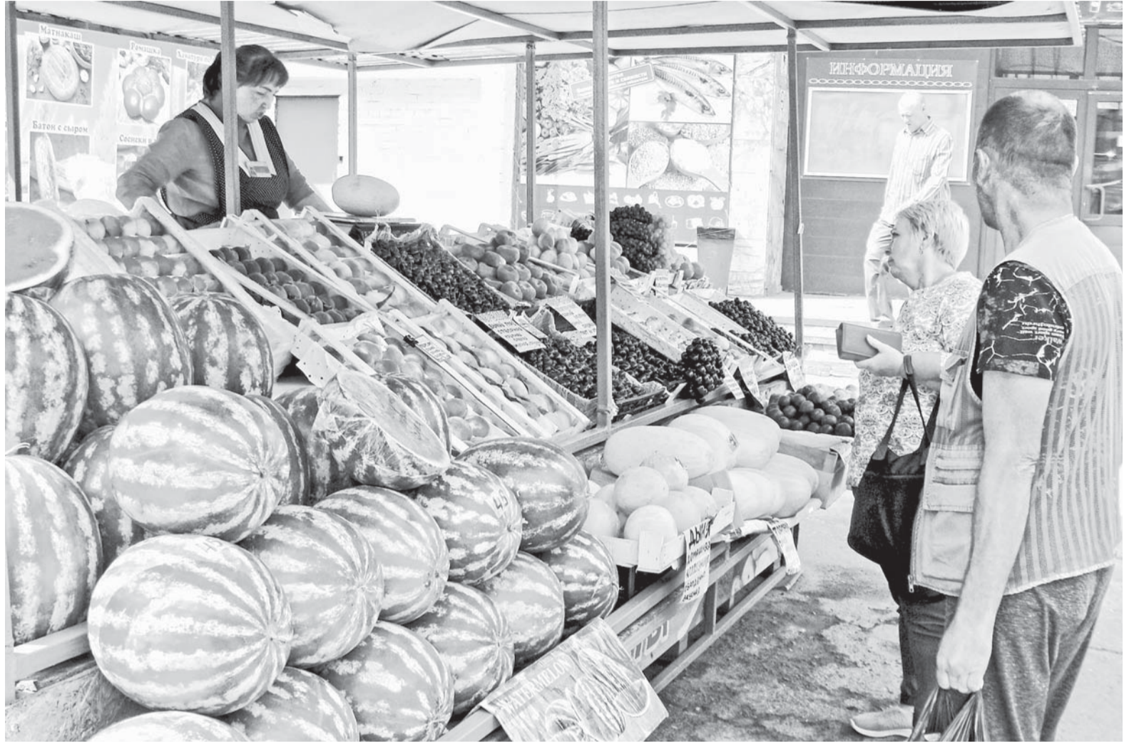
Не покупайте арбузы половинками, это может привести к пищевому отравлению.