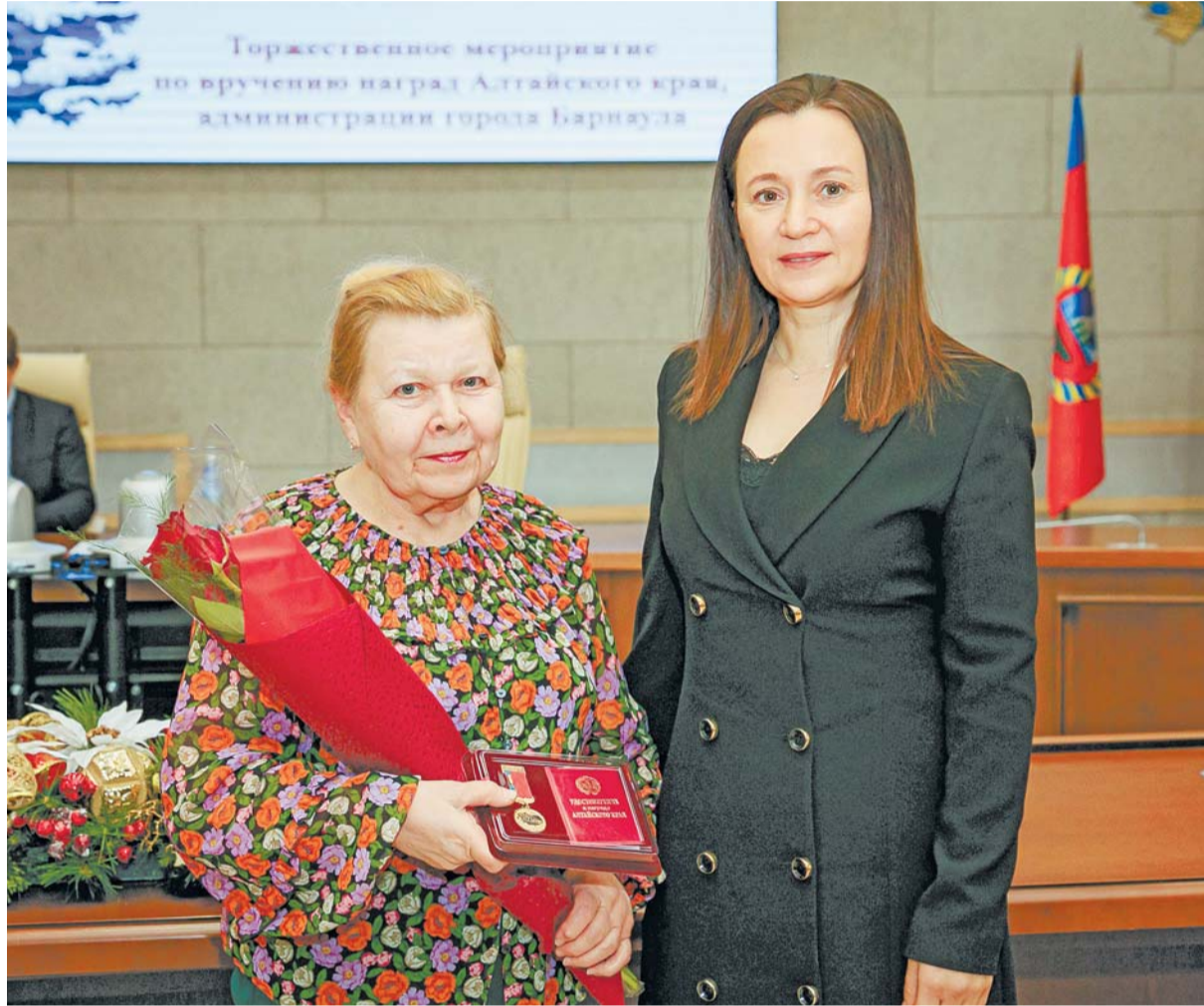
Барнаульцев отметили краевыми и городскими наградами за достойный труд.

– Благодаря вашему труду наш город становится красивее и уютнее, – подчеркнула она. – В декабре принято подводить итоги. В этом году жизнь Барнаула сопровождало множество значимых событий. В частности, в Нагорном парке установлена стена «Город трудовой доблести» – символ трудового подвига наших горожан в годы Великой Отечественной войны. На сегодняшний день продолжается масштабный проект реконструкции путепровода на пр. Ленина. Также в этом году был избран новый созыв Барнаульской городской Думы. Мы продолжаем строить парки, дороги, детские сады, школы – и все это складывается из труда каждого.