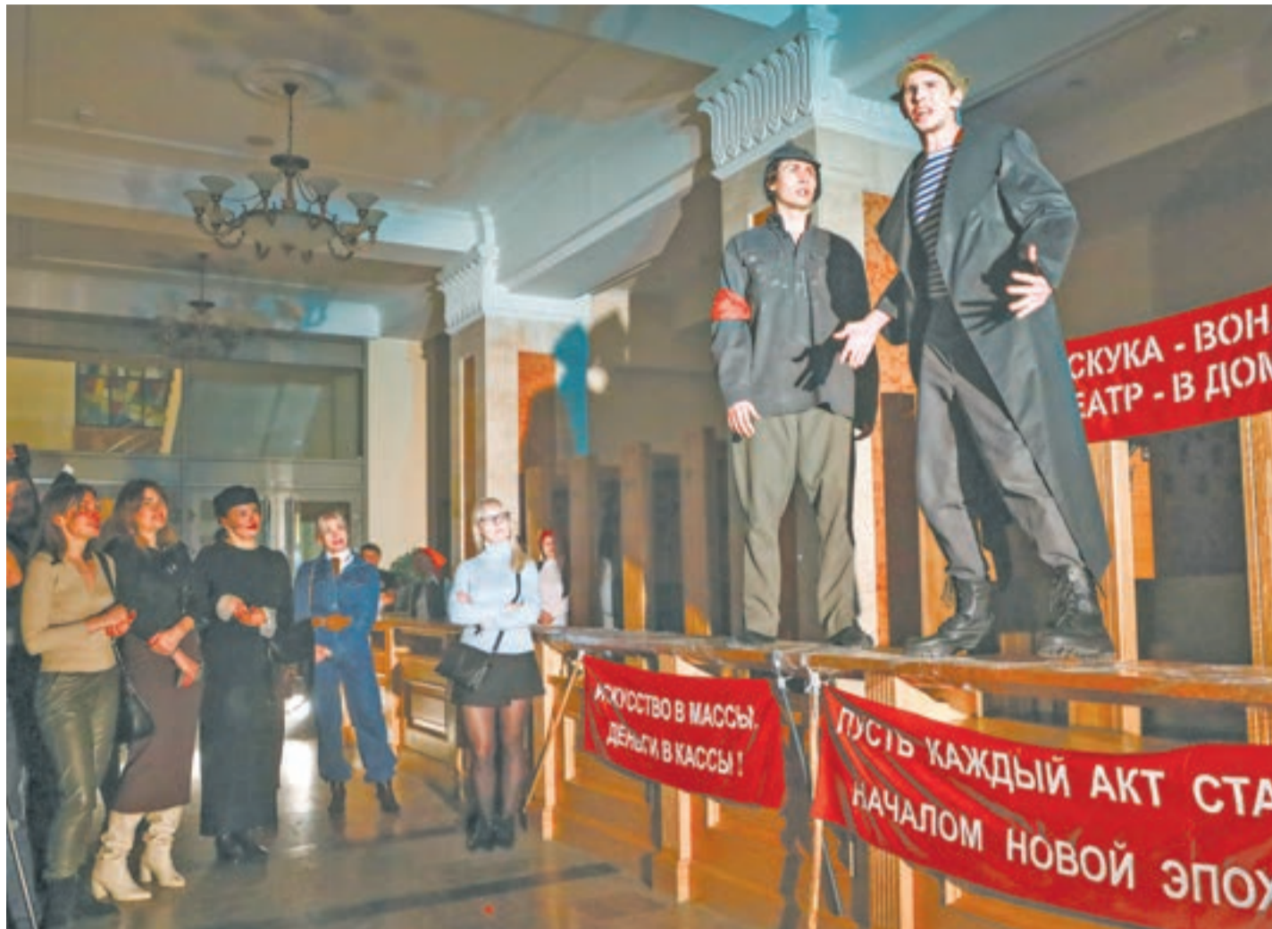
Молодежный театр Алтая решил посвятить первую акцию своей истории.