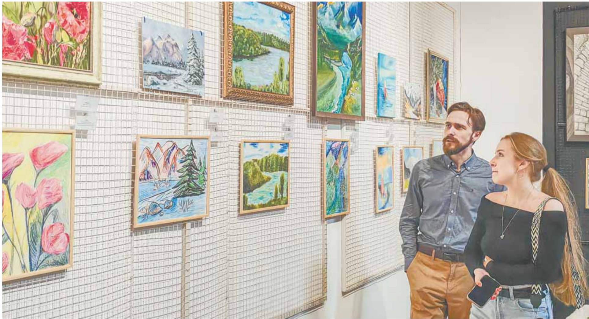
Юные художники были вольны в выборе материалов и размеров полотна, которые необязательно совпадали с оригиналом.