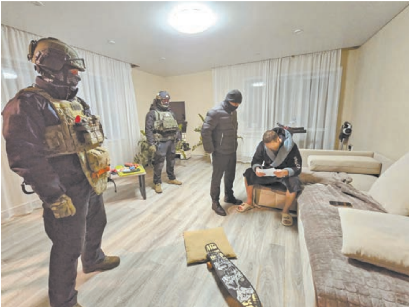
На время следствия участники преступной группы помещены в СИЗО.