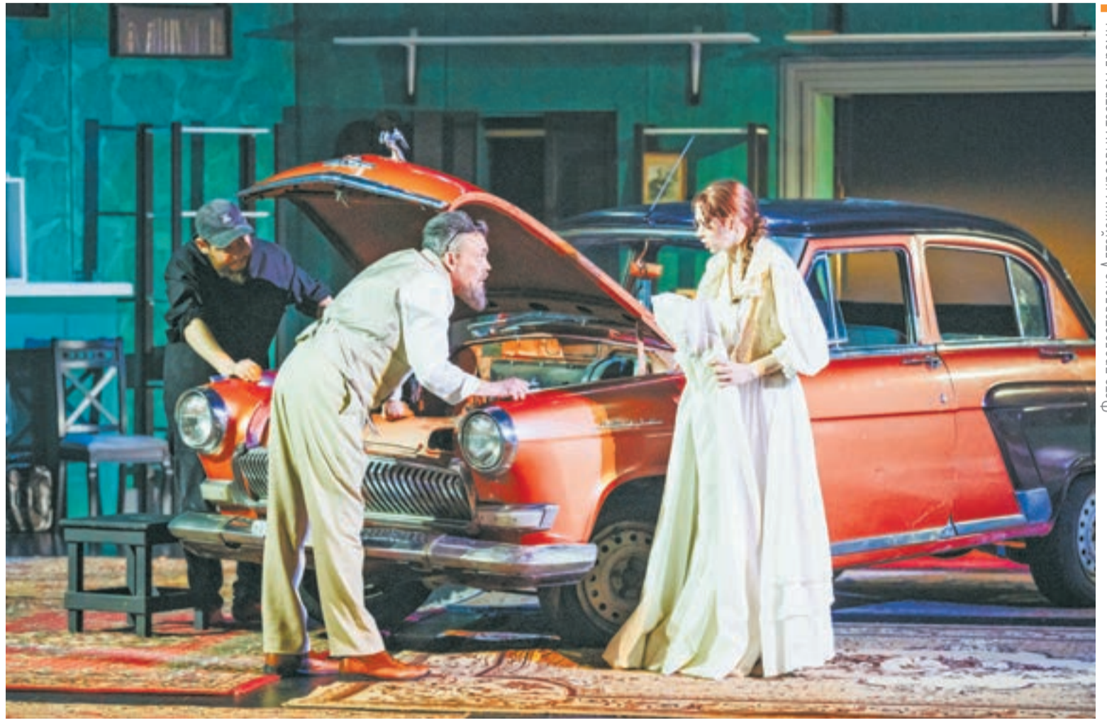
Символом спектакля стала старая «Волга», которую никак не могут починить автор пьесы и режиссер спектакля.