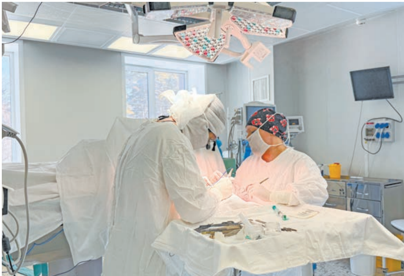
В регионе выполнено 209 операций по пересадке почки.

– К сожалению, хроническая болезнь почек – это «молчащее» заболевание. Если инфаркты, стенокардии и другие сердечные недуги о себе кричат – из-за боли пациент вызывает скорую, то хронические болезни почек длительное время протекают скрытно. К нам часто приходят пациенты, которые вроде бы чувствуют себя терпимо, но ощущают легкую слабость. А при обследовании мы выявляем повышение до предельного уровня азотемии – уровня азотистых продуктов, которые должны выводиться почками. Обычно это категория молодых людей без сопутствующих заболеваний. Особенно обидно, что в таком состоянии, в терминальной стадии почечной недостаточности, даже имея самую современную терапию, мы можем предложить для них единственный вариант – заместительную почечную терапию с помощью гемодиализа и в дальнейшем