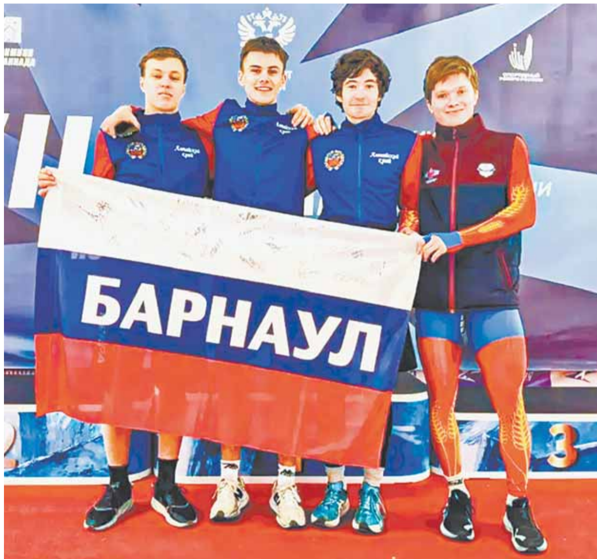
Воспитанники СШОР «Клевченя» уже несколько лет показывают высокие результаты.

– Для такой работы дети должны, скажем так, в одних пеленках расти, хорошо чувствовать друг друга. По-