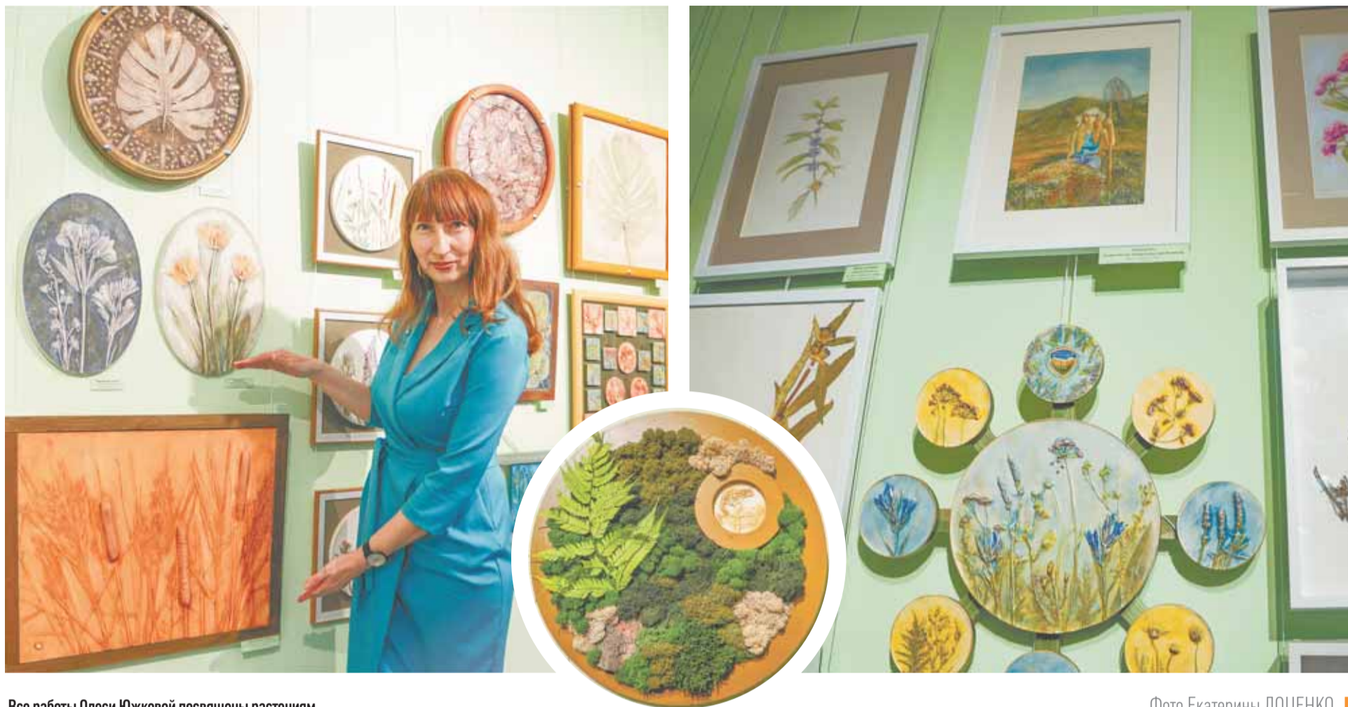
Все работы Олеси Южковой посвящены растениям.