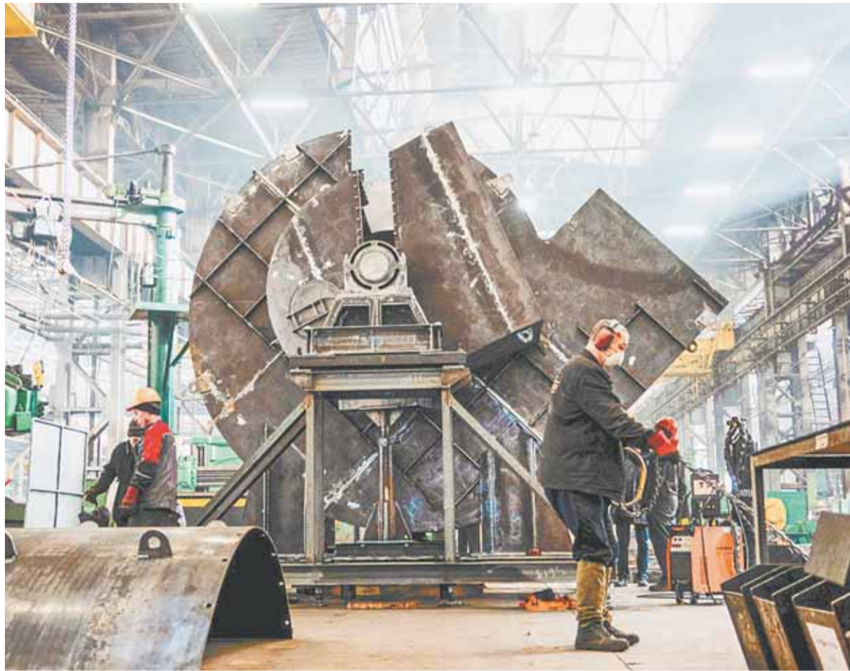
Предприятия Барнаула эффективно используют меры господдержки для модернизации производств.

Среди главных факторов, повлиявших на динамику производства, называют высокую