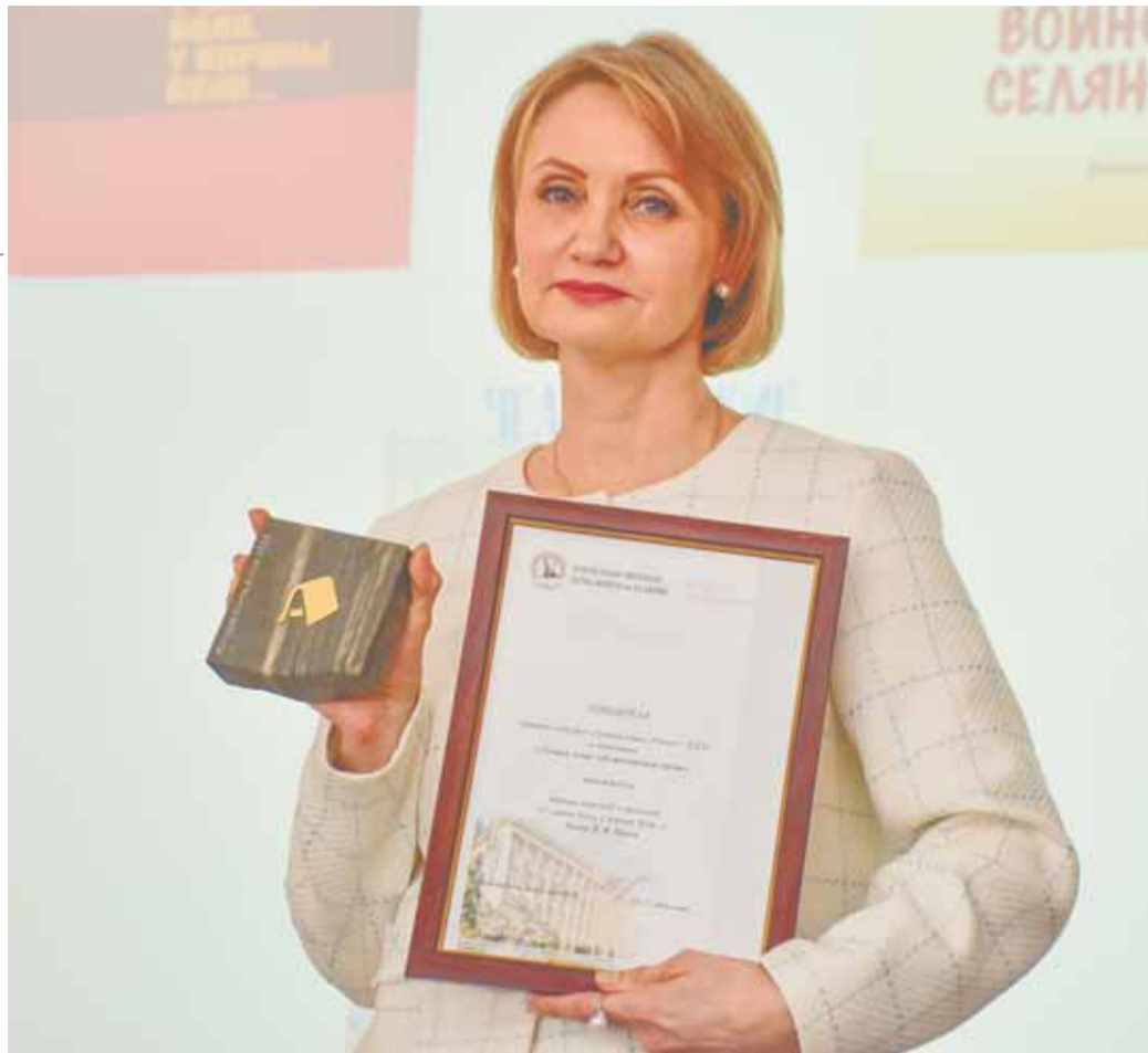
Главным событием фестиваля стало награждение победителей конкурса «Лучшая книга Алтая» дипломами и памятными призами, изготовленными из ревневской яшмы.