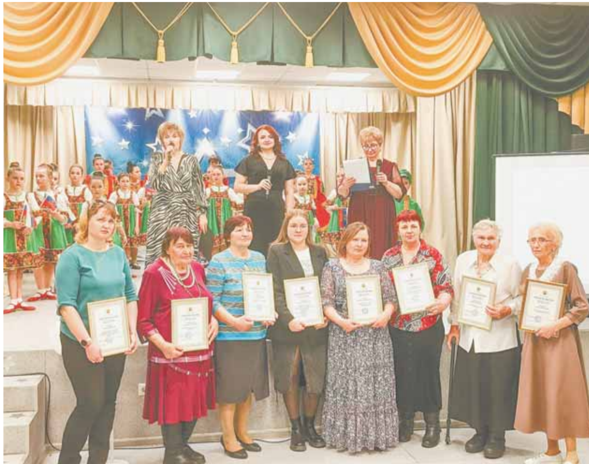
Особо отличившиеся активисты и заслуженные ветераны получили свидетельства о занесении в альбом «Ими гордится село» и ценные подарки от ТОС с. Гоньба.