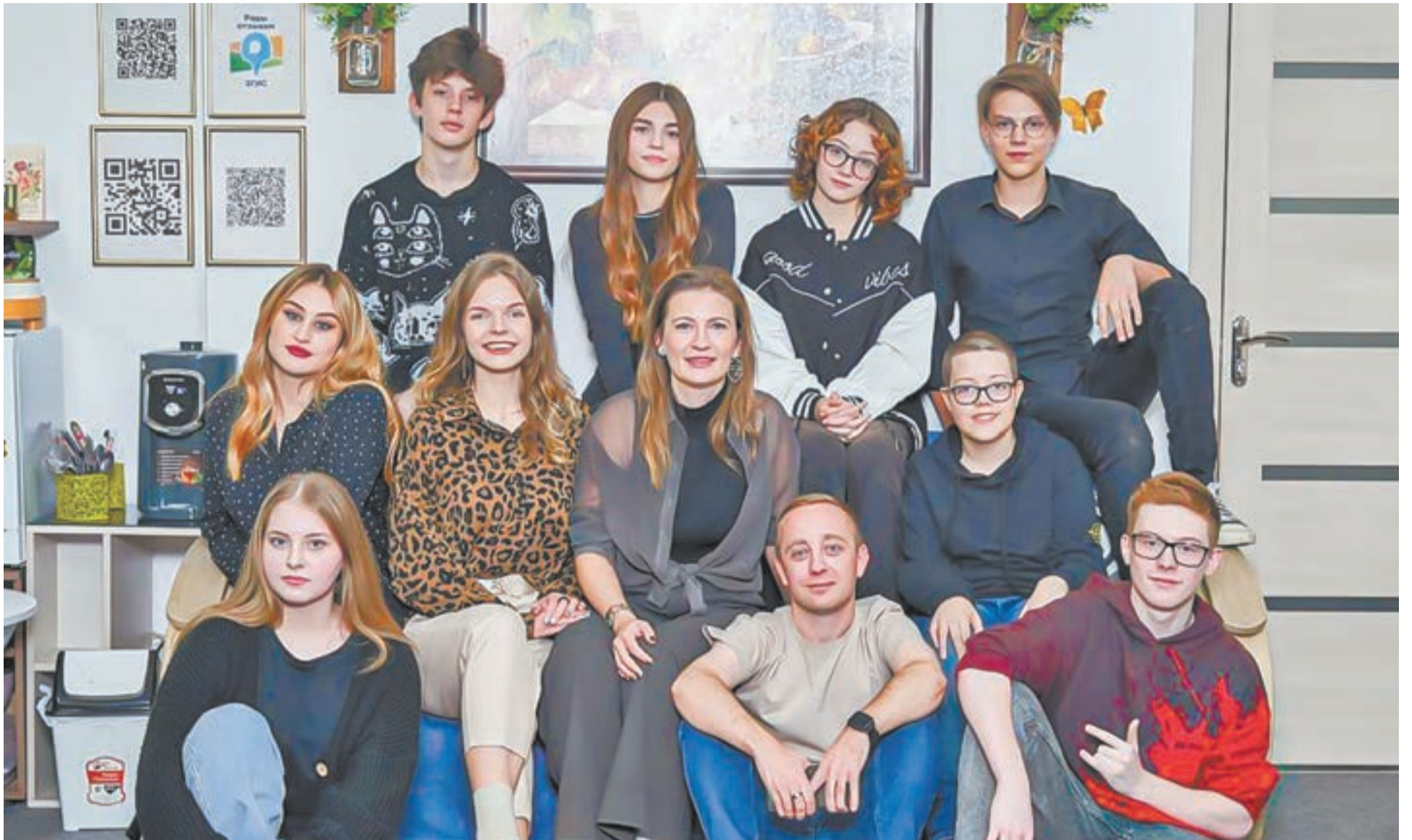
Юные стендаперы вместе с наставником придумывают юмористические номера.

Как развивается сфера подросткового юмора