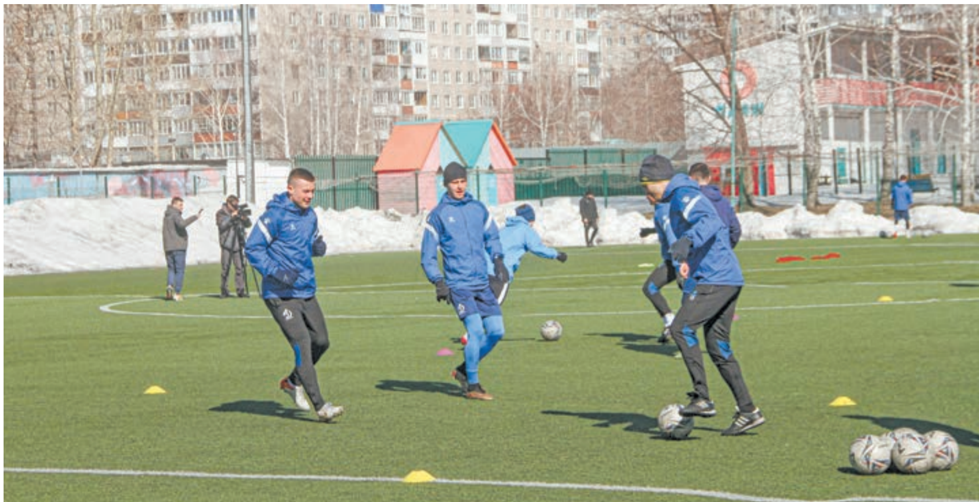
На этой неделе «Динамо» тренировалось на одном из полей стадиона СШОР Смертина.