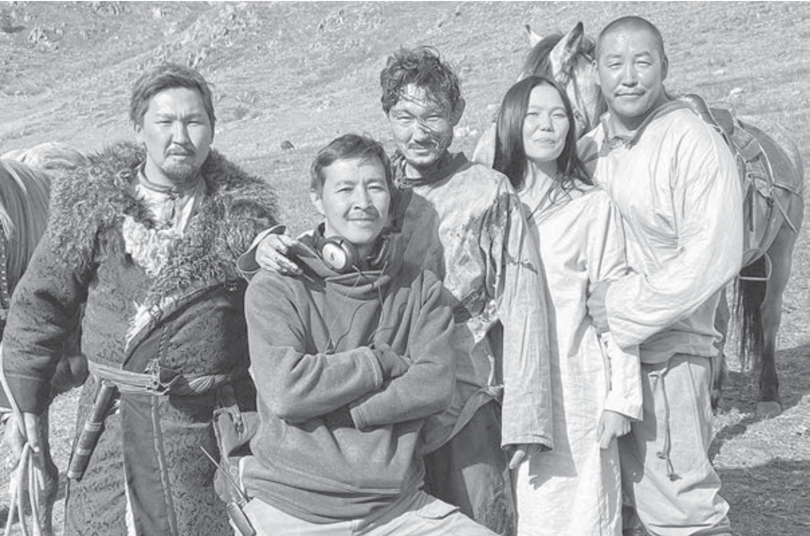
Съемки фильма «Волки» проходили на Алтае в Шебалинском районе.