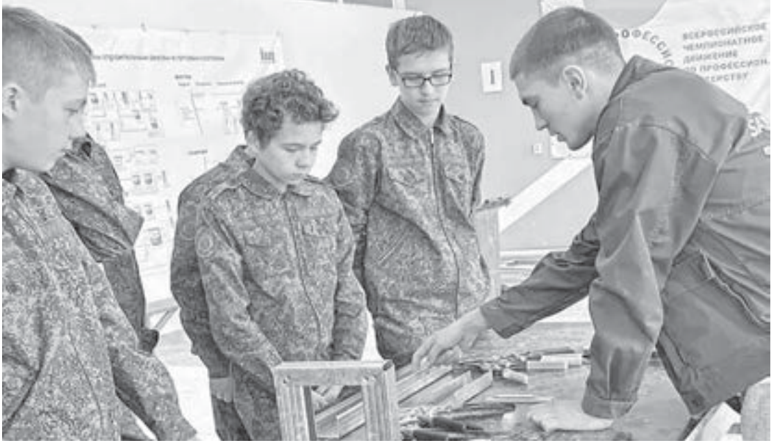
Школьники Барнаула посещают производственные площадки краевой столицы.

Старшеклассники школы также посетили историко-демонстрационный зал Управления ФСБ России по Алтайскому краю.