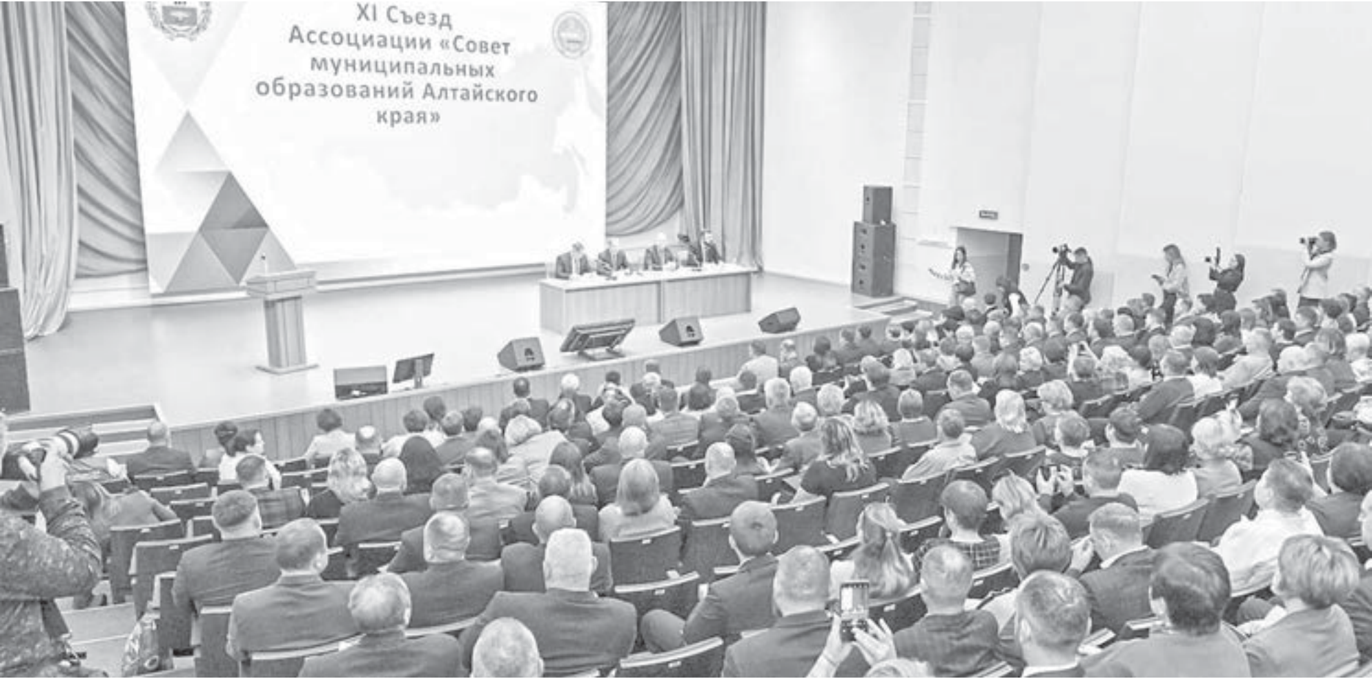
В мероприятии приняли участие главы городов и районов Алтайского края.

На XI Съезде Ассоциации «Совет муниципальных образований Алтайского края» обсудили актуальные вопросы развития региона