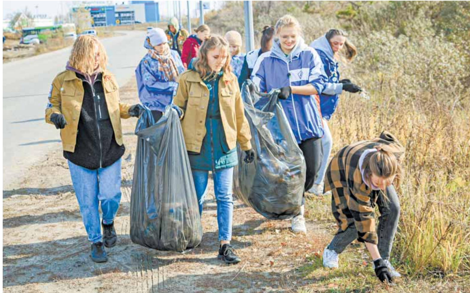
Активными участниками экологических акций становятся студенты и молодежь города.

Планируется, что в этом году коллективными усилиями будут очищать улицы, тротуары, дворы и зеленые уголки от грязи и мусора,