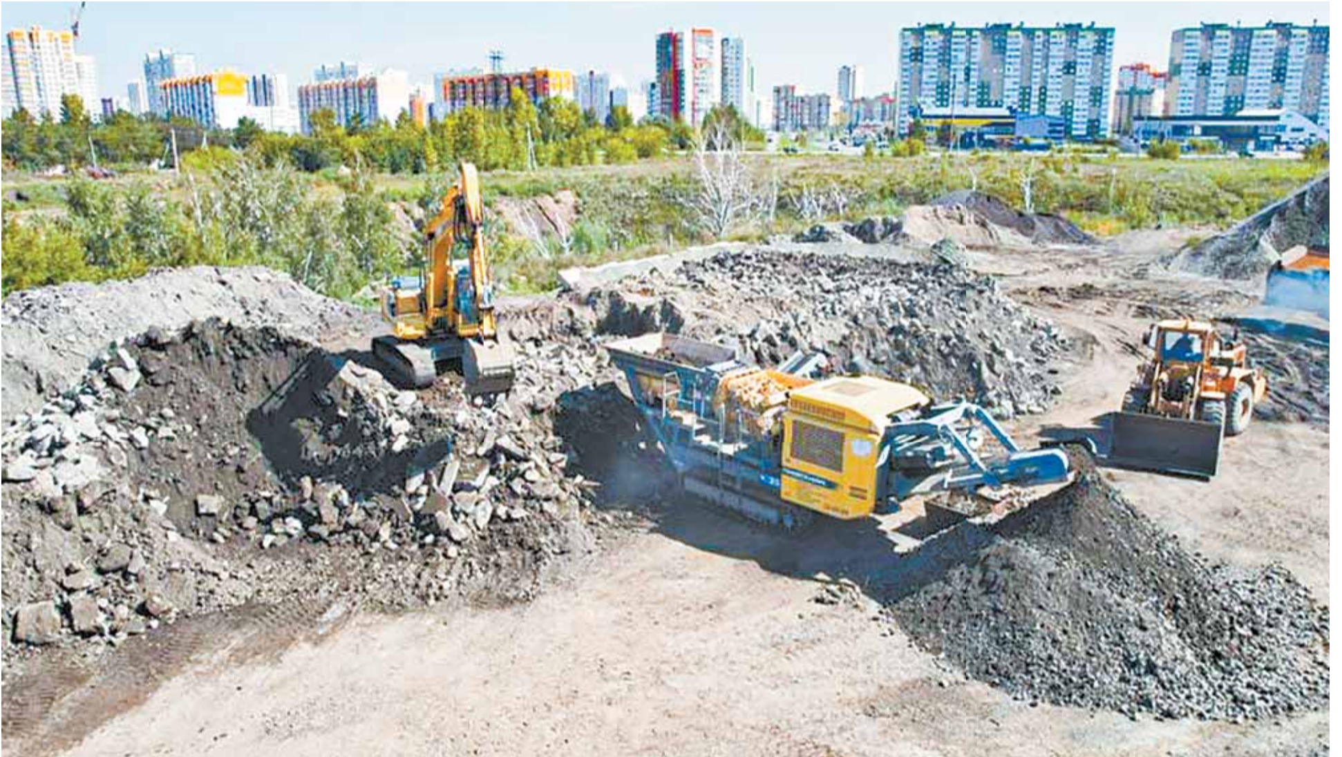
Эта гора вышедшего из эксплуатации железобетона не мусор, а сырье для производства инертного стройматериала.