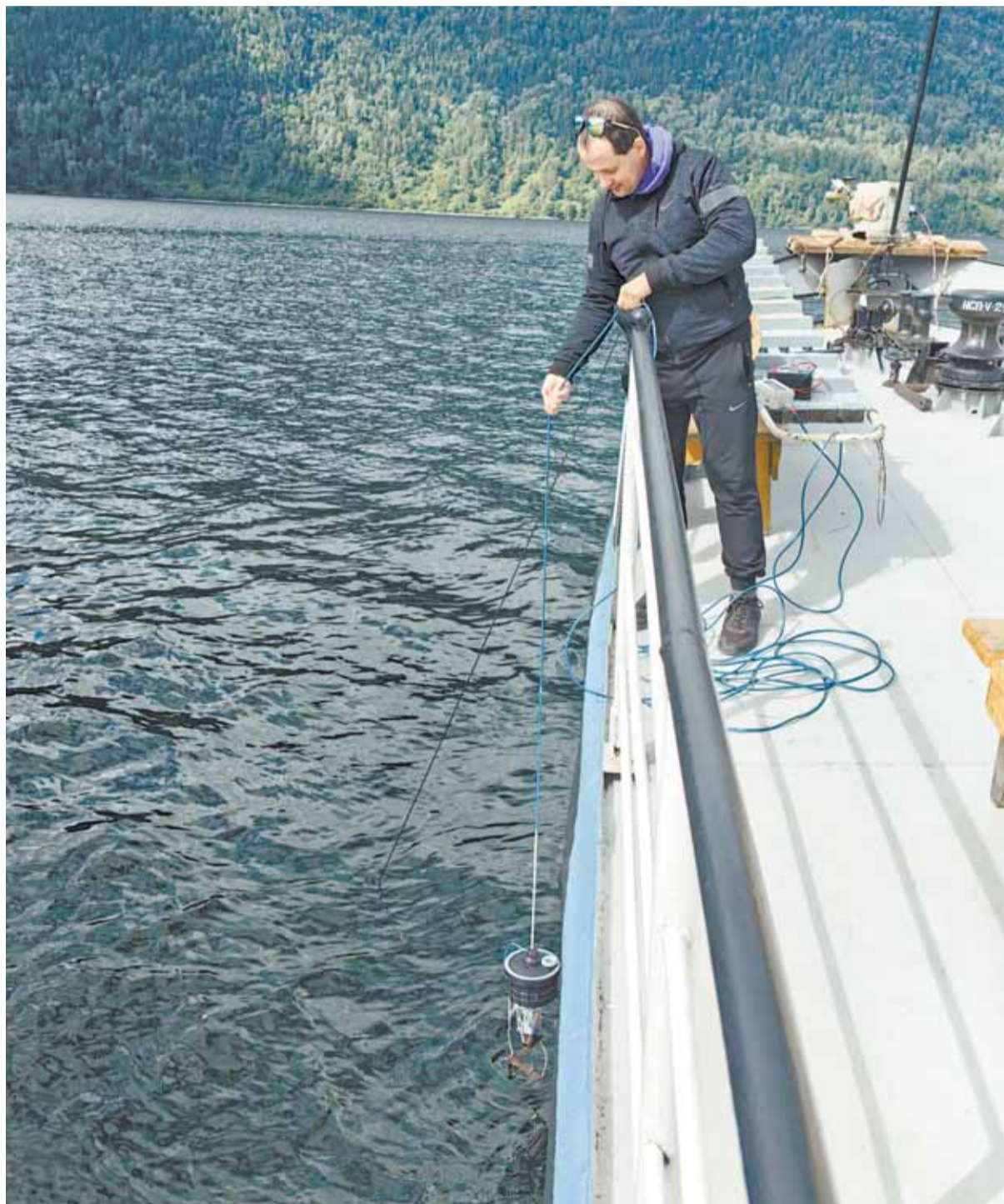
На протяжении трех лет ученые испытывают свою разработку, выезжая в экспедиции на озера Алтая.

Принцип действия прибора прост: его опускают в водоем на определенную глубину и по каждому из установленных светофильтров определяют уровень