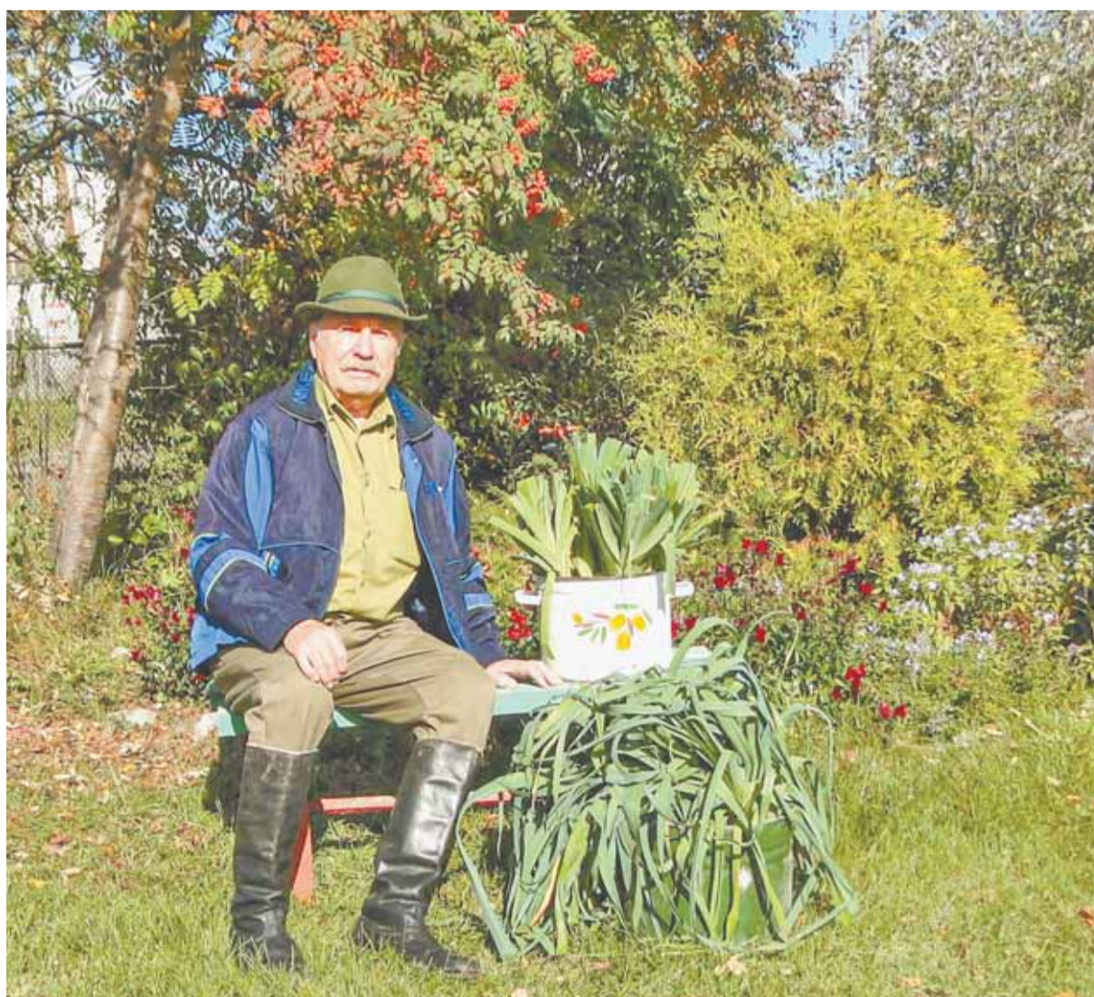
Лук-порей боится высыхания, поэтому при закладывании его на хранение нужно оставить достаточное количество зеленой шевелюры.

– Побелка особенно нужна во второй половине зимы. С февраля важно, чтобы набирающее яркость солнышко не нанесло вред деревьям. От белоснежного побеленного ствола солнечные лучи будут отражаться. Если это не произойдет, то у деревца нагревается кора, а внутри оно остается холодным. Возникают ожоги и трещины, в которых