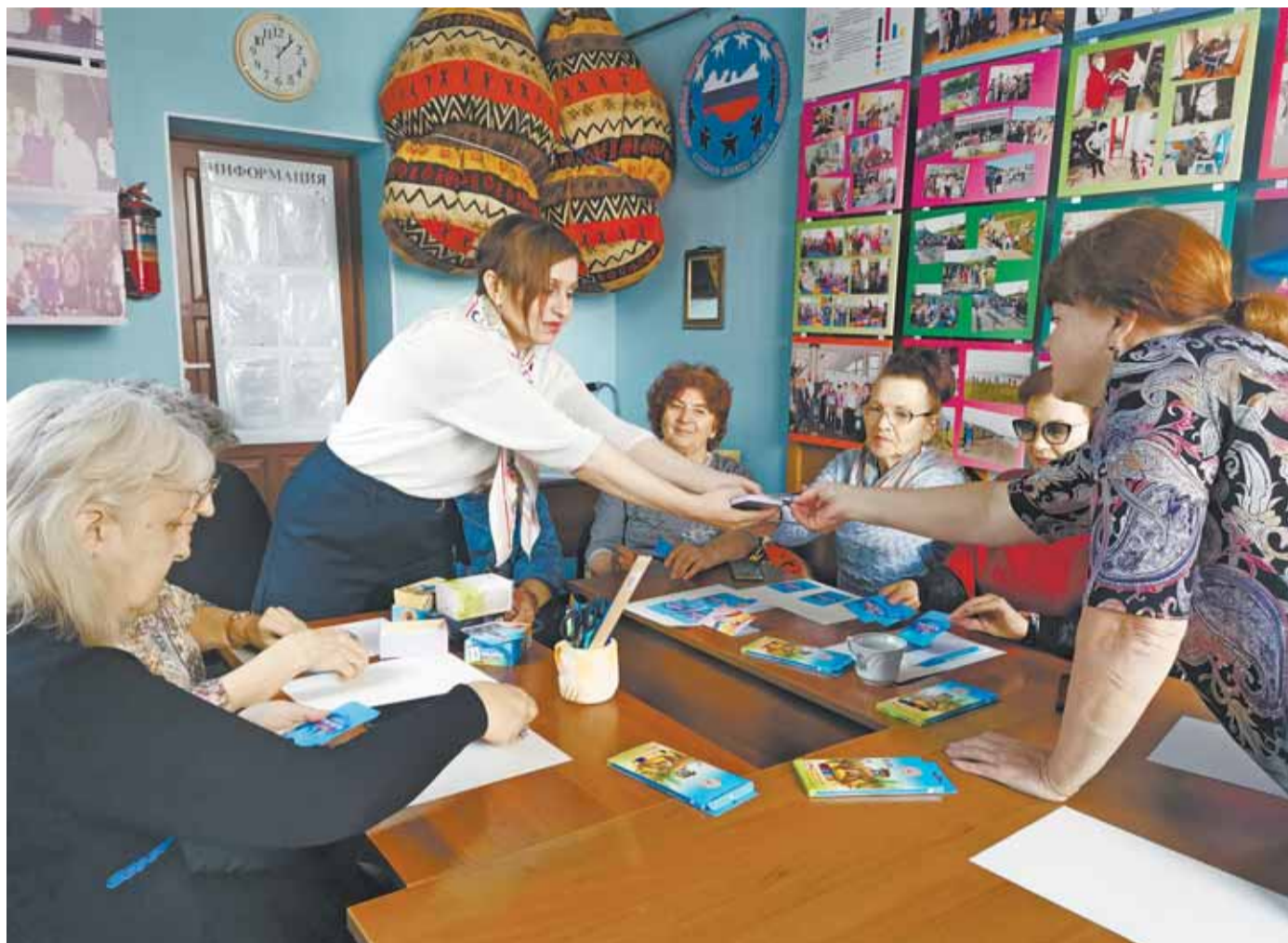
На одном из занятий участники клуба ознакомились с техникой для принятия решений.