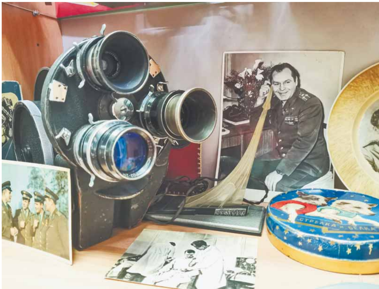
Космос и Алтайский край близки друг другу. Экспонаты музея «Мир времени».