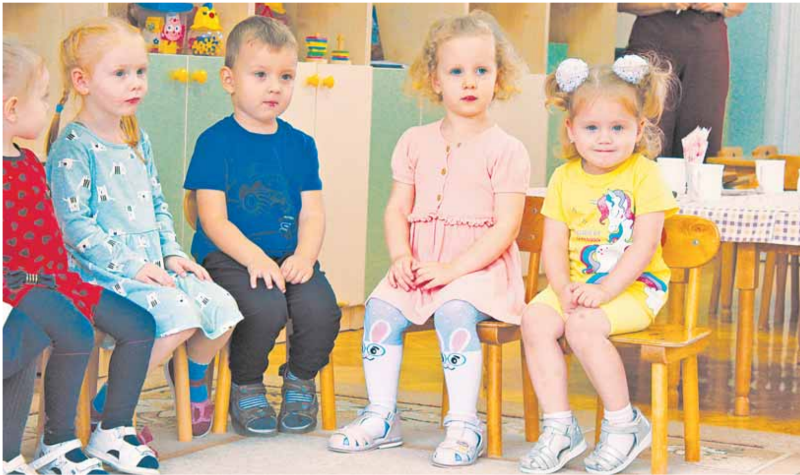
Участники комиссии удостоверились – для малышей детсада № 170 созданы прекрасные условия.

Пятница, 29 сентября 2023 г. № 144 (5817)