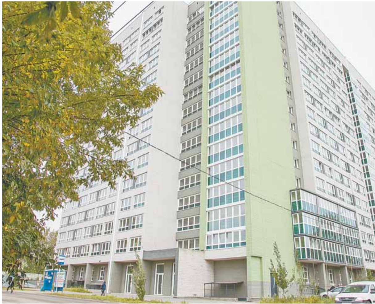
Завершения строительства дома ждут 300 семей будущих новоселов.