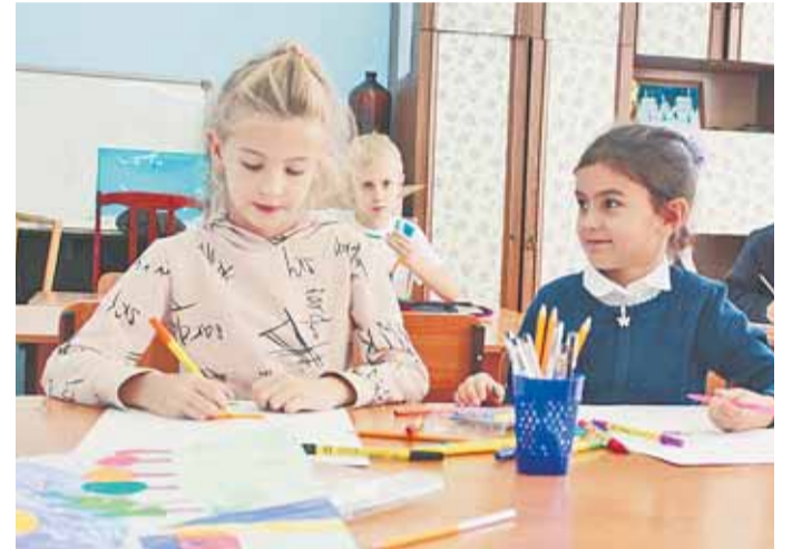
В БГДЮЦ успешно развивают различные творческие направления.