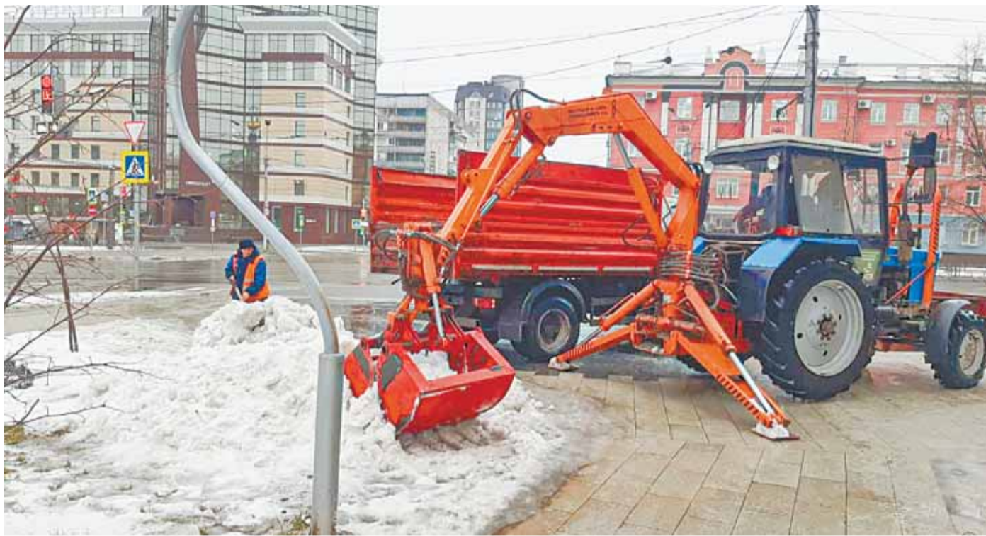
Работа по уборке городских дорог и улиц проводится техникой и вручную.