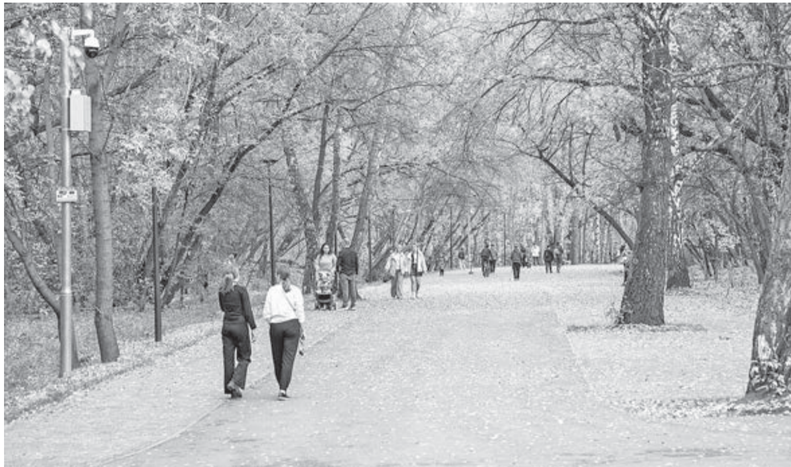
Парк «Юбилейный» – самый большой парк в Алтайском крае.