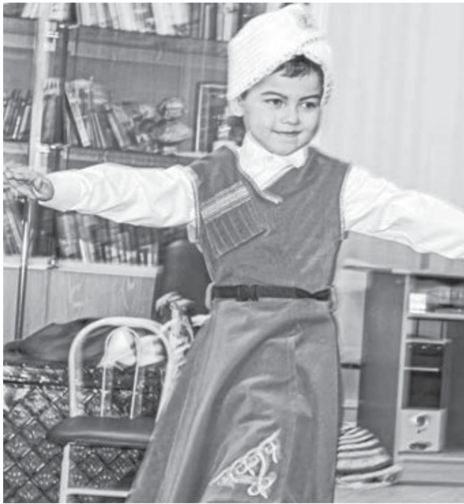
На протяжении недели в библиотеках города пройдут мероприятия в рамках литературной акции.

Мудрость веков В этом году открыть Неделю детской книги было решено в театрализованном формате. Юные читатели библиотек, а также воспитанники различных театралных объединений подготовили свои выступления, посвященные литературным традициям разных народов.