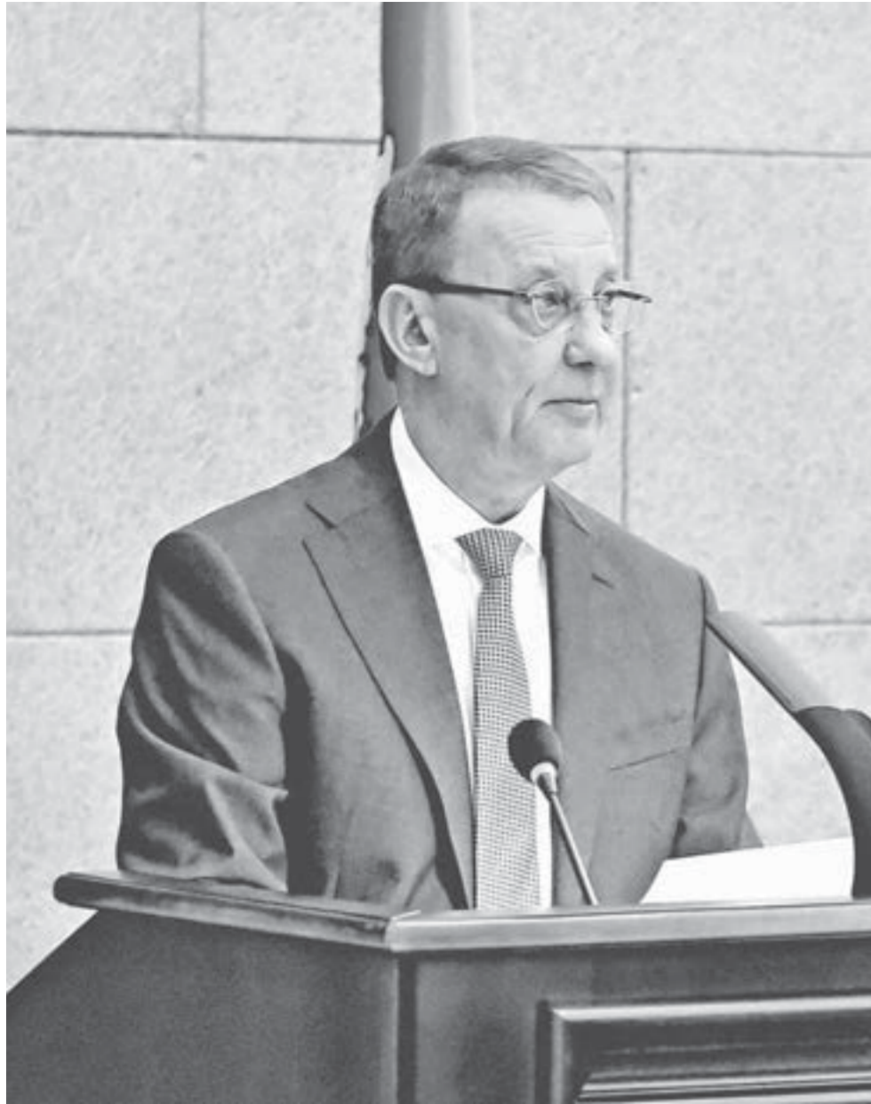
Глава города выступил перед депутатами БГД и общественностью.