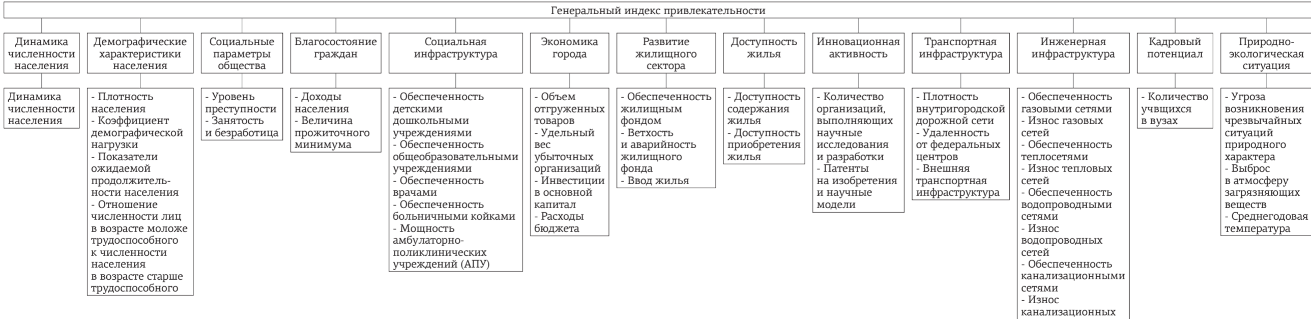
Рис.2. Структура показателей, на основе которых получен ГИПГ