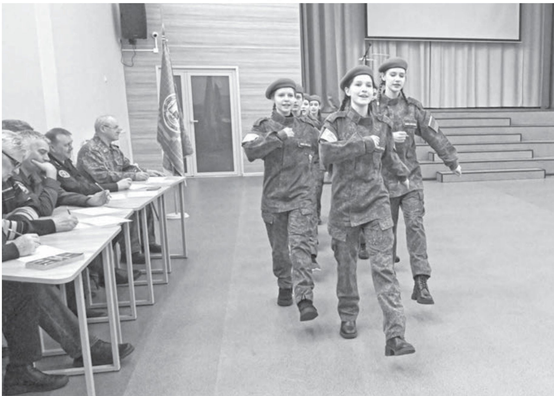
Участники смотра продемонстрировали навыки строевого шага.