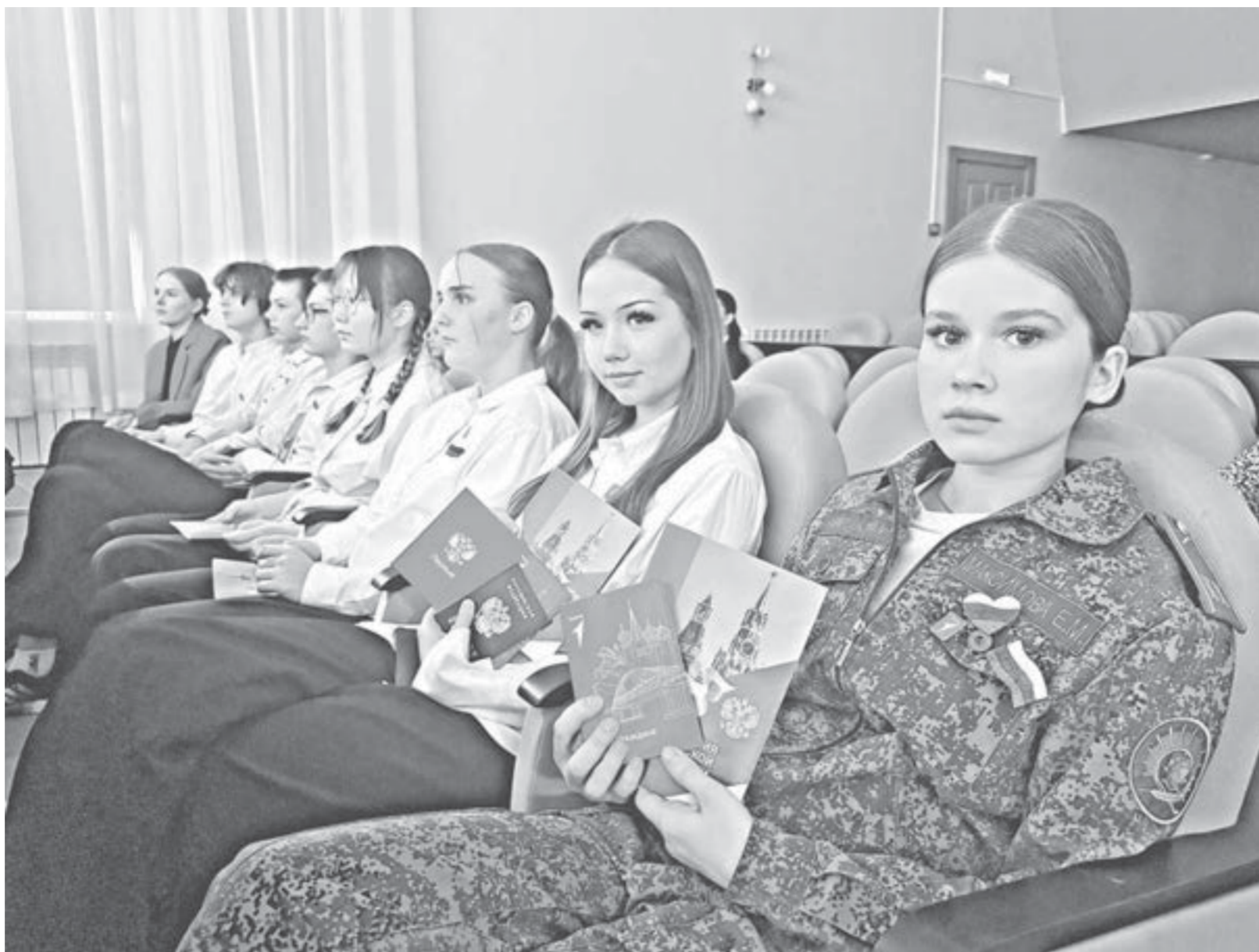
Школьники четко осознают, что с получением паспорта приходит большая ответственность.

– Паспорт – это не только права, но и обязанности. Вы – новое поколение граждан, от которого зависит процветание нашего города и государства.