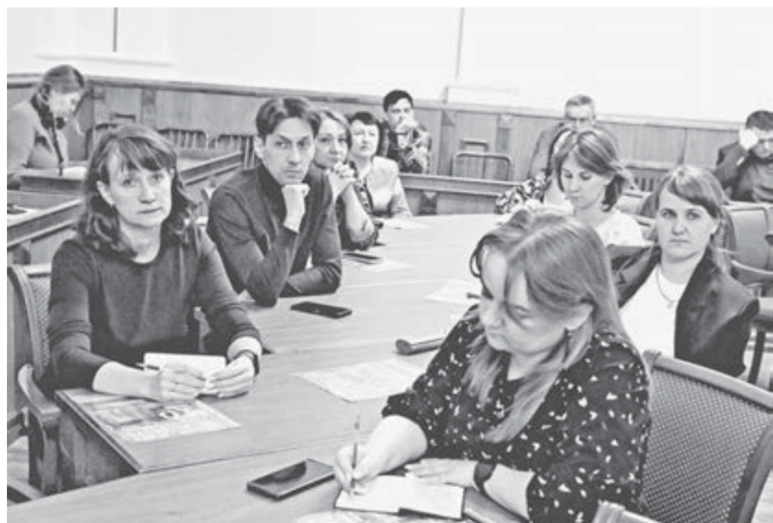
Представители учебных заведений получили ответы на интересующие их вопросы в части работы с иностранными студентами.