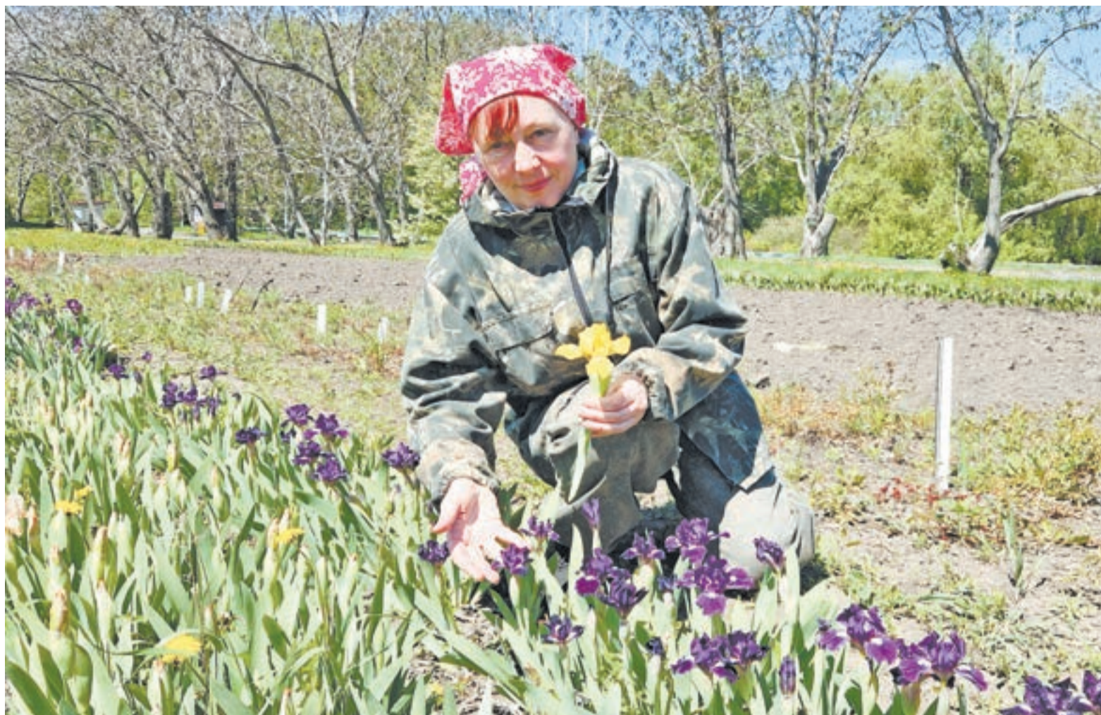
Карликовые ирисы зацветают первыми из собратьев.