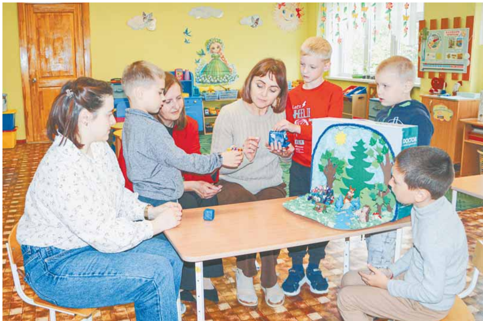
Работе детей и педагогов над проектом помогает нейросеть.