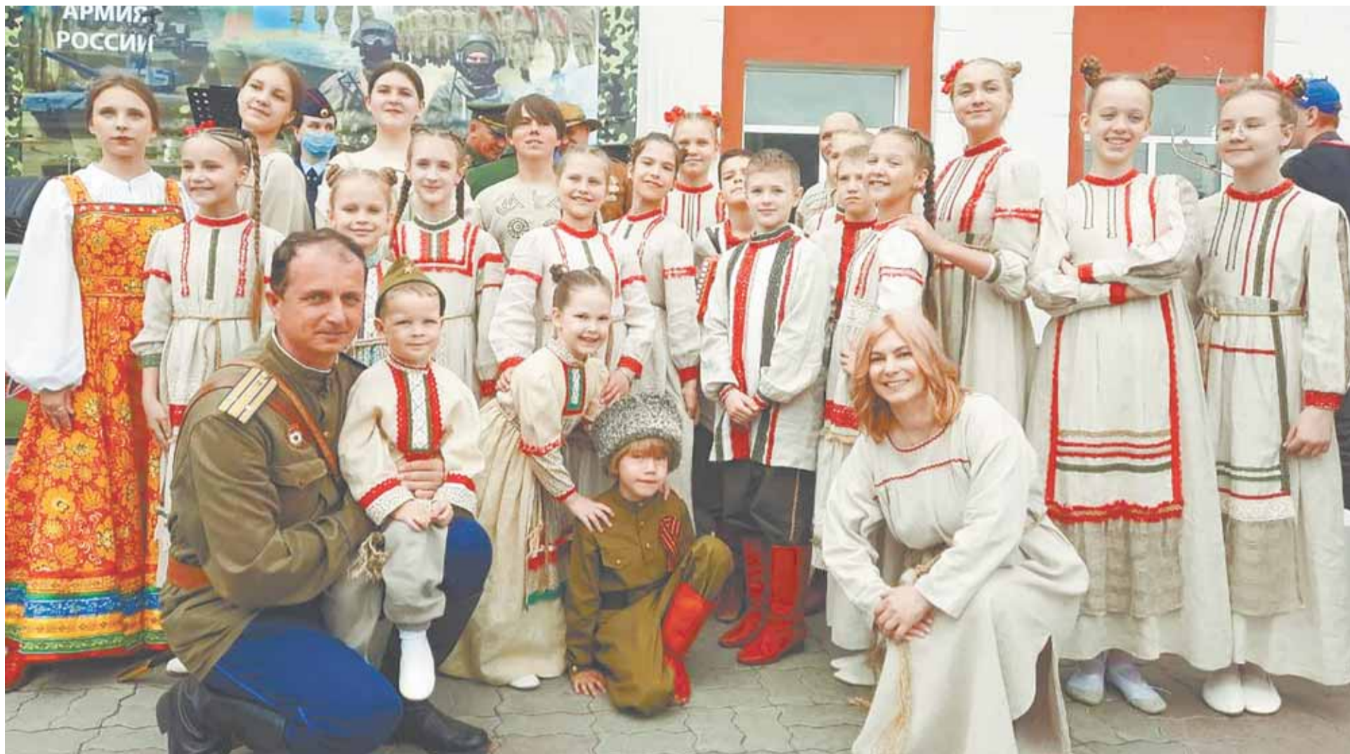
Многие воспитанники «Звонницы» стали профессиональными артистами.