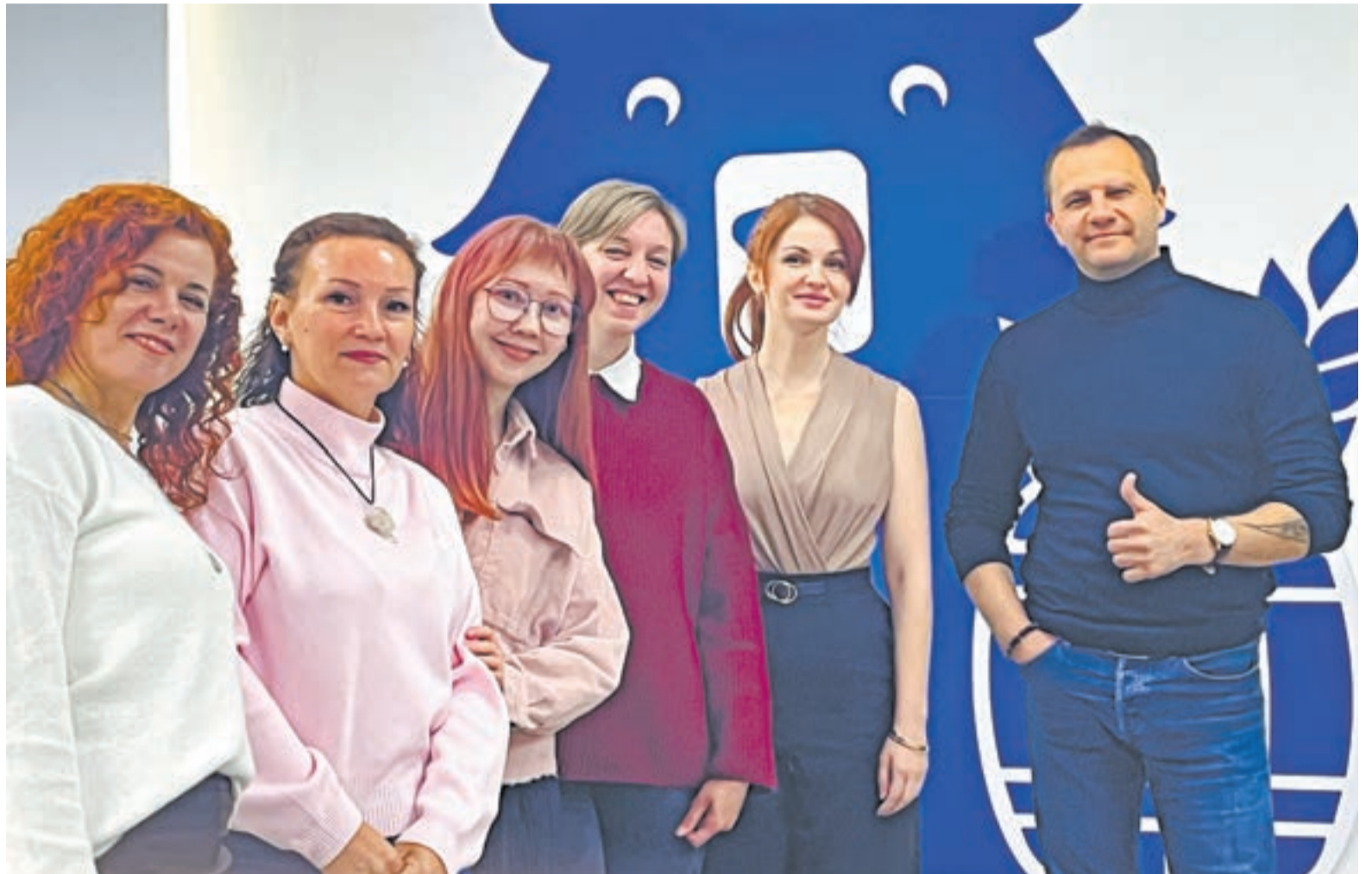
Специалисты помогут участницам проекта начать новую жизнь.

– Одно из ключевых направлений – помощь в оформлении заявки на получение социального контракта с дальнейшим развитием своего дела. Поэтому при отборе мы будем обращать внимание на то, чтобы женщина входила в категории, имеющие право