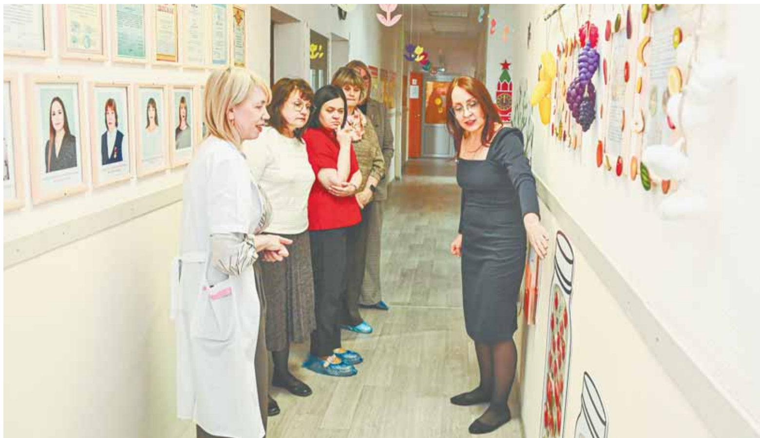
Комиссия по итогам проверки положительно оценила работу детского сада № 87.