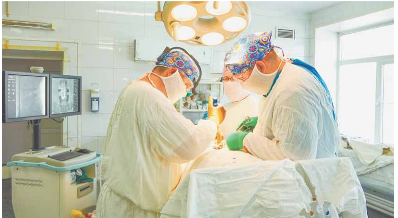
В операционных БСМП круглосуточно не затихает работа. Каждый третий пациент — после ДТП.

За четыре месяца 2026 года в БСМП поступило около 200 человек с травмами, полученными в дорожных авариях. Из них 28 — несовершеннолетние.