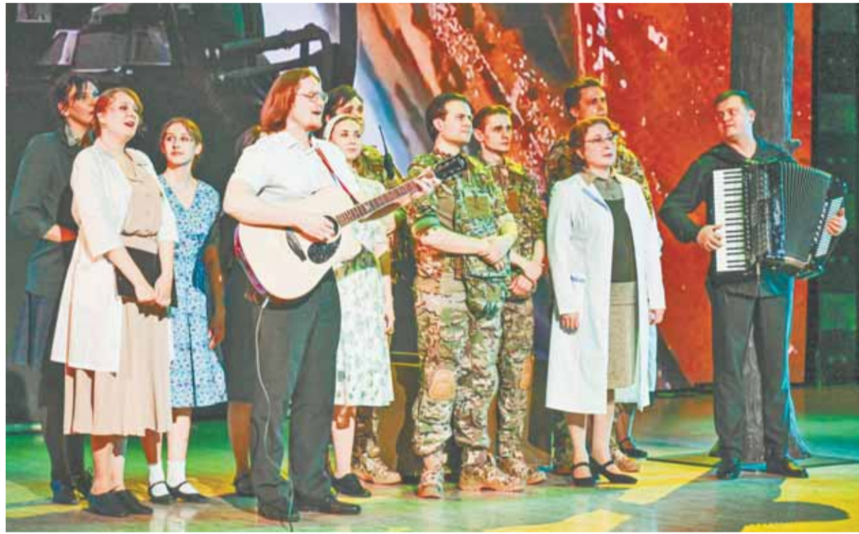
В концертной программе рассказали об истории становления госпиталя.