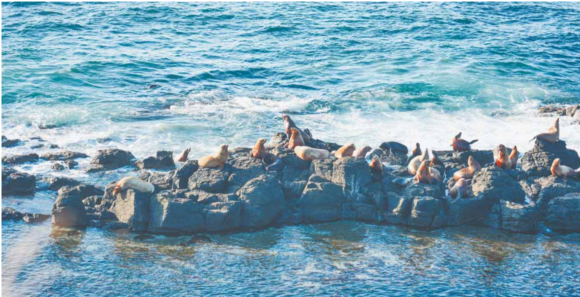
Разработка Семёна Апарина поможет в дальнейшем изучении сивучей на острове Монерон.