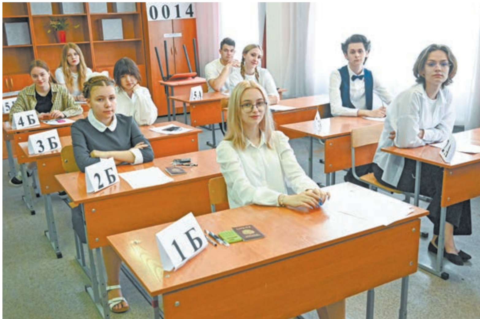
В период экзаменов ребенку необходима поддержка близких.

Первое, что нужно сделать родителям, – успокоиться самим. Находясь в тревоге, мамы и папы начинают напрямую транслировать свое состояние подростку. А ведь именно родитель – символ безопасности, поддержка и опора. Но если родитель сам в неконтролируемом состоянии волнения, все это очень негативно сказывается на ребенке.