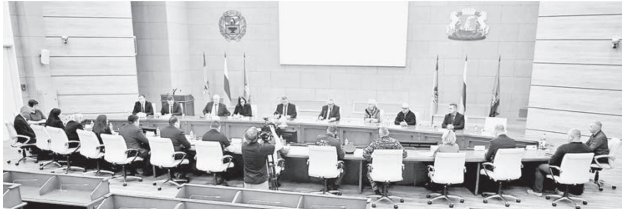
Вопросы летнего отдыха детей – на контроле администрации города.

Как Барнаул готовится к летней оздоровительной кампании 2026 года