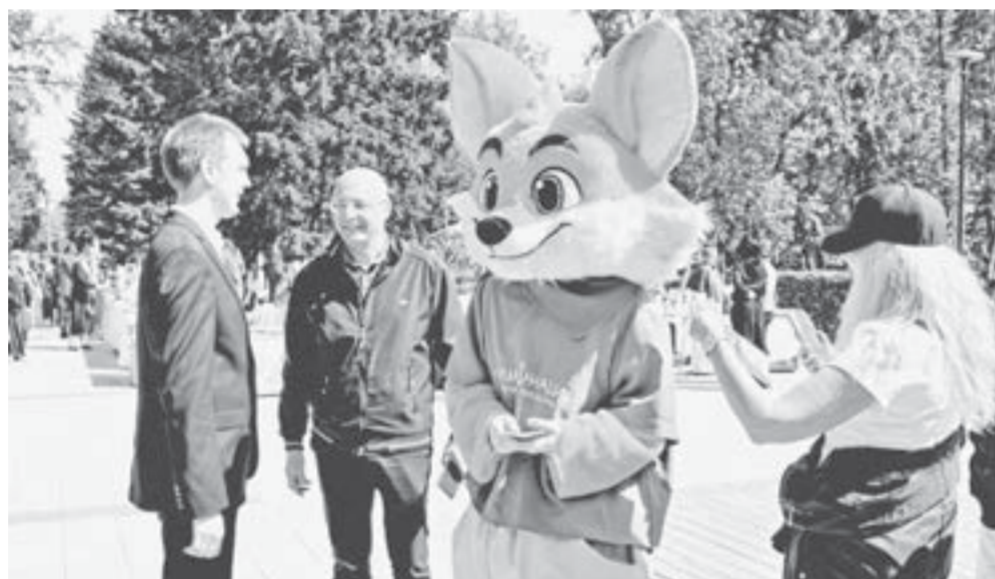
По традиции у горожан была возможность выбрать локацию по душе – начиная от погружения в народные обычаи и заканчивая космическими технологиями.