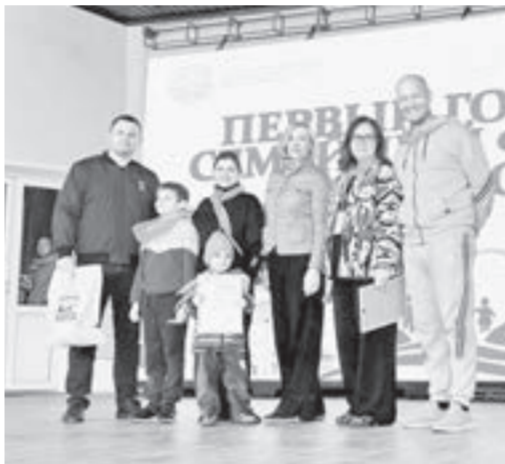
Дети и взрослые, объединенные в семейные команды, боролись за звание самой творческой, спортивной и дружной семьи.

к Родине. В этом смысле Барнаул является большой семьей, в которой проживает более ста национальностей. Семьи-участники сегодня выступают примером правильного отношения к здоровому питанию, активному отдыху, занятиям физической культурой. Все это представлено в программе фестиваля, проведение которого, надеемся, станет нашей городской традицией.