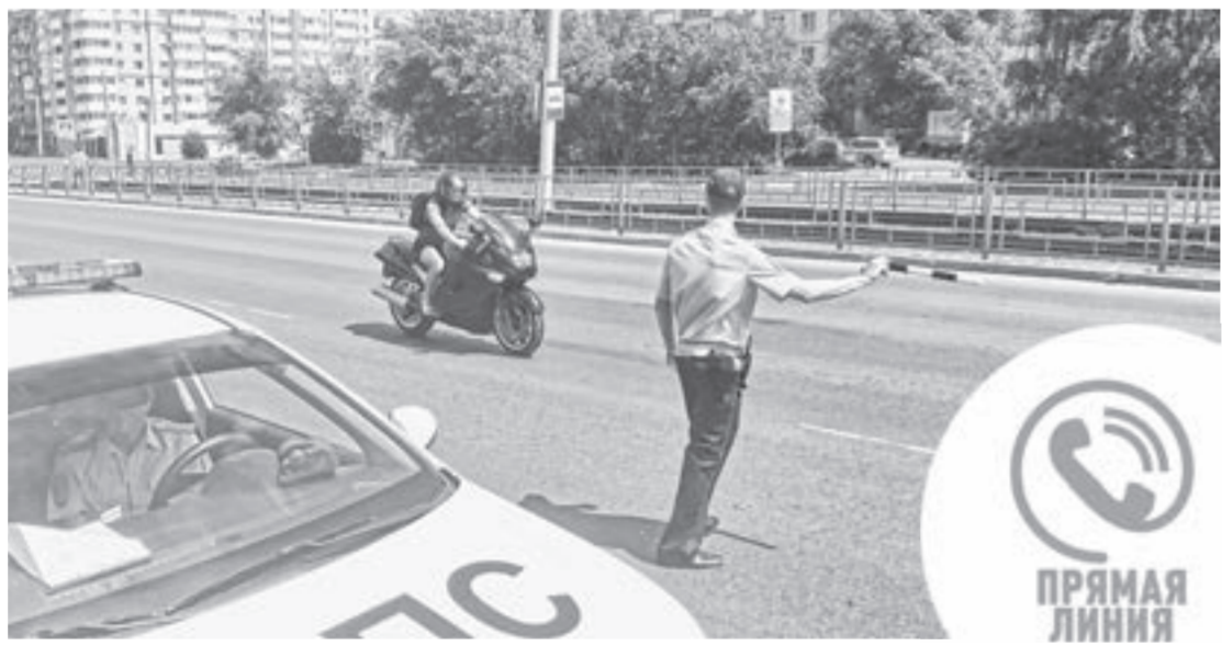
Летом под особым вниманием Госавтоинспекции – водители мототранспорта.