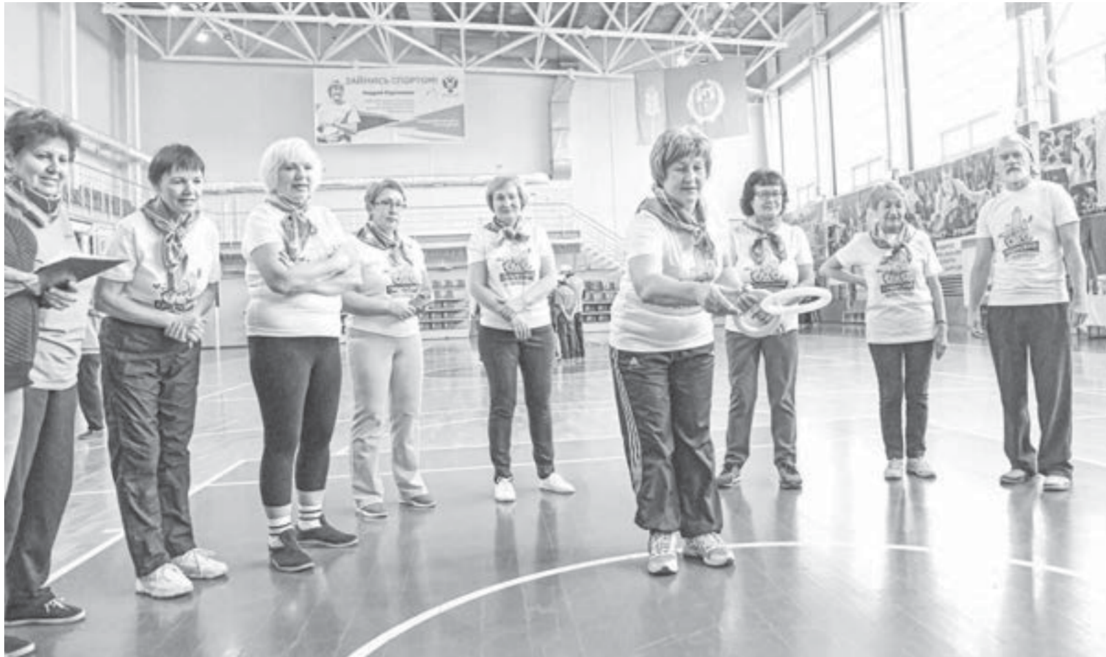
Активный образ жизни способствует долголетию.

Все начинается с диспансеризации. Во время посещения участкового терапевта возрастным пациентам предлагают заполнить специальную анкету, каждый из