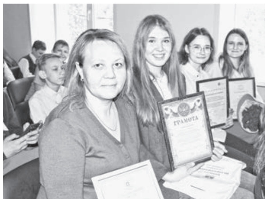
Радость побед с воспитанниками центра «Потенциал» разделили родители и педагоги.