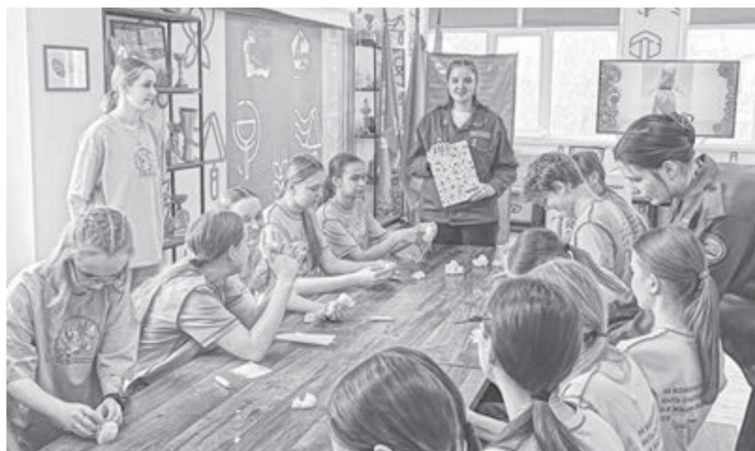
Мастер-классы, прошедшие в рамках конкурса, будут показаны детям в лагерях этим летом.

– Традиционно система наставничества между педагогическими отрядами и трудовыми отрядами подростков очень крепка. Ребята часто становятся участниками и зрителями мероприятий, где они могут познакомиться с другими отрядами, набраться опыта. А в этом году они еще и поменяются ролями: в третий день конкурса трудовые отряды подростков будут проводить свои