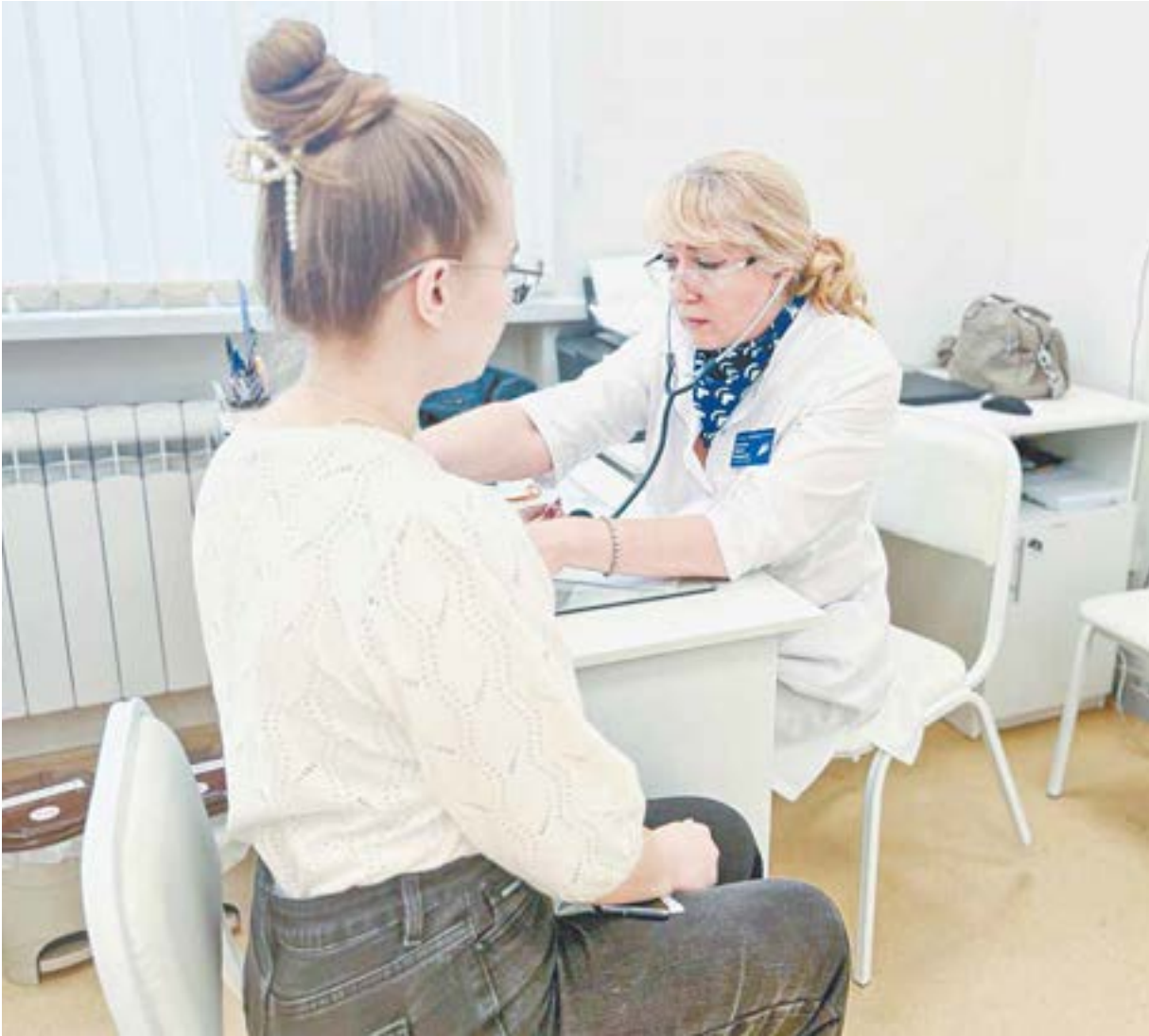
В структуре поликлиники № 14 работают четыре терапевтических и три педиатрических участка.

На первом этаже корпуса разместили кабинеты для забора крови и ультразвуковых исследований. На этой базе также организован прием узких специалистов. Уже приступил к работе эндокринолог, а с конца месяца начнет принимать первых пациентов невролог. Также в корпусе созданы необходимые условия для прохождения профилактических обследований: сюда пациенты могут обратиться