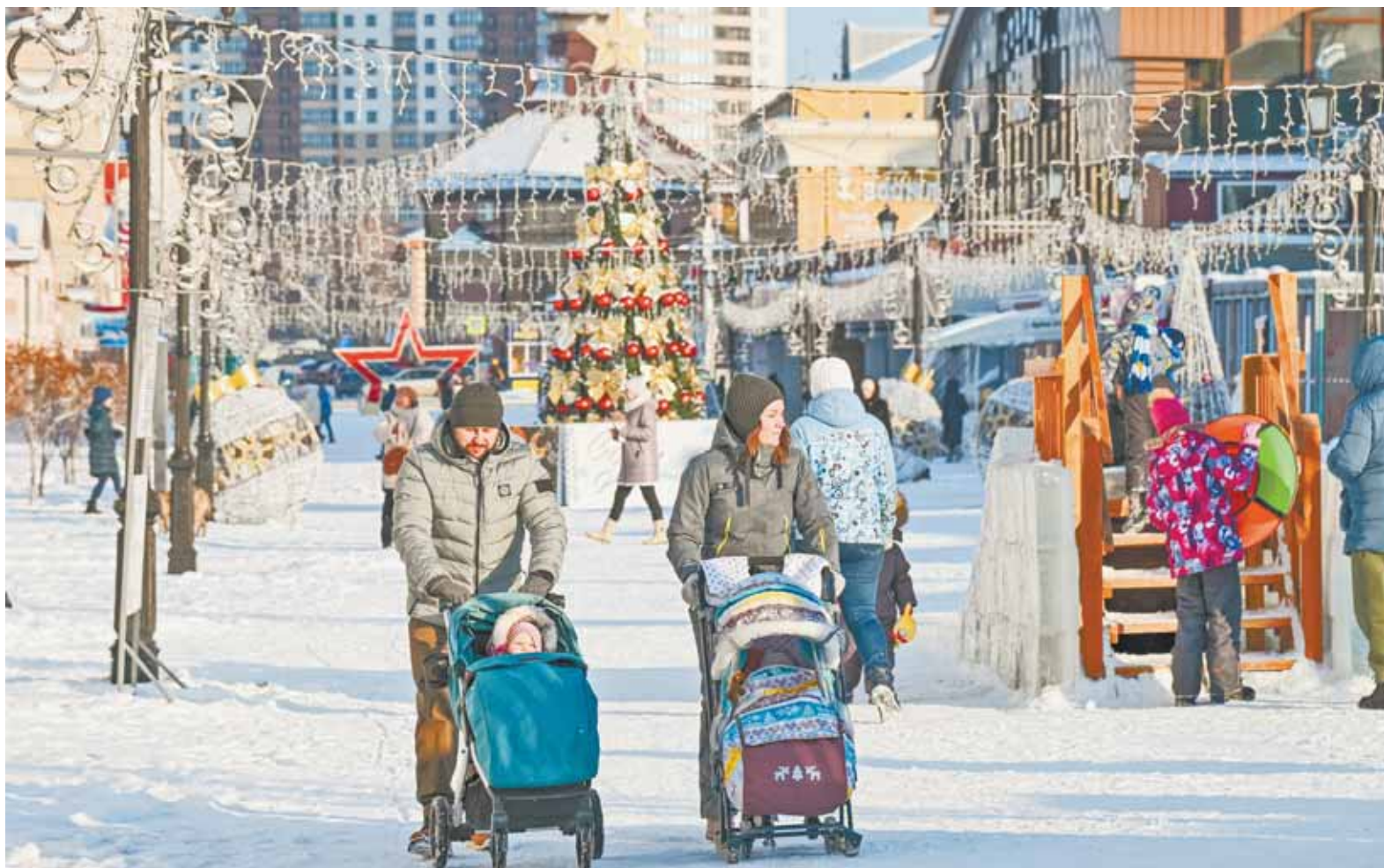
Большая часть законодательных нововведений касается семей с детьми.

С 1 февраля изменится сумма материнского капитала, его проиндексируют по уровню фактической инфляции. Региональный маткапитал в Алтайском крае в этом году вырос на 9% и составит 95,5 тыс. руб. Размер денежной выплаты из