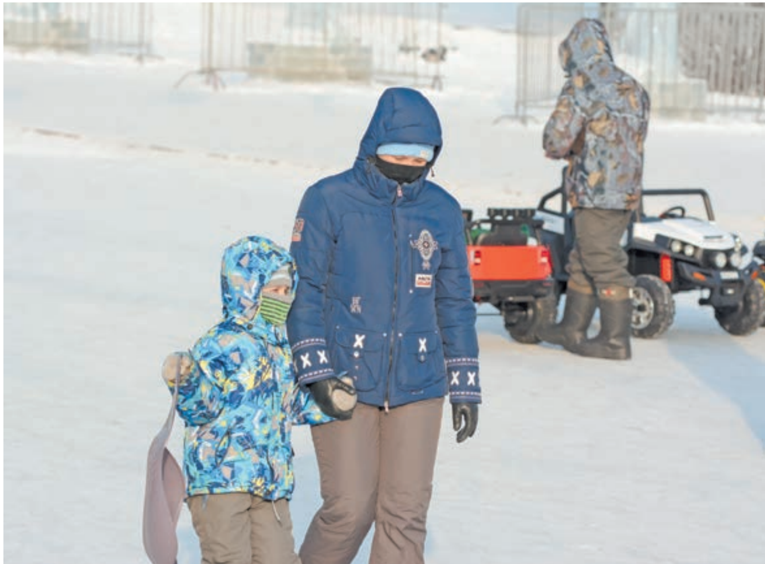
В мороз лучше отправляться на улицу на сытый желудок и в теплой одежде.

– В комфортной зимней обуви не будет нарушаться кровообращение сосудов в пальцах и стопах, а также сохранится внутренняя цирку-