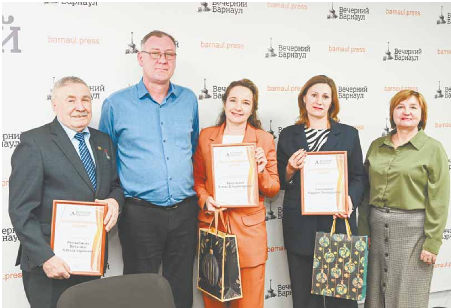
Материалы и комментарии внештатных авторов помогают делать выпуски «Вечёрки» интереснее.

Порядка 30 интересных тем для обсуждения и комментариев по разным актуальным вопросам, а также 20 замечательных фотографий подготовили в ушедшем году внештатные авторы «Вечёрки».