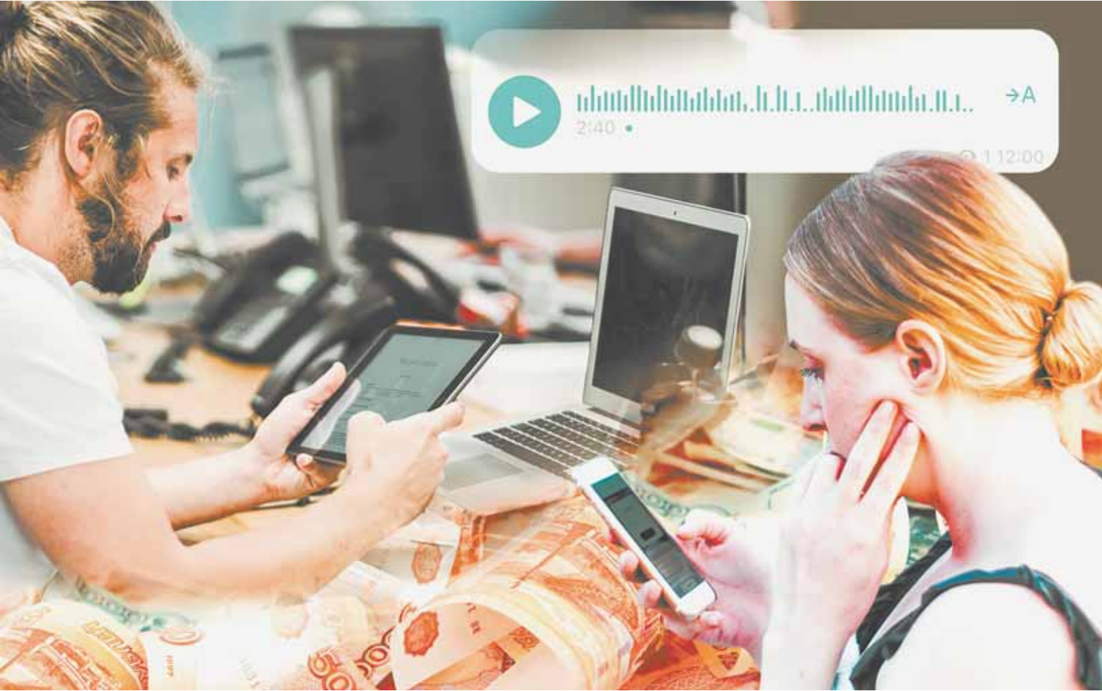
Коллаж Александра ЕРМОЛОВИЧА

Таким образом, от удаленных действий злоумышленников в декабре прошлого года пострадала жительница края. Ей в сообщении пришла ссылка с надписью «привет,