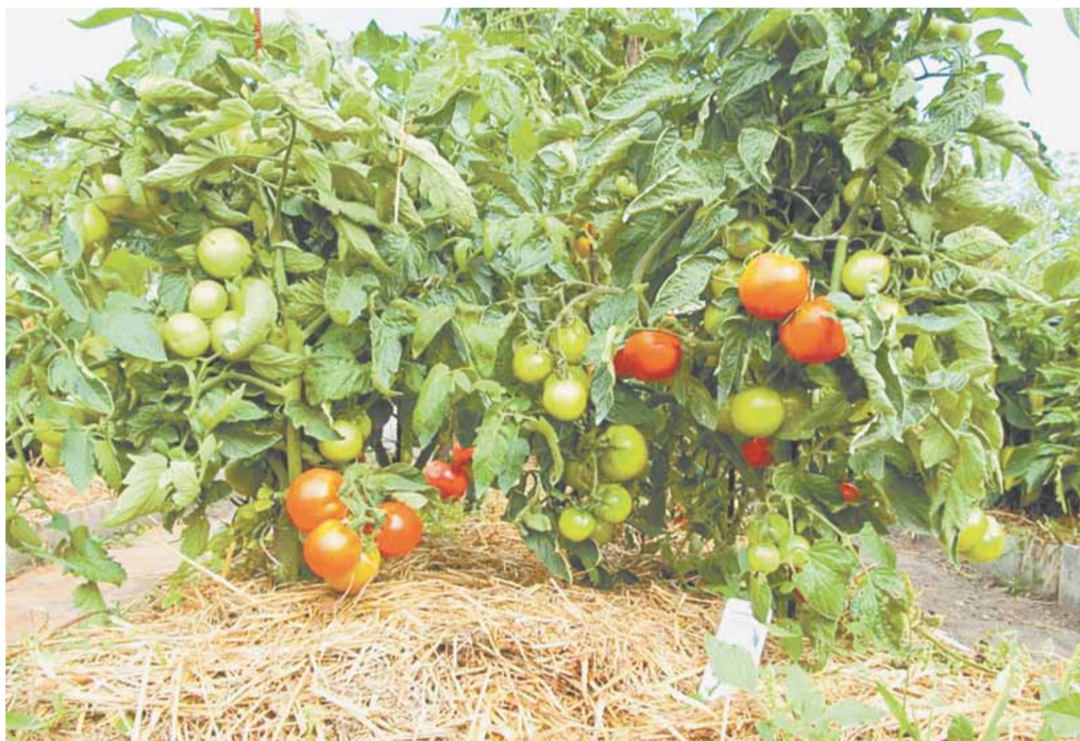
В ответ на правильный уход томаты порадуют большим урожаем.

Меры борьбы со всеми вышеперечисленными инфекциями – подбор устойчивых сортов и гибридов, чередование культур, уничтожение послеуборочных остатков и дезинфекция семян. Эффективно помогает