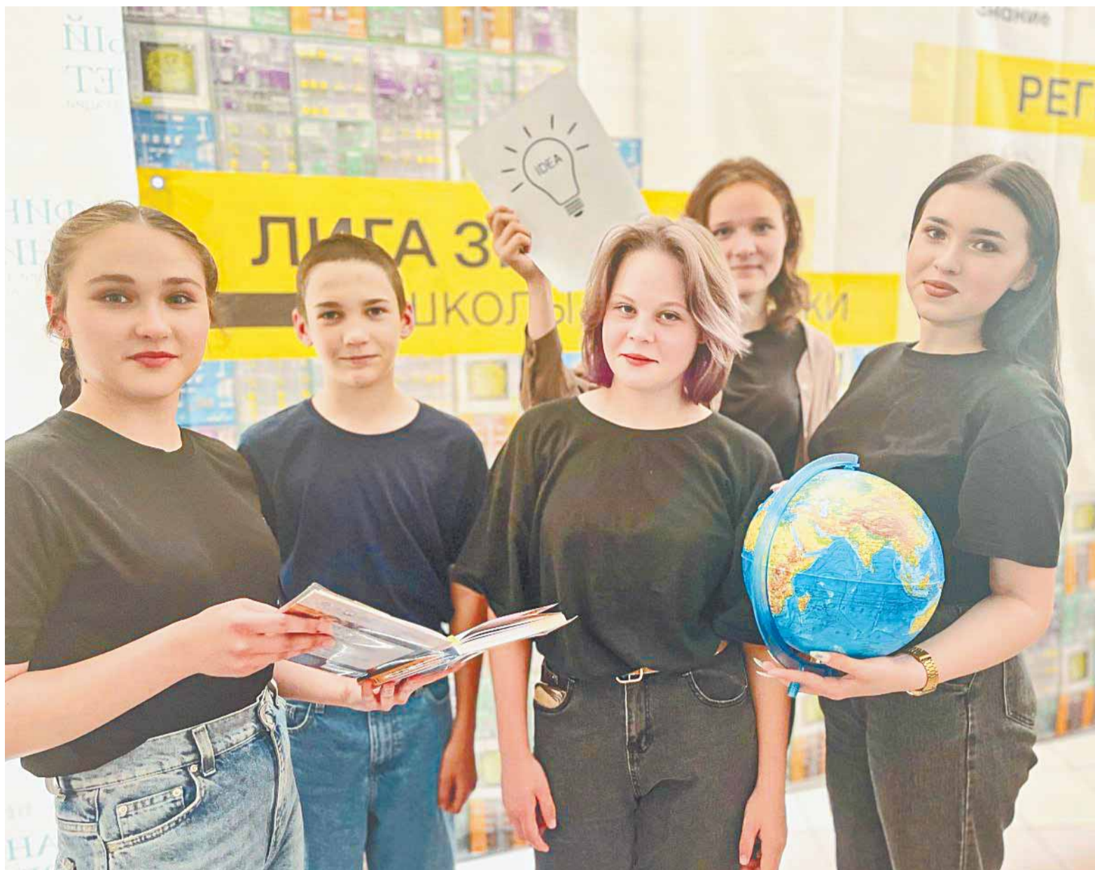
Много проектов общества «Знание» нацелено на школьников и студентов.