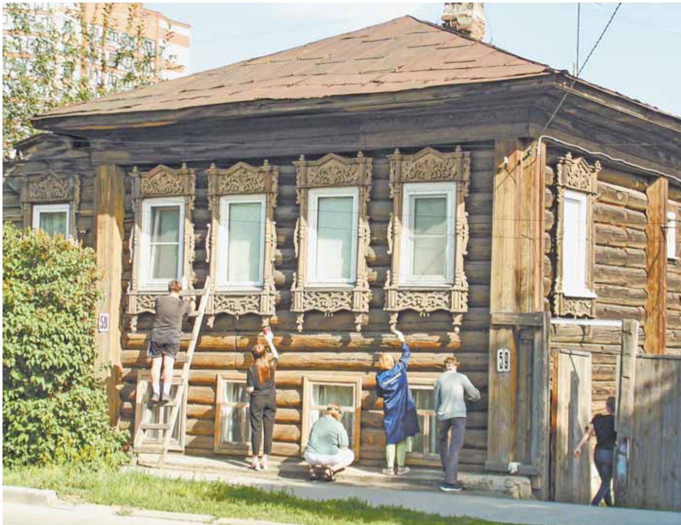
Волонтеры очень бережно очищают грязь с наличников окон, и когда установят строительные леса, работа пойдет намного быстрее.