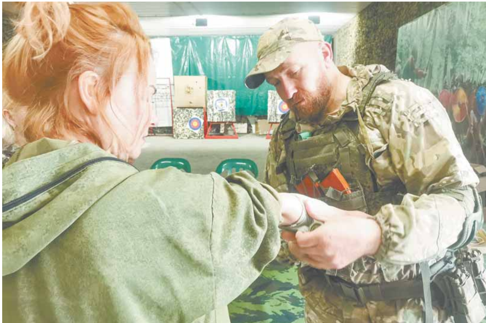
Инструкторы показали разные виды наложения повязок и жгутов.