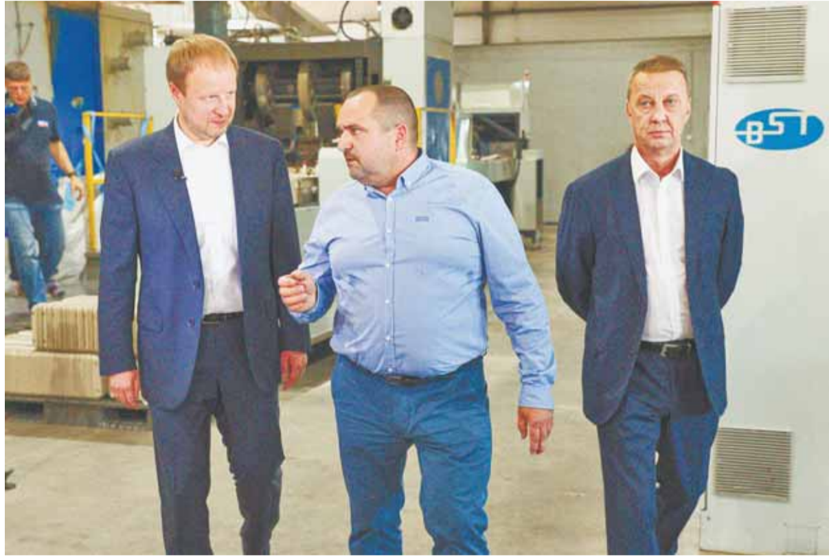
Активно развивающимся предприятиям оказывается поддержка со стороны властей.

Губернатор отметил важность того, что компания проявляет себя как социально ответственное предприятие, которое занимается сохранением экологии и заботится о воспитании подрастающего поколения. Сегодня это одно из самых экологичных предприятий перерабатывающей