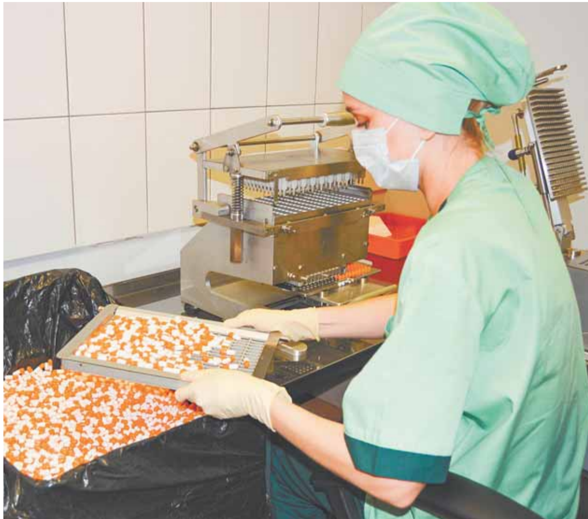
Весомую часть рынка БАД в России занимают алтайские производители.

По данным мониторинга Алтайпищепрома, на территории края 50 организаций являются держателями свидетельств о государственной регистрации БАД на более 1000 наименований продукции.