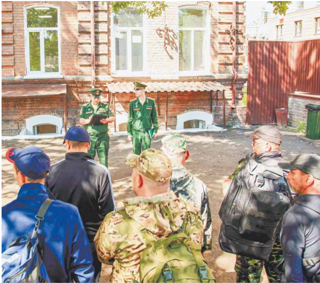
Инструктаж контрактников перед отправкой в воинские части.

Очень нужны сегодня токари, сварщики и обладатели других технических специальностей. Их мы назначаем на сходные воинские должности в подразделения, которые занимаются ремонтом, восста-