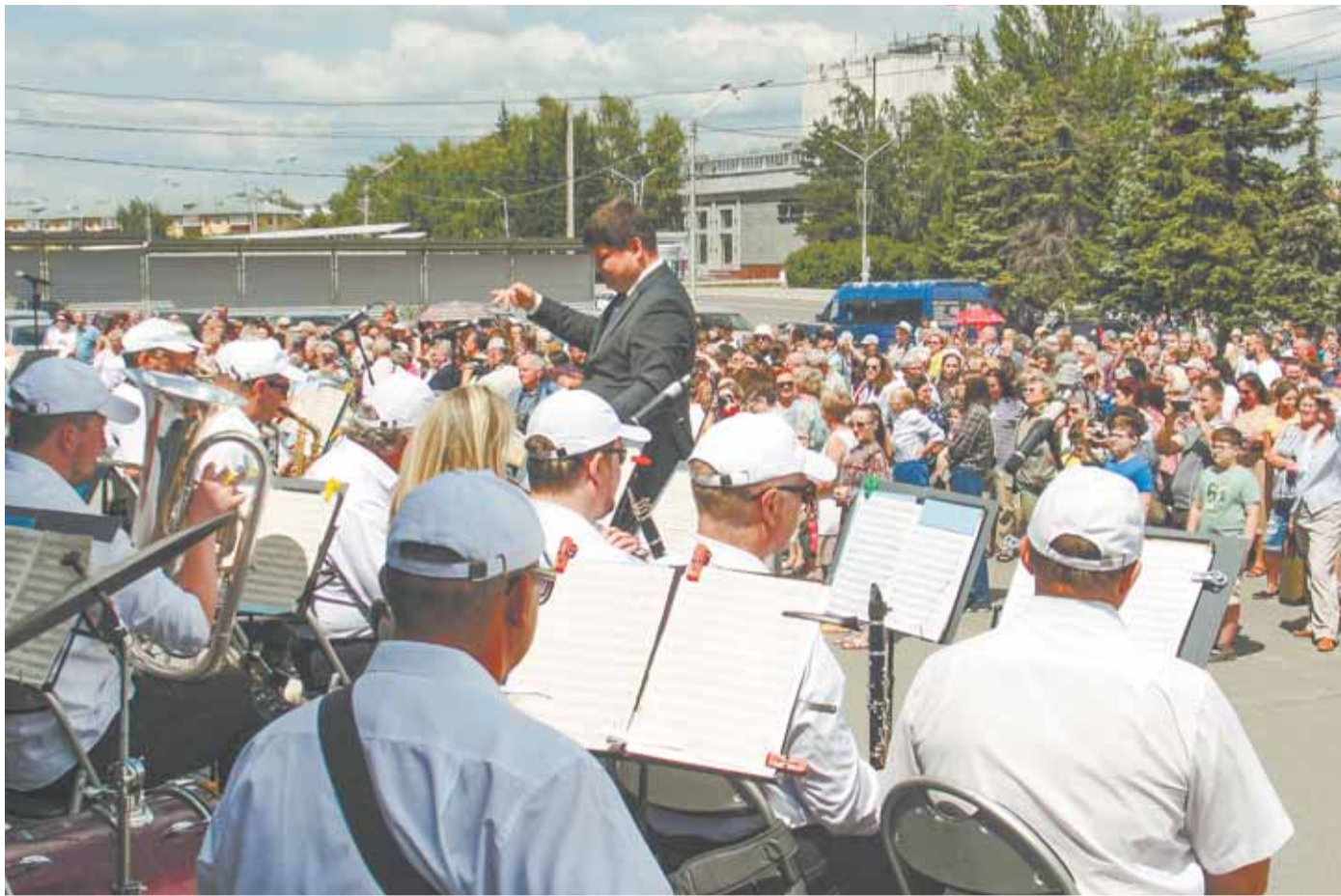
Открытие выставки, начавшееся с выступления оркестра, вызвало большой интерес у горожан.