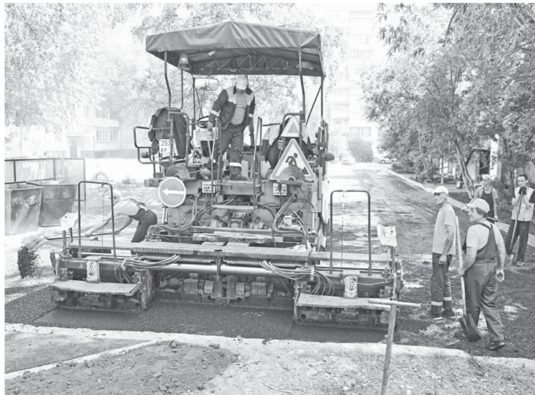
В 2021 году на ремонт 65 дворов Барнаула направлено 148 млн руб., из них 8 млн руб. – софинансирование жителей.