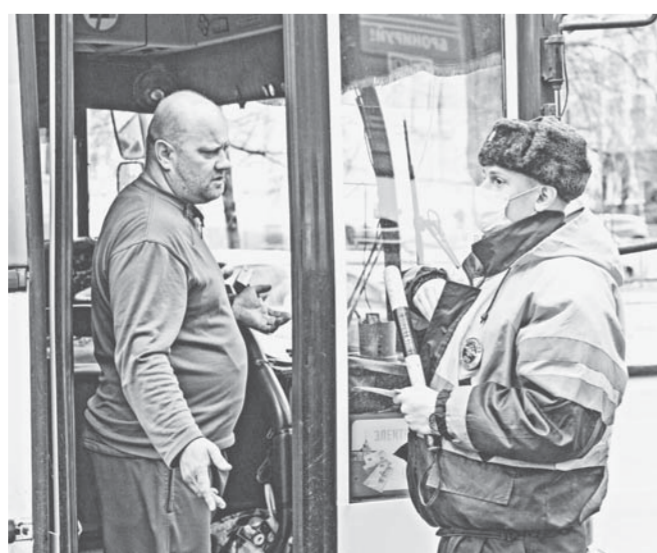
Спорить бессмысленно – маски обязательны.

Уровень воды в Оби в районе г. Барнаула на 10 см ниже уровня водомерного поста, температура воды плюс 2 градуса.