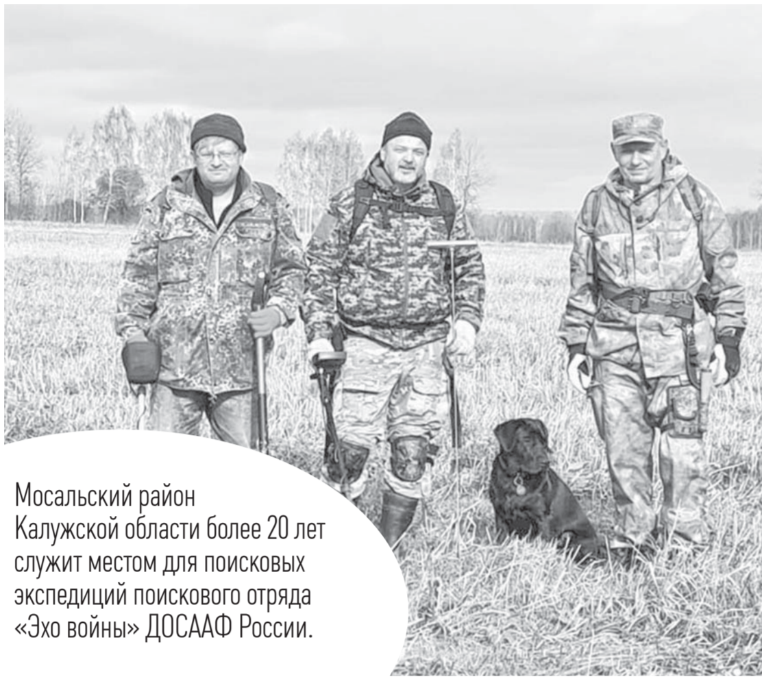
Мосальский район Калужской области более 20 лет служит местом для поисковых экспедиций поискового отряда «Эхо войны» ДОСААФ России.