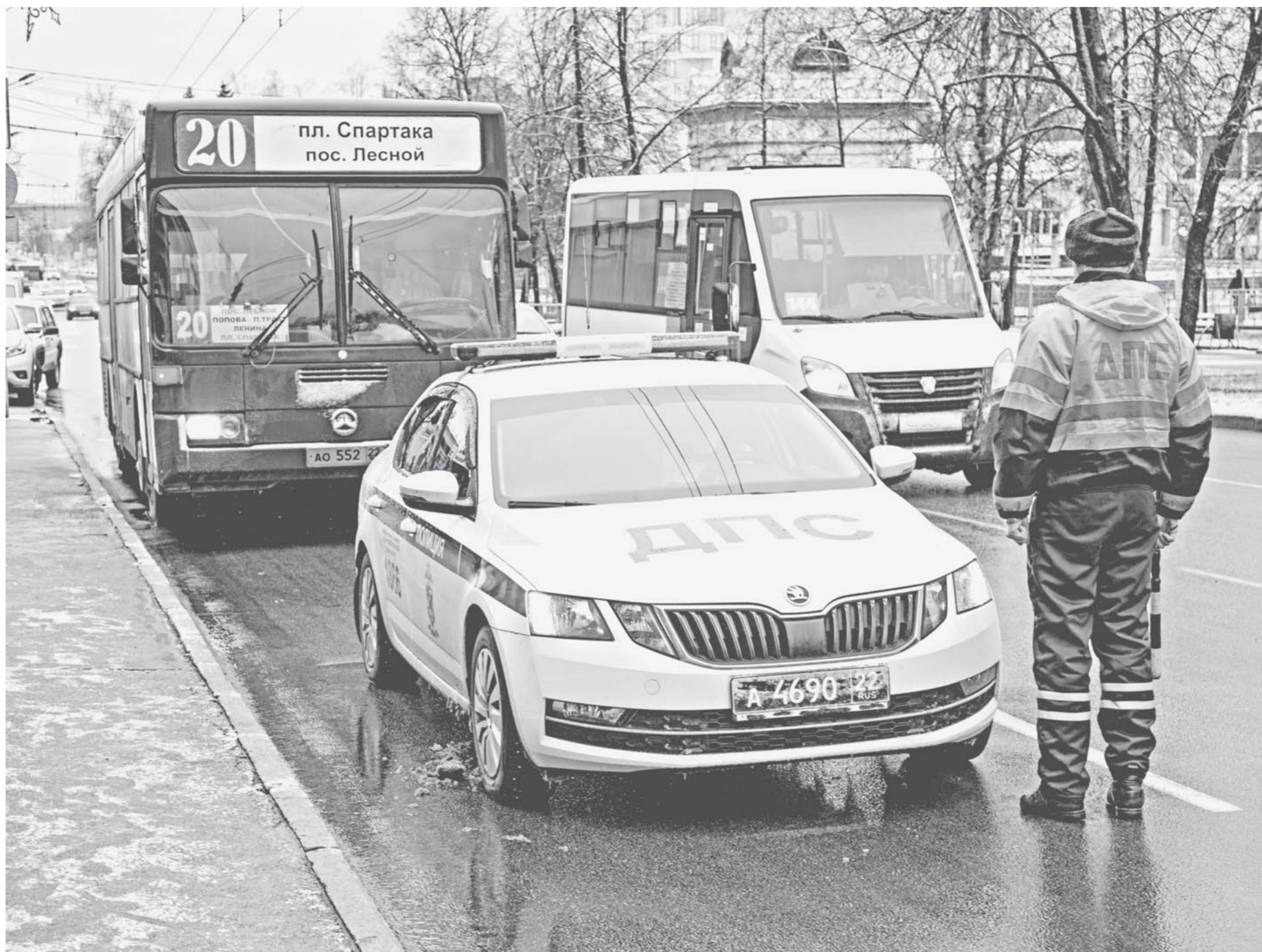
Автобусы останавливали у ТЦ «Невский» и составляли протоколы на водителей без масок.