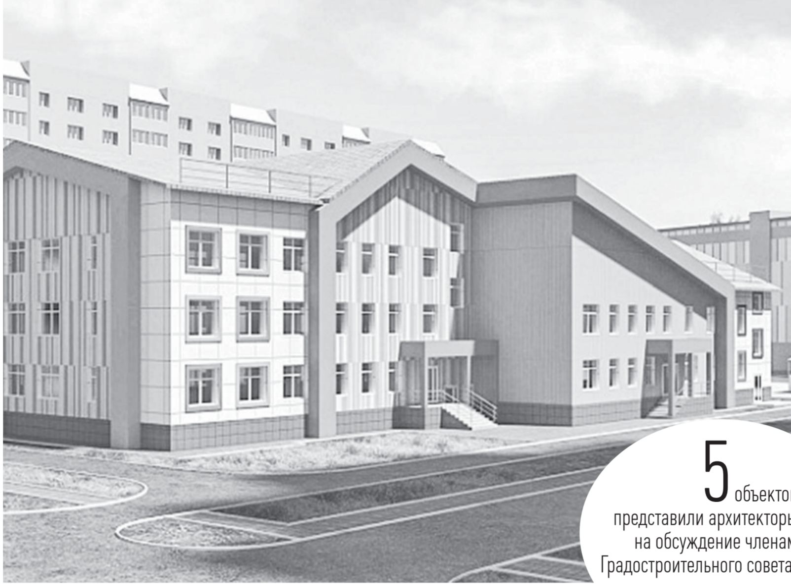
Особенностью детского сада в квартале 2037 станет трансформируемая модель. Эскиз дошкольного учреждения одобрен Градостроительным советом.

По нашему мнению, в существующем виде это не то здание, которое должно быть на пересечении улиц Попова и Власихинской. Оно низкое,