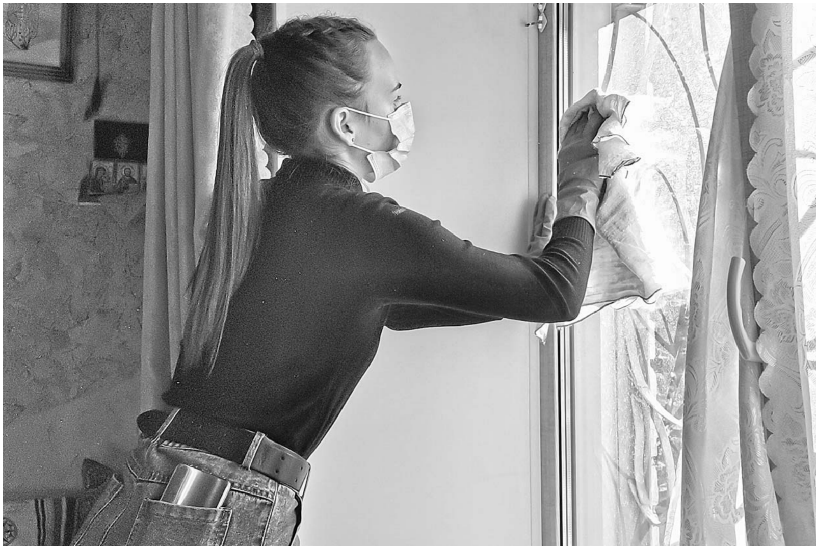
Барнаульские волонтеры регулярно помогают по дому пенсионерам, однако этим может заниматься практически любой трудоспособный человек и получать за работу выплату.

Это не просто волонтерство, а оплачиваемый труд. Уход за пожилым человеком старше 80 лет оплачивается ежемесячной