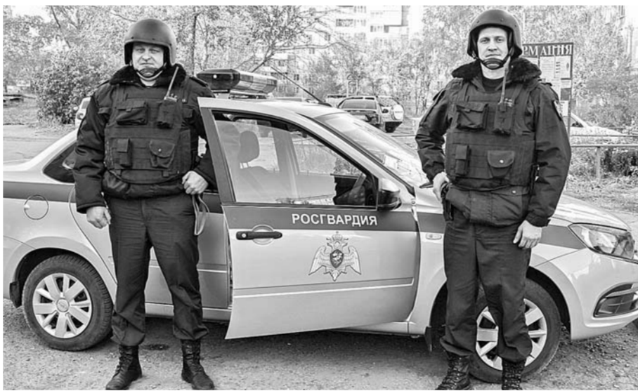
Вневедомственная охрана прибывает на срочку сигнализации в считанные минуты.

У нас в любом договоре на охрану квартиры имеется перечень ответственных квартиросъемщиков, которые имеют ключи и доступ в помещение. И есть перечень доверенных лиц, которые в случае отсутствия собственника имеют право сдавать эту квартиру под охрану и снимать с нее. Мы можем специально для них прописать код снятия и сдачи под охрану, если хозяева этого захотят. То есть до отъезда вы нас предупреждаете, что в список надо внести соседа. Тогда приедет наш электромонтер, мы пропишем для