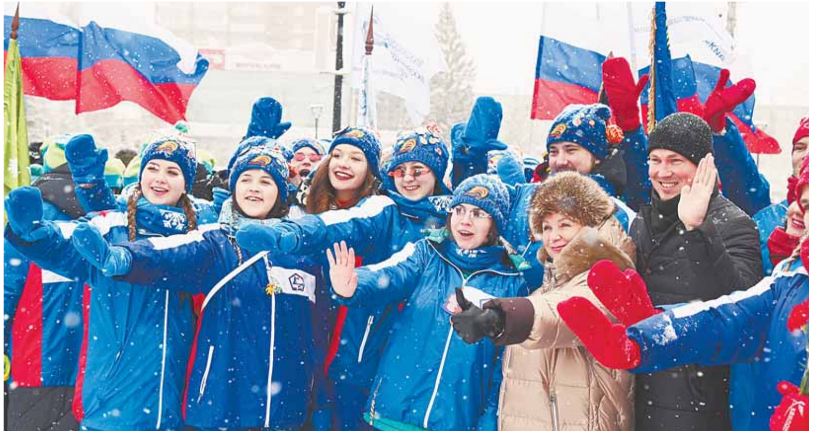
В открытии приняли участие ректоры вузов региона, председатели университетских профкомов, бойцы и ветераны движения студотрядов.

– В этом году добавили в программу обучения и мастер-классов патриотическую игру, которую будем проводить среди учащихся пятых-восьмых классов, для старших классов доба-