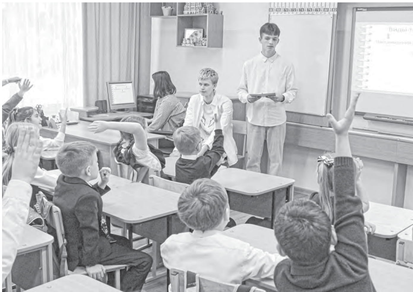
Одна из форм привлечения молодых кадров в школы – проведение профессиональных проб.