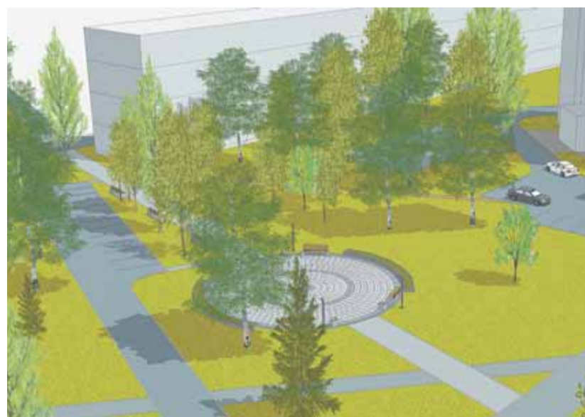
Среди проектов – стадион, сквер, уличное освещение, дороги.