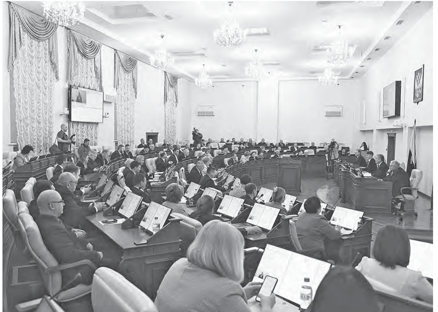
Депутаты поддержали увеличение размера сельхозугодий для одного собственника в 2,5 раза.

Депутаты АКЗС обсудили вопросы о земле и региональном маткапитале