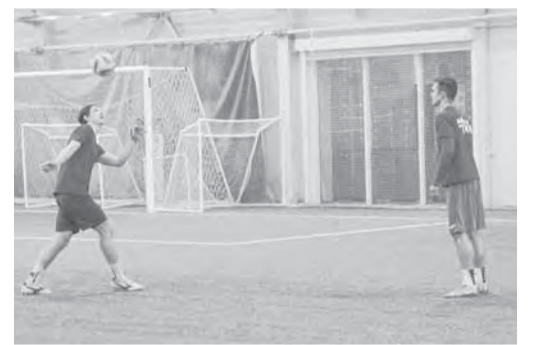
Футболисты «Динамо» готовятся к сезону в приподнятом настроении.