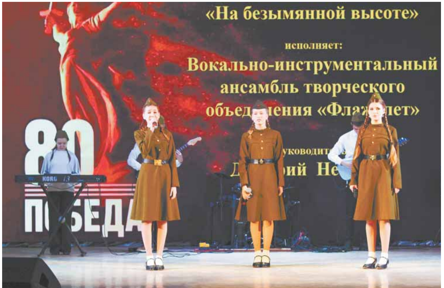
Впервые за долгое время Гран-при взял вокально-инструментальный ансамбль.