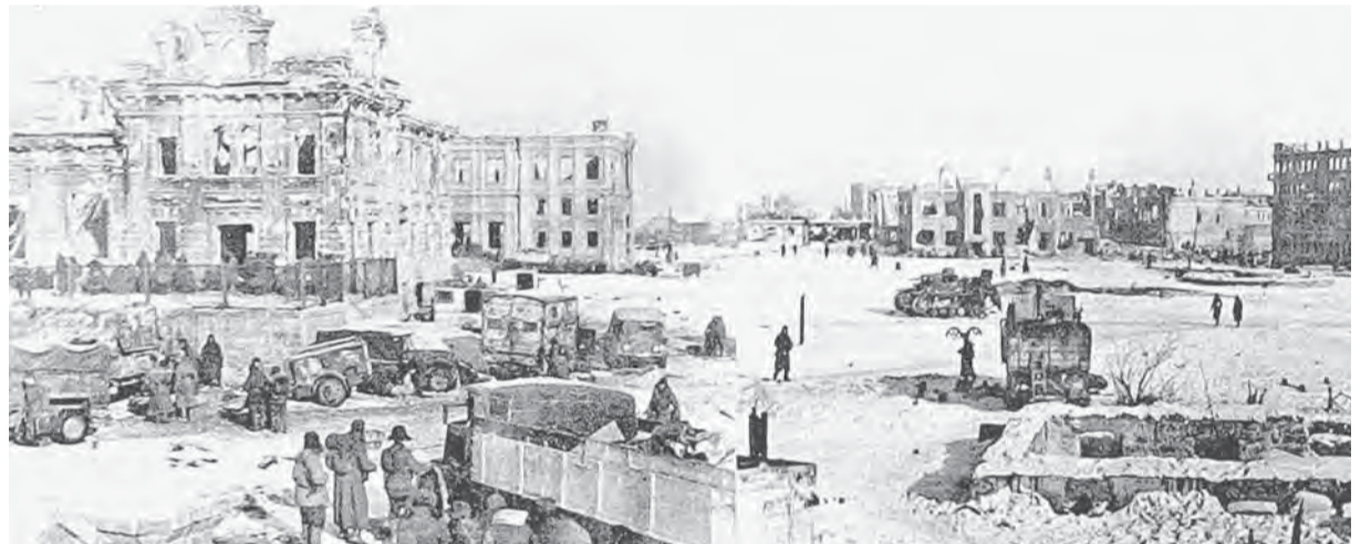
В боях за железнодорожный вокзал «Сталинград-1» героическое сопротивление фашистам оказывала и 42-я отдельная стрелковая бригада, потерявшая здесь почти весь личный состав, но сохранившая шефское знамя Барнаульского городского комитета ВКП (б) и Совета депутатов трудящихся (на фото сверху). Битва с врагом шла за каждую улицу, каждый дом (на фото внизу).

Местом самых ожесточенных боев в Сталинграде стал Мамаев курган. Он имел важное стратегическое значение – с его вершины хорошо просматривались и простреливались прилегающая тер-