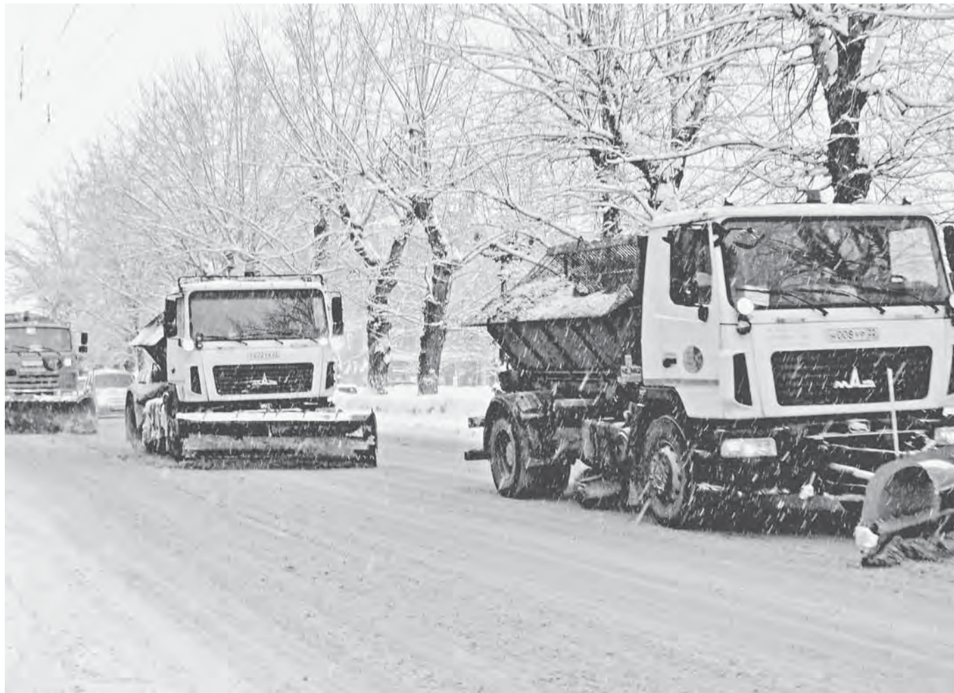
Дорожная служба очищает от снега как центральные магистрали, так и улицы частного сектора.