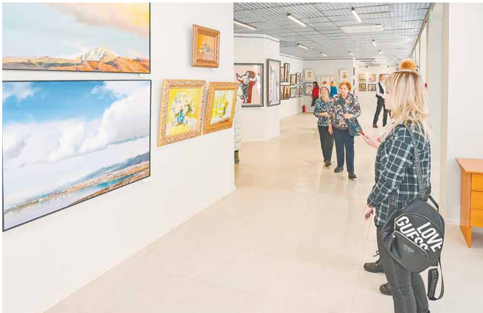
Обновленный зал позволяет проводить выставки на более качественном уровне.