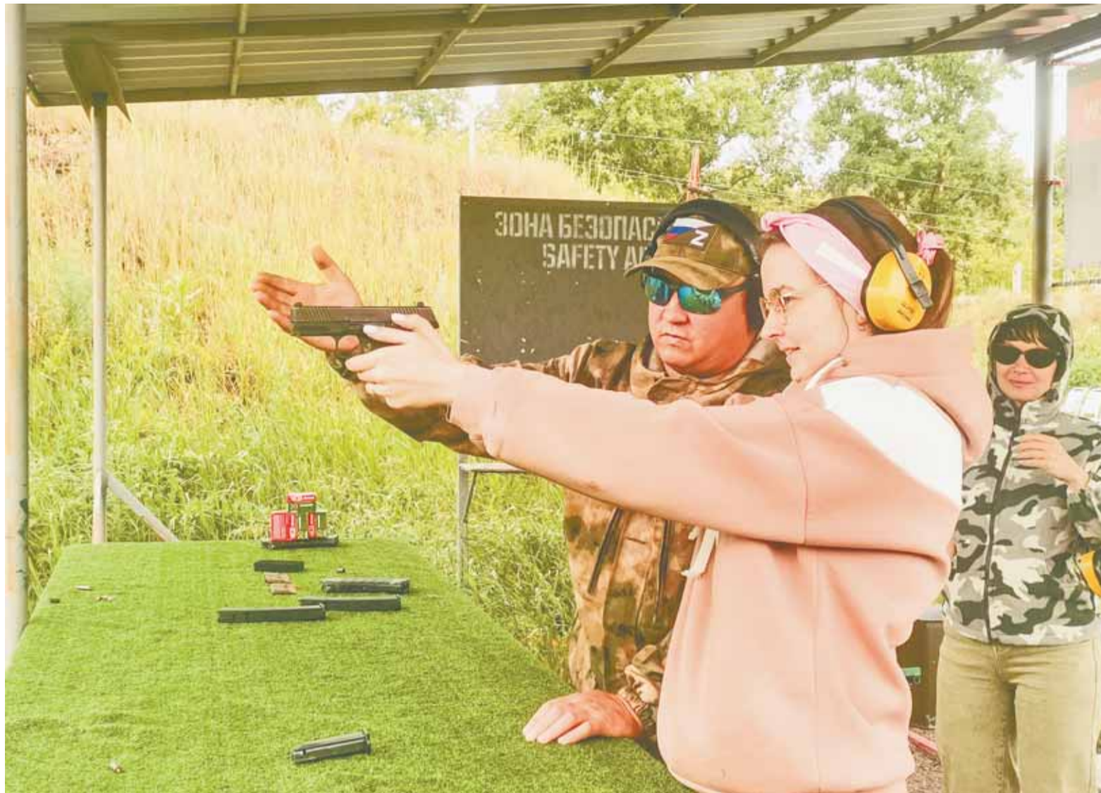
Инструктор всегда контролирует каждый выстрел участника-стрелка.