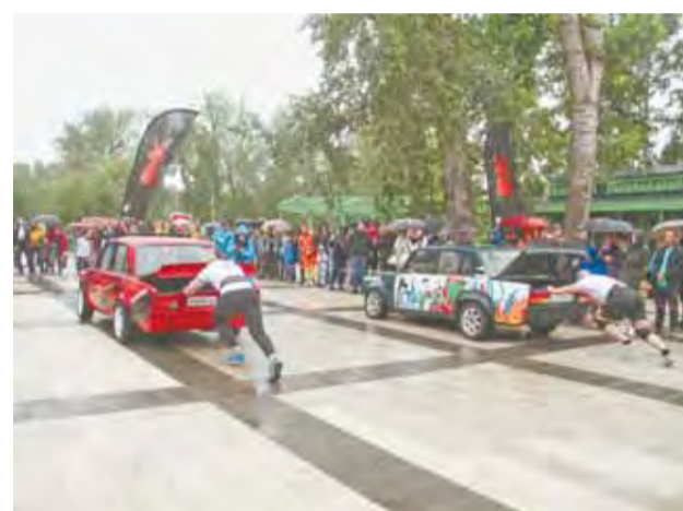
Эти испытания – для настоящих богатырей.