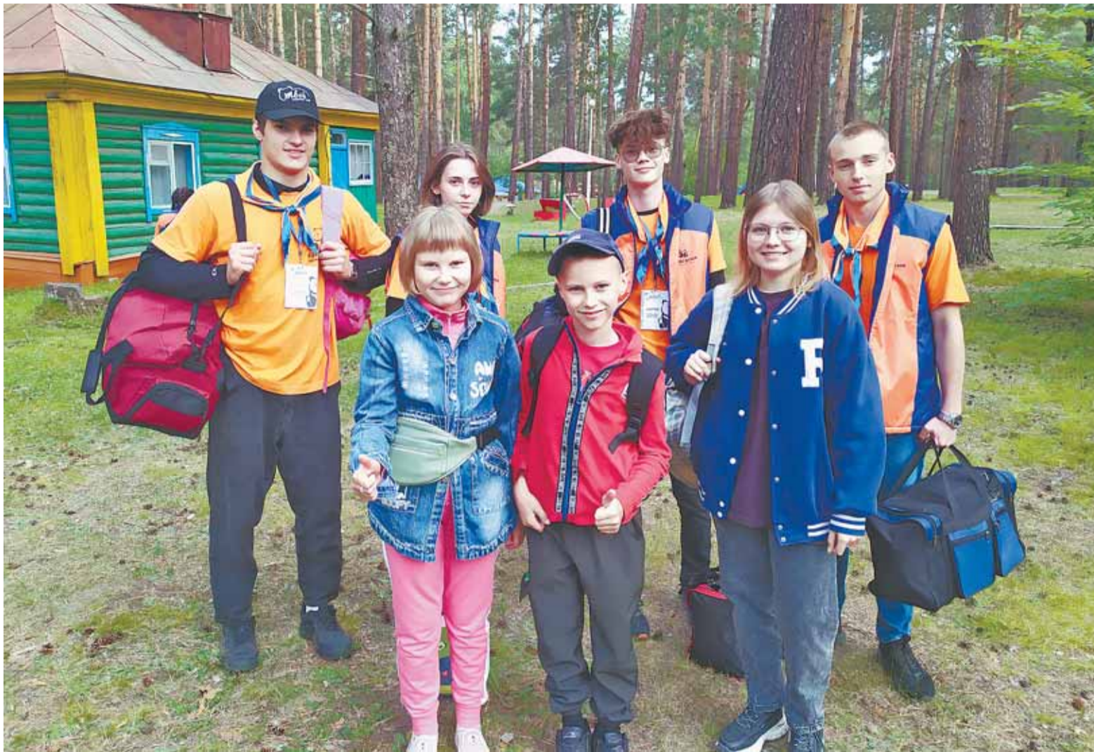
В день заезда команда вожатых знакомит ребят с лагерем и помогает заселиться в домики.