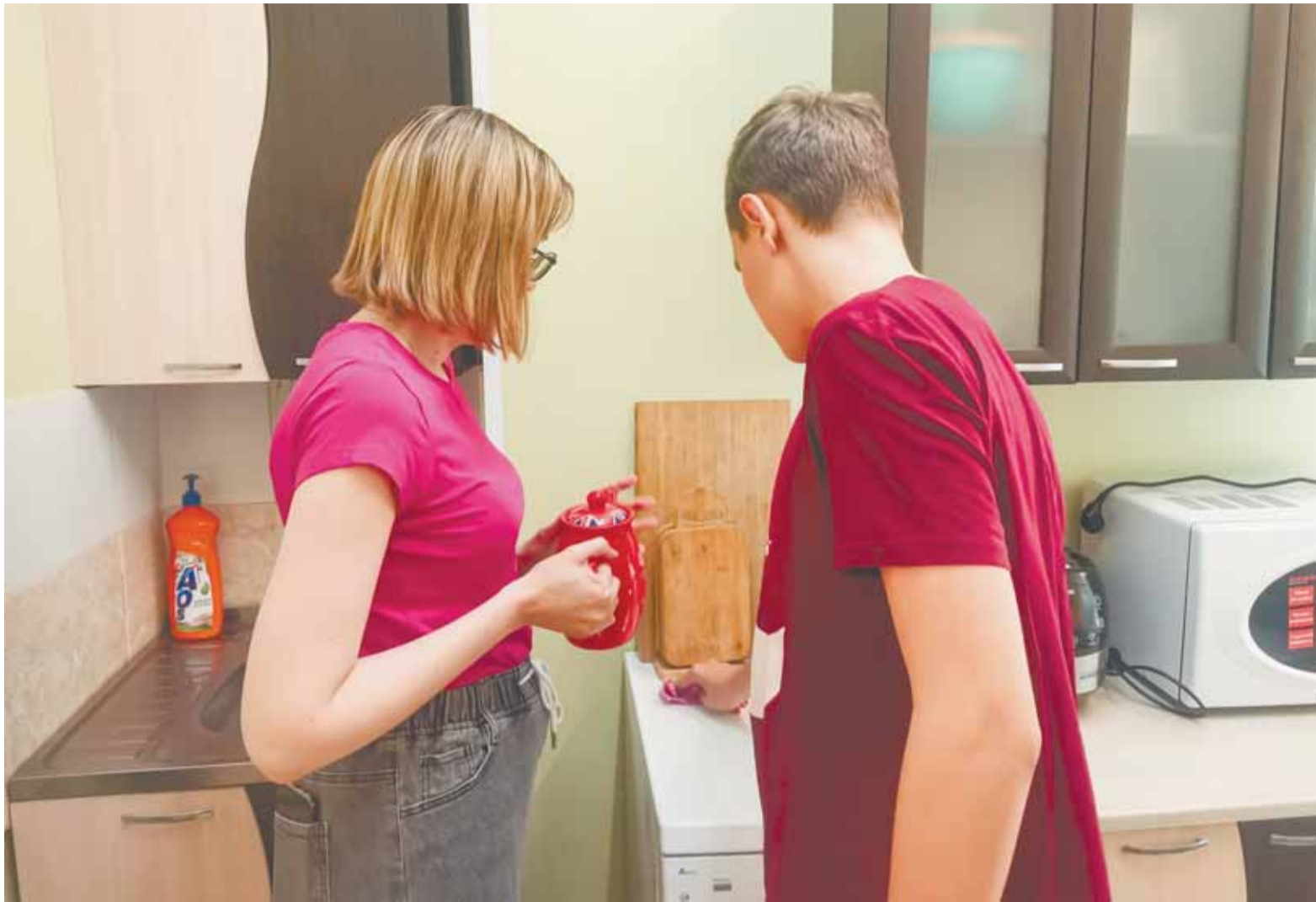
Специалист контролирует действия подростков, которым это необходимо. Иногда использует метод «рука в руке».