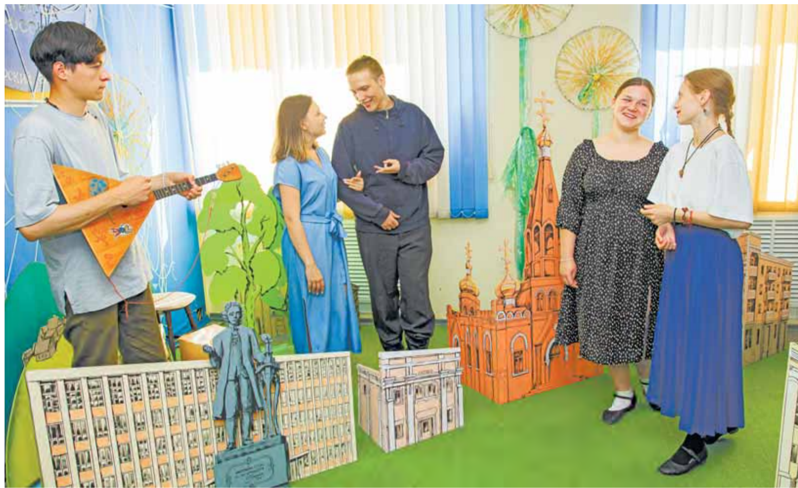
Одна из последних репетиций спектакля перед премьерой.

– Путь от Нулевого километра до гостиницы «Алтай» составляет 1970 шагов, или 1,4 км. Время действия – конец