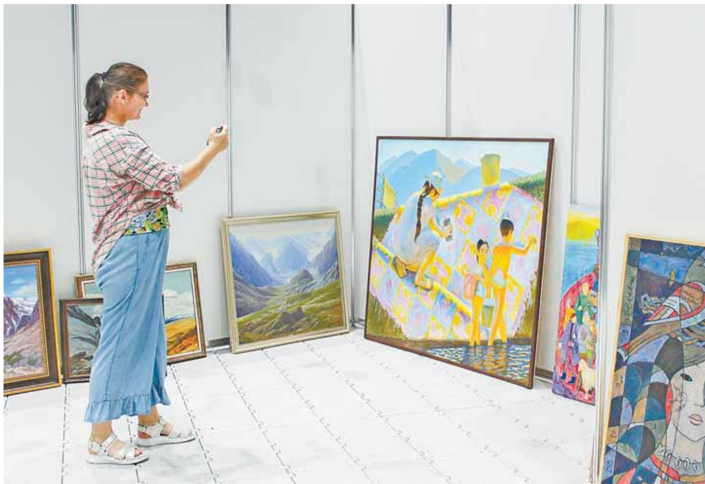
Организаторы готовят экспозицию к открытию.