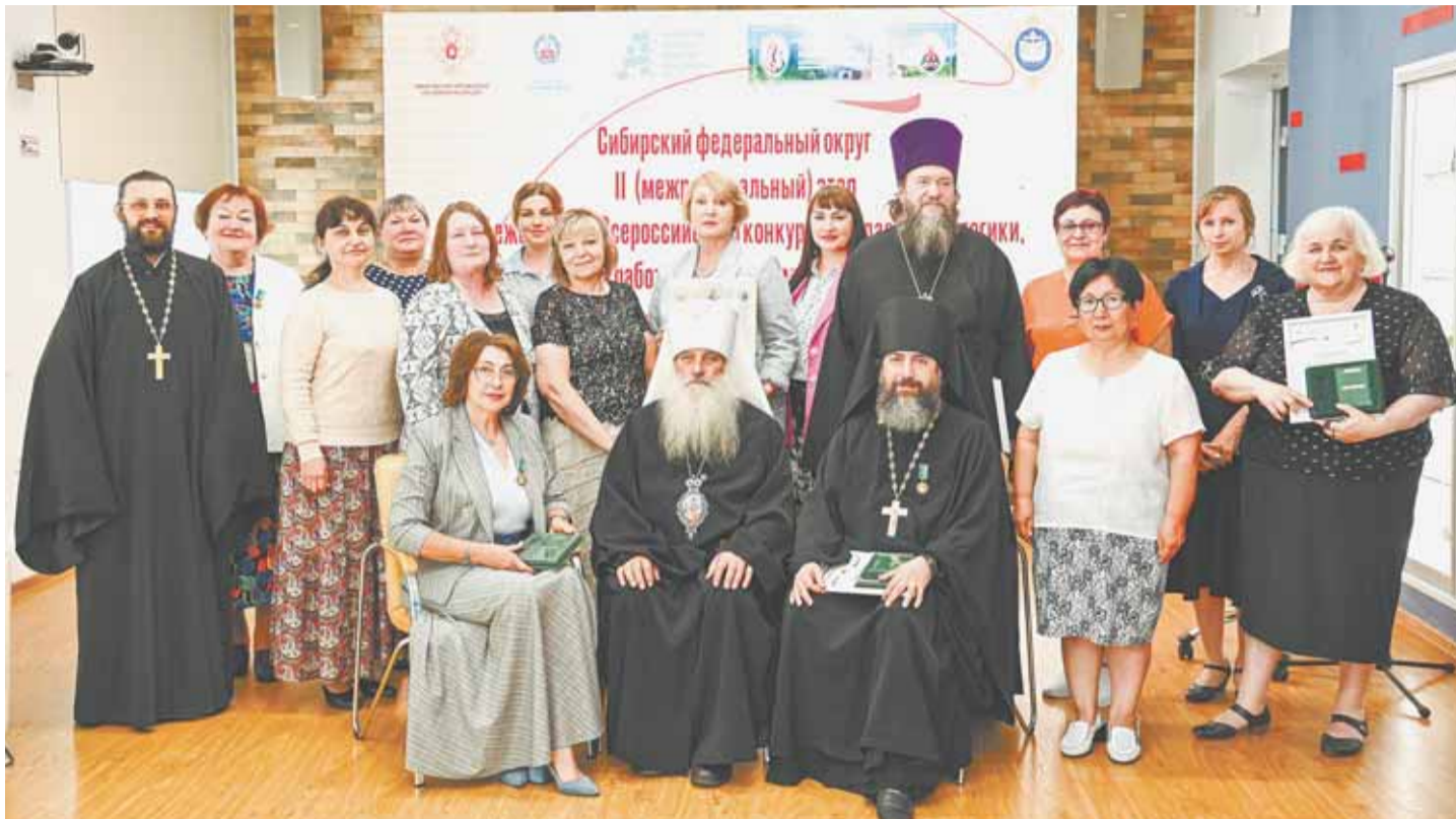
Конкурсная комиссия включает в себя специалистов в области образования и просвещения.