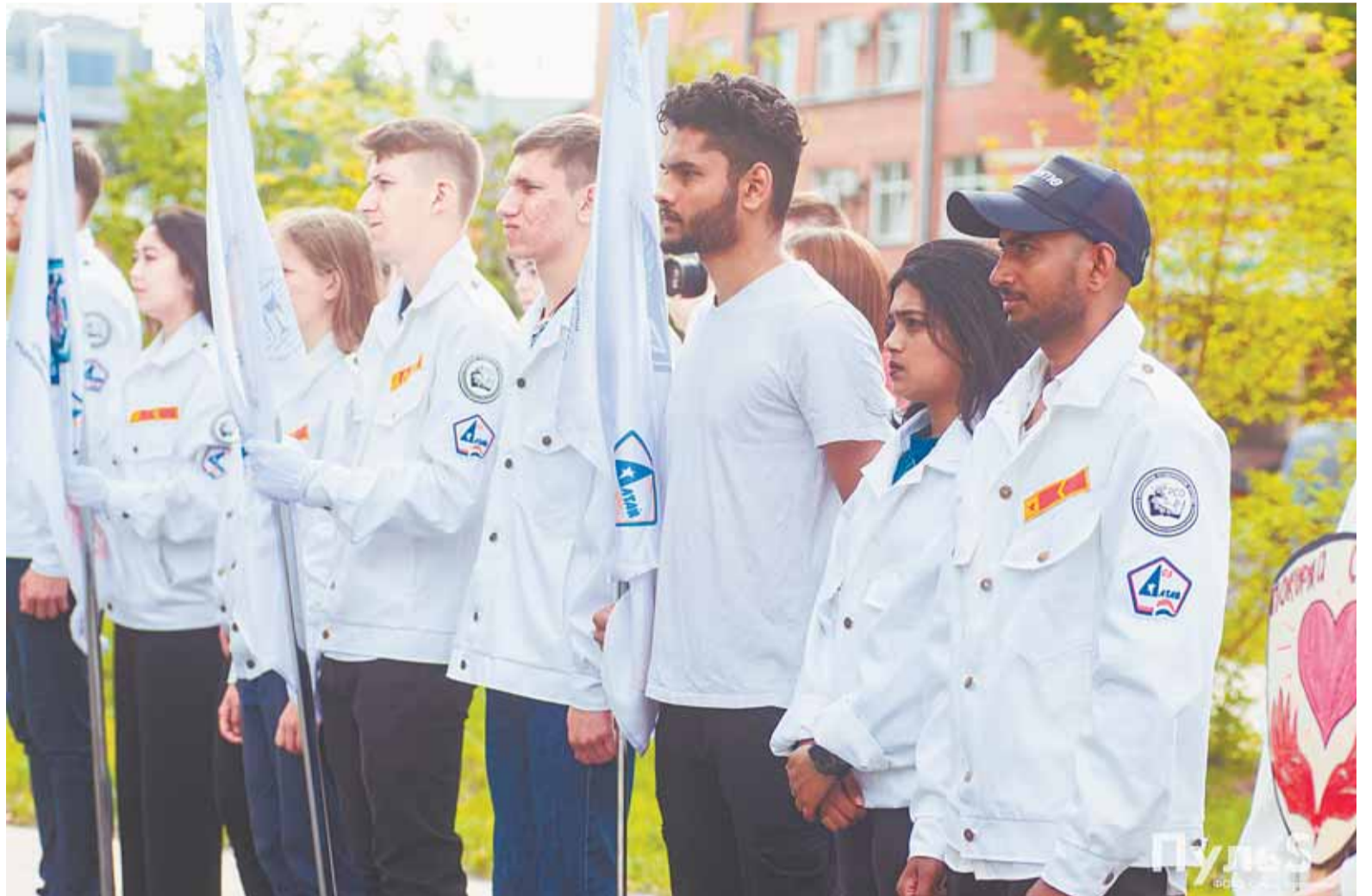
Иностранцы студенты медуниверситета влились в студотрядовское движение.

Этим летом в медучреждения края трудоустроились отряды «Альбус», Danis, «Алтея», «Аликор», «Василиск», «Гелиос», Falixr и «Покоряй сердца».