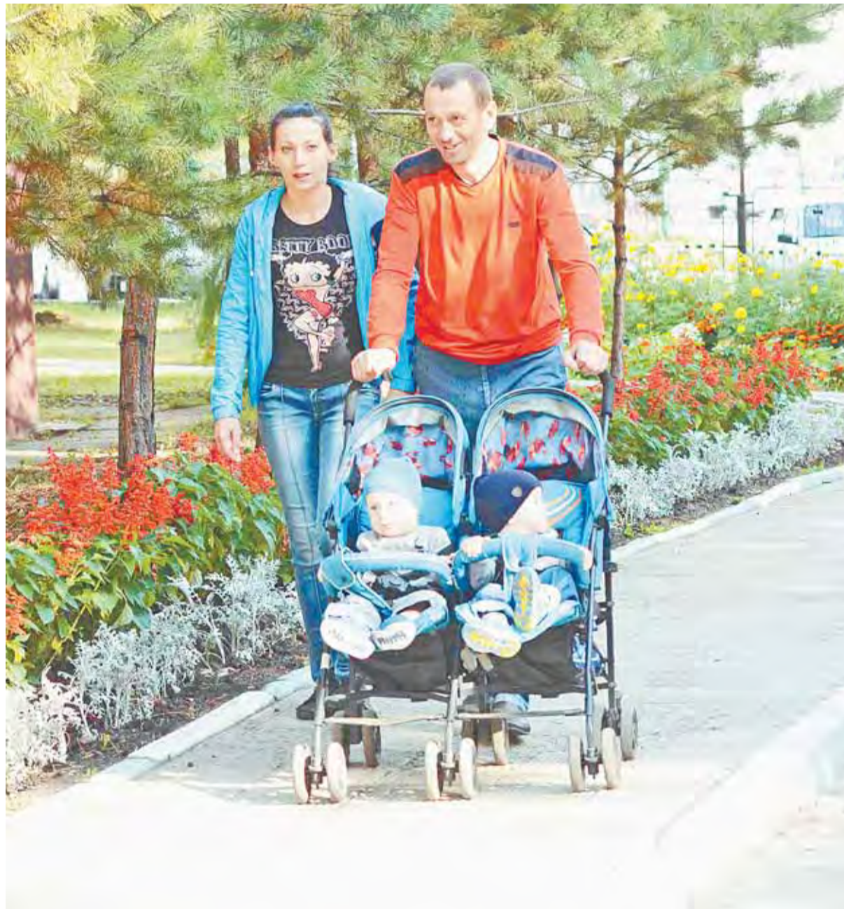
Проект «Семейная сессия» продлится до декабря 2025 года.