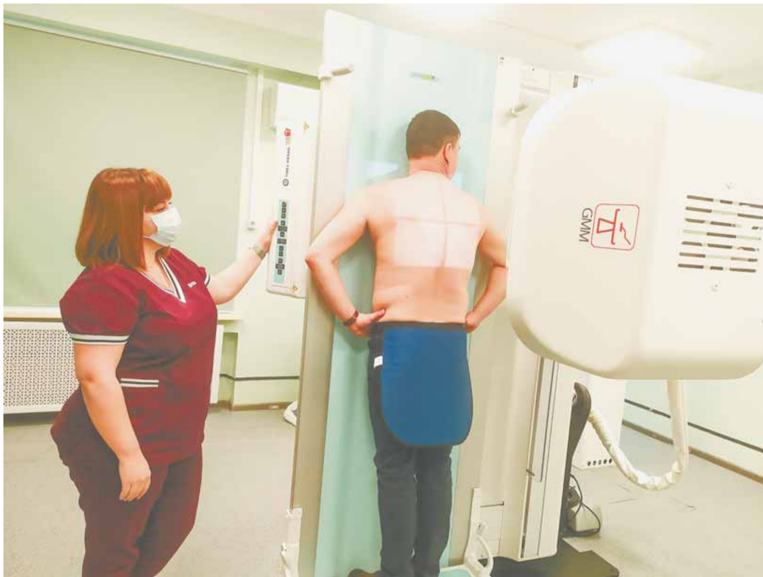
Современное оборудование помогает распознать болезнь.