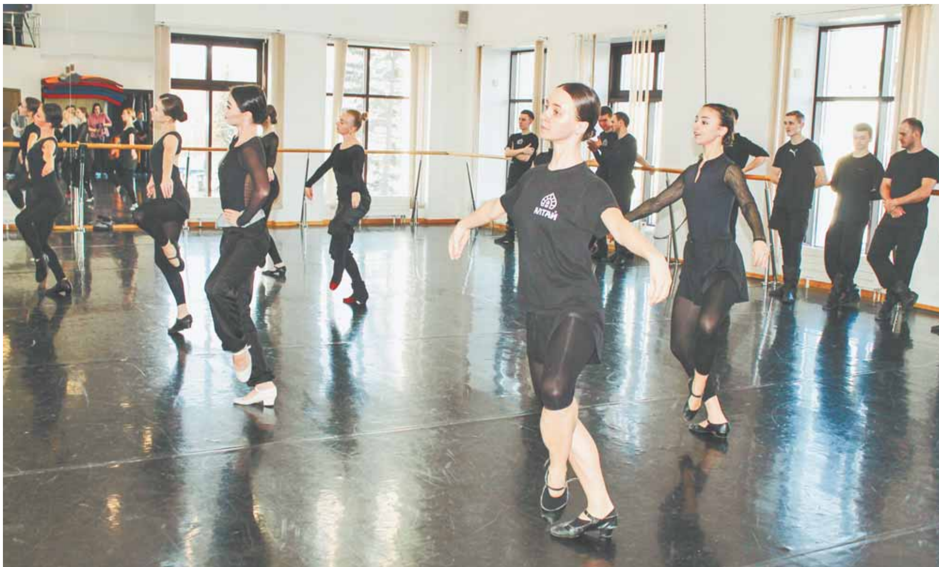
Артисты ансамбля «Алтай» оттачивают движения перед поездкой на Кубу.