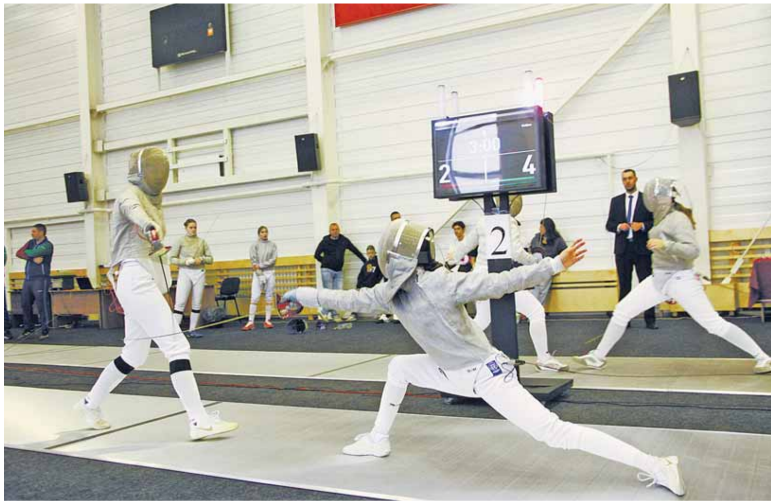
И для взрослых, и для молодежи соревнования стали проверкой сил перед этапом Кубка мира.

– Я хорошо знаю тренерский коллектив Алтайского края, в сборной России есть ваши спортсмены. Так что с удовольствием принял при-