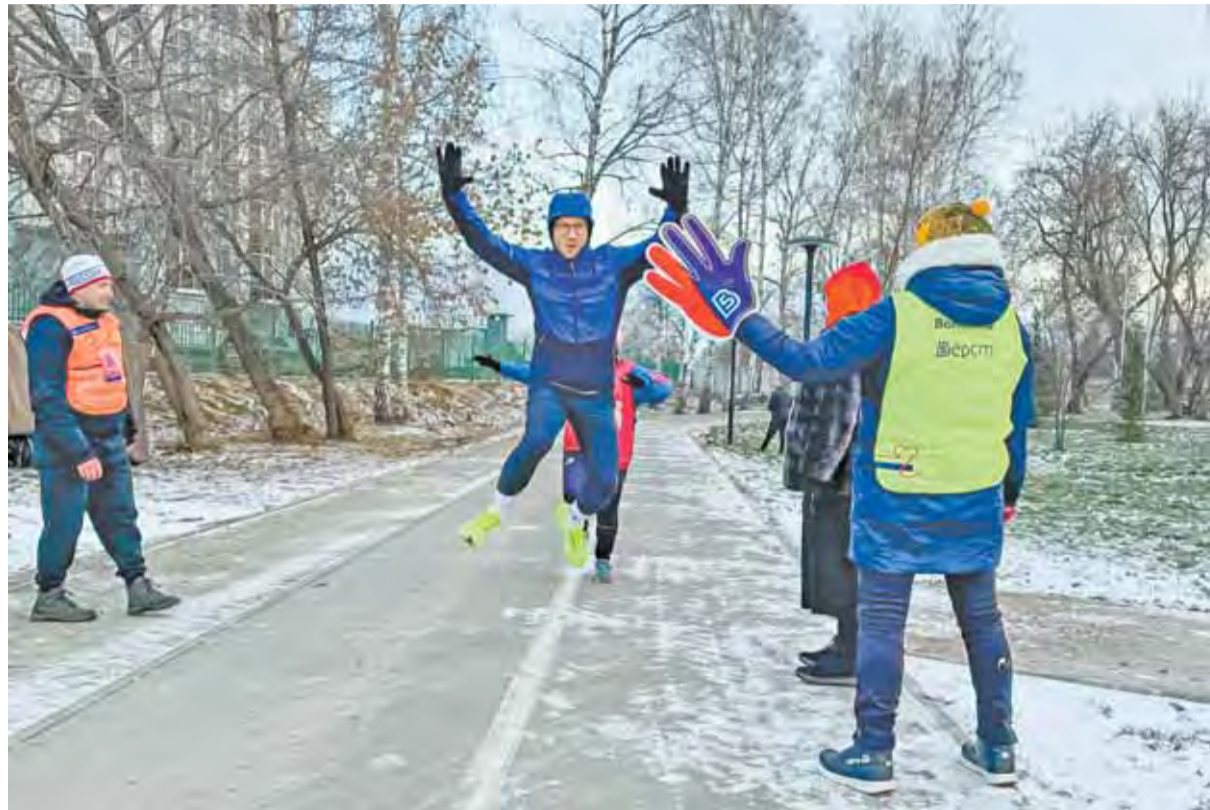
Тестовый забег в минувшую субботу прошел успешно.

Сейчас «5 верст» объединяет несколько десятков