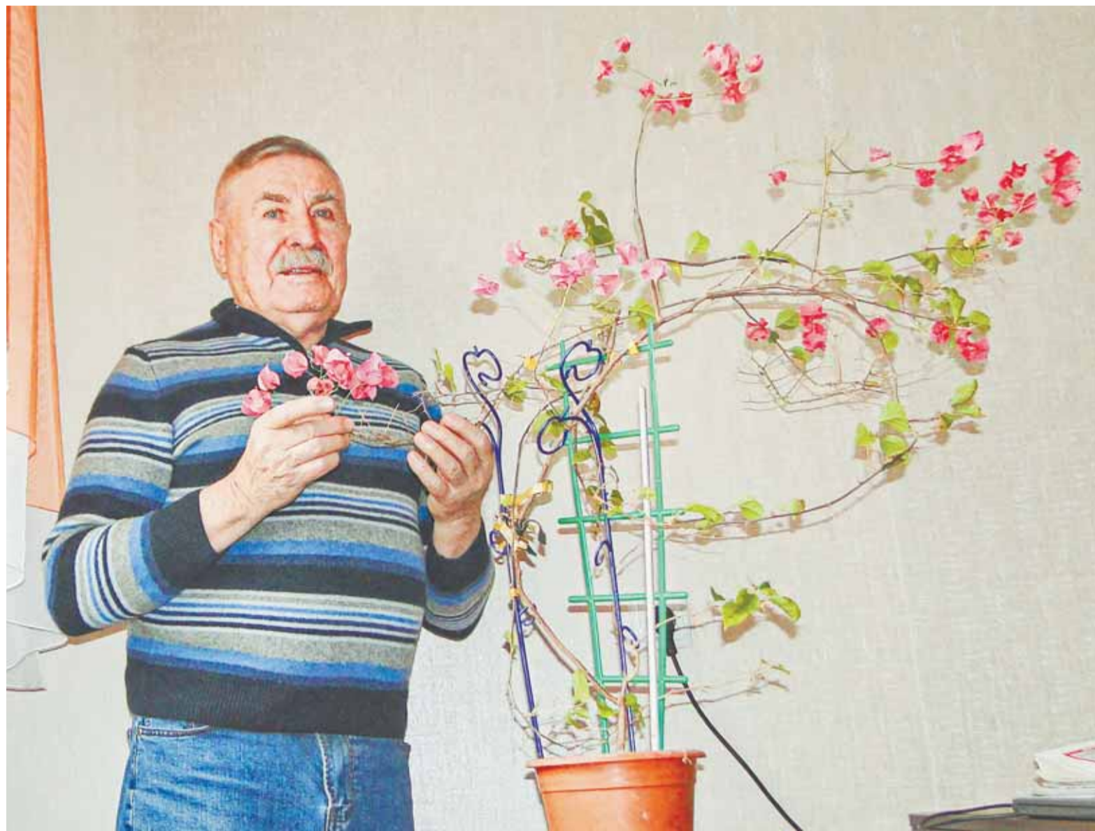
При хорошем уходе тропиканка будет цвести практически круглый год.

При появлении на растении вредителей — тлей, щитовок и мучнистых червецов — обработайте препаратами «Актара» или «Искра». Чтобы избежать возможного заражения всех домашних цветов, новому растению лучше устроить карантин и поместить на первые две недели на отдельный подоконник.