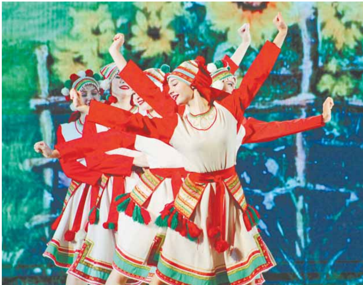
Участники удивили зрителей мастерством и яркими костюмами.