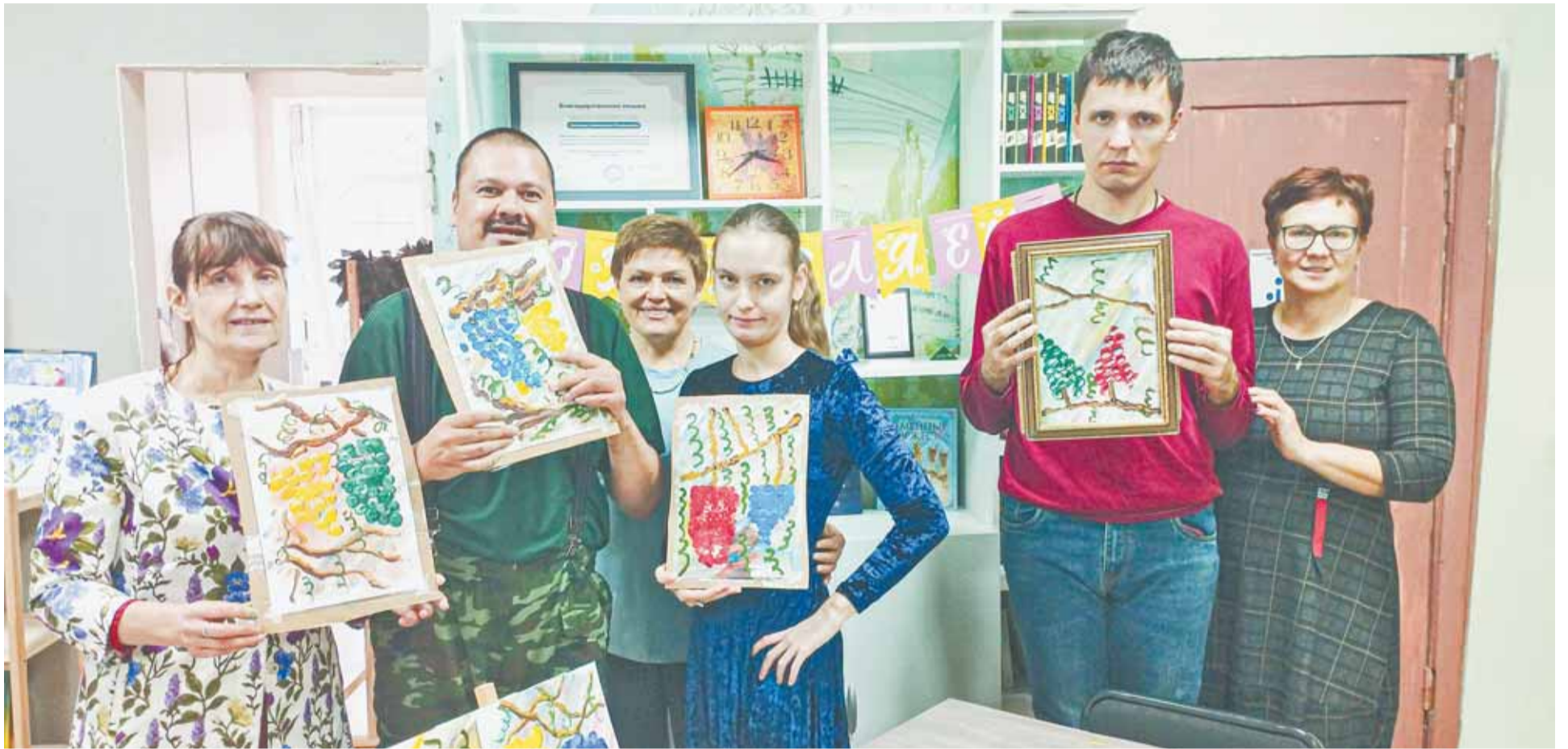
Ограничения по здоровью не мешают молодым людям с инвалидностью заниматься творчеством и добиваться значительных результатов.

Общественная организация «Много деток – хорошо!» возобновила проект для молодежи с инвалидностью