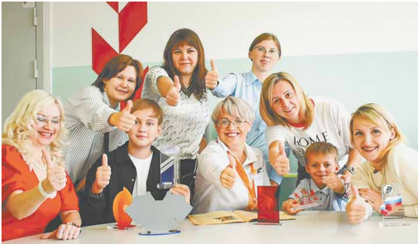
Сотрудничество педагогов и родителей учеников школы № 98 дает хорошие результаты.