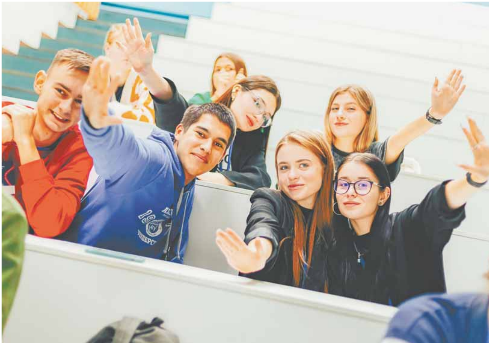
Лучшие студенты страны учатся на отлично, успевают заниматься спортом, научной и общественной деятельностью.