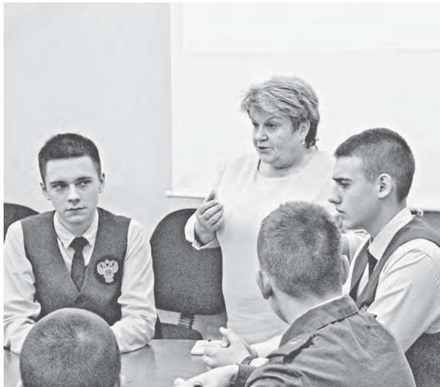
Встреча «Кадетского братства» состоялась не впервые.