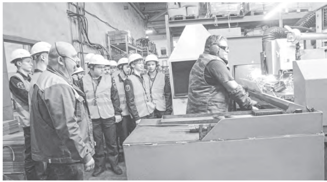
После знакомства с предприятием школьников пригласили на летнюю подработку.

В отдельных школах краевого центра профориентационная работа давно вышла на новый уровень благодаря тесному сотрудничеству с организациями и ведомствами разных профилей. В школе № 110 готовят будущих строителей благодаря поддержке группы компаний «Союз». В школе № 53 успешно зарекомендовали себя правоохранительные и инженерные классы. Около 70% учащихся лицея № 52 носят статус кадетов классов МЧС. Такая профиллизация не обязывает ребят по окончании школы продолжать двигаться