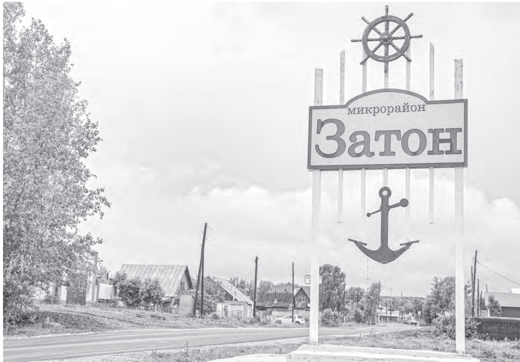
Сегодня в Затоне есть все для благоустроенной, комфортной жизни.

В микрорайоне реализуется программа социальной газификации. За счет средств Единого