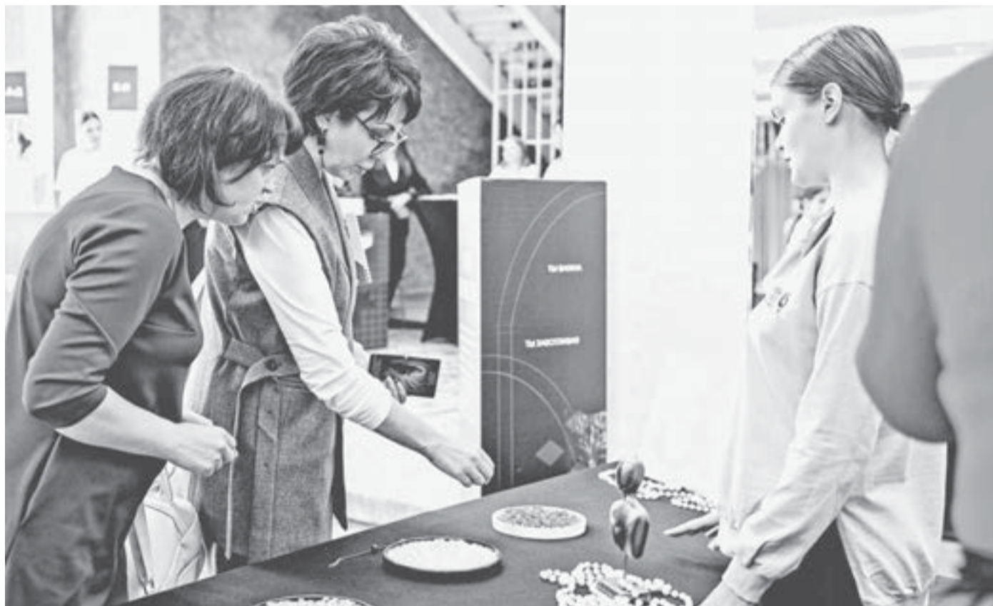
В рамках форума предприниматели познакомили участников со своей продукцией и провели ряд мастер-классов.

Более 700 предпринимателей объединил третий по счету женский бизнес-форум