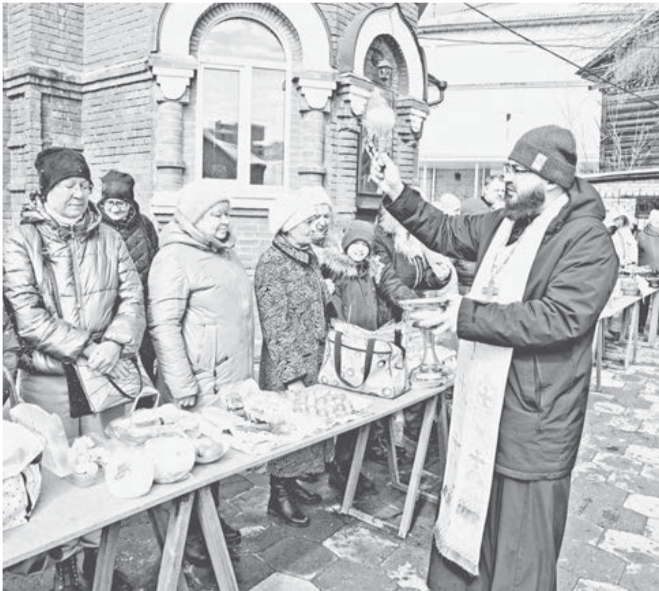
В праздник Пасхи во всех храмах Барнаула пройдут богослужения.