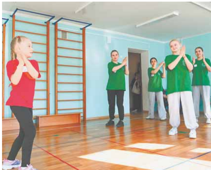
Юные мастера показали членам жюри профессиональные умения в разных компетенциях.