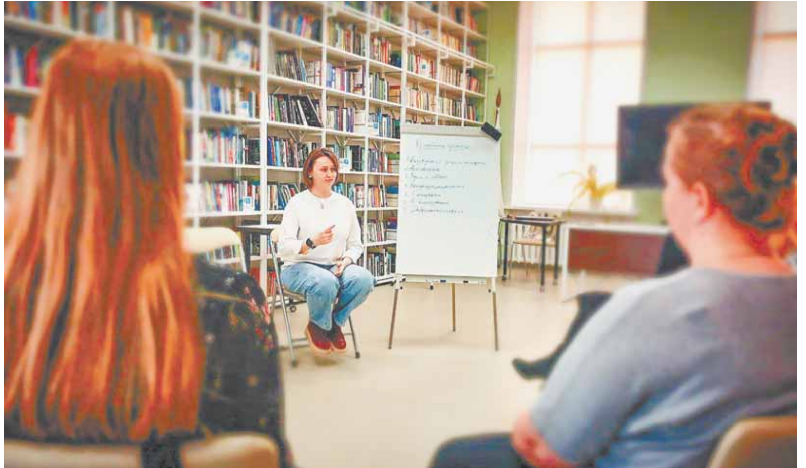
Помощь специалиста помогает установить истину в споре.

Конечно, каждое обращение – это уникальная личная история, соответственно, уровень результативности рассматривался в индивидуальном порядке. Для одних пар большим достижением стало то, что спустя годы они исключили номера друг друга из «черного списка» и стали вести диалог напрямую, а не передавать необходимую информацию через общих детей. В других случаях родитель, живущий отдельно, наконец-то получил возможность участвовать в воспитании ребенка. Было несколько