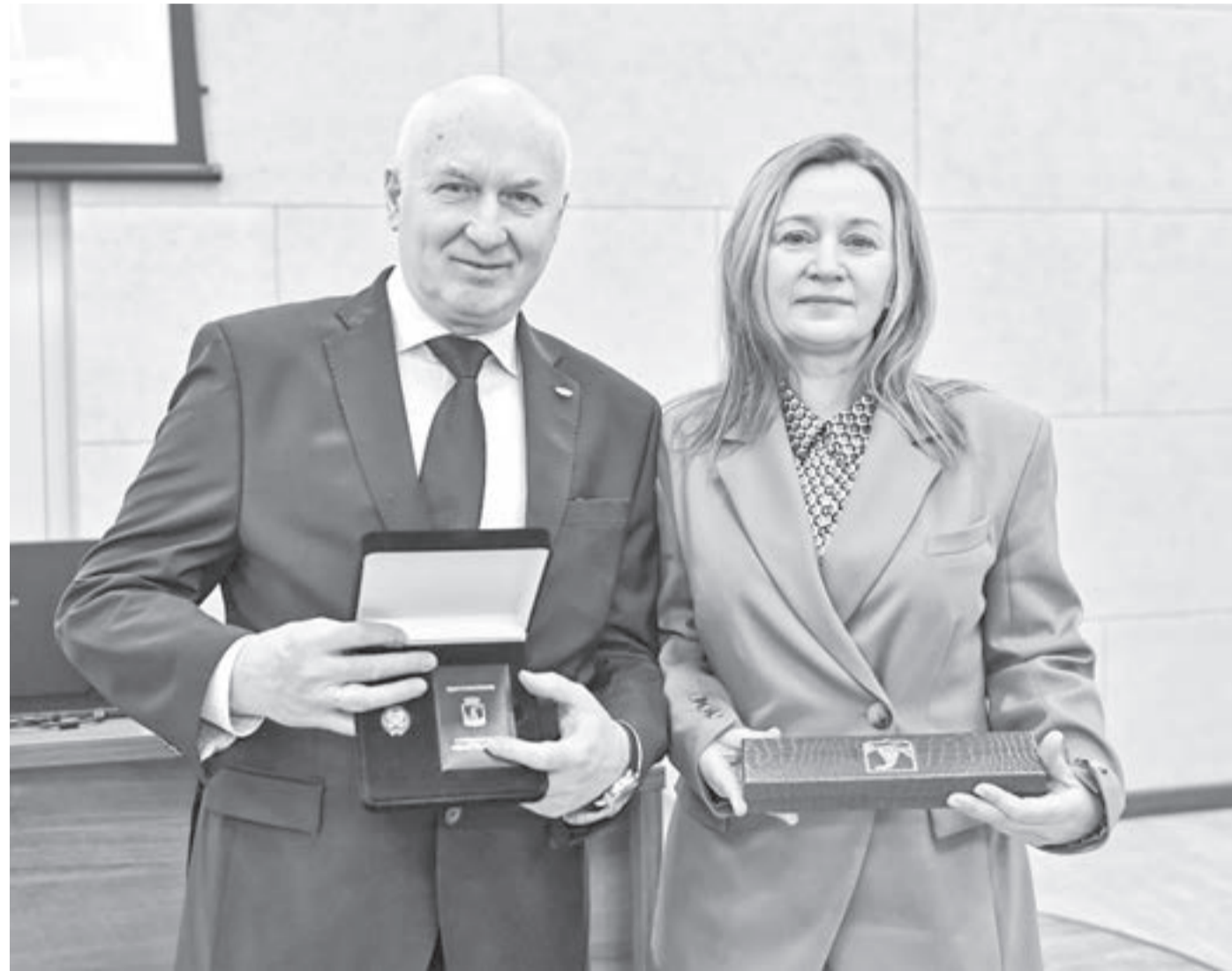
В ходе торжественного мероприятия 43 человека были удостоены наград разного уровня.