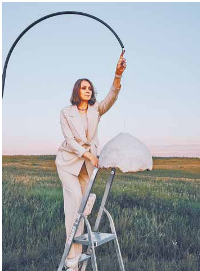
Техника папье-маше напоминает скульптурную лепку.