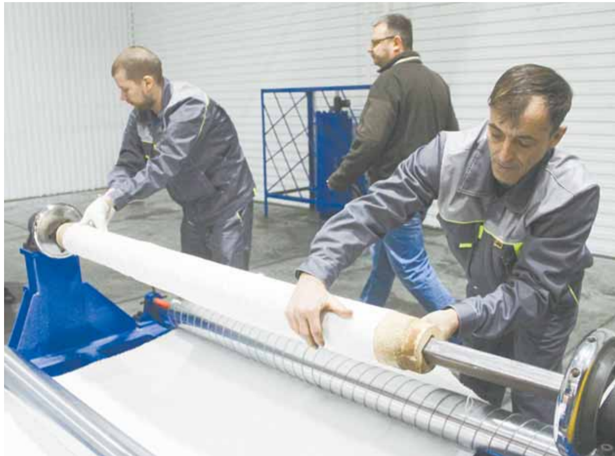
Инвестиции в развитие производства в этом году превысили прошлогодние показатели.

Объем инвестиций в развитие производства крупными и средними предприятиями в этом году превысил прошлогодние показатели. Сразу три предприятия реализуют проекты общей стоимостью несколько миллиардов рублей – АО «Сибирь-Полиметалл» направит на развитие Корбалихинского месторождения более 40 млрд, на модернизацию Барнаульского меланжевого комбината заложено 15 млрд, АЗПИ расширение серийного производства современных топливных систем