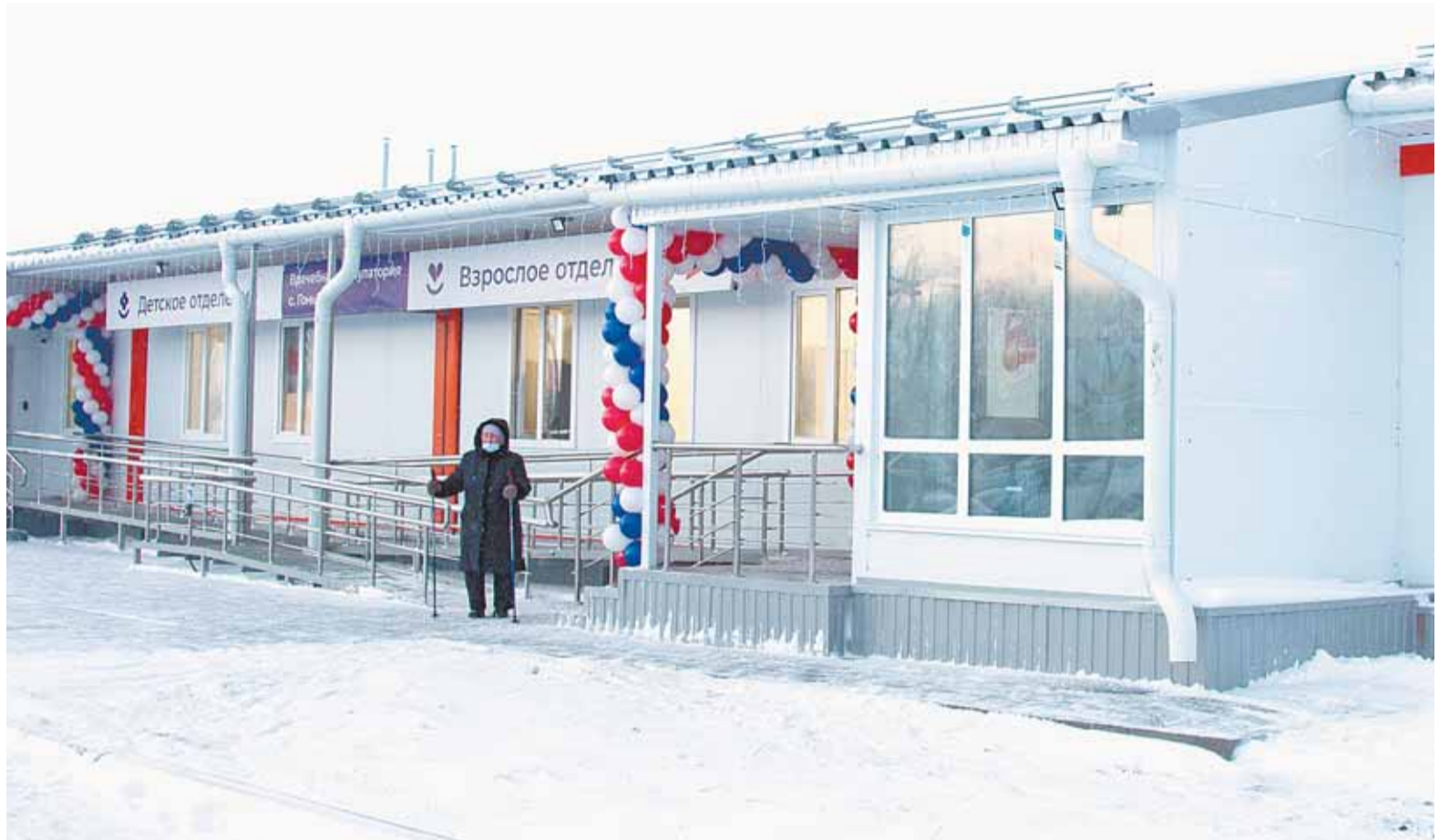
Первых посетителей в новой амбулатории начали принимать уже в день открытия.

– Детей раньше обслуживали в Научном Городке, теперь они будут получать помощь рядом с домом. Это 1200 детей