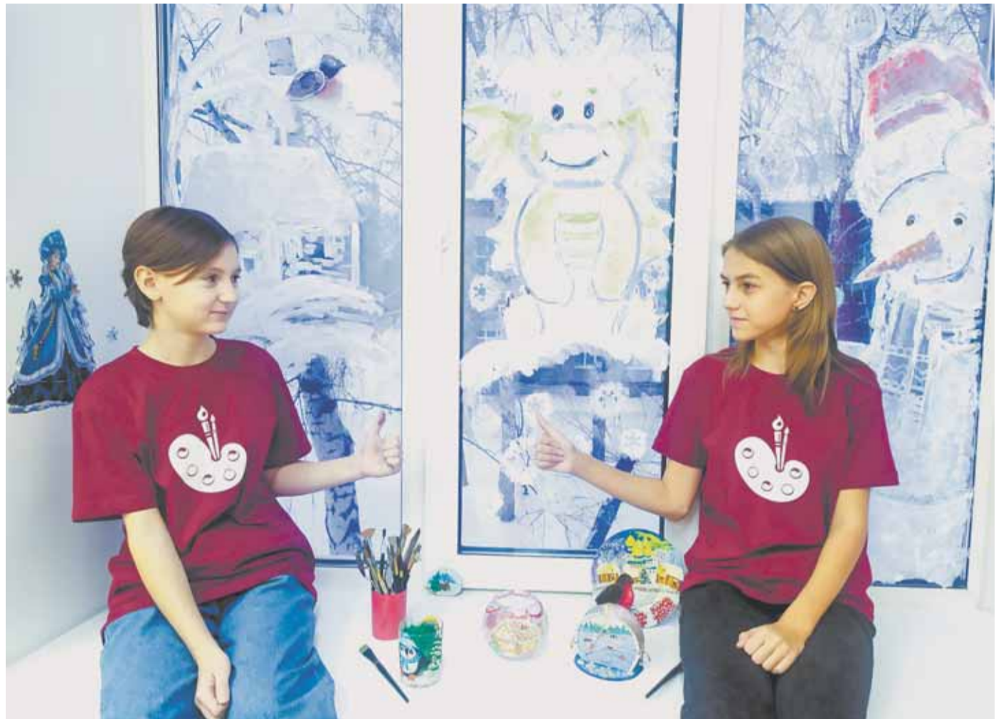
Полчаса работы – и дизайн в новогоднем стиле готов!