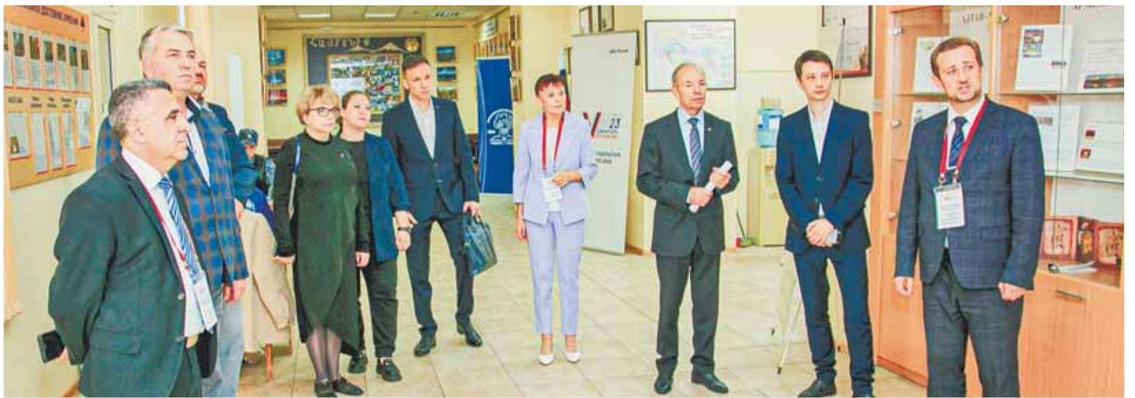
Общественная палата города Барнаула принимает активное участие в решении актуальных городских вопросов и разработке рекомендаций.

ный совет, комиссия по оказанию помощи участникам СВО и их семьям, комиссия по конкурсному отбору инициативных проектов, Совет по экономическому развитию и приоритетным проектам и другие.