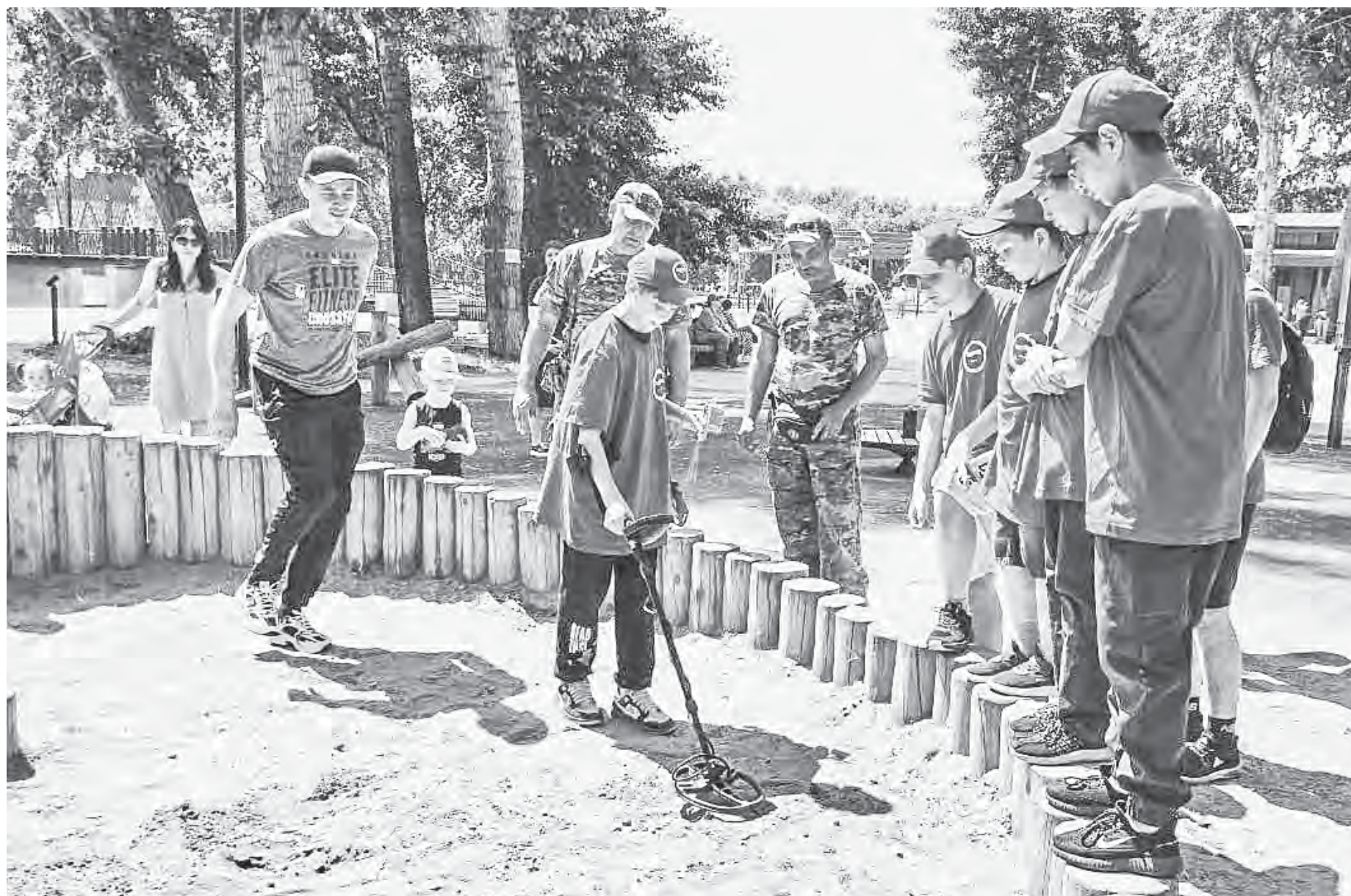
В военно-спортивной игре «Зарница» в «Изумрудном» приняли участие пять команд по десять человек.