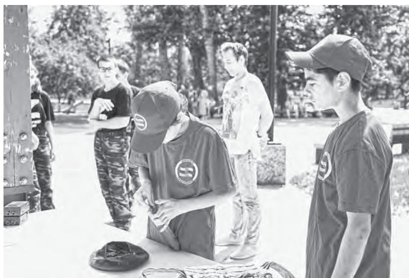
На всех этапах игры ребята показали, что хорошо умеют работать в команде.

После торжественного открытия «Зарницы» капитаны доложили о готовности команд, получили маршрутные листы с заданиями, и игра началась. Пять команд состязались в сборке-разборке автомата, прохождении «минного» поля с металлоискателем,