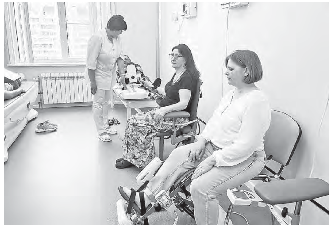
Курс реабилитации включает в себя занятия на тренажерах, физиолечение и многое другое.

В распоряжении пациентов поликлиники — кабинеты, оснащенные самым современным оборудованием. Многие из них проходят механотерапию: тренажеры позволяют разрабатывать суставы. А занятия на так называемой стабиллоплатформе помогают тем, у кого имеются нарушения мозгового кровообращения, были операции на позвоночнике. В числе применяемых методик восстановления также электростимуляция, магнитотерапия и пневмокомпресс конечностей. В отделении проводят индивидуальные и групповые сеансы лечебной физкультуры и массажа. Также обустроили комнату психологической разгрузки. Все физиолечение теперь также погружено в состав отделения. Если раньше пациенты получали его в качестве единичных процедур, то сейчас физио выполняет функцию составной методики лечения.