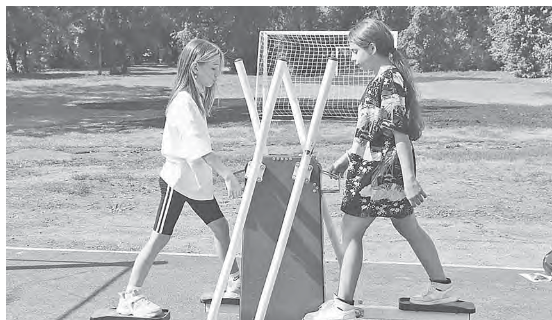
По программе инициативного бюджетирования у барнаульской школы № 68 установили тренажеры.

— Этот социальный объект еще одно подтверждение заин-