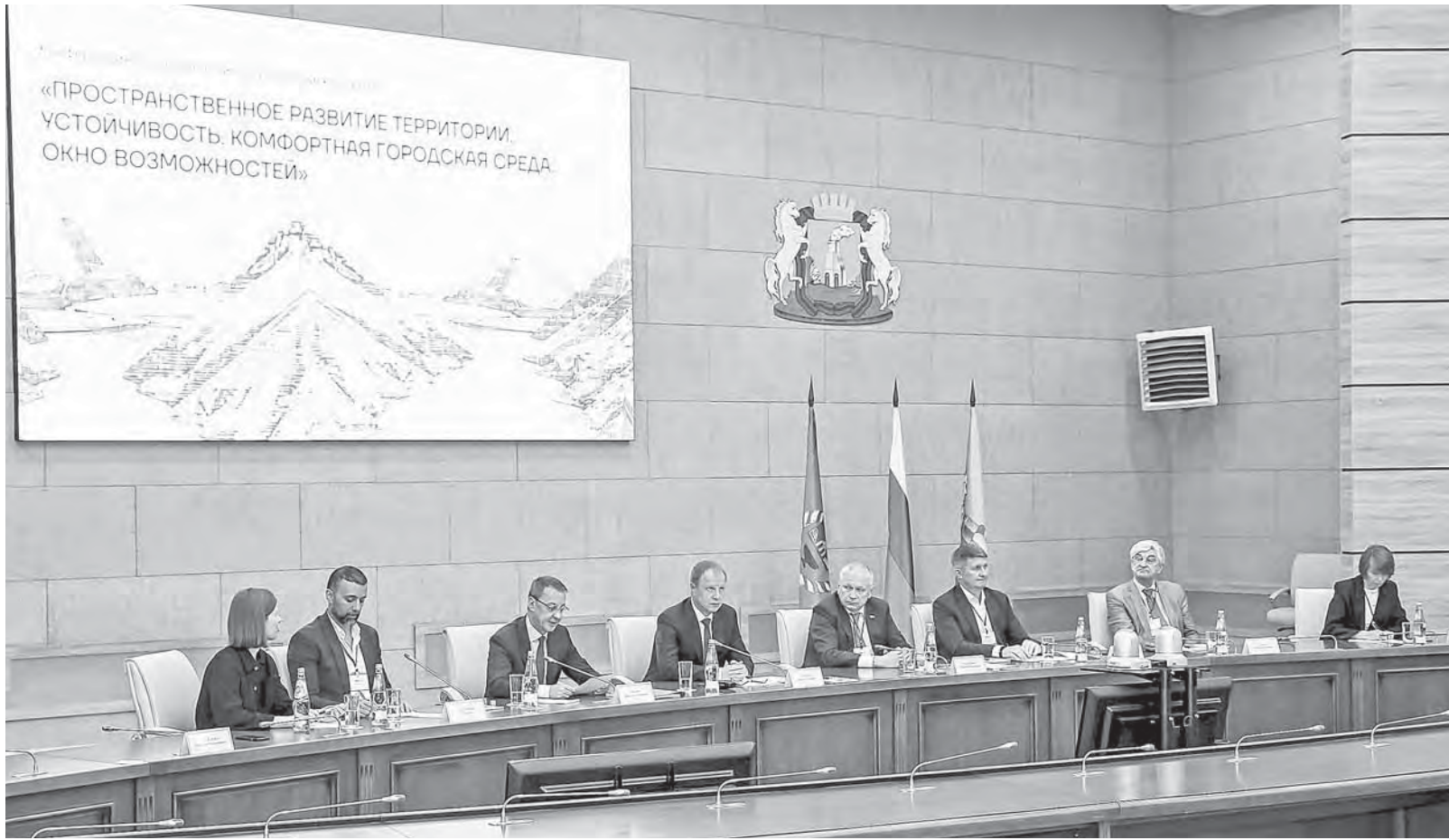
Участники конференции высоко оценили ее значимость и актуальность.