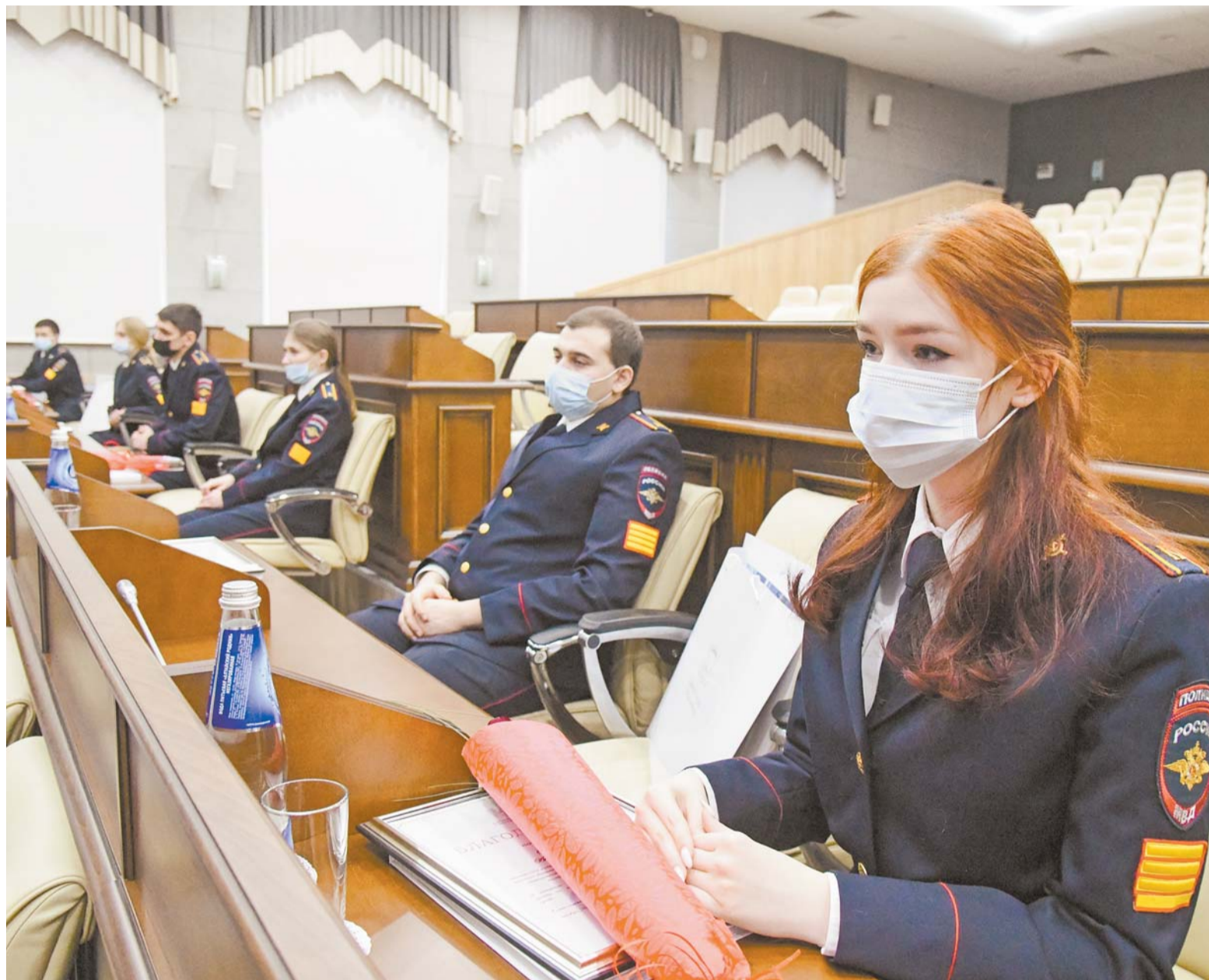
На заседании комиссии представители БЮИ участвовали в обсуждении актуальных проблем.

Одним из проявлений экстремизма является нанесение граффити и надписей в общественных пространствах, на стенах зданий и сооружений, в частности, нанесение рисунков пронацистского содержания. Это проблема всего мира, не только Барнаула, – подчеркнул Геннадий Королёв. – Чтобы грамотно и системно бороться с такими проявлениями в краевой столице, администрацией города принимается ряд мер. Для муниципальных служащих проводится обучение на тему существующих символов экстремистских и террористических организаций, запрещенных в Российской Федерации, и действий при обнаружении надписей экстремистского характера. В муниципальных образовательных организациях и в системе профессионального образования также проводят