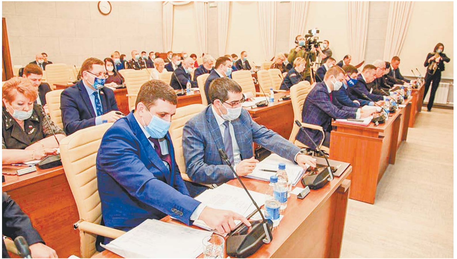
Чтобы поддержать барнаульских предпринимателей, депутаты помогут им экономить на арендных платежах.