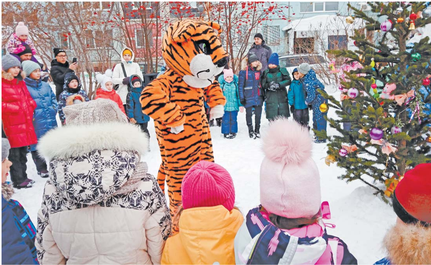
Активисты ТОС «Мирный» не только заботятся об уюте микрорайона, но и создают настроение его жителям.

Суббота, 25 декабря 2021 г. № 191 (5475)