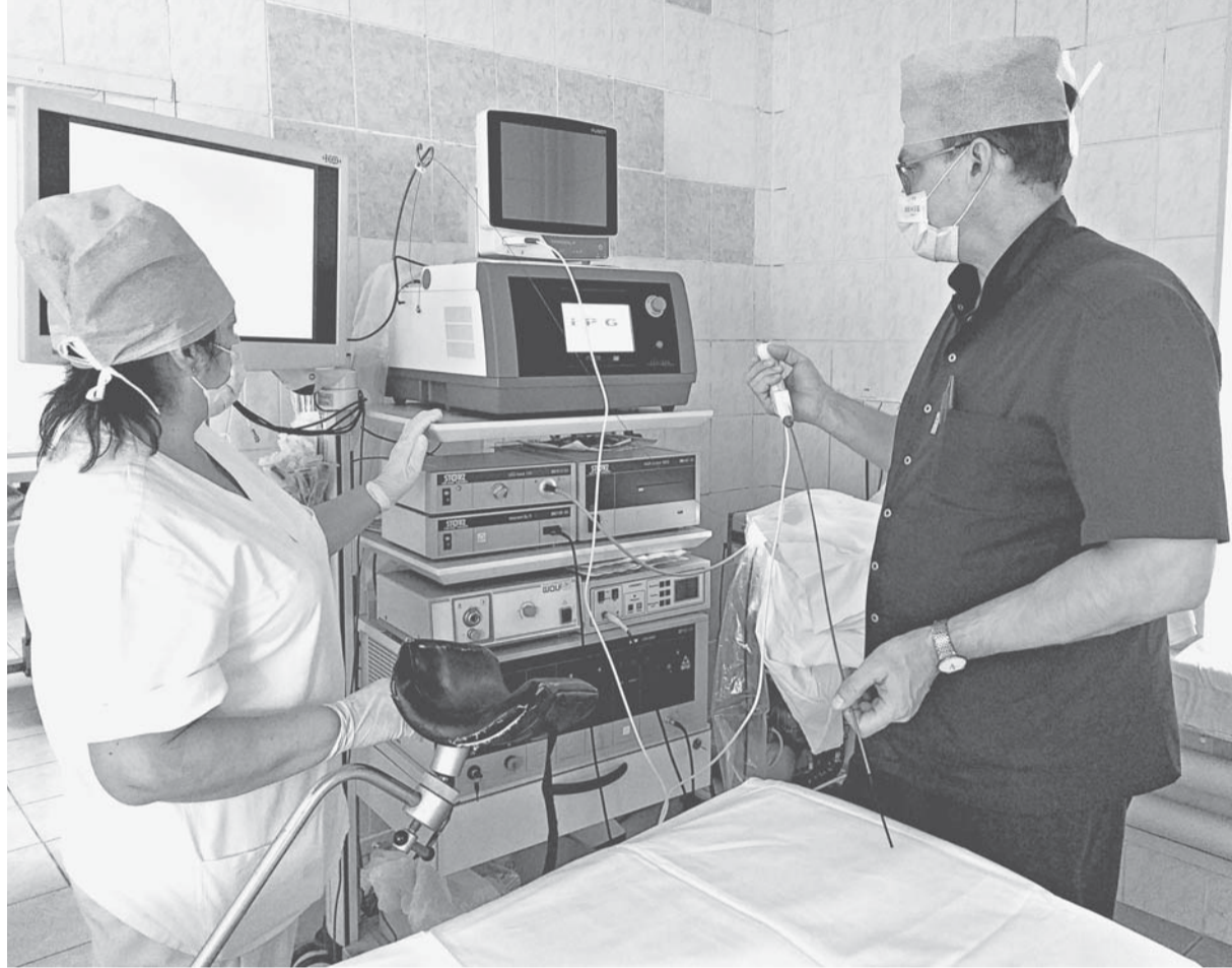
Все готово для очередной операции по удалению камней контактным способом.

Ранее использовался монополярный, также малотравматичный способ лечения, который позволял удалять лишь небольшие опухоли. В остальных случаях мы вынуждены были проводить открытую полостную операцию с неминуемо долгим периодом лечения и восстановления. Но и при монополярном методе могли возникнуть опасные