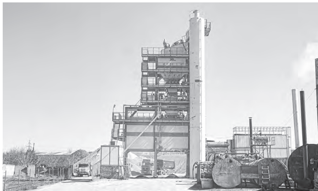
Асфальтобетонный завод в Барнауле обеспечивает материалом краевую столицу и ближайшие районы.