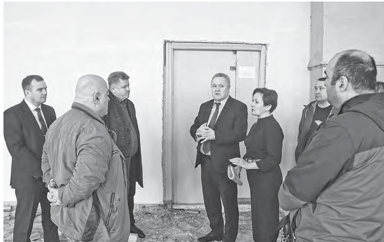
Капитальный ремонт ведется в соответствии с графиком.

Это решение было принято по инициативе администрации города Барнаула с целью обеспечения дополнительных возможностей для занятий физкультурой и спортом. Поэтому уже в начале года школа № 127 была включена в план реализации муниципальной программы «Развитие образо-