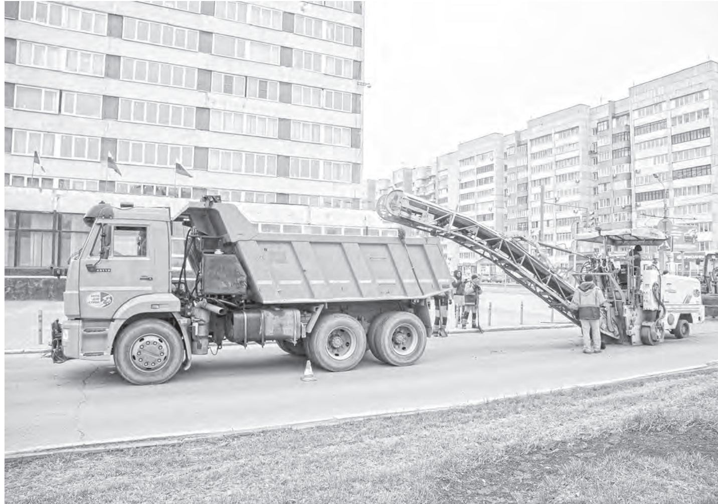
Участок на улице Молодёжной вошел в приоритетный план ремонта.