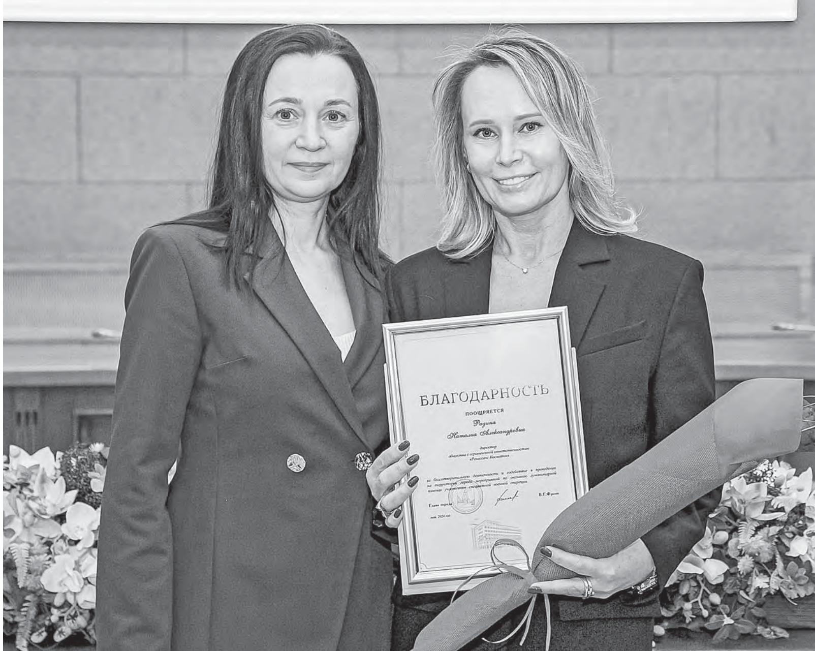
Награды были вручены как конкретным людям, так и целым коллективам.

Барнаульскими предпринимателями при содействии администрации города было отправлено в зону СВО более 220 тонн продуктов питания, свыше десятка единиц автотехники.