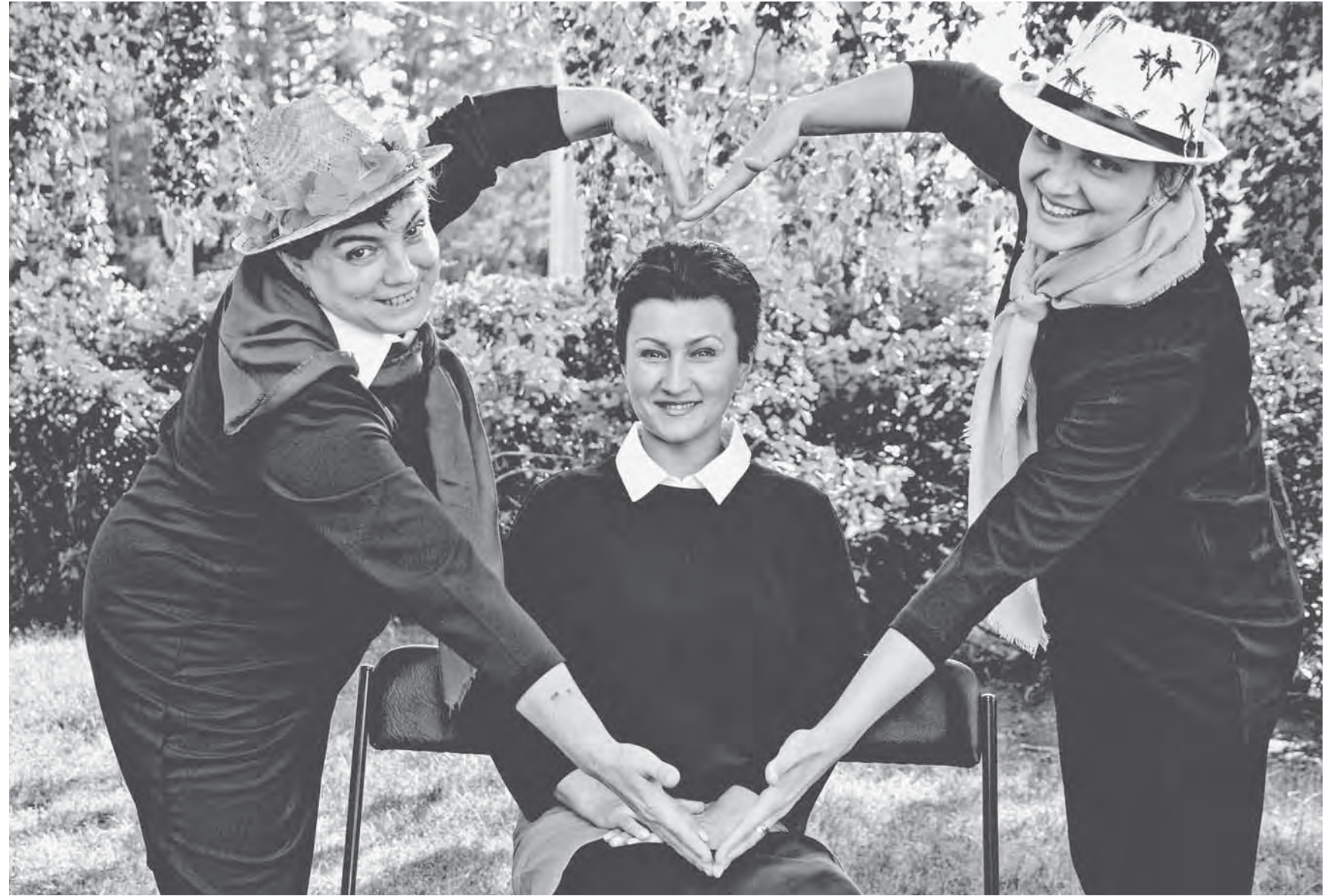
Постановку Литературного театра Шишковки покажут жителям региона.