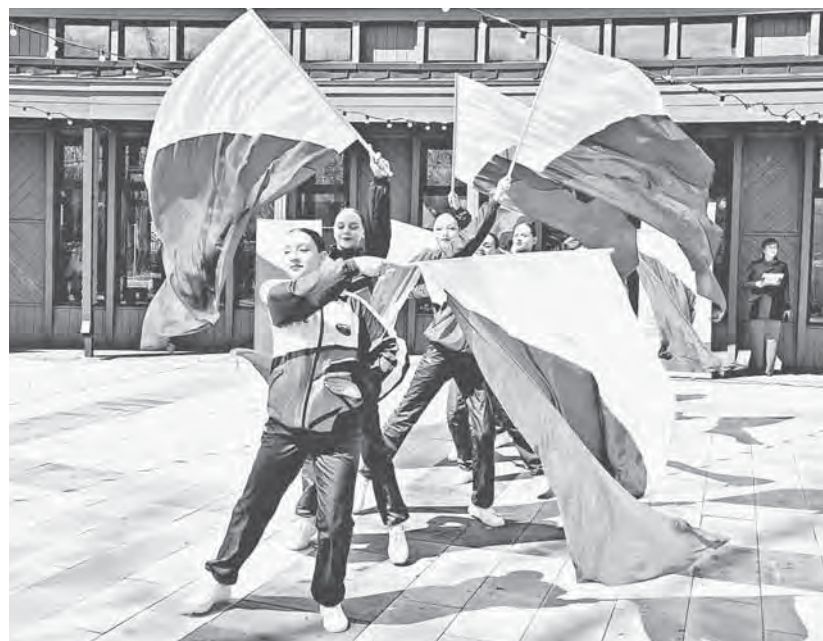
Юнармейцы произнесли слова торжественной клятвы, затем посадили кусты сирени.