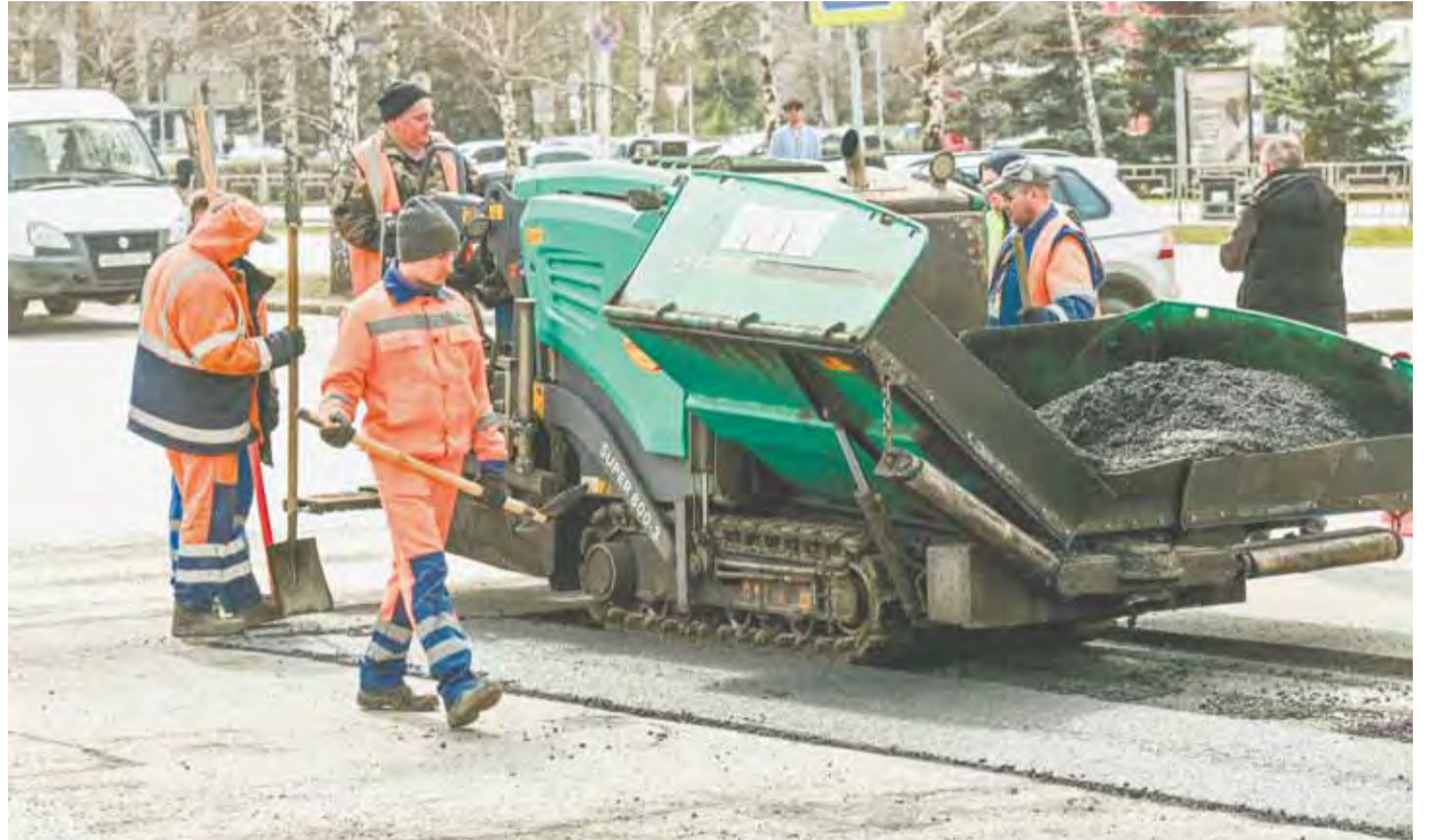
Погодные условия позволили приступить к текущему ремонту.