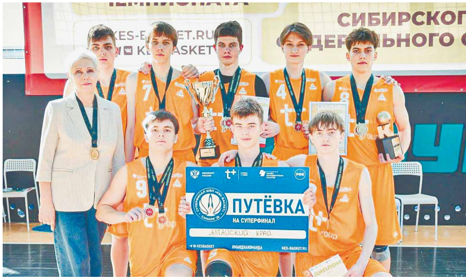
Баскетболисты лицея № 124 ставят только максимальные цели.

Лучший результат в суперфиналах «КЭС-Баскет» среди команд Алтайского края показывали сборные парней гимназии № 40 и лицея № 121 – они становились пятыми. У девочек дважды до бронзы добиралась команда рубцовской школы № 8.