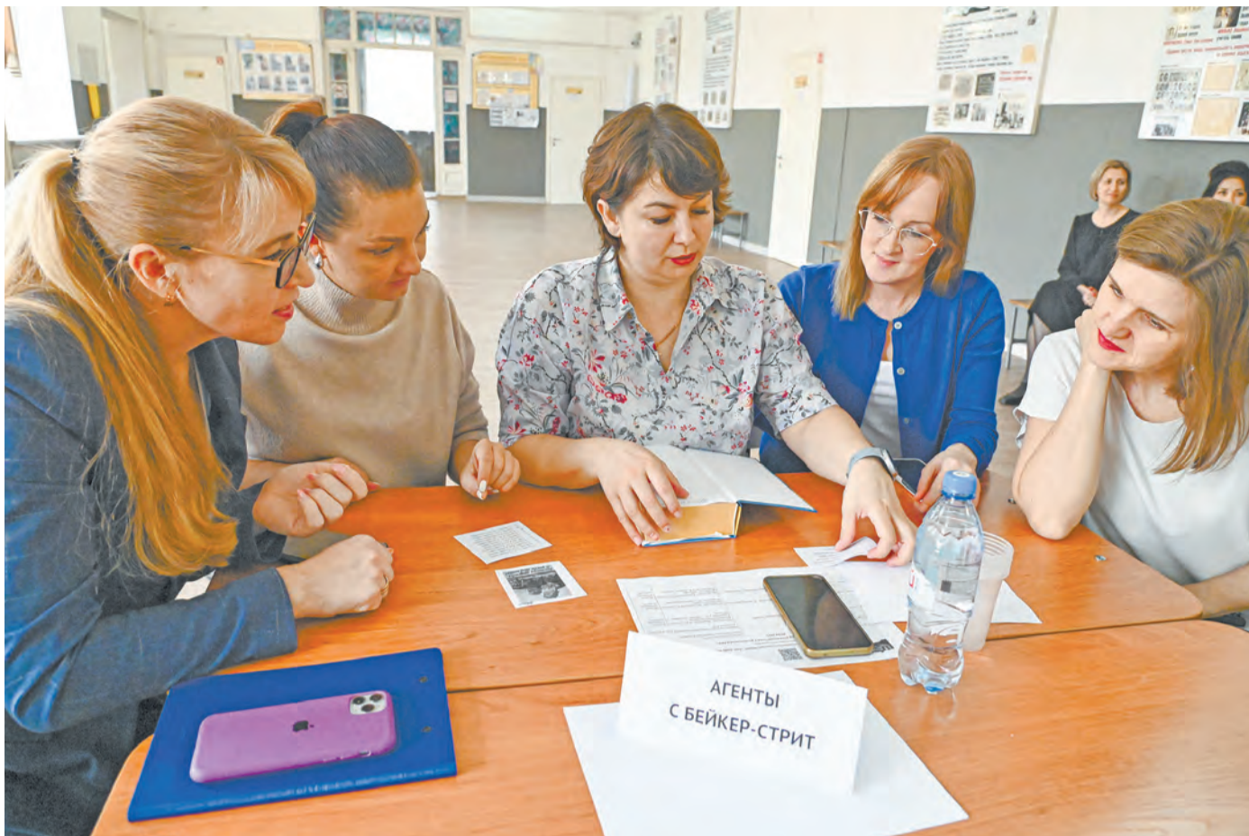
Педагоги с интересом погрузились в методический детектив.