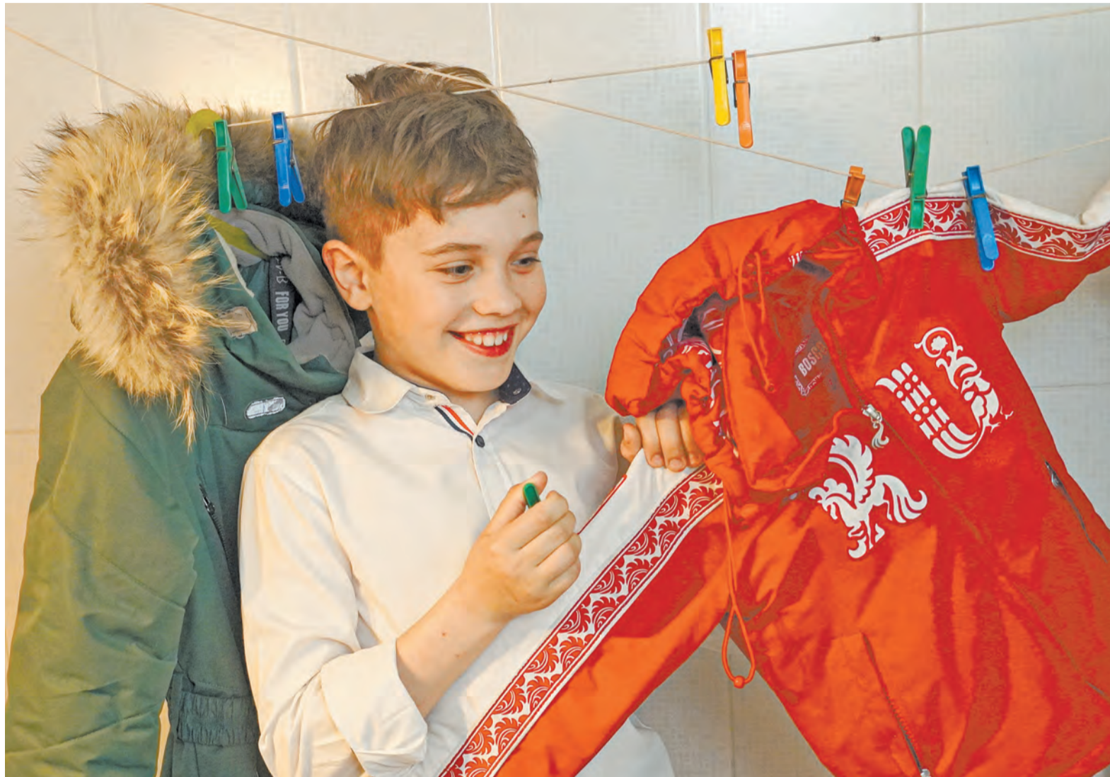
После стирки пуховика его лучше всего сушить в вертикальном виде.

– Если вещь имеет загрязнения, не обойтись без предварительного воздействия на пятна. Всем рекомендую иметь в арсенале обычное хозяйственное мыло. Им можно натереть исключительно загрязненные места, оставив в сухом виде всю остальную куртку, и спустя час без всяких предварительных полосканий