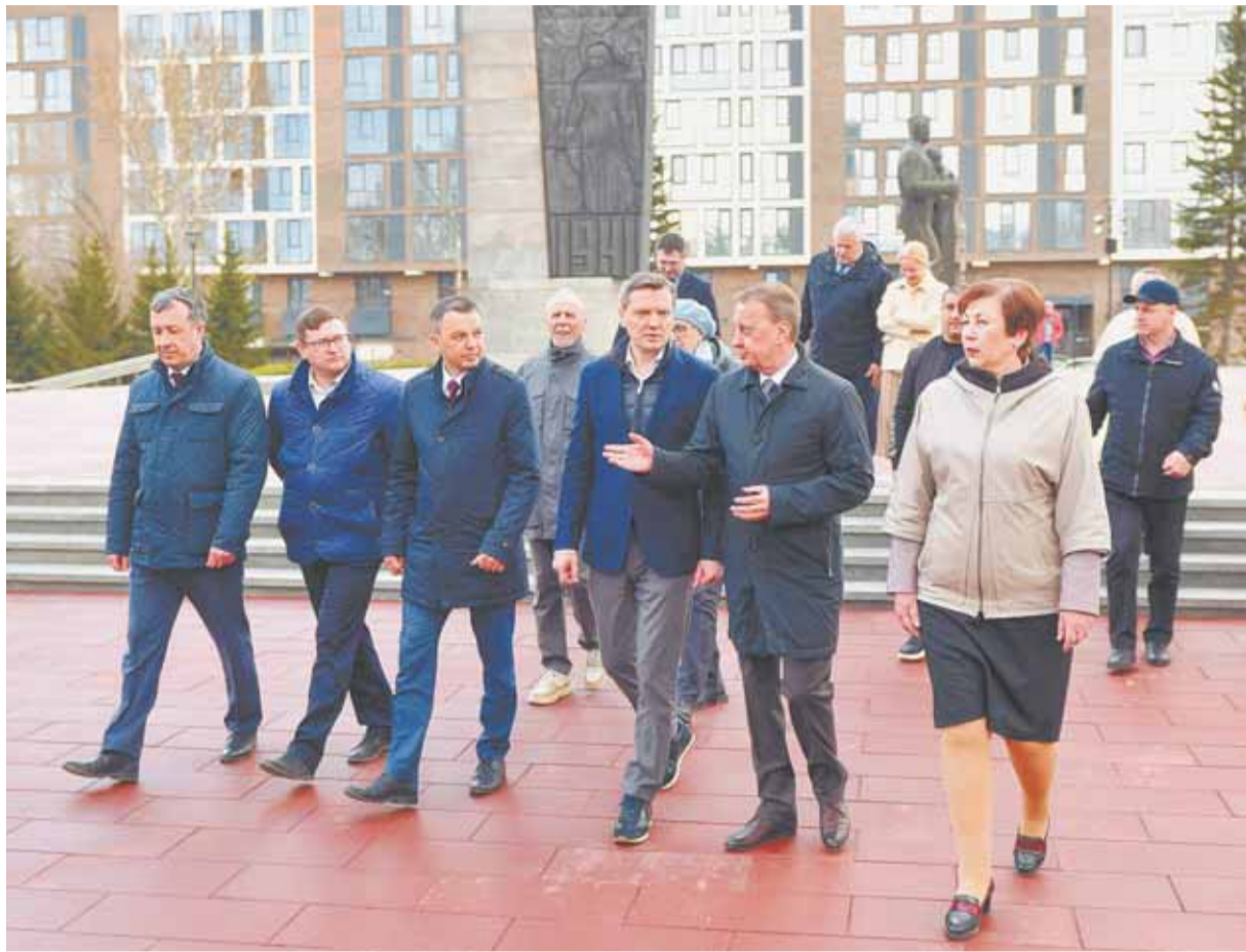
Мемориал Славы практически готов к проведению мероприятий, посвященных юбилею Победы.