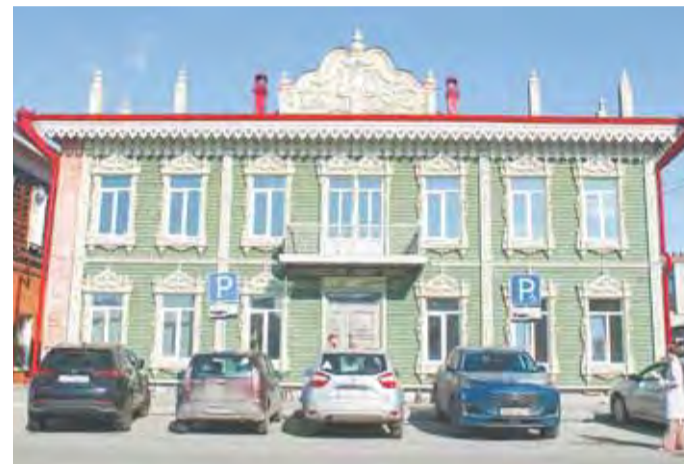
Архитектурные памятники Барнаула становятся полезными и интересными пространствами.