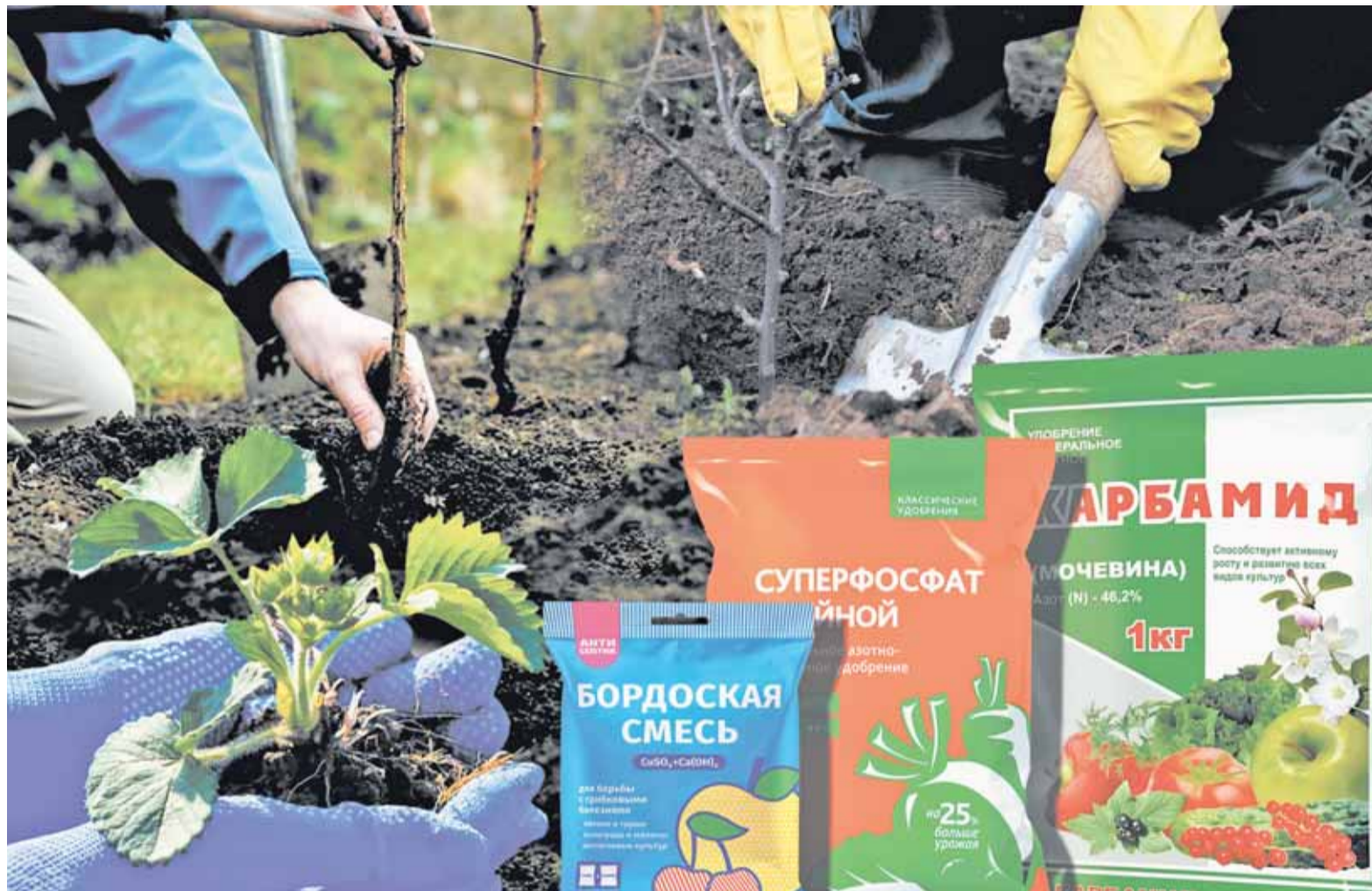
Коллаж Александра ЕРМОЛОВИЧА

Нельзя выращивать близко друг к другу растения, имеющие общих вредителей или болезни. Например, бутоны малины и земляники повреждает один и тот же малинно-земляничный долгоносик, а стебли и листья земляники и флоксов — стеблевая нематода.