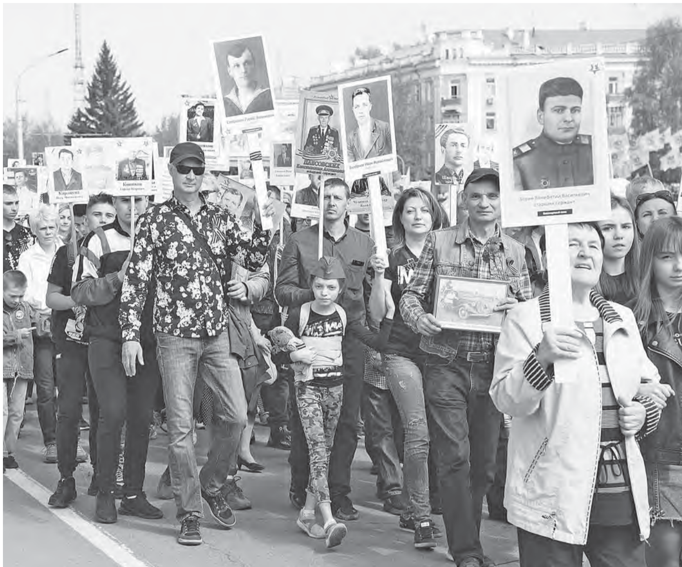
«Бессмертный полк» – акция-шествие в память о героях-участниках Великой Отечественной войны.

Как будет организовано шествие «Бессмертного полка» в Барнауле