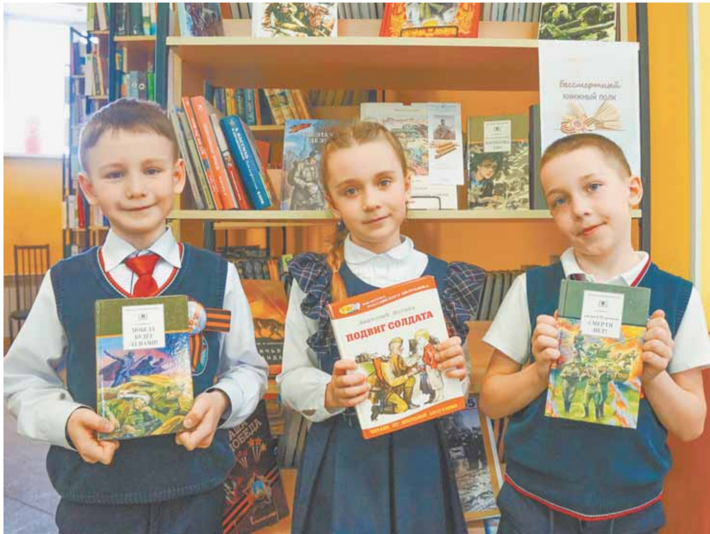
Учащиеся 1 «Б» лица № 73 в этот день не только познакомились с новыми книгами, но и пели песни и рисовали Победу.

Ребята, чтобы стать читателем библиотеки, нужно прийти туда с папой или мамой. Пусть взрослые возьмут паспорт. На вас оформят читательский формуляр, и любую понравившуюся книгу вы сможете брать домой на несколько дней для прочтения.