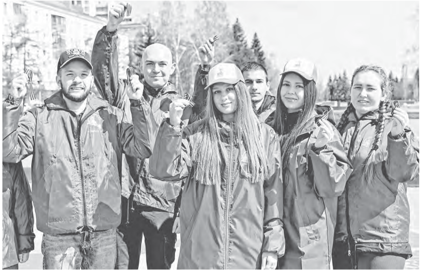
Георгиевская лента ведет свою историю от XVIII века, в 1941 году была возрождена под названием «Гвардейская лента», а с 2022 года защищена законодательно как один из символов воинской славы России.