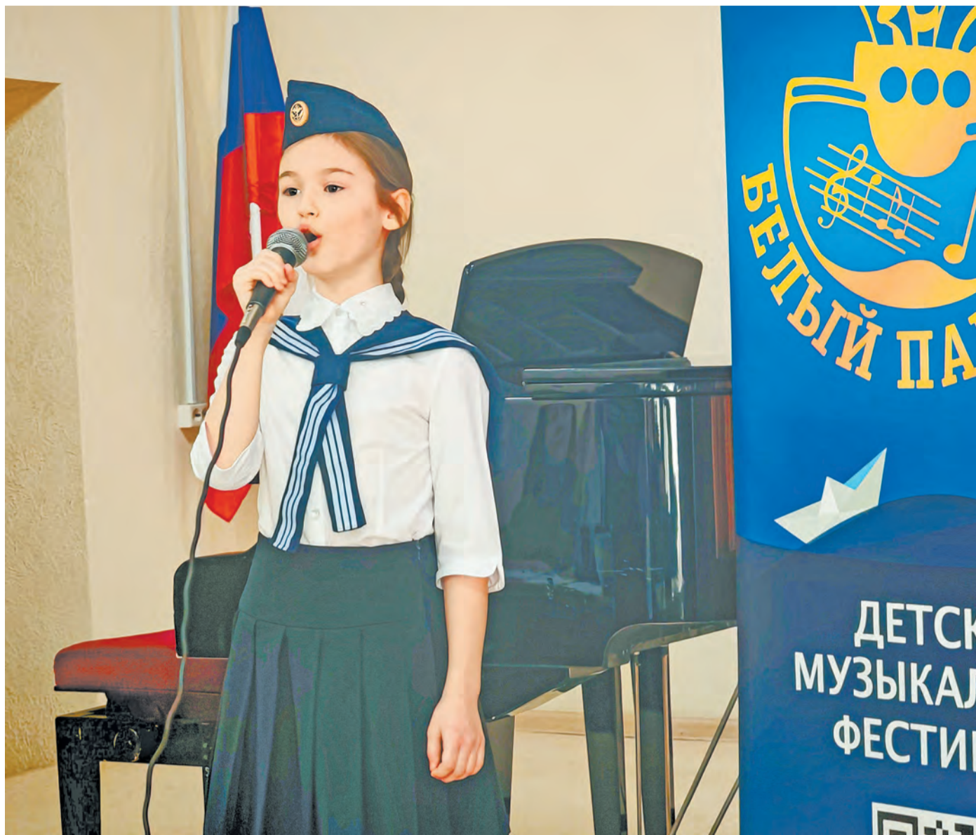
Имена детей, прошедших в следующий этап, будут известны в конце апреля.