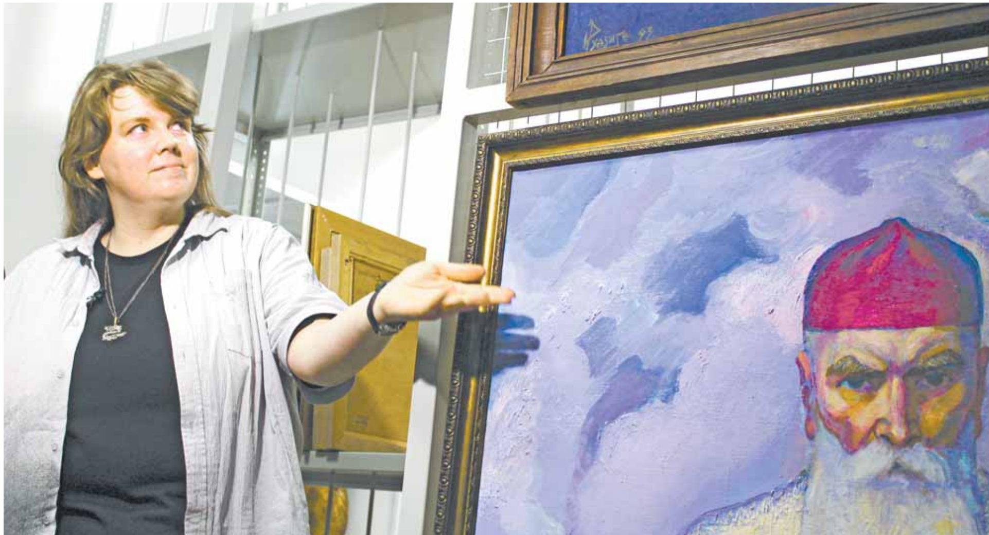
Теперь живописные полотна будут храниться в ГМИЛИКА в специальных выдвижных системах.