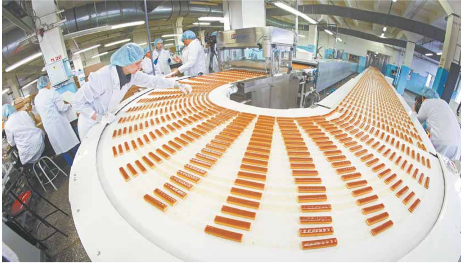
40 118 детей города Барнаула получат губернаторские подарки.

Состав сладких наборов меняется год от года, однако некоторые кондитерские изделия в них входят постоянно на протяжении нескольких лет. Например, глазированное печенье, которое является хитом продаж.