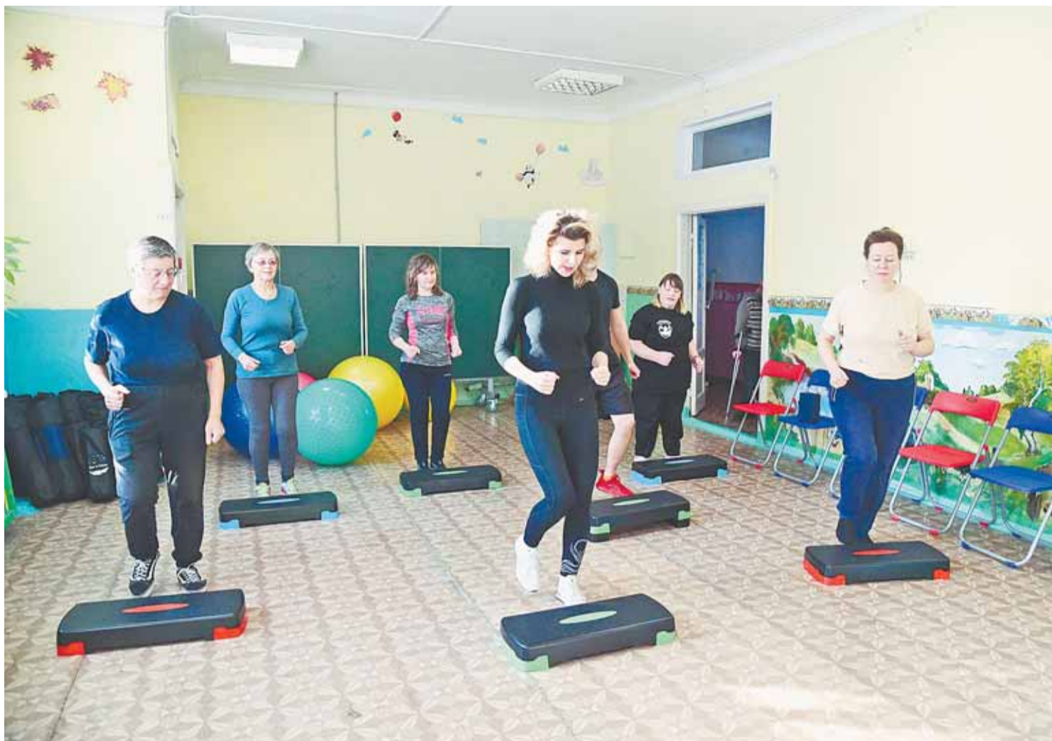
ФОКИ «Инваспорт» уже давно не просто тренажерный зал, а многопрофильный спортклуб.

Более 50 барнаульцев с инвалидностью занимаются на постоянной основе в клубе «Инваспорт». В понедельник, среду и пятницу с 14 до 17 часов на ул. Профинтерна, 37, – свободное посещение, можно заниматься по личному плану. Во вторник, четверг и субботу с 10 до 15 часов проводятся организованные тренировки по настольному теннису, настольному керлингу и бочча, адаптивному фитнесу.