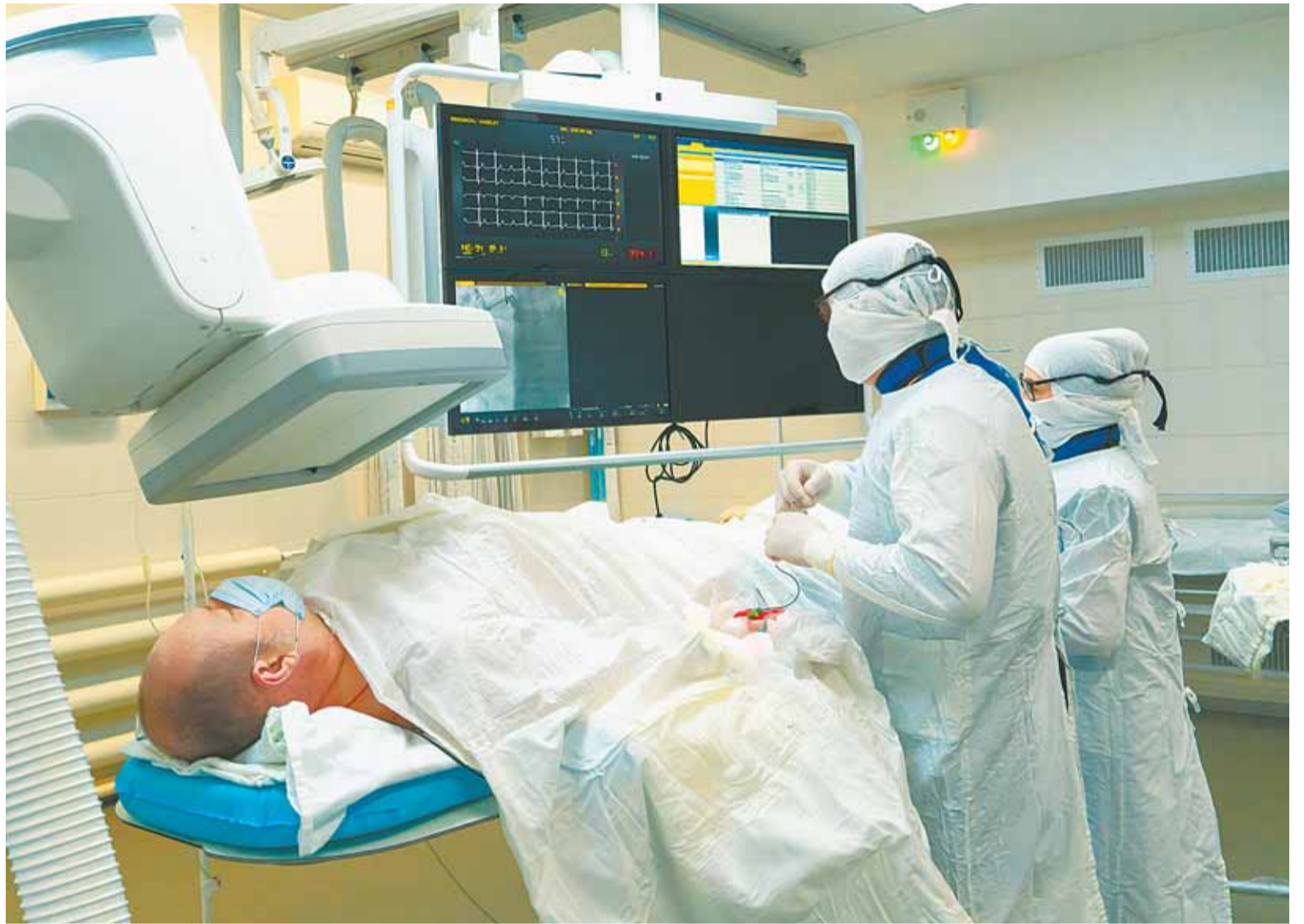
Ангиографический рентгеновский комплекс помогает врачам диагностировать и эффективно лечить многие патологии.

За год в больнице провели более 700 диагностических и лечебных рентген-хирургических операций. Специалистам помогает в этом современное и очень точное оборудование – рентген-ангиографический комплекс, который создает максимальную визуализа-