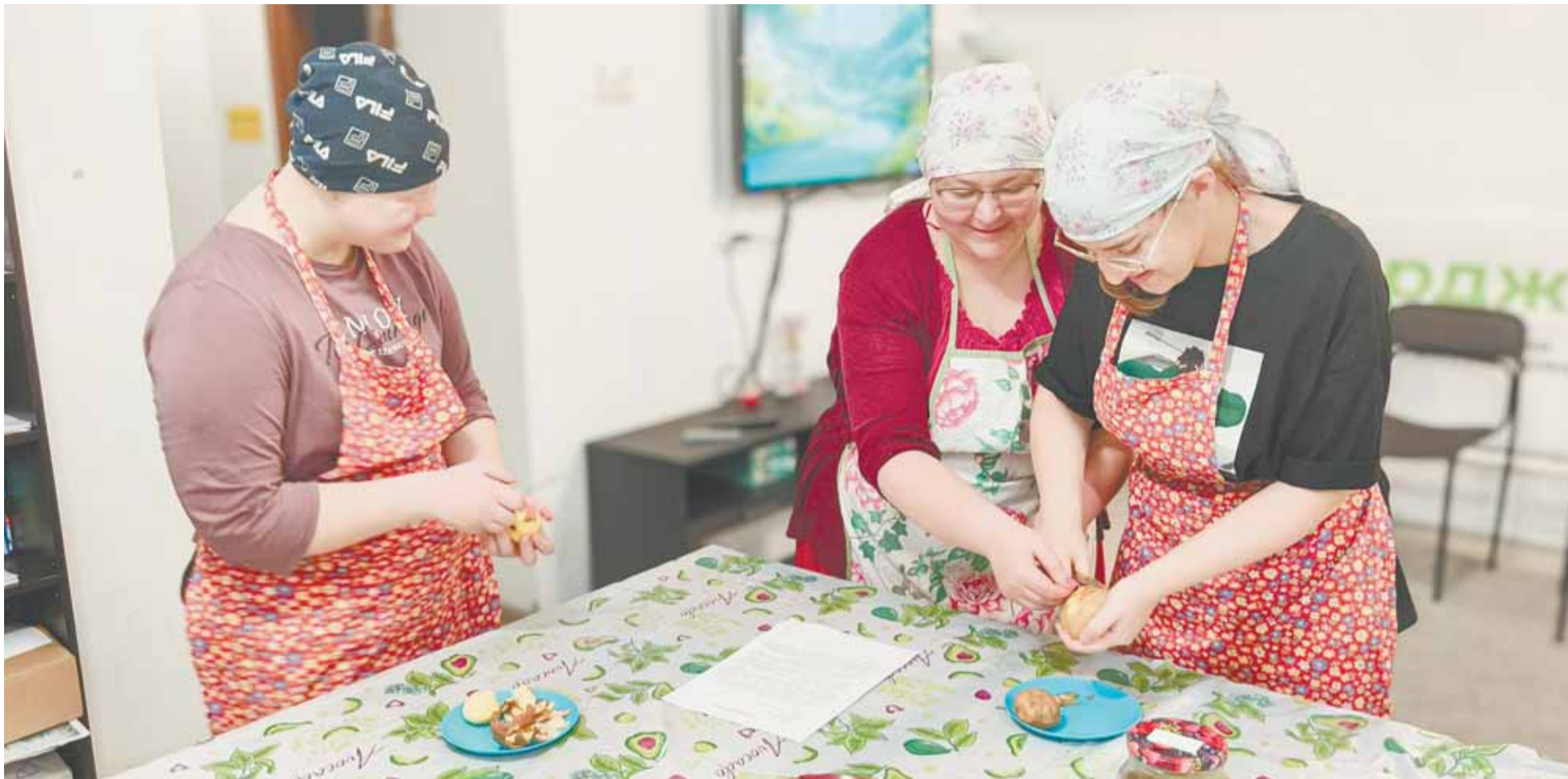
Отработка навыков идет зачастую при помощи метода «рука в руке», когда куратор направляет каждое движение подопечного.