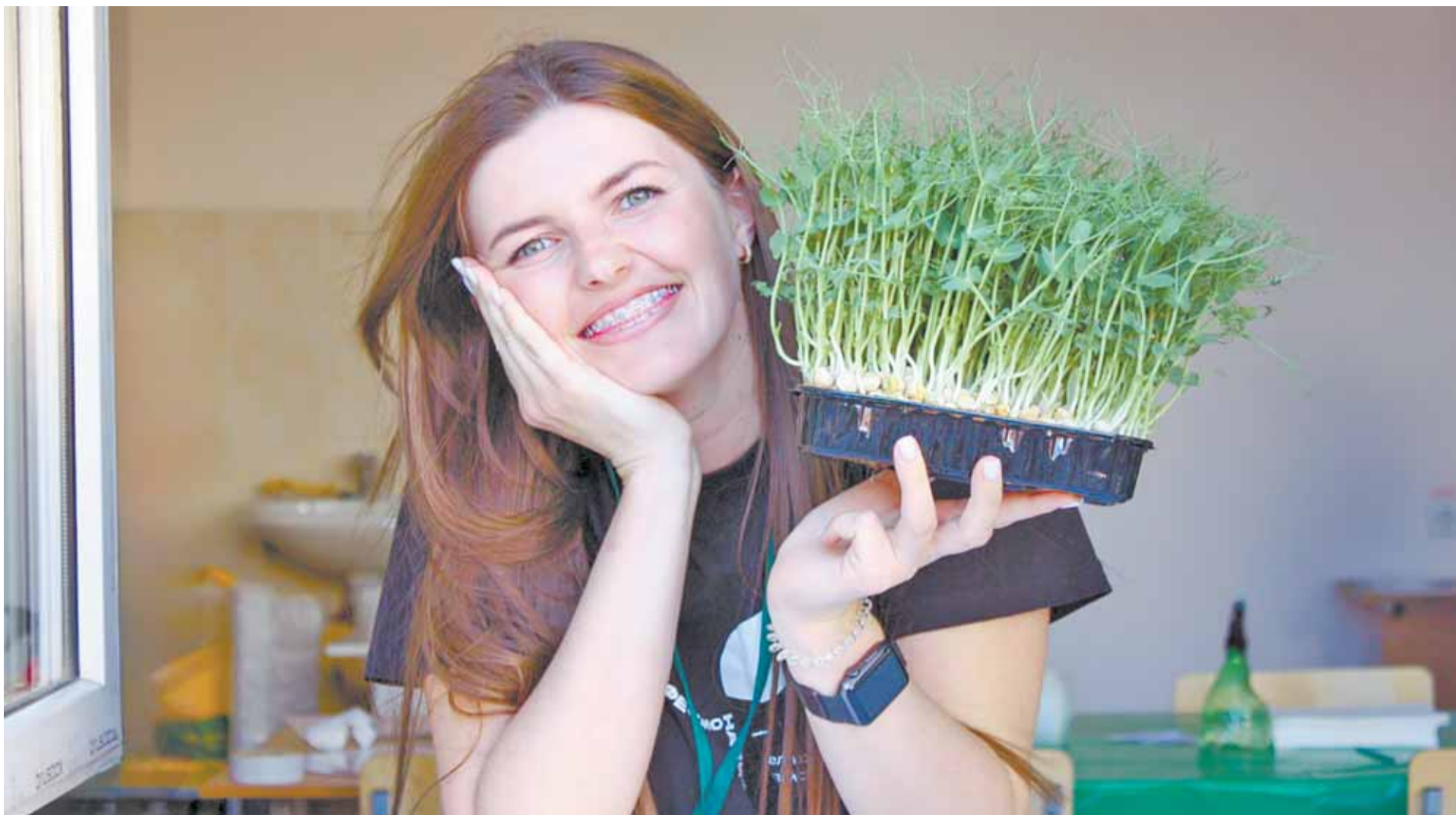
Микрозелень гороха успевает вырасти за пару недель.