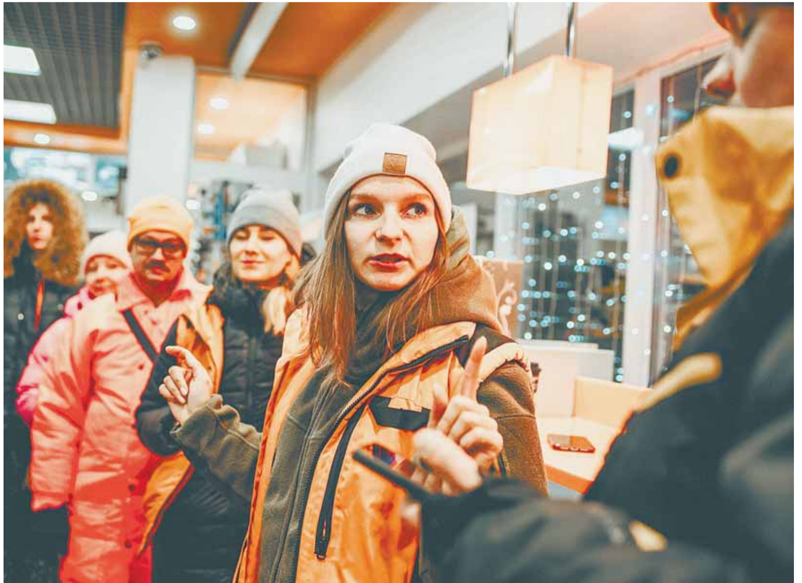
Каждый выезд волонтеров стартует с инструктажа.