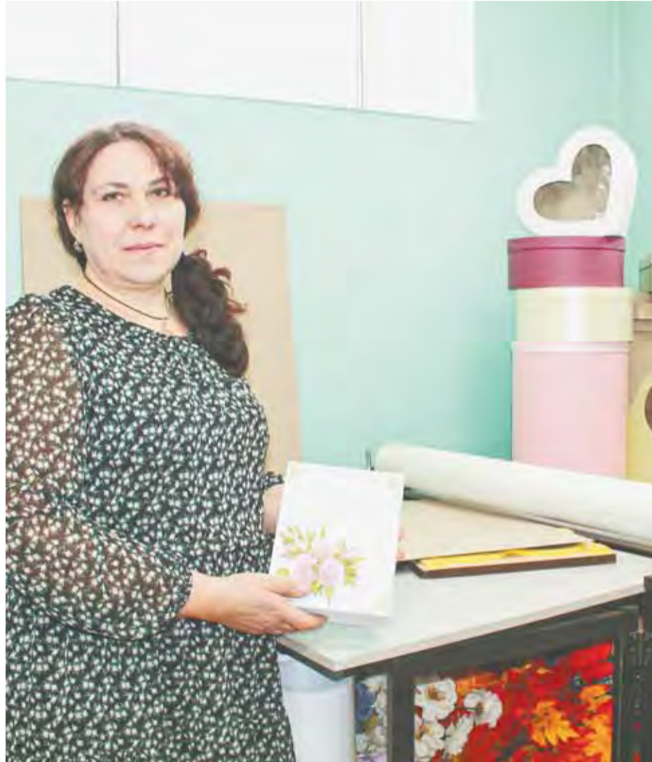
Соцконтракт позволяет превратить увлечение в работу.