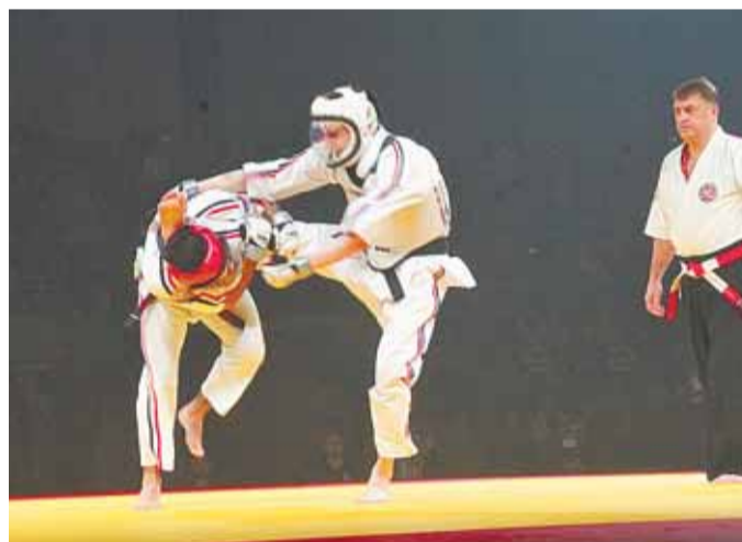
Хозяева зала подтвердили силу алтайских единоборств.