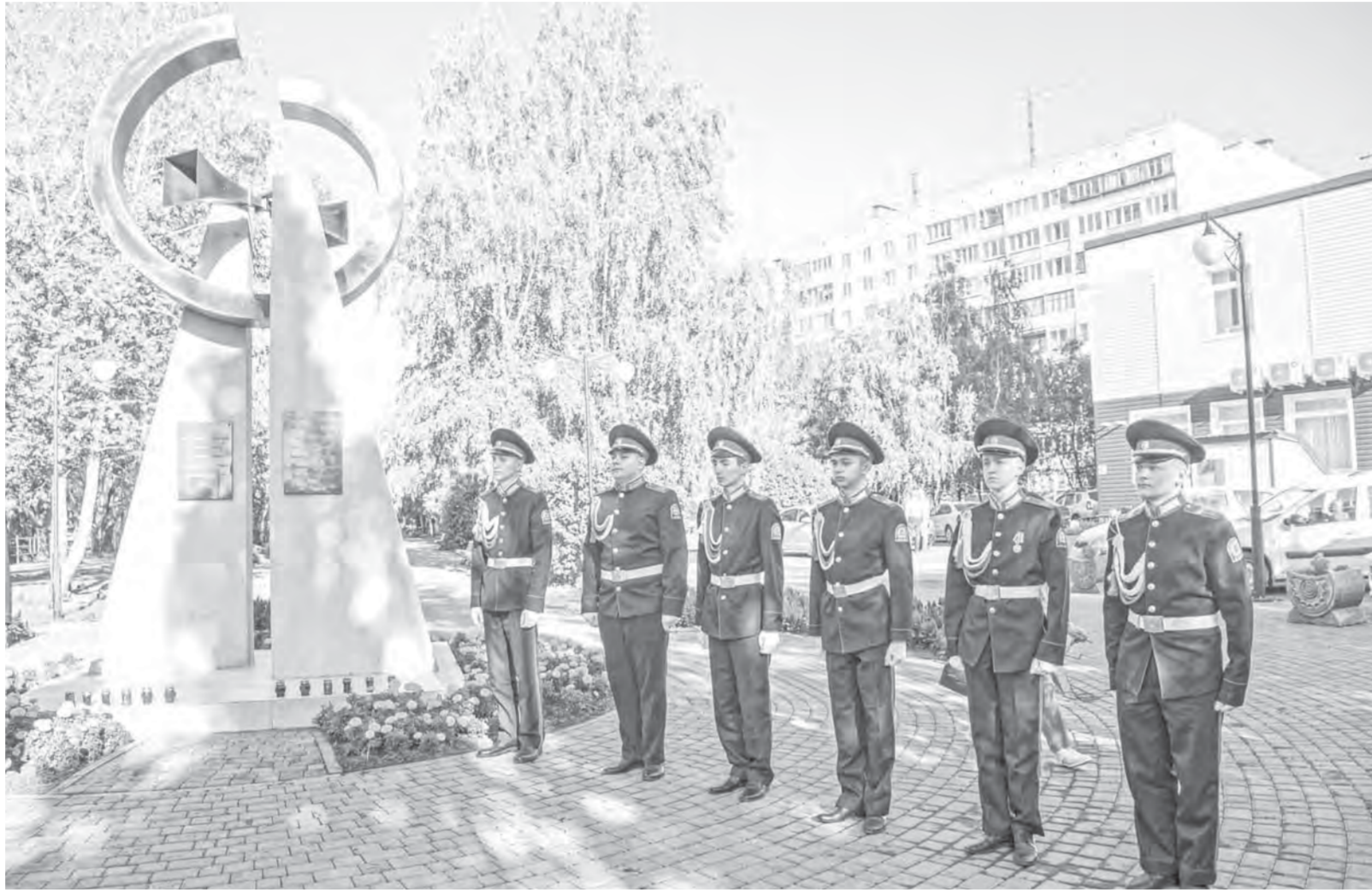
У памятника на Ленинградской аллее регулярно проходят митинги.