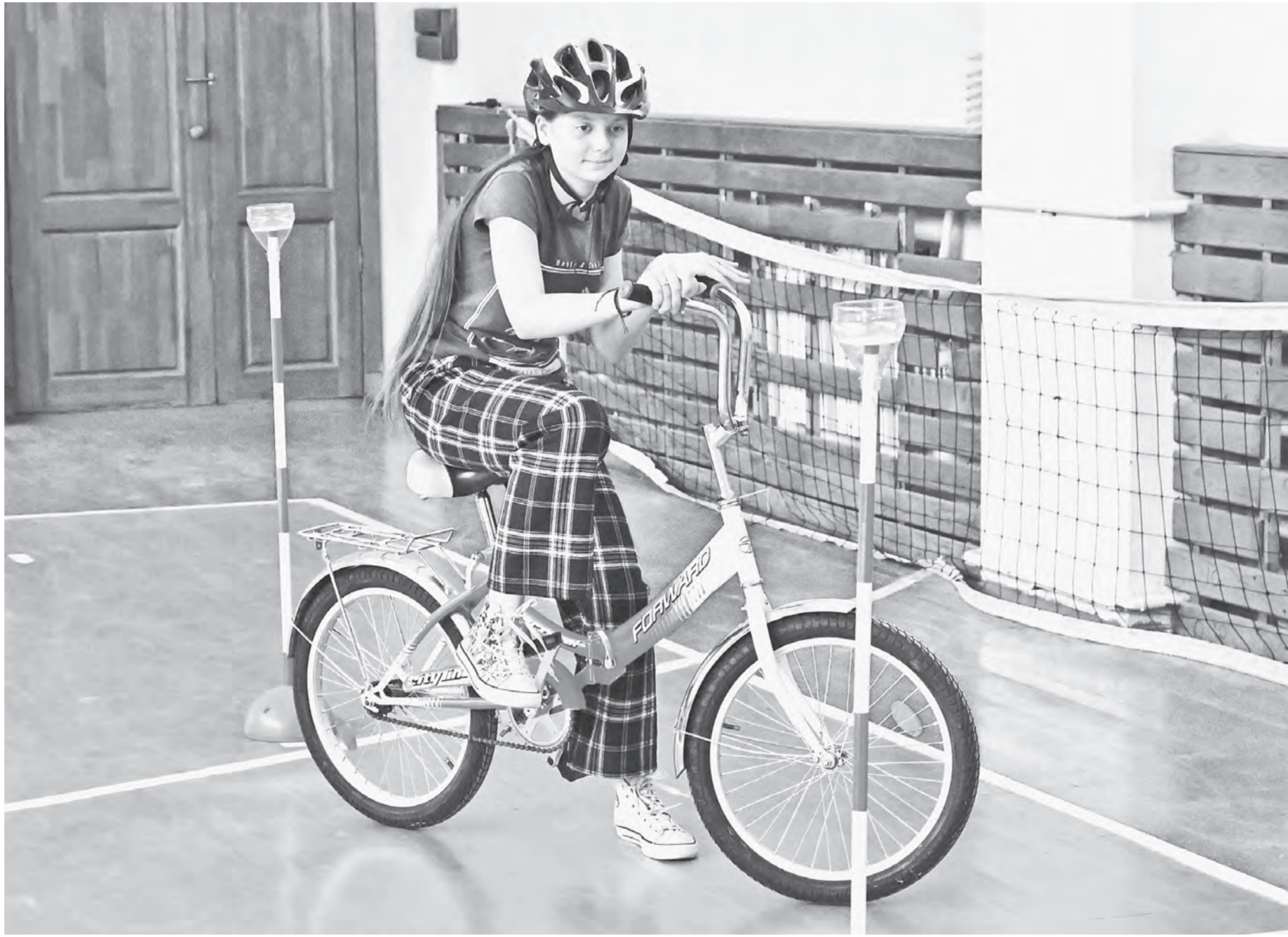
Фигурное вождение велосипеда – один из самых зрелищных этапов соревнований.