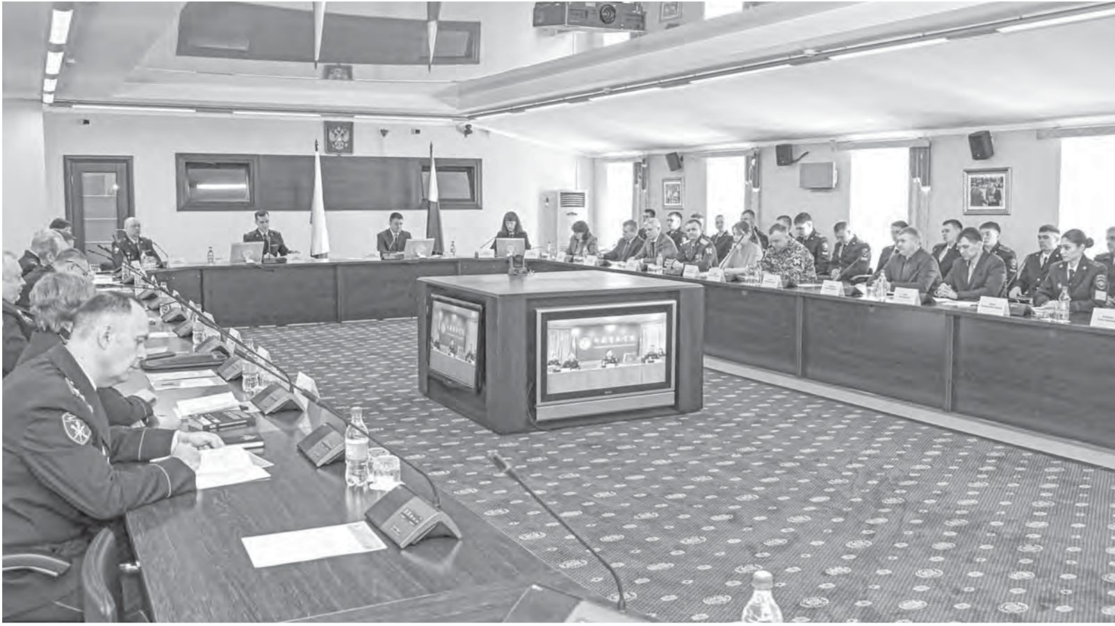
Барнаульский юридический институт МВД России ежегодно выступает организатором международной конференции, посвященной актуальным аспектам противодействия экстремизму.

– За последние два-три года были террористические преступления, в которых оказались замешаны несовершеннолетние: начиная от ложных звонков о минировании объектов, вплоть до уничтожения вертолетов, – отметил в сво-