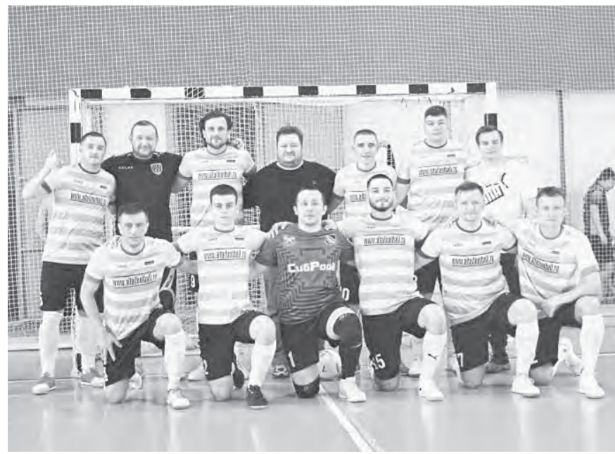
«АлтПолитех» планирует вернуться в профессиональный футзал.