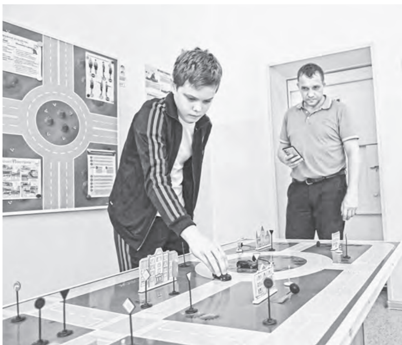
Автогородок помогает на практике закрепить ПДД.

67 отрядов ЮИДД из пяти районов Барнаула приняли участие в трехдневных состязаниях юных инспекторов «Безопасное колесо – 2025».