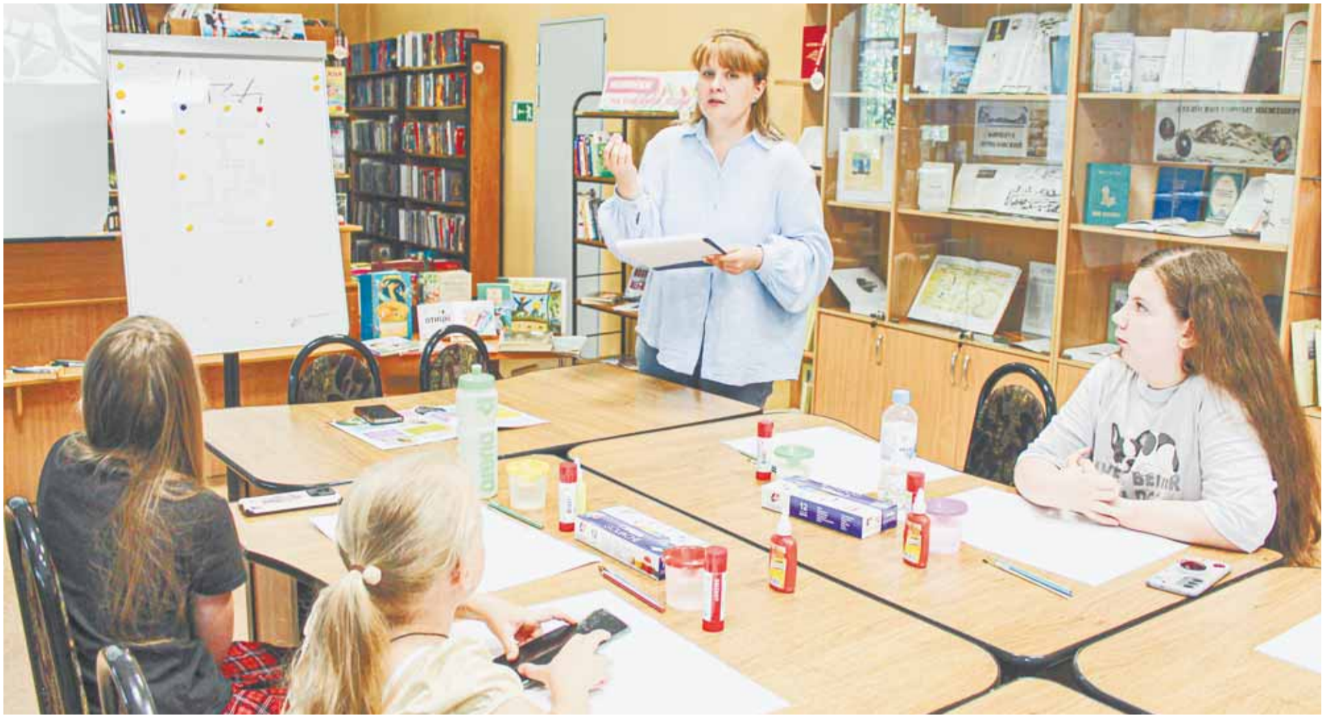
В библиотеке № 36 объединили активный и познавательный формат занятий.