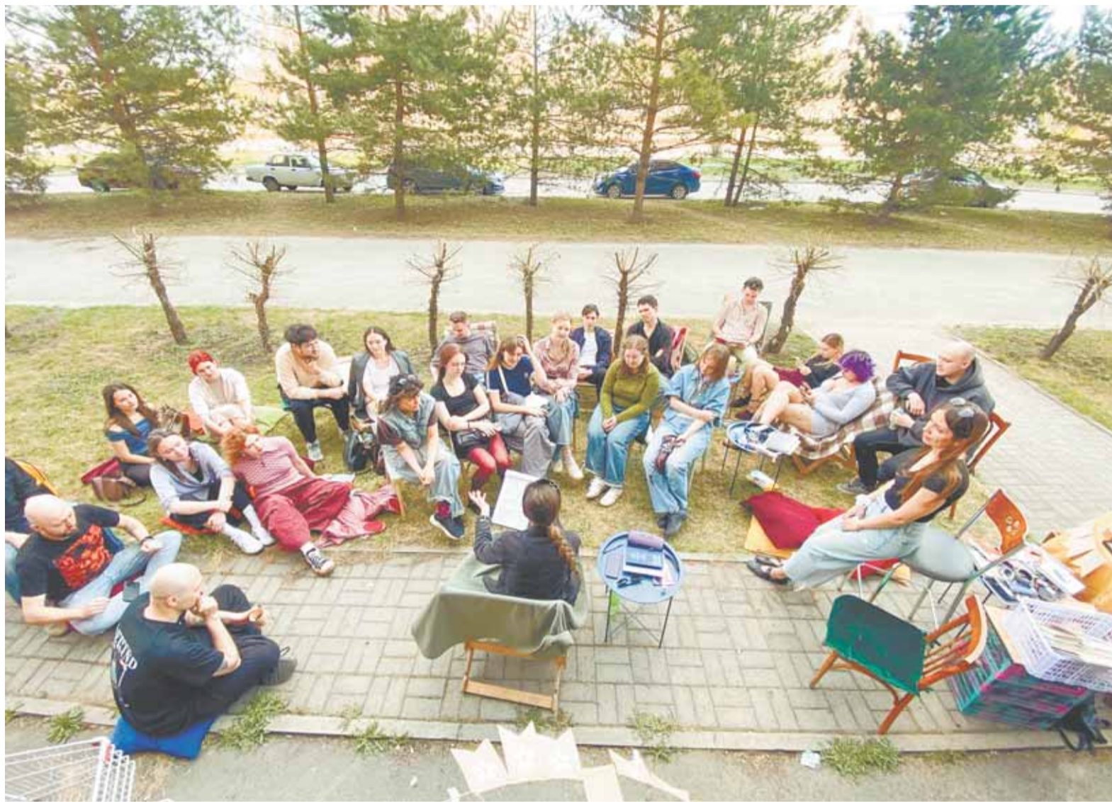
Более пятидесяти событий включены в программу третьего «РомФеста».

Книжный фестиваль «РомФест» пройдет 28 июня в парке «Изумрудный» (пр. Комсомольский, 128). Подробнее о фестивале можно узнать на его странице во «ВКонтакте».