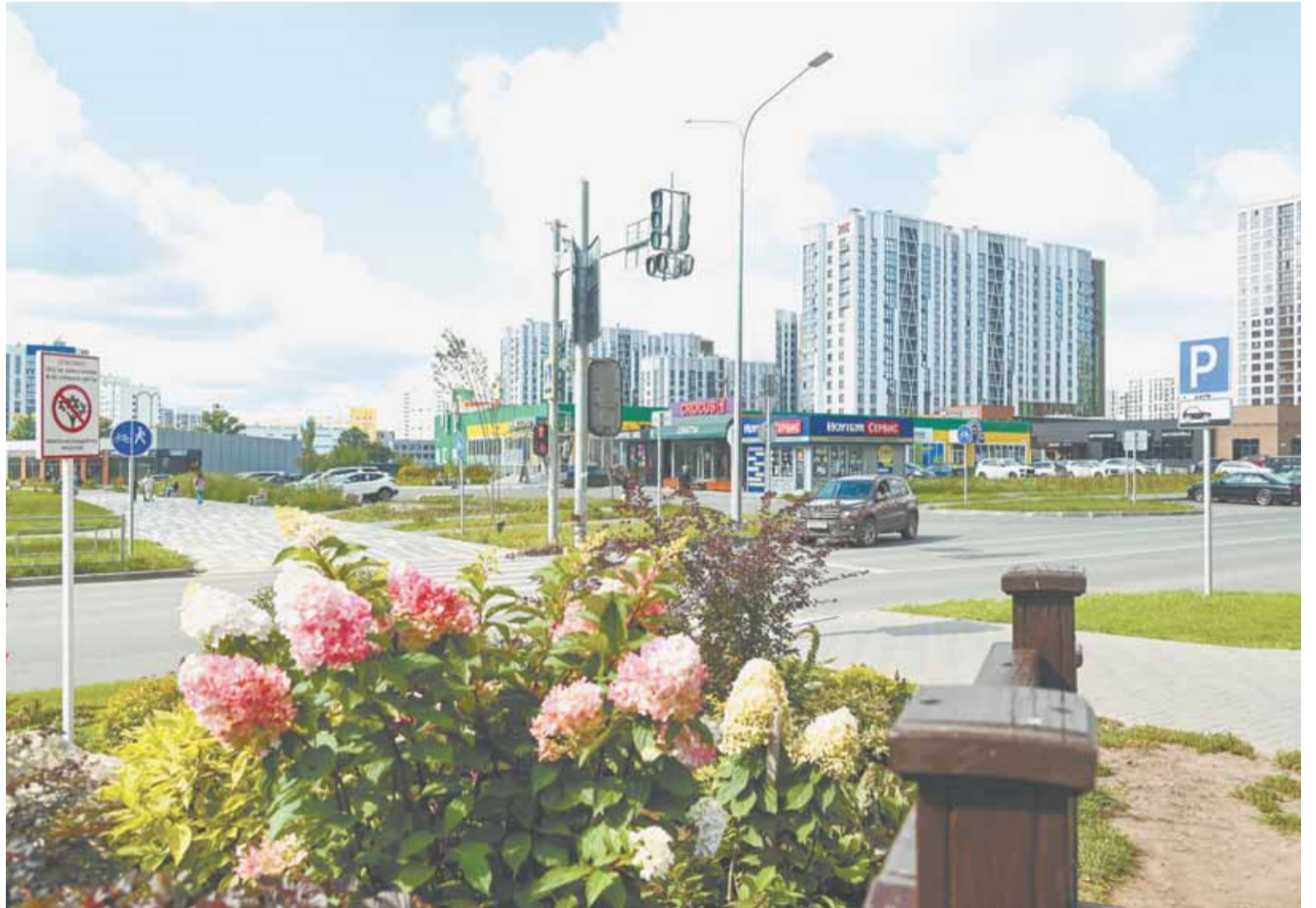
Изменения в Правила благоустройства призваны сделать жизнь барнаульцев более комфортной.

В Правилах отдельно прописан порядок действий при аварии. В экстренной ситуации собственник объектов