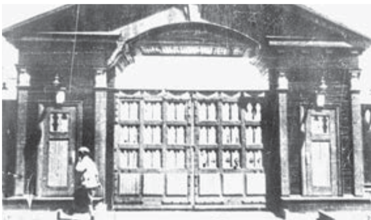
Проходная завода № 77 (Трансмаш). 1950-е гг.