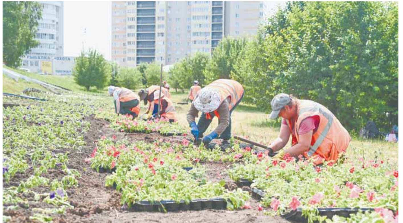
Клумба в цветах российского флага – одна из самых ярких в Барнауле.

В Барнауле продолжают высаживать цветы на городских клумбах