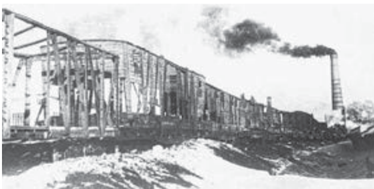
Вагоны, побывавшие в огне ВОВ. Первая половина 1940-х гг.