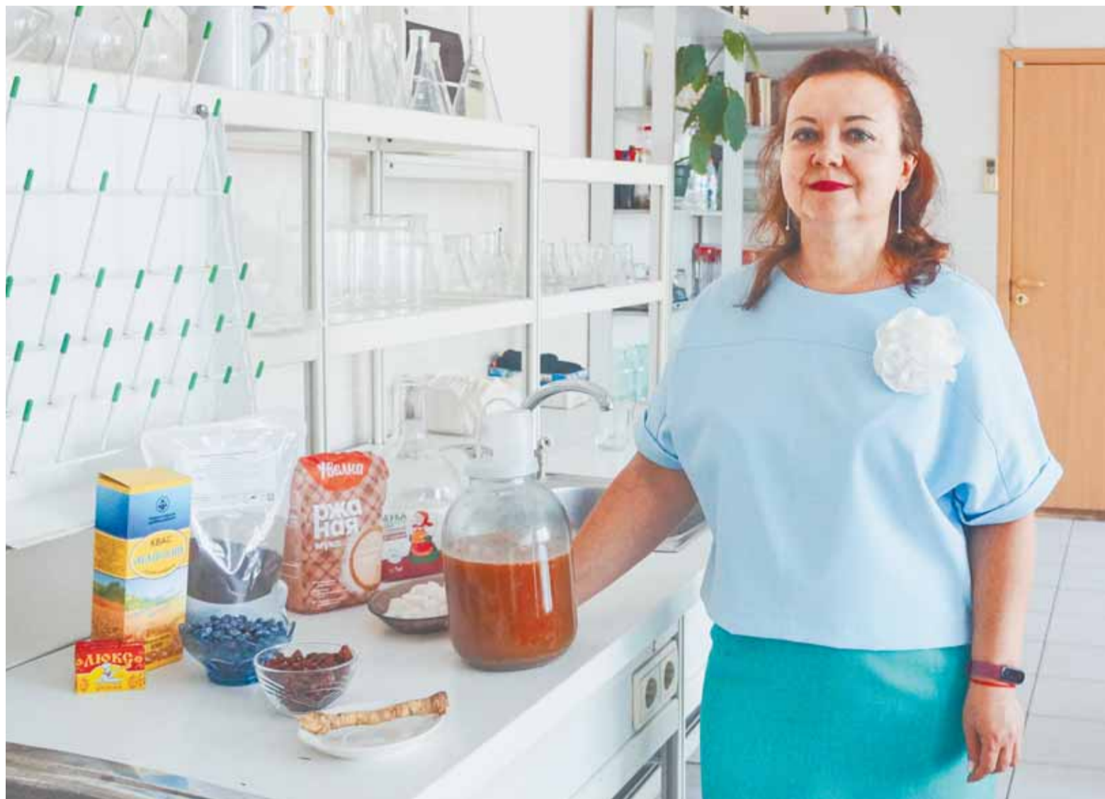
Для производства кваса нужны сахар, сухой квас, солод и другие добавки.