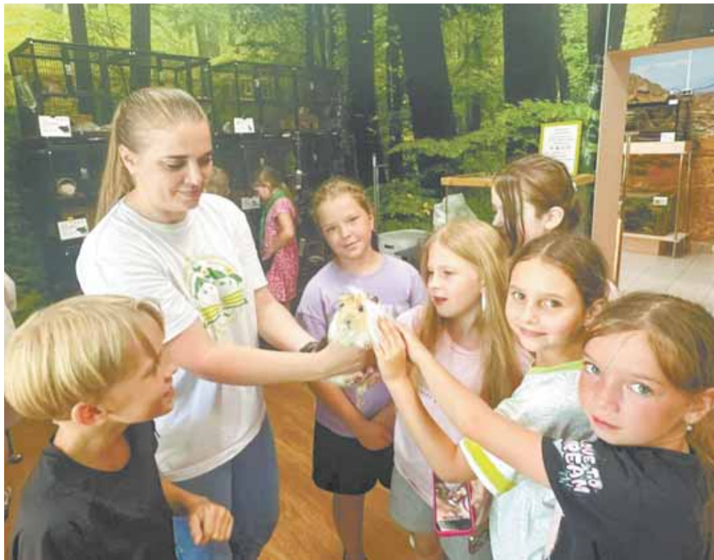
Ребята познакомились с питомцами станции и узнали о них много интересного.

— Правила благоустройства — это не свод пожеланий, а полноценный нормативный документ, за нарушение которого установлена конкретная ответственность. Размеры штрафов дают административным комиссиям необходимый инструментарий. Важно, чтобы и граждане, и организации понимали: парковка на газонах, несанкционированные раскопки, брошенный после спила мусор — это не просто неудобство для соседей, а правонарушение с вполне осязаемыми последствиями для кошелька. Принятые изменения в правила благоустройства теперь подкреплены действующими нормами краевого закона, и эта связка должна работать на опережение — чтобы порядок поддерживался не страхом штрафа, а осознанием неотвратимости наказания за его нарушение.