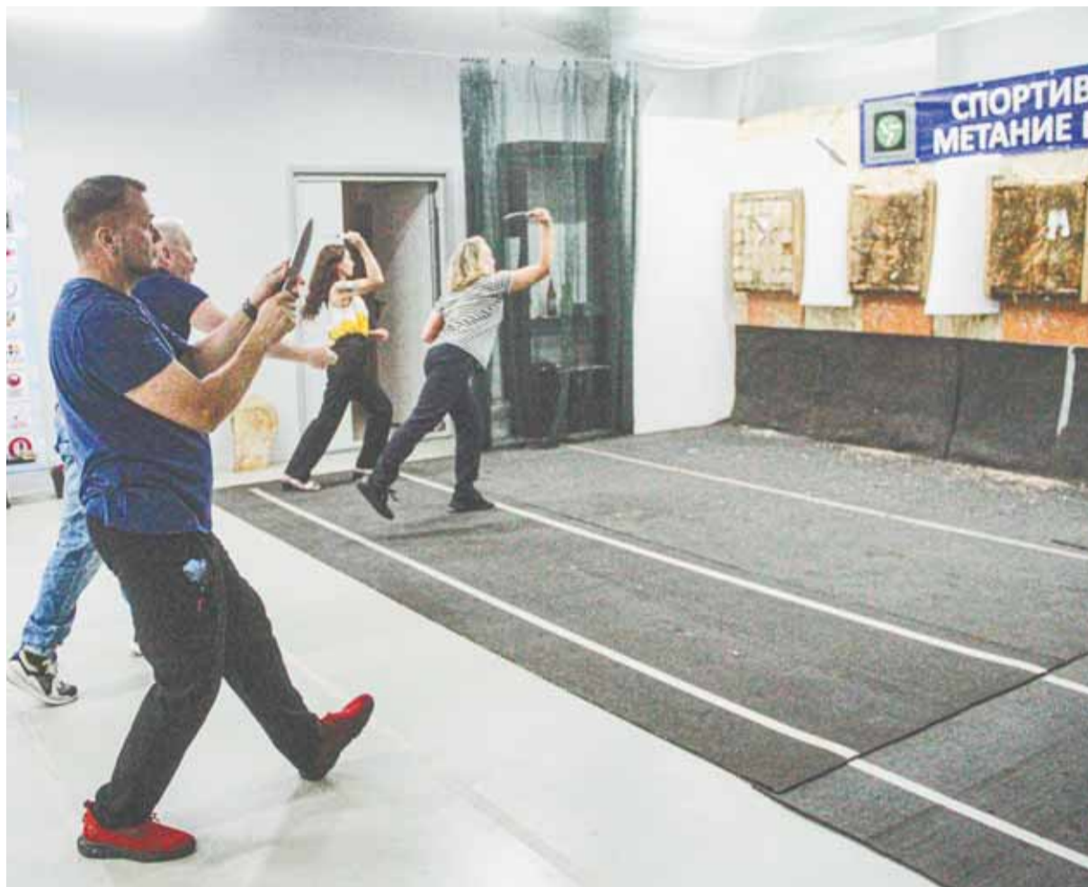
Метание ножа – спорт, доступный всем.

Правила, как в большинстве стрелковых или метательных видов спорта, обычные: кто набрал больше баллов, то есть попаданий как можно ближе к центру, тот выиграл. Есть дисциплина метания на дальность и на скорость.