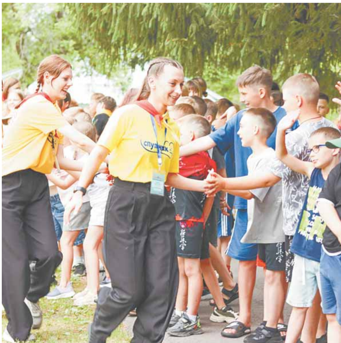
В первую смену в барнаульских лагерях отдыхают более 1200 ребят.

К слову, лагерь отдыха «Дружных» первым принял ребят. В день старта их ждала игра – знакомство с территорией. Отряды при помощи карты прошли квест и изучили лагерь. Вечером состоялся творческий интерактив и «Огонек знакомств». Подобные интересные события ждали ребят во всех семи лагерях.