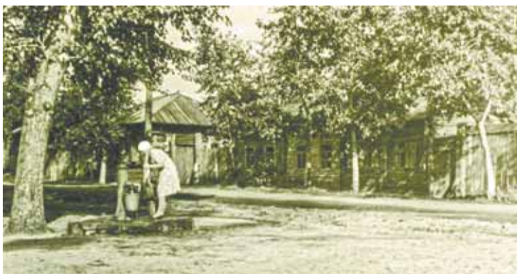
У городской колонки. Из фотоальбома Л.И. Борисенко. «Барнаул – жизнь». 1950 г.