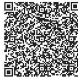
Карта официальных пляжей и открытых бассейнов города Барнаула.

– Под нашим наблюдением находятся 25 несанкционированных мест для купания. Там размещены знаки «Купаться запрещено», а также информационные щиты с цифрами, показывающими количество погибших на конкретных участках водоемов.