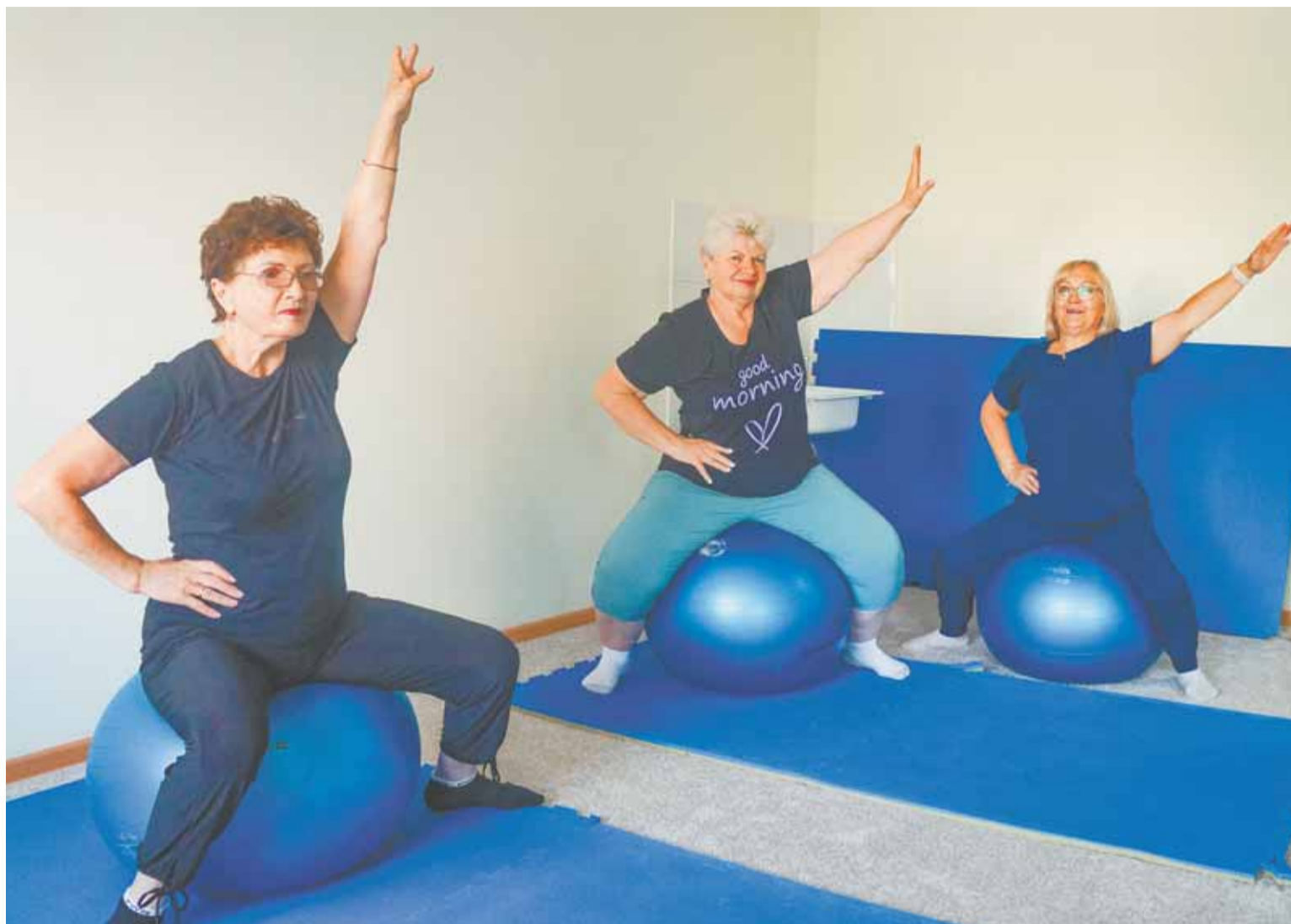
Курс занятий в зале составляет две недели, после этого полезные упражнения можно будет продолжать выполнять дома.

График работы зала ЛФК на ул. Сиреневой, 9, корпус 2: понедельник — пятница с 8:00 до 16:00 (обед с 12:00 до 12:30), суббота — воскресенье — выходные. При себе иметь паспорт, полис ОМС, СНИЛС. Предварительная запись на занятия по телефону: 42-70-19.