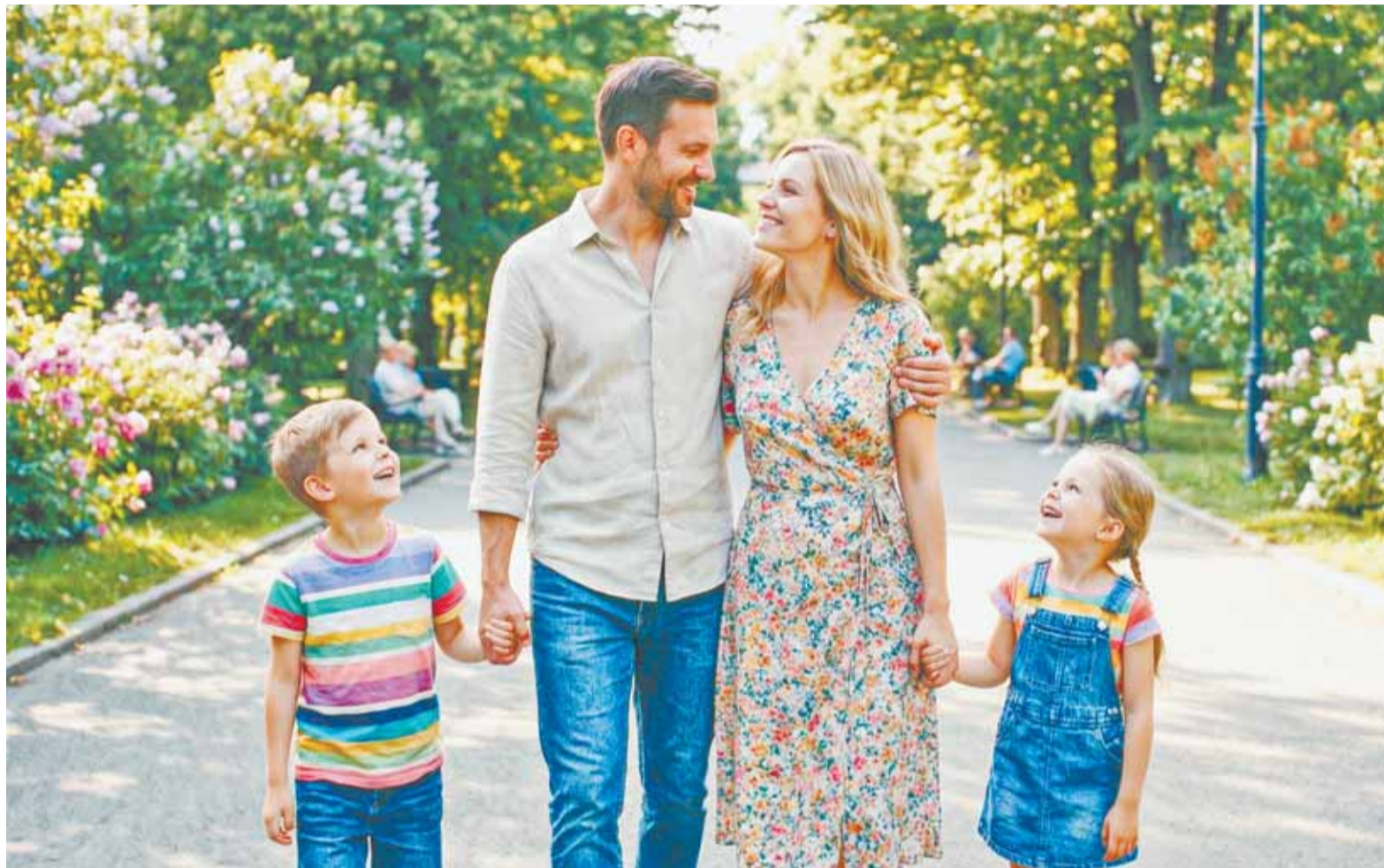
Коллаж Александра ЕРМОЛОВИЧА

Для получения выплаты родители должны являться гражданами РФ, постоянно проживающими в стране. Двое или более детей должны быть несовершеннолетними (или, если они обучаются очно, то младше 23 лет).