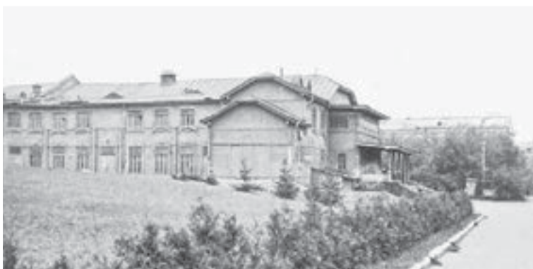
Клуб железнодорожников. Здесь был пункт сбора и отправки воинов на фронт.