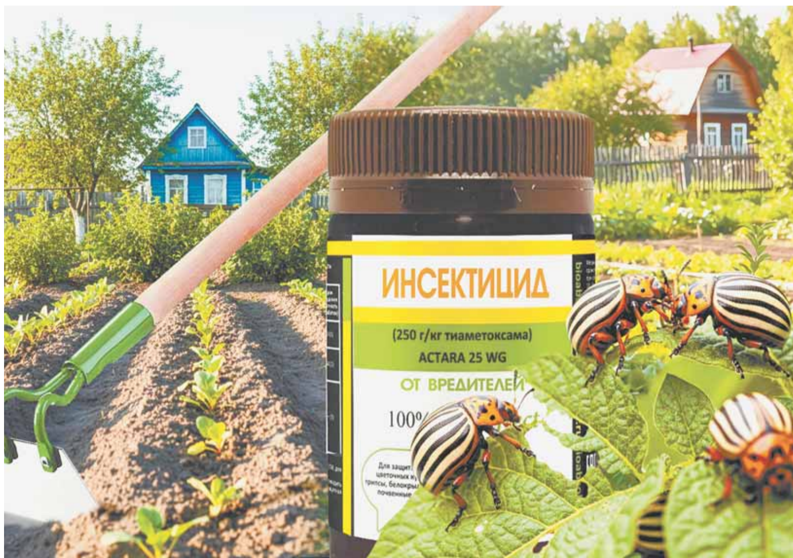
Коллаж Александра ЕРМОЛОВИЧА

Большинство садоводов уже перешли на предпосевную обработку картофеля от колорадского жука. Остальным приходится периодически обходить посадки, собирая полосатика. Утомительному занятию есть альтернатива: обработать картофельную плантацию при наличии вредителя препаратами «Актара», «Актарис», «Тиамед». Только важно выбрать время так, чтобы по прогнозу впереди на пару дней ожидалась сухая погода, чтобы до достижения эффекта наши усилия не смыло дождем.