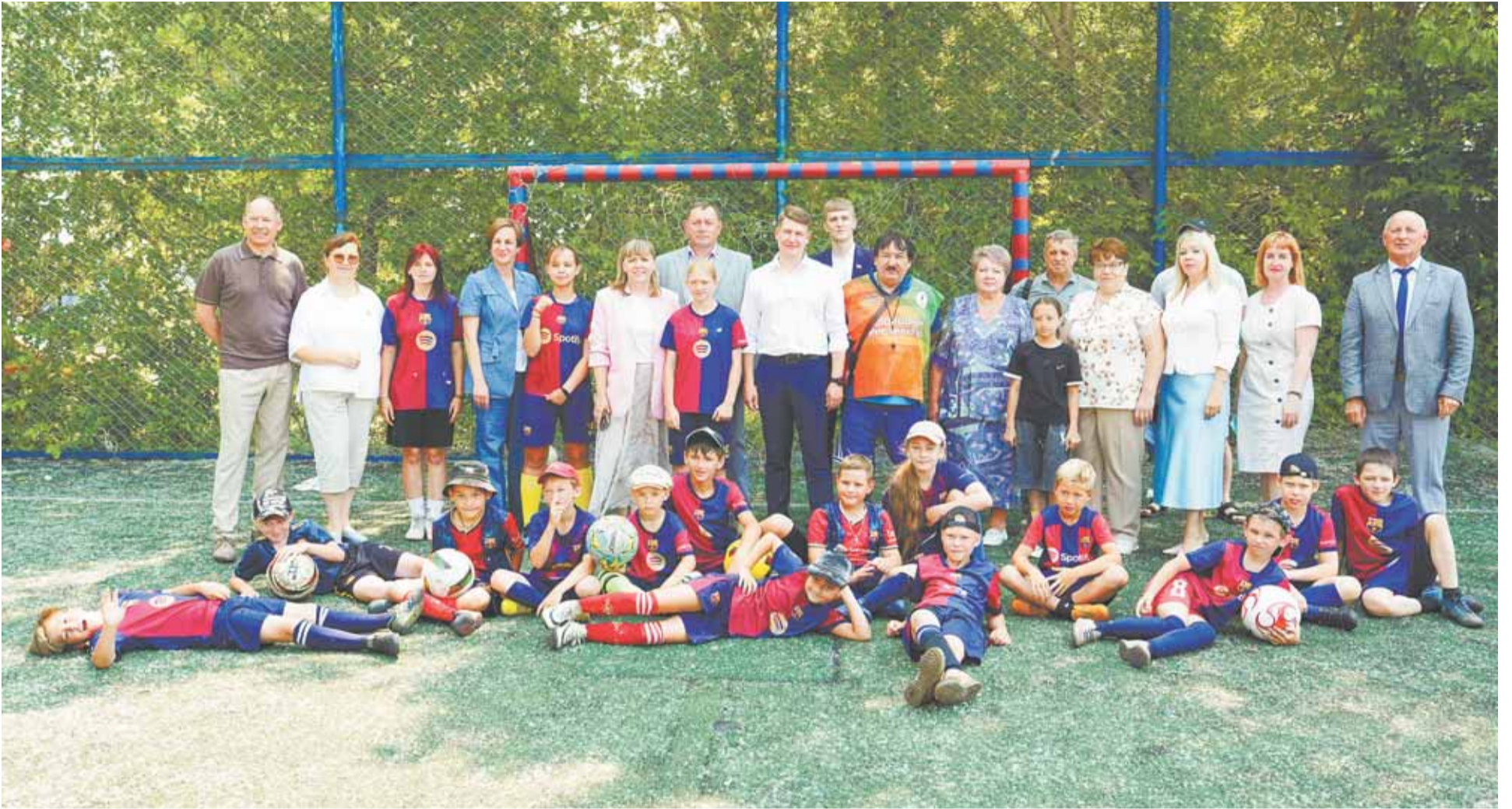
Проект «Дворовый инструктор» дает детям большие возможности для роста.