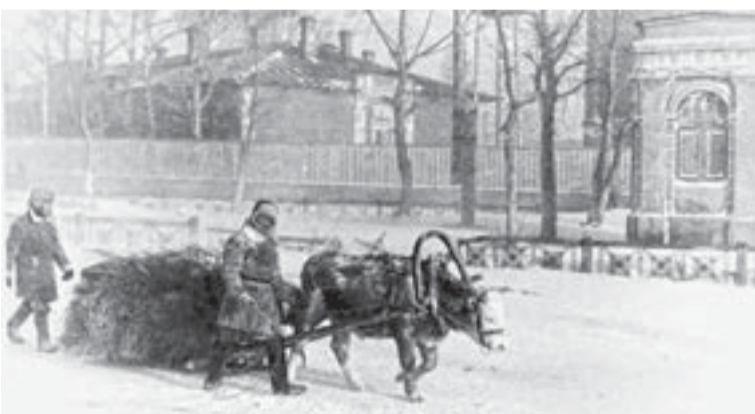
Проспект Ленина. Первая половина 1940-х гг.