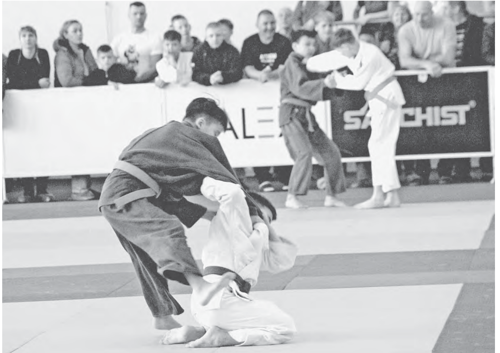
«Лига Патриотов» – соревнования не только силы, но и характера.

«Лига Патриотов» предусматривает не только соревнования на татами, но и патриотические акции. В Барнауле перед зданием спорткомплекса АУОР развернули полевую кухню, а в фойе работала выставка оружия и обмундирования. В середине соревновательного дня для спортсменов провели урок мужества.