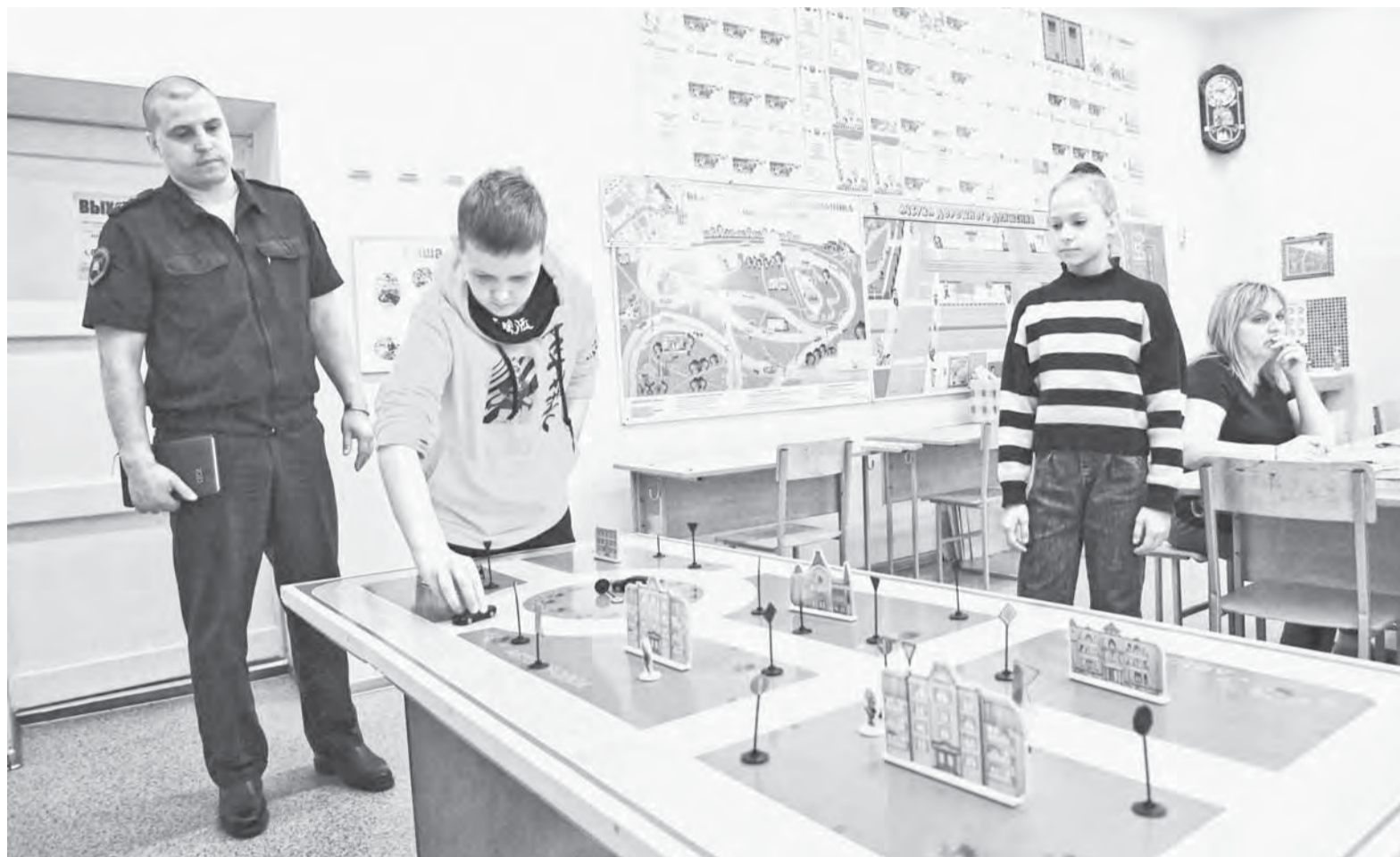
На следующей неделе в Барнауле проведут отборочные соревнования среди юных инспекторов дорожного движения.

Традиционно на каникулах пройдет множество спортивных состязаний, в том числе