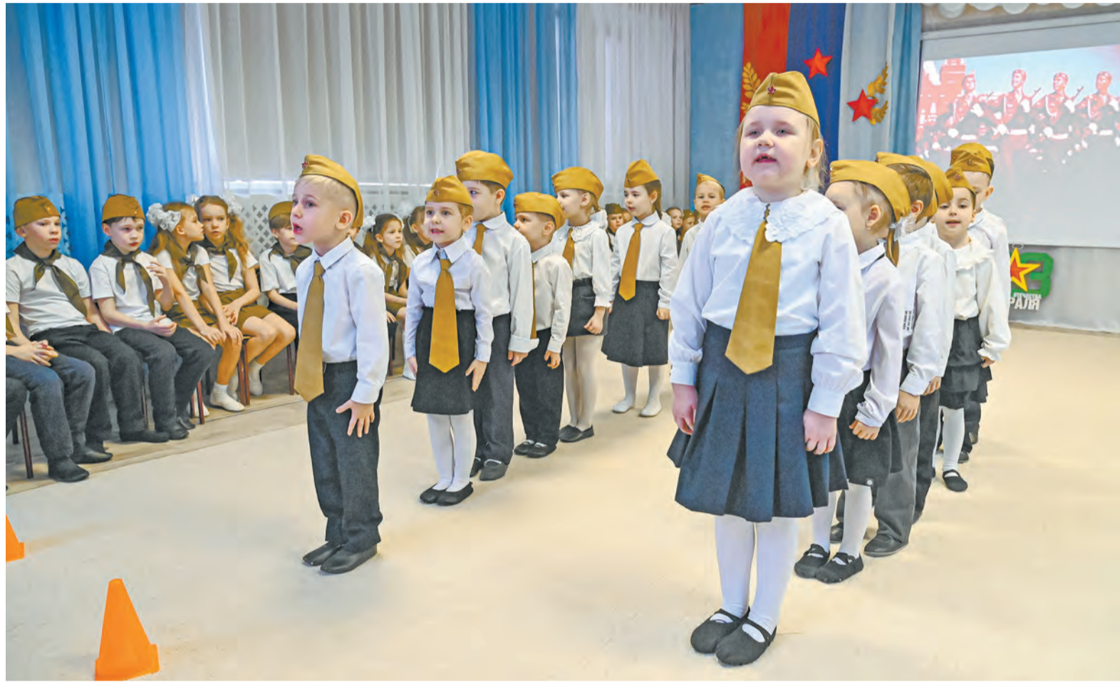
В подготовке к патриотическим мероприятиям в садах активно участвуют родители, погружая детей в тему, готовя костюмы.

Педагоги акцентируют: малышам не так важны слова, как поступки значимых взрослых – родителей,