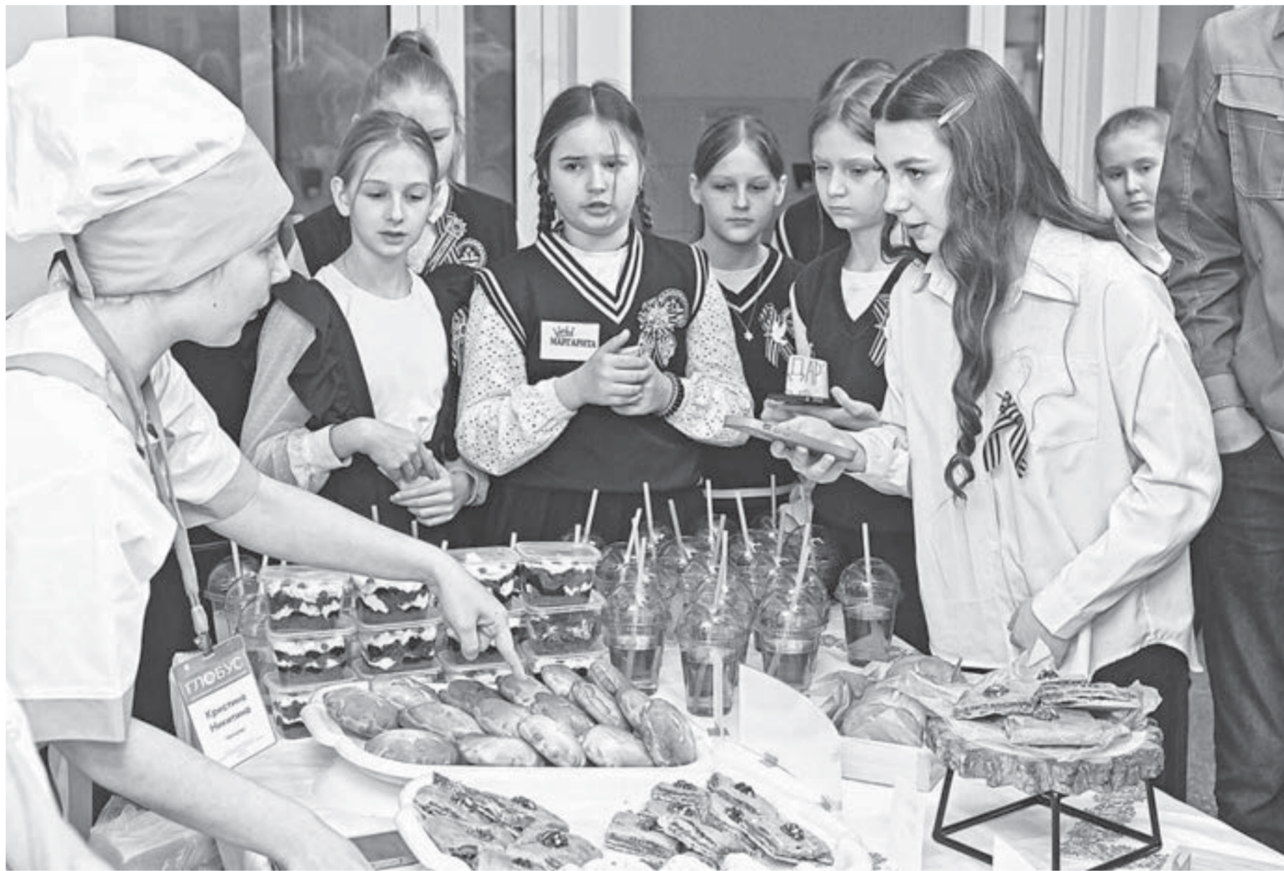
Школьники с удовольствием попробовали блюда разных народов.

В Барнауле прошел фестиваль национальных кухонь «Гастрономическое наследие народов России»