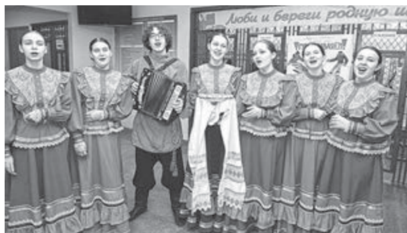
Творческий номер от студентов педколледжа.

– Наш техникум уже 70 лет готовит специалистов в области поварского и кондитерского дела. Недавно в рамках программы этнической мобильности к нам приехали восемь студентов и педагогов из Казахстана: мы провели мастер-классы и обменялись опытом. Особенно приятно, что этот проект совпал с «ПрофДебютом» – мероприятием, посвященным воспитанию подрастающего поколения. Так мы укрепляем связи между народами и чтим