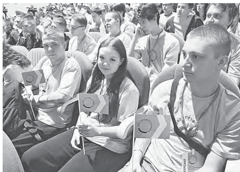
До конца недели конкурсанты будут демонстрировать свое мастерство.

Чемпионат «Профессионалы» – уже традиционное событие в сфере образования. Его востребованность среди школьников, студентов, педагогов-наставников и индустриальных партнеров растет, а значит, программа требует своевременных изменений.