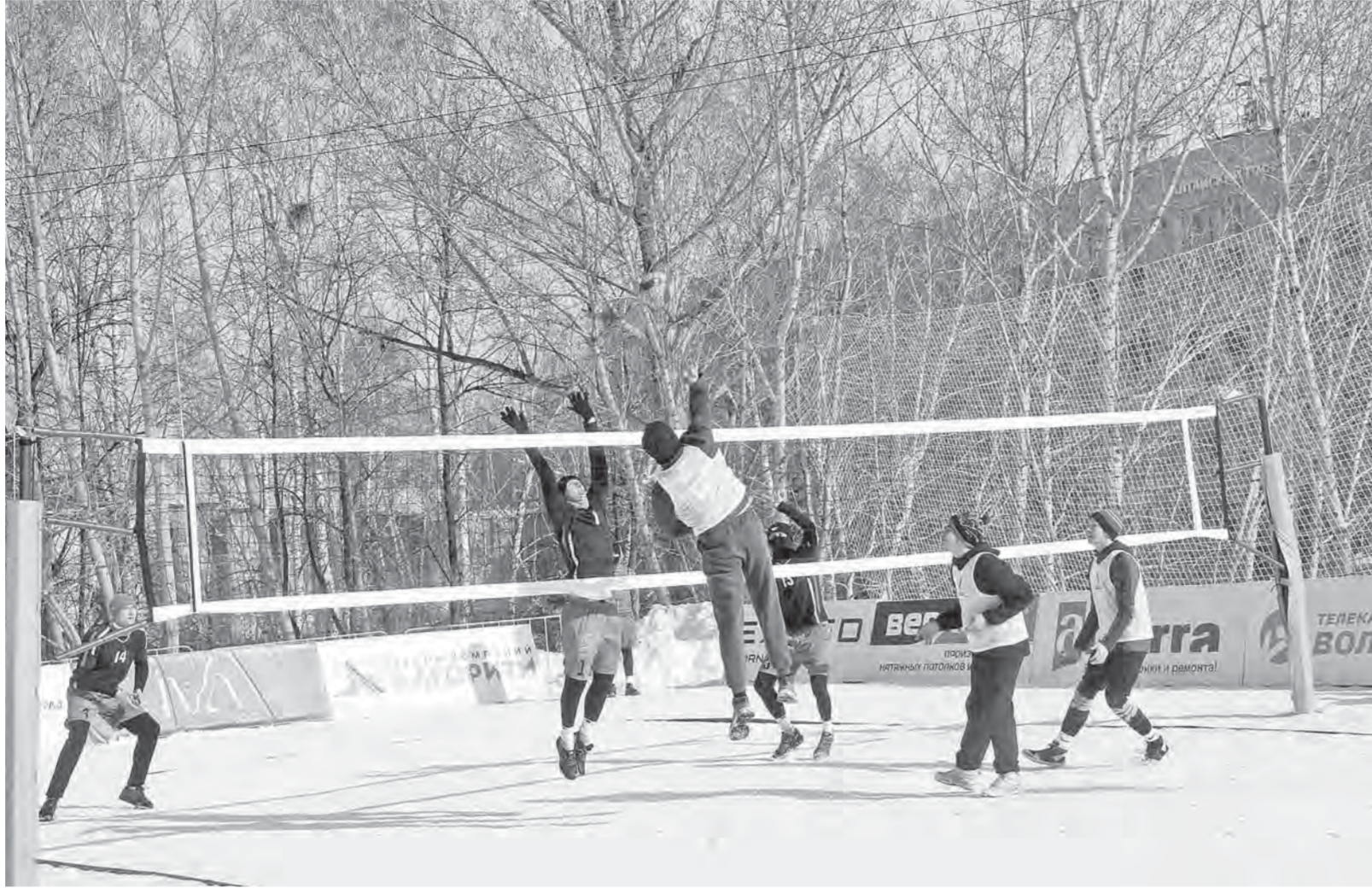
Барнаульские волейболисты привыкают к новой для себя дисциплине.

При этом если в «пляжке» в команде два человека, то здесь – три плюс один запасной. В каждом сете возможны две замены. Отличается и мяч, который имеет другое покрытие