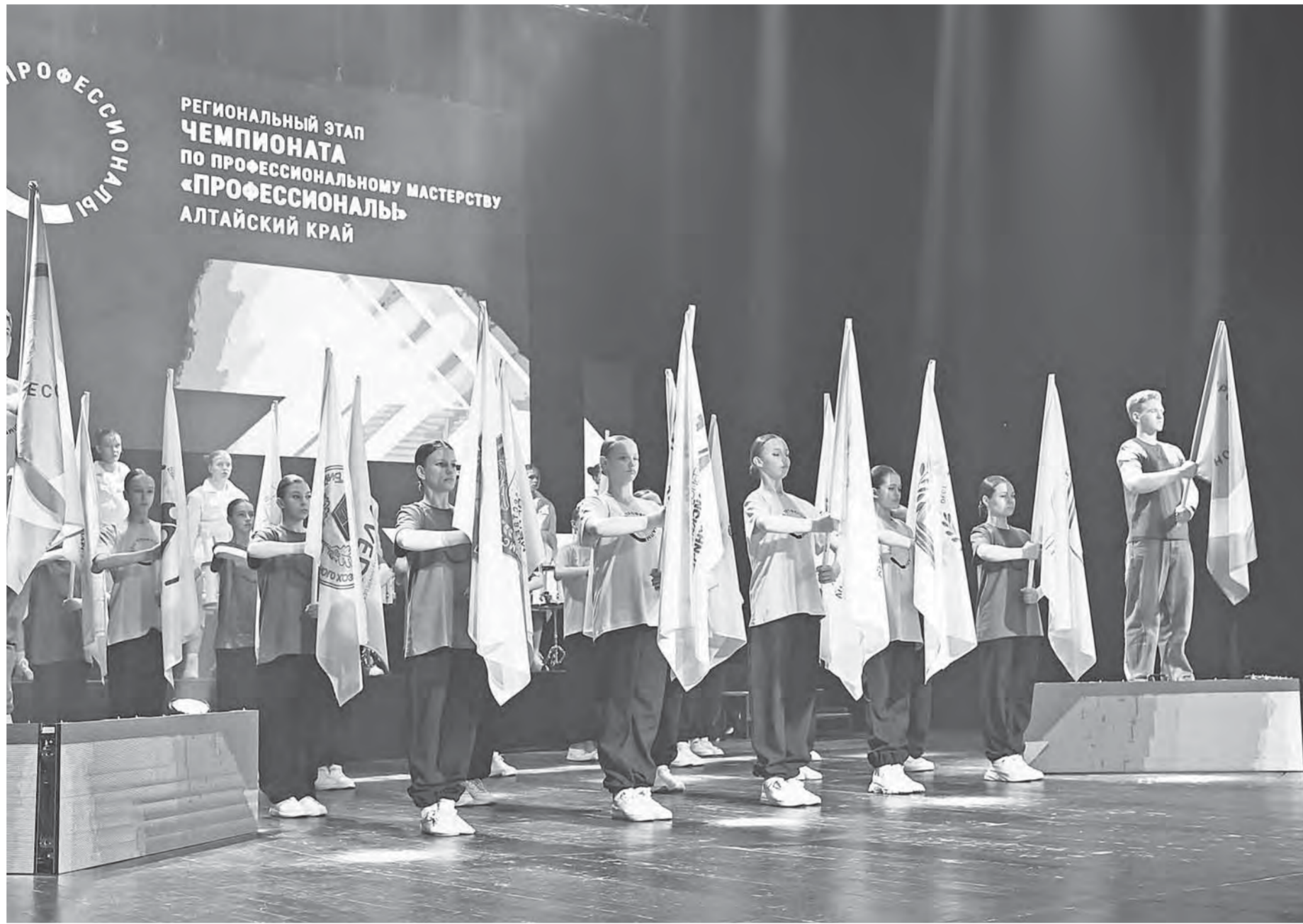
Открыли чемпионат 20 флаговосцев с символикой образовательных организаций, которые принимают соревнование на своих площадках.