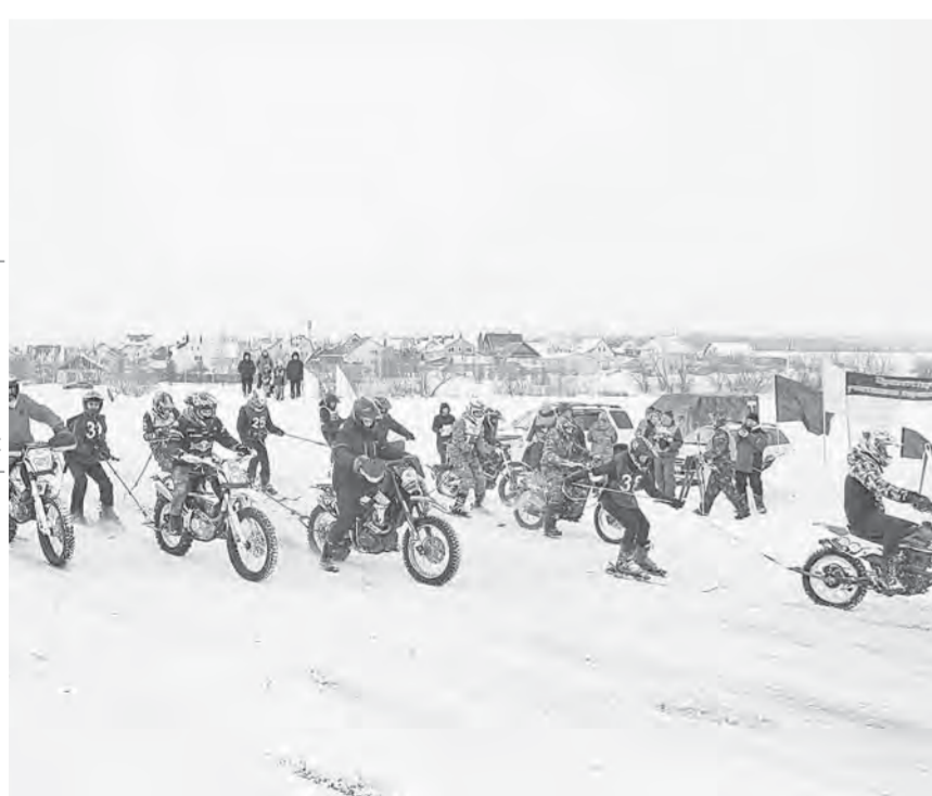
Скиоринг – отличная подготовка для мотоуристов перед летним спортивным сезоном.

В пригороде Индустриального района прошли городские соревнования «Весенняя капель» по скиорингу – мотолыжным гонкам, в которых мотоциклист буксирует лыжника.