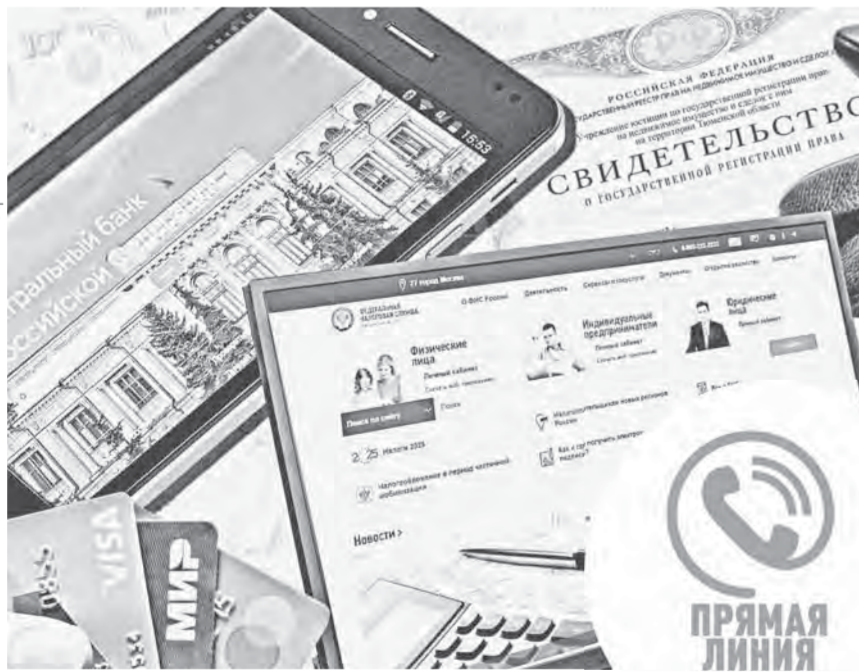
Коллаж: Александра ЕРМОЛОВА