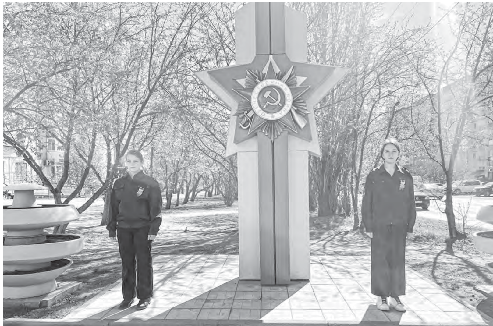
В памятные даты на аллее 60-летия Великой Победы можно встретить школьников, волонтеров, представителей общественных организаций.

В районах Барнаула продолжается благоустройство памятников и памятных знаков в год 80-летия Победы