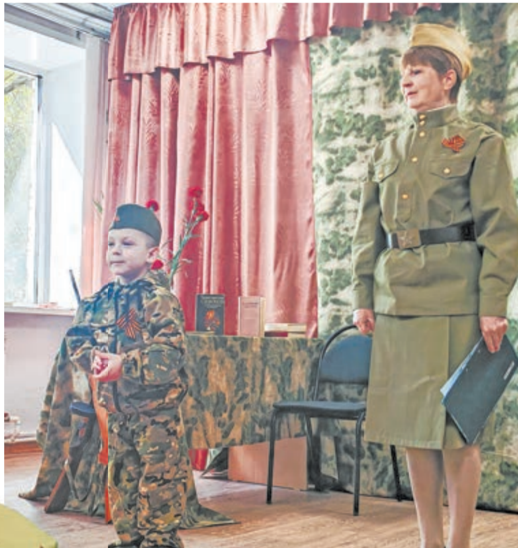
Творческая программа никого не оставила равнодушным.