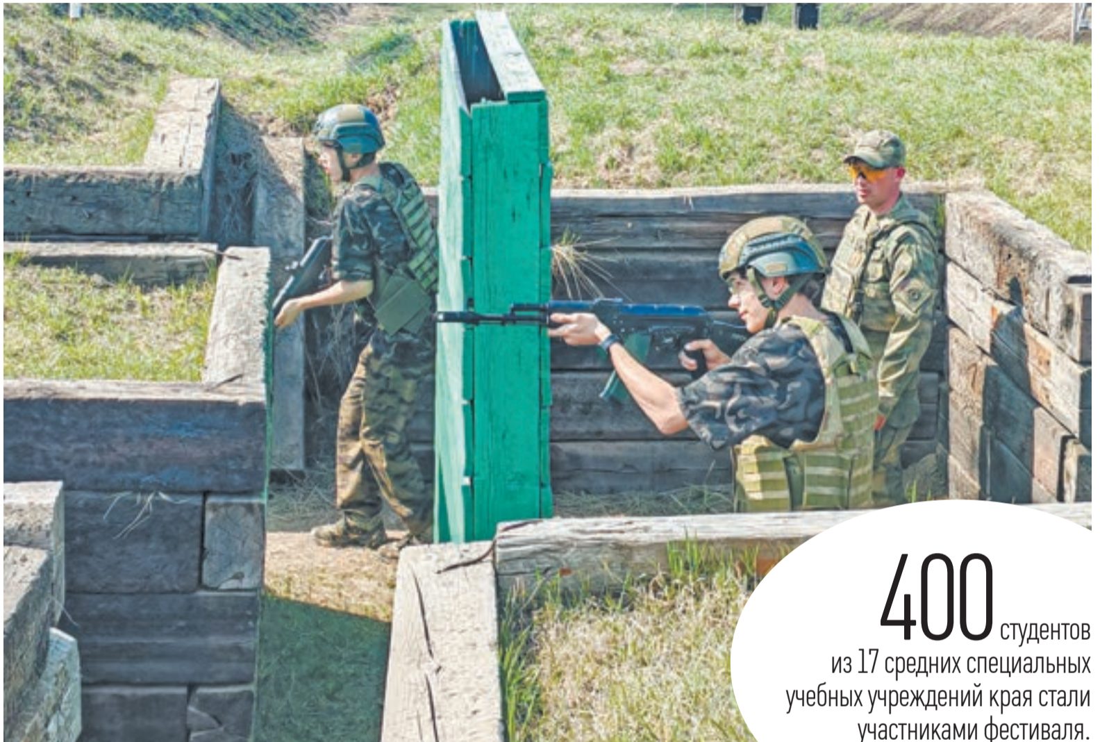
На полигоне студентам предложили различные локации для тренировок.

Так как многие студенты подобное обмундирование раньше видели только на фотографиях и не держали в руках, чтобы разобраться, как правильно его надеть и зафиксировать, потребовалось время.