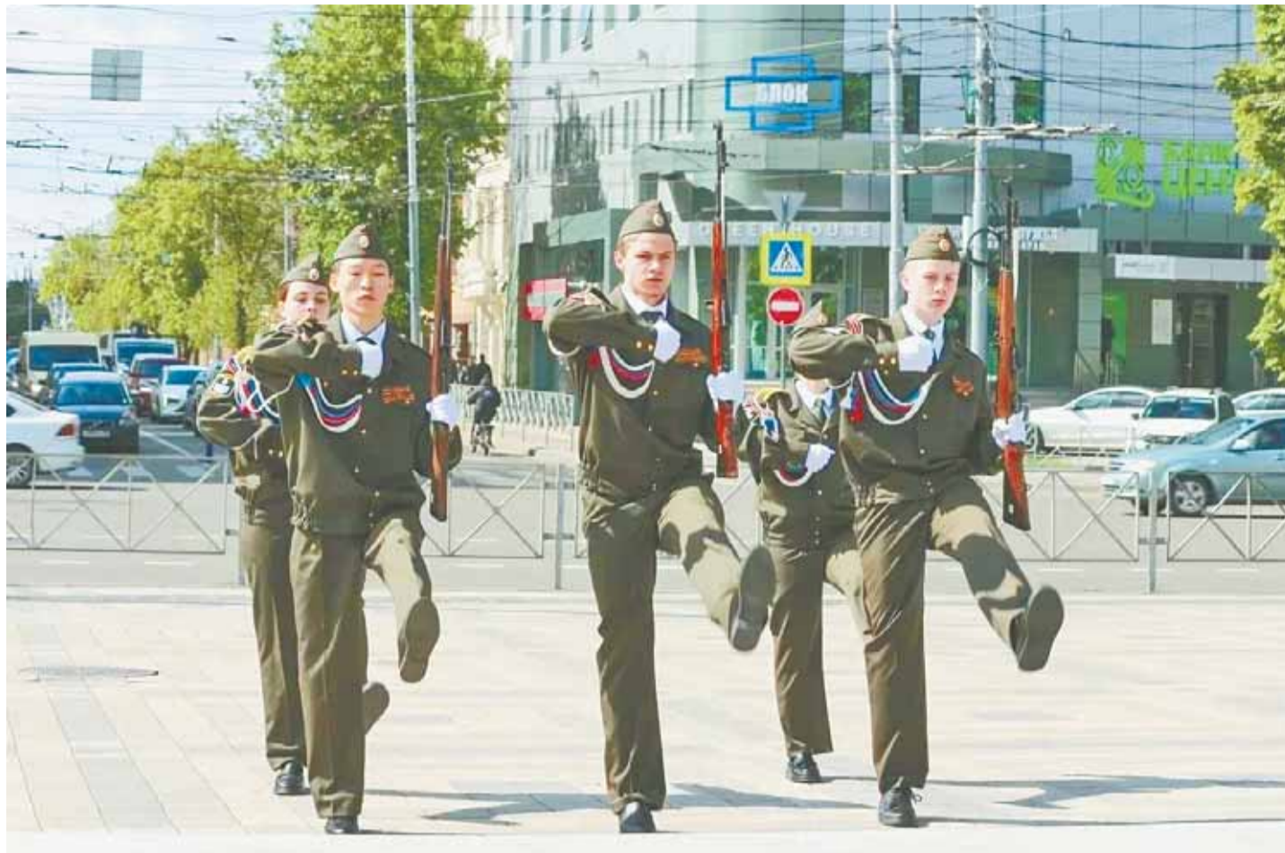
Юнармейцы школы № 78 достойно представили регион на IV Всероссийском слете почетных караулов постов № 1 в Краснодаре.