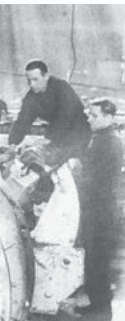
для фронта продукции.