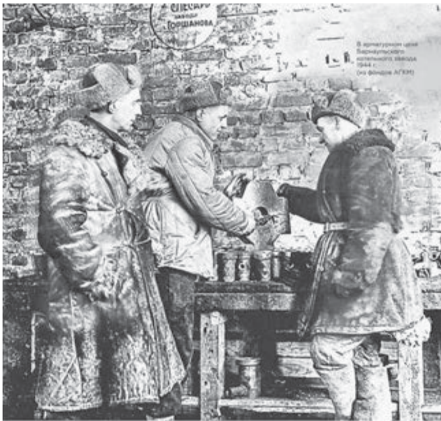
В подготовке материала использованы фото и документы фондов АГКМ и книги «Барнаул – город трудовой доблести. 1941-1945».