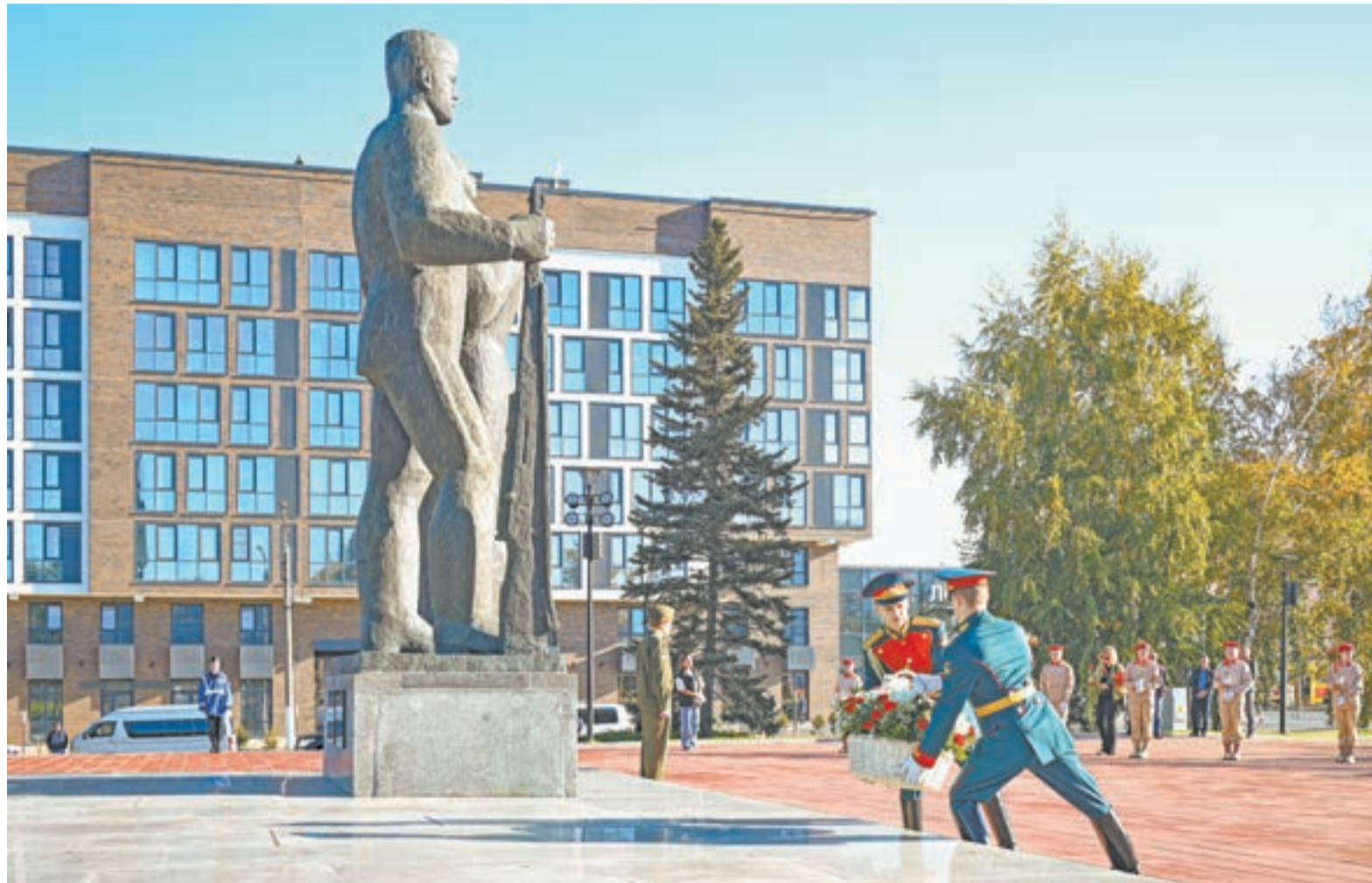
В этом году Барнаул отметит 55-летие с момента открытия первой очереди Мемориала Славы.