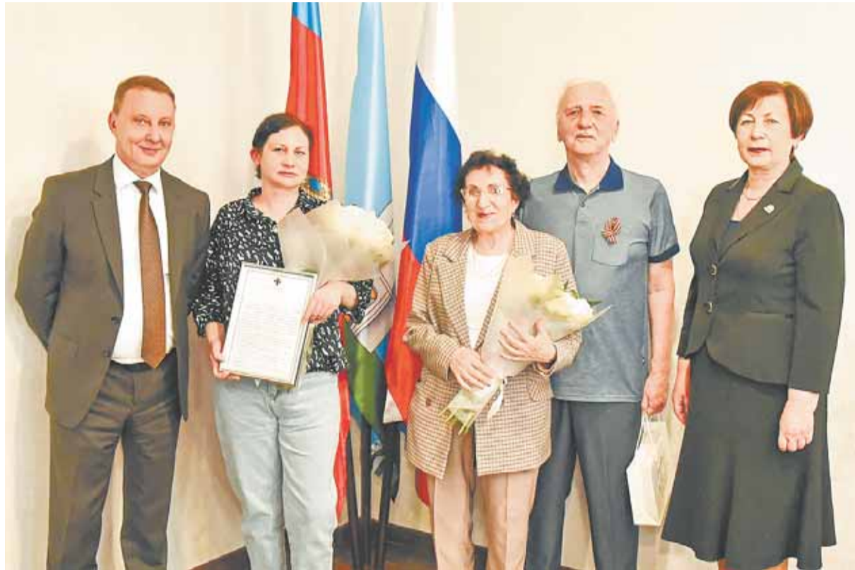
В завершение встречи участников поздравили с наступающим Днем Победы.

Служба в Президентском полку – почетная и ответственная миссия. Солдаты Президентского полка обеспечивают безопасность официальной резиденции главы Российской Федерации, участвуют в церемониях, имеющих государственное значение, несут караульную службу на главных мемориалах нашей страны в Москве. Требования к новобранцам предьявляются самые строгие: безупречная биография, хорошая спортивная подготовка, крепкое здоровье. Призыв на службу в