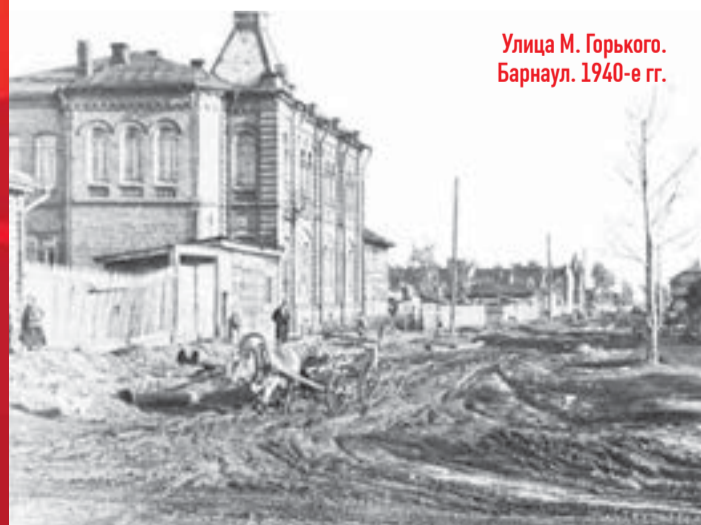
Улица М. Горького. Барнаул. 1940-е гг.

В течение всех лет войны в Барнауле собирали деньги на строительство боевой техники, посылки с теплыми вещами. Коллективы школ направили средства для строительства и передачи военным морякам торпедных катеров «Алтайский школьник» и «Пионер Алтая». В сентябре 1943 года «алтайские» торпедные катера в одном из дерзких рейдов открыли счет своим боевым победам. Кроме того, Барнаул принял 4 тыс. детей из блокадного Ленинграда.