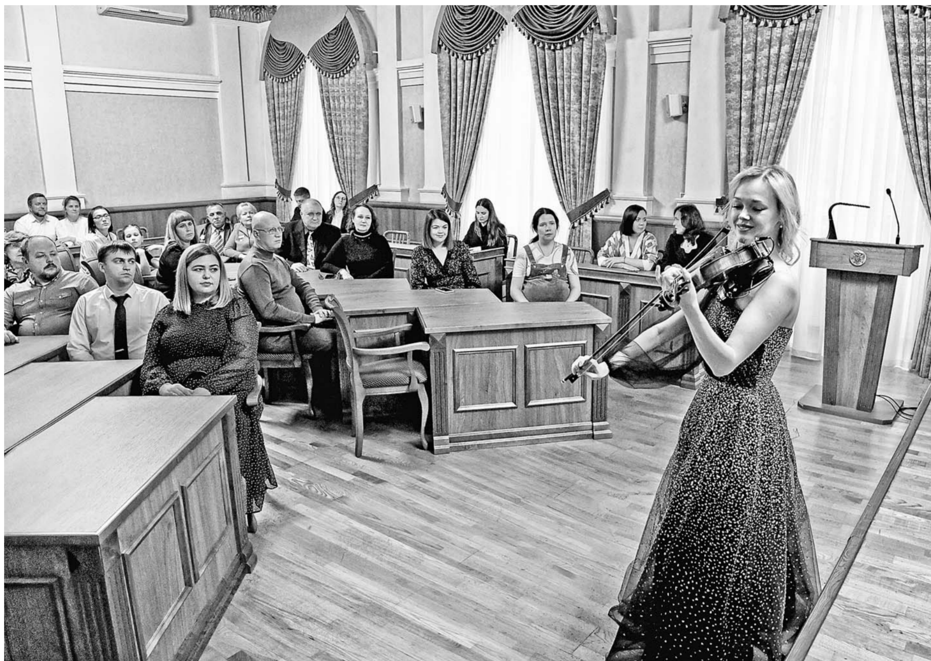
В адрес участников эстафеты прозвучали поздравления, также для них выступили музыканты города.