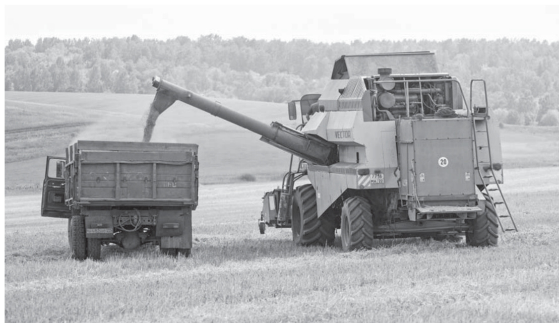
Уборочная страда в регионе завершилась с хорошими результатами.