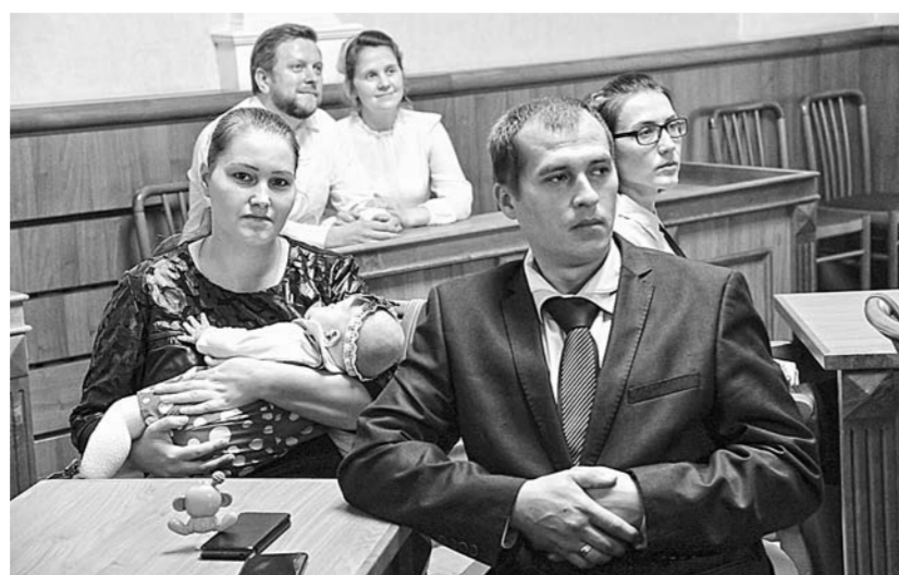
Участники эстафеты пришли семейными парами вместе с детьми.