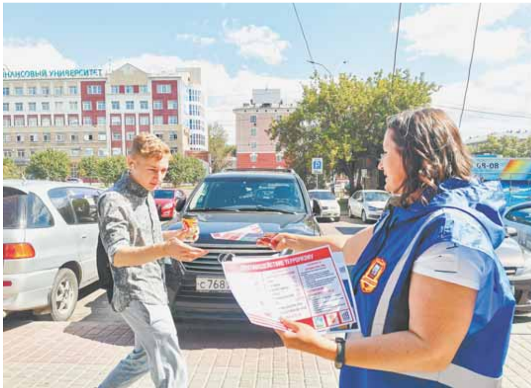
Подготовленные комитетом общественных связей и безопасности администрации города Барнаула листовки по профилактике экстремизма и терроризма распространяют дружинники, сотрудники полиции и специалисты миграционной службы.

Формируем контент для СМИ, социальных сетей и мессенджеров, направленный на социальную профилактику, предупреждение информирование и силовое реагирование.