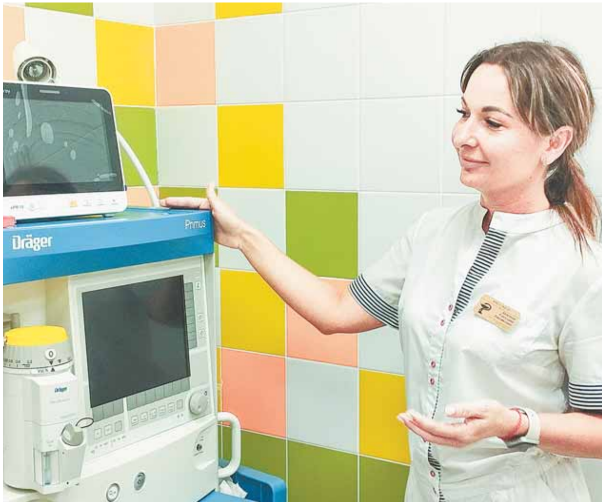
Современное оборудование позволит лечить зубы безопасно и безболезненно.