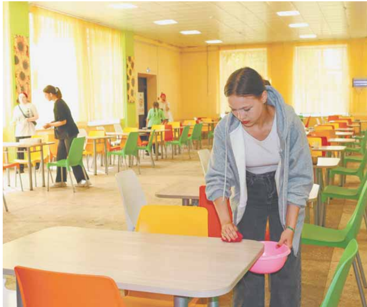
Вопросам условий пребывания детей в лагерях уделяется пристальное внимание.

В лагерях с отдыхающими ребятами регулярно проводят занятия, направленные на