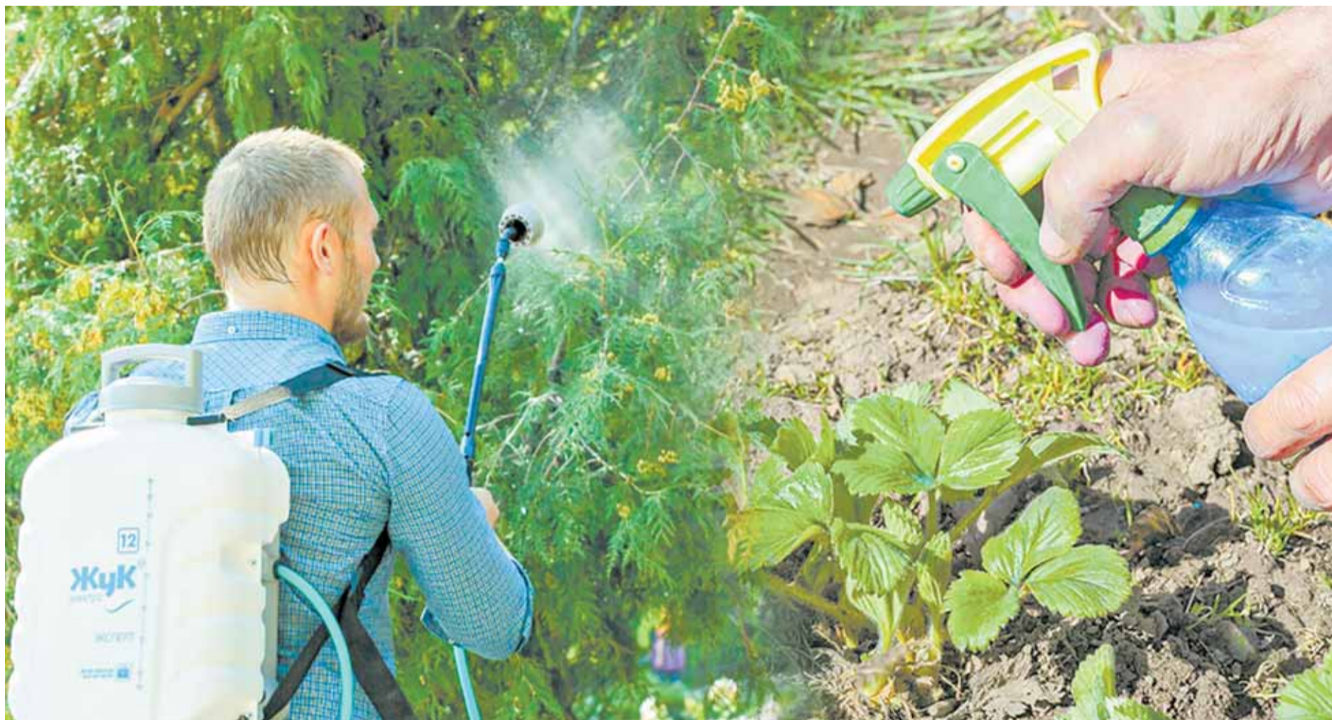
Коллаж Александра ЕРМОЛОВИЧА