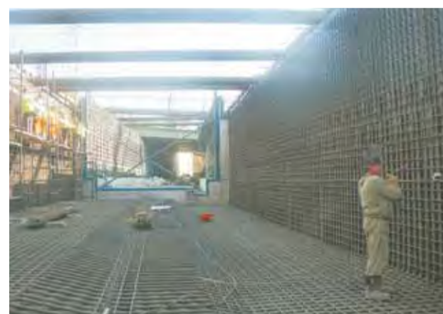
В две смены на объекте работает около 200 человек и несколько десятков единиц техники.