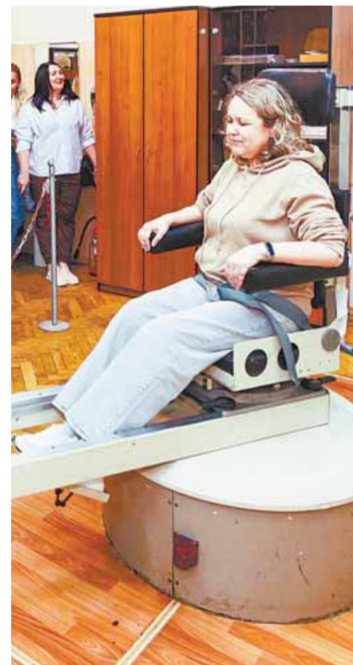
Расширенная экскурсия в Центр подготовки космонавтов включает посещение пяти объектов: зал тренажеров космического корабля «Союз», зал станции «Мир», зал российского сегмента Международной космической станции, Центрифуга ЦФ-18 и гидролаборатория.