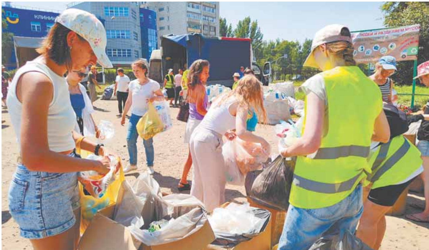
Горожане приносят на акцию чистое вторсырье, уже рассортированное по разным пакетам.