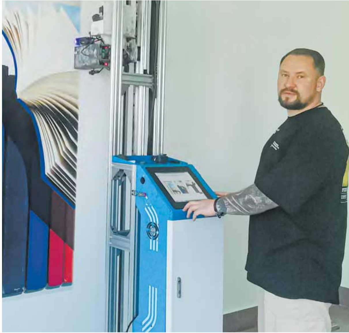
Скорость нанесения рисунка при работе – 2,5 квадратных метра в час.