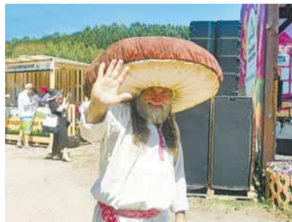
5000 человек посетили фестиваль «Ах!Фест».