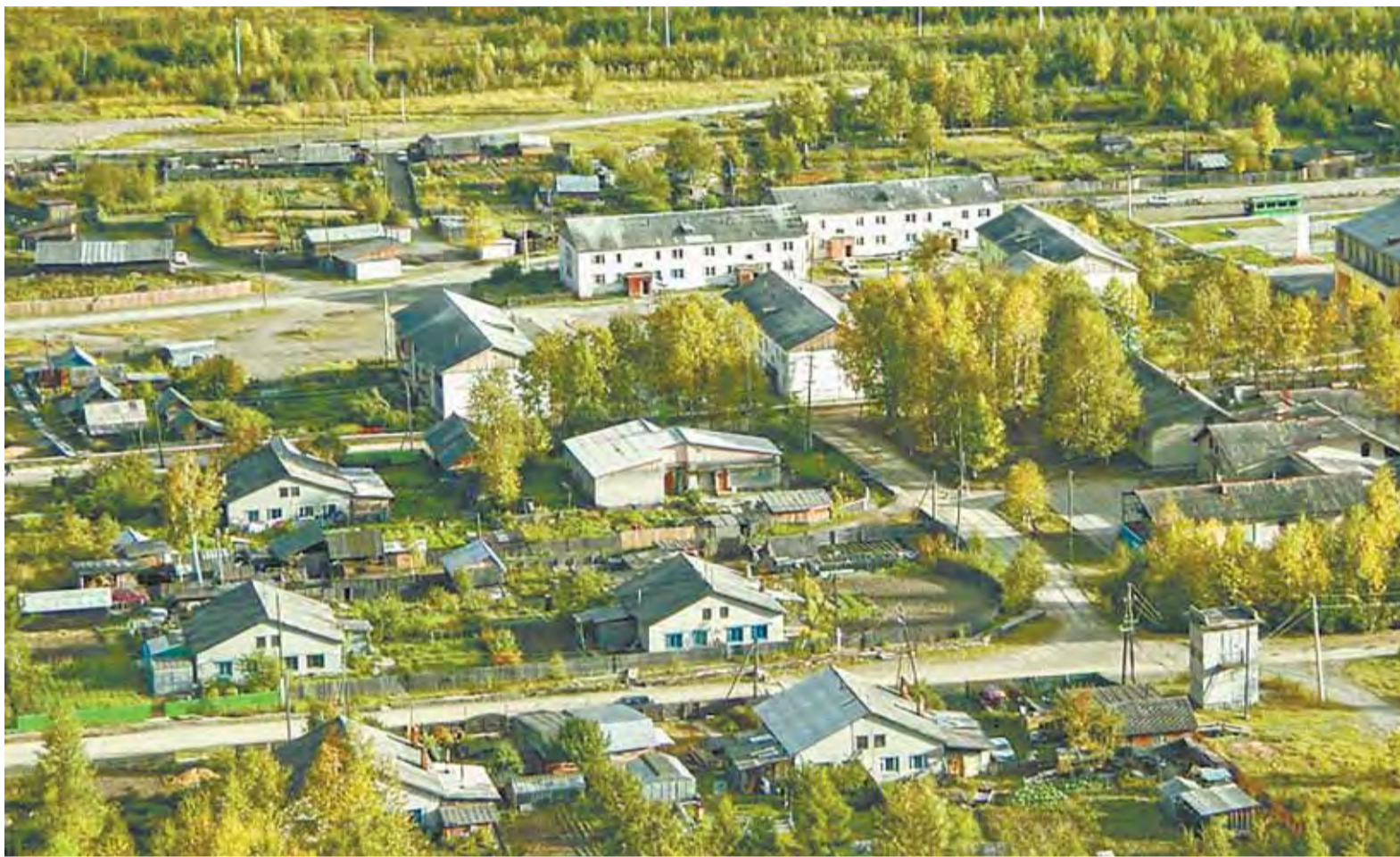
Современный вид Эворона.

Красивое название поселка Эворон в переводе с нанайского