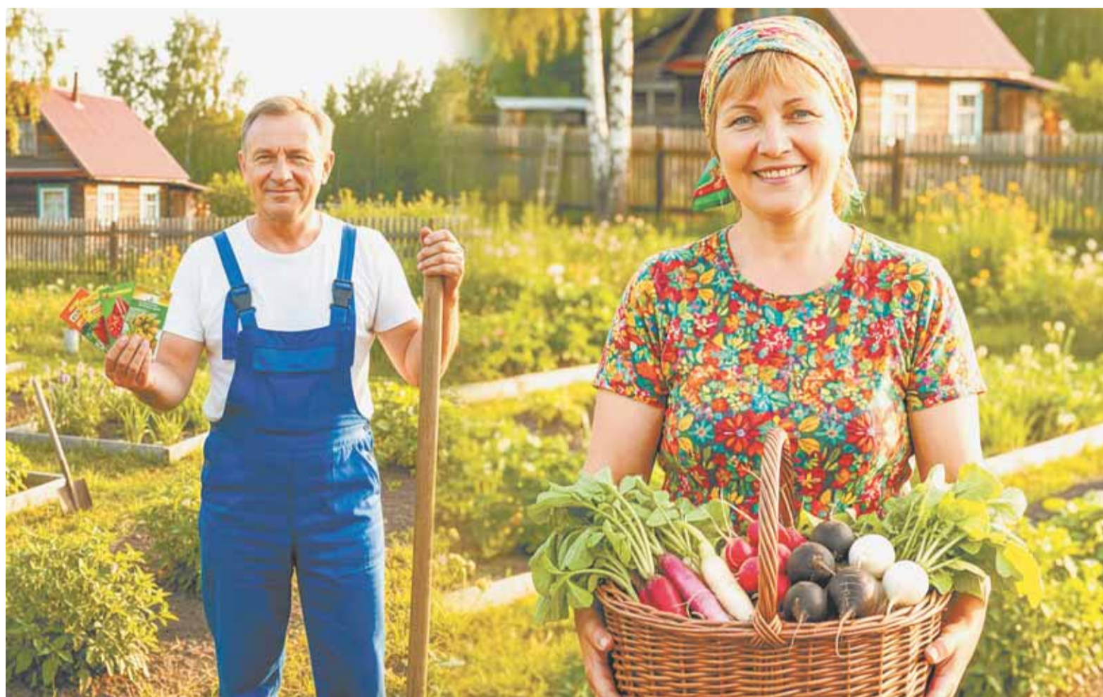
Коллаж Александра ЕРМОЛОВИЧА

Владельцам небольшого земельного участка сейчас придётся поломать голову, куда разместить семейство редьки на участке. Корнеплоды хоро-