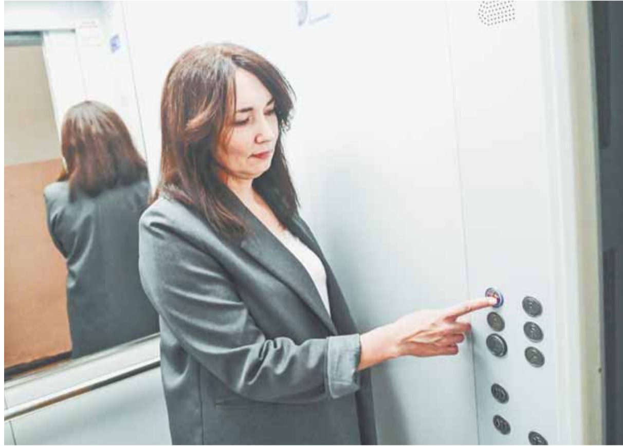
Собственники жилья бережно относятся к новым лифтам, радуясь их комфорту.

Как рассказал технический директор некоммерческой организации «Региональный оператор фонда капитально-