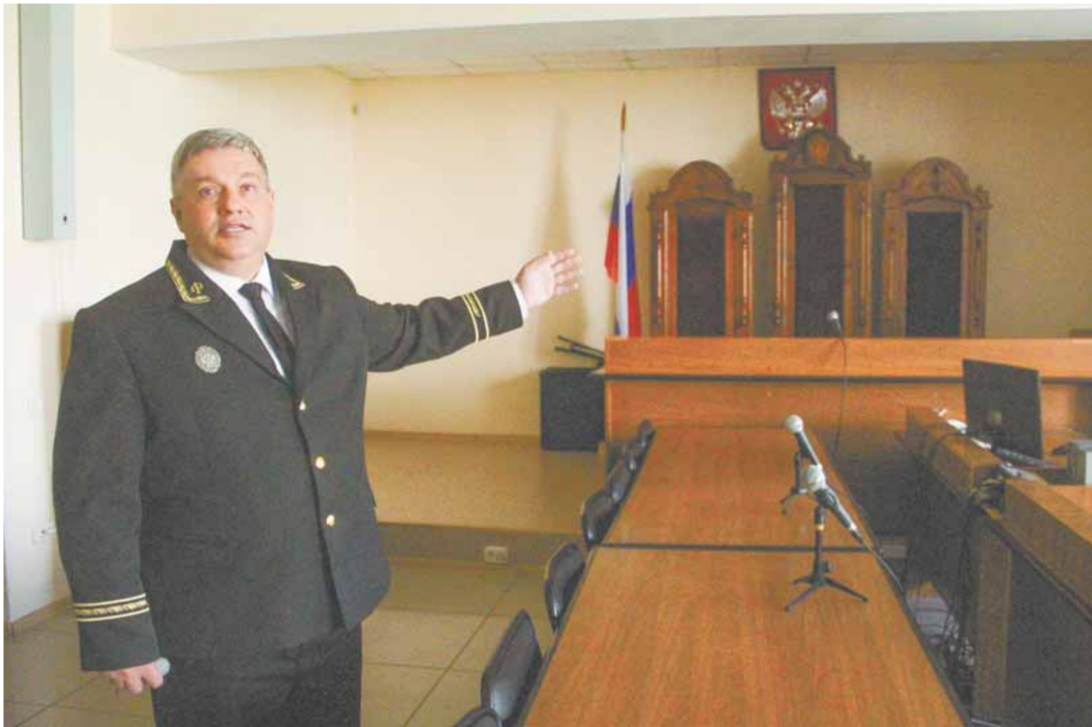
В самом большом зале заседаний № 108 судьи приносят присягу при вступлении в должность.