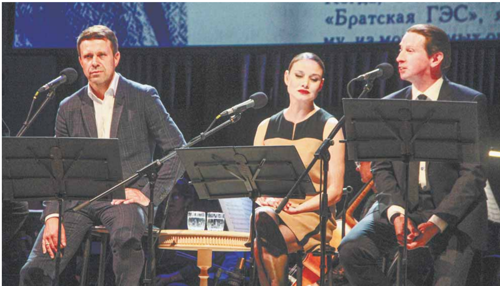
Для звёзд театра и кино поэзия шестидесятников – особый пласт культуры.