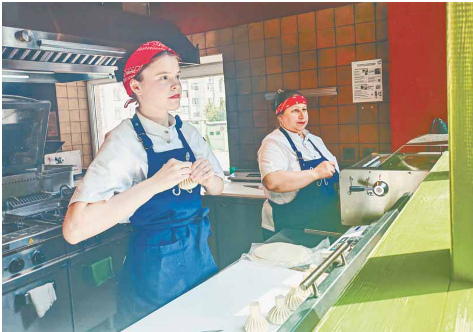
По стандартам, чтобы слепить одно хинкали, нужно не более 22 секунд.