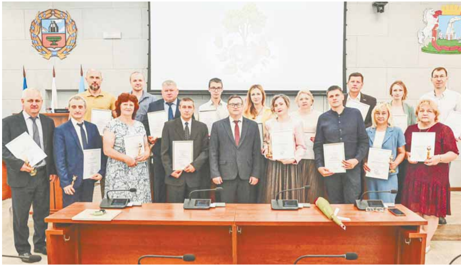
Участниками конкурса стали не только предприятия города, но и образовательные учреждения, общественные объединения, физические лица.