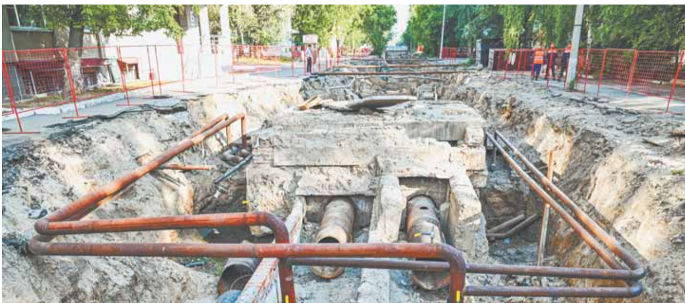
Ремонтные работы на теплосетях в Барнауле идут в плановом режиме.