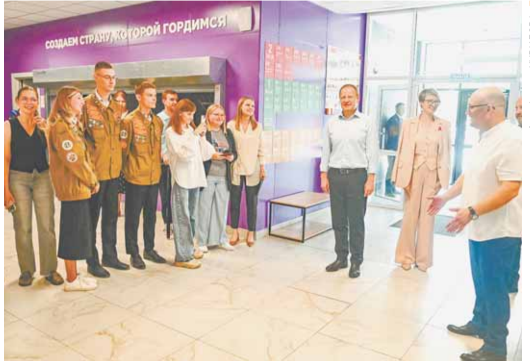
Первым мероприятием в новом пространстве стала встреча с молодыми активистами Алтайского края.