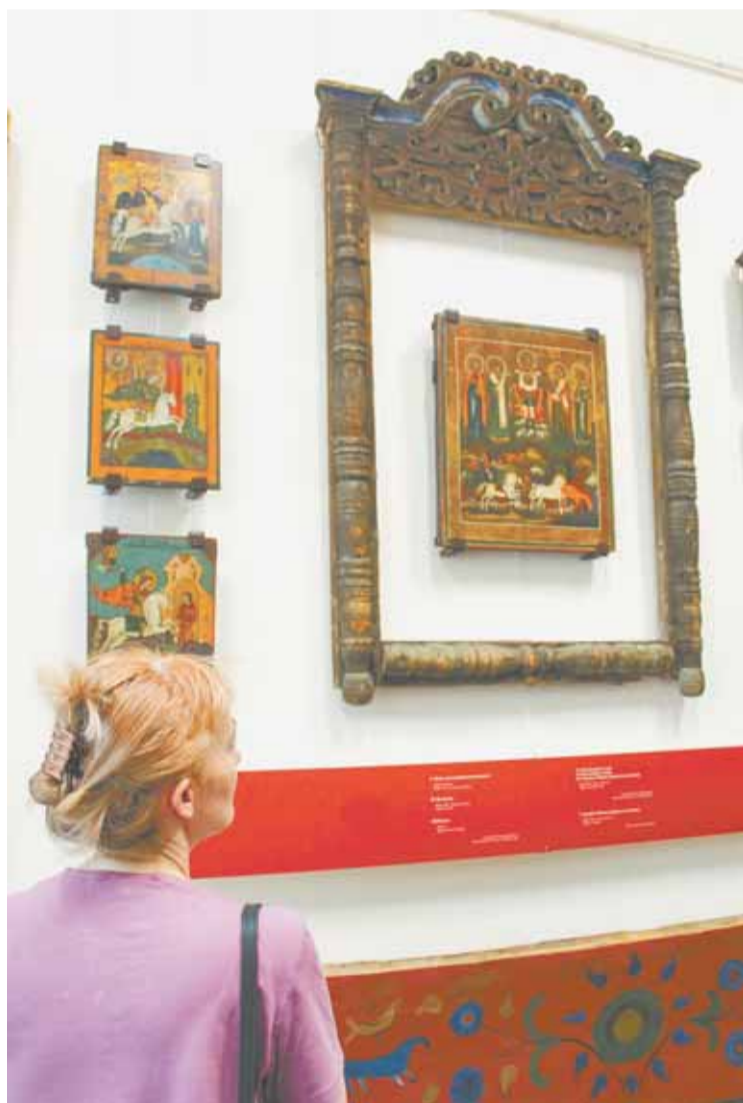
Выставка показывает, как народные промыслы развились из иконописного мастерства.