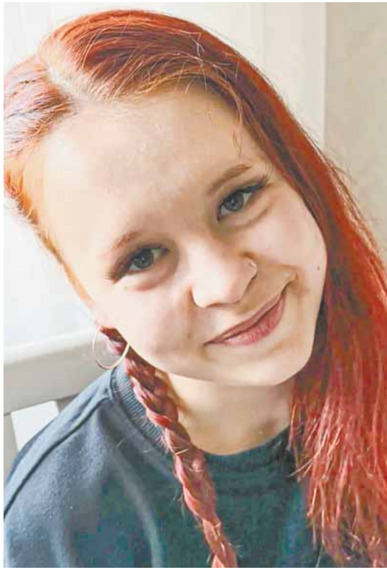
Секрет успеха на ЕГЭ – долгая и упорная подготовка.

Что же помогало школьнице не сдаваться при изучении