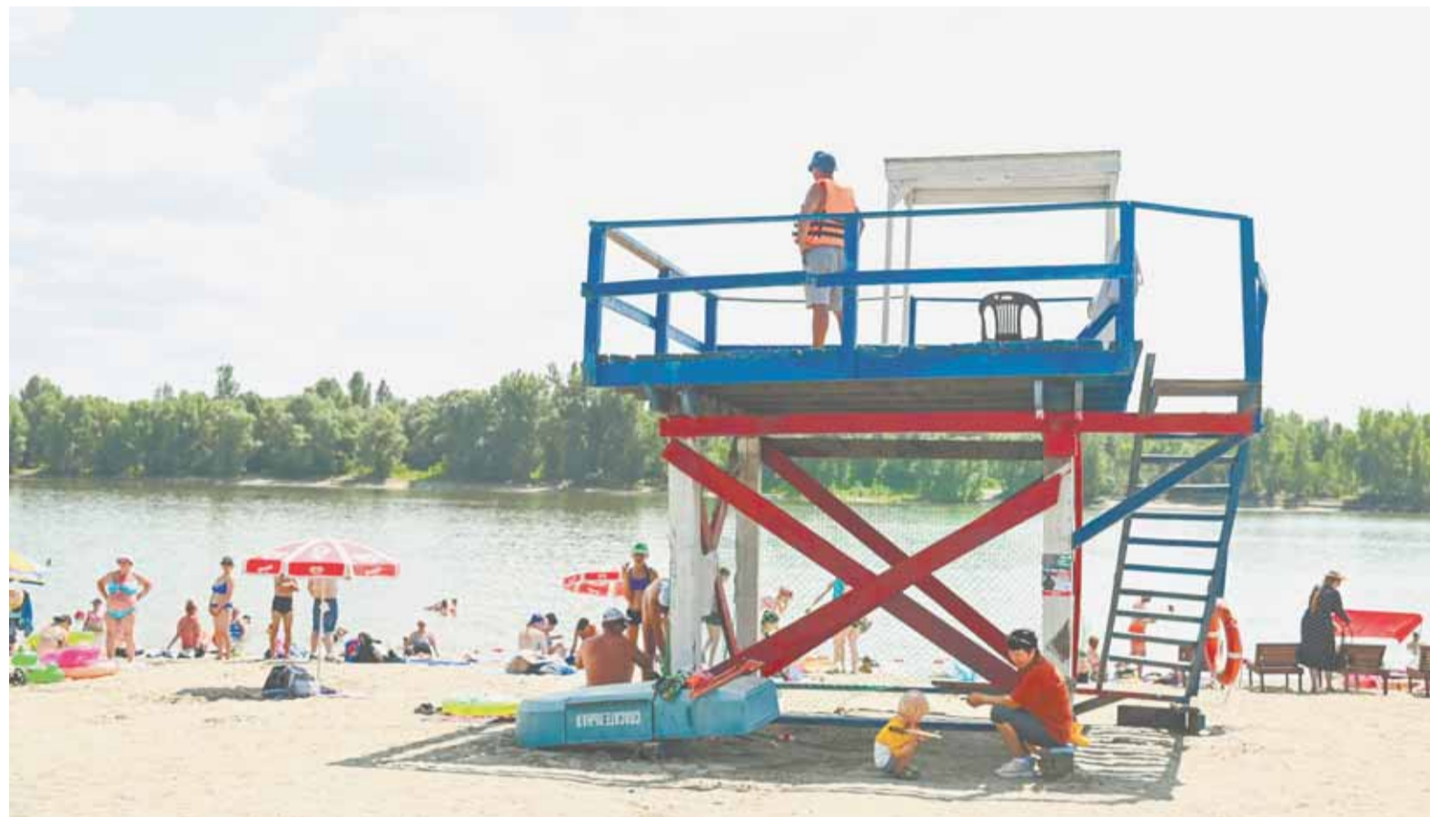
За обстановкой на берегу и в воде в зоне городского пляжа внимательно следят спасатели.

Ежедневно с 9:00 до 21:00 на городском пляже дежурят спасатели – от двух до четырех человек одновременно. Они поясняют: протяженность городского пляжа составляет 100 метров, поэтому для обеспечения безопасности доста-