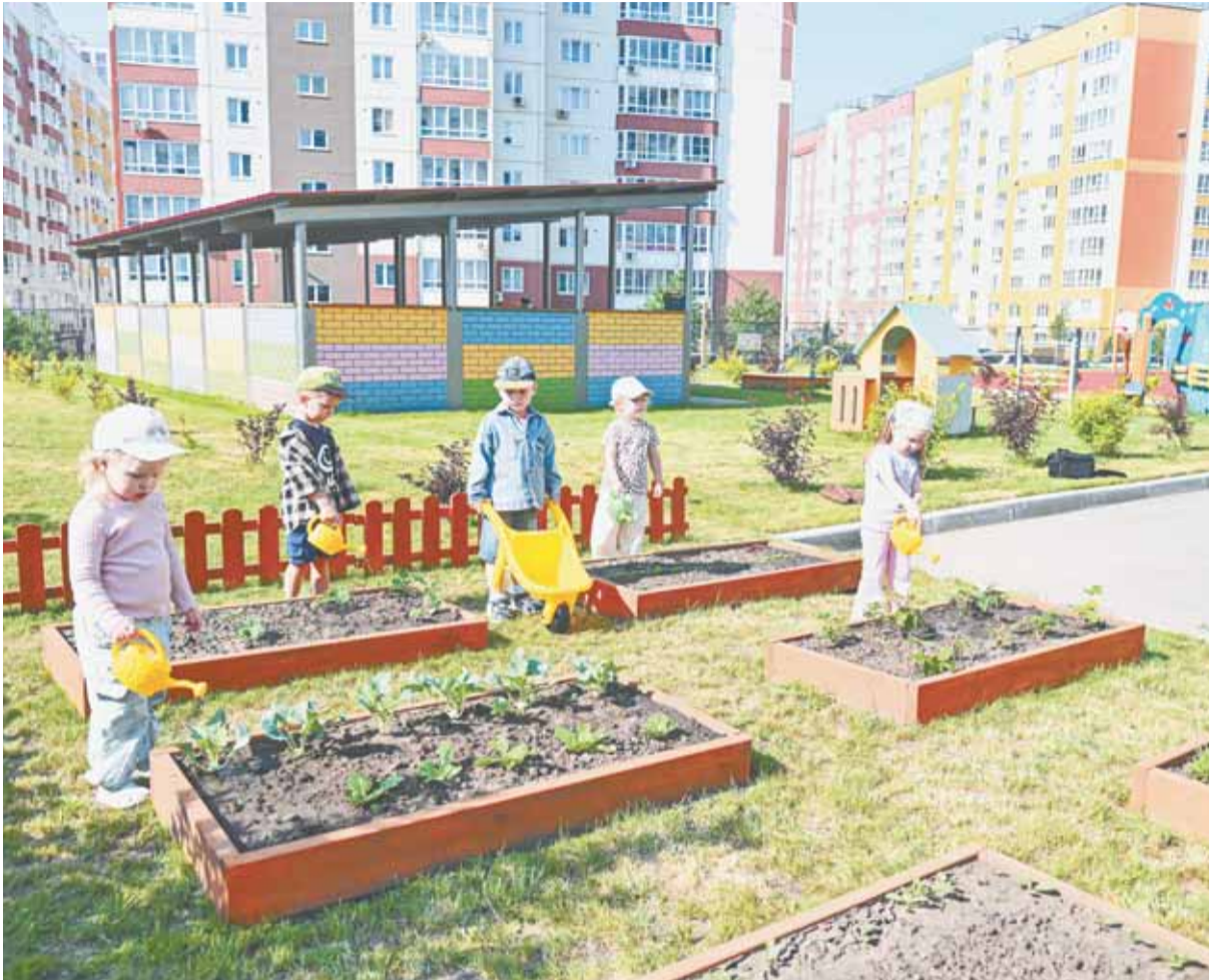
Каждый день у воспитанников детсада № 283 насыщен яркими событиями.