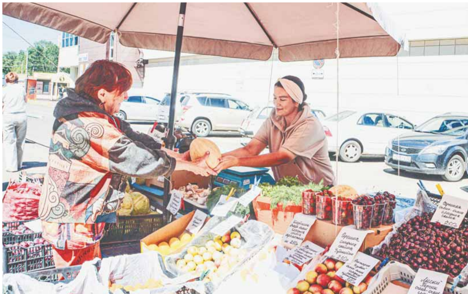
При покупке овощей и фруктов не лишним будет спросить у продавца разрешительные документы.

На территории Барнаула сейчас официально работают 25 палаток по торговле арбузами, дынями и овощами. Также торговля овощами и фруктами осуществляется на десяти постоянно действующих ярмарках города.