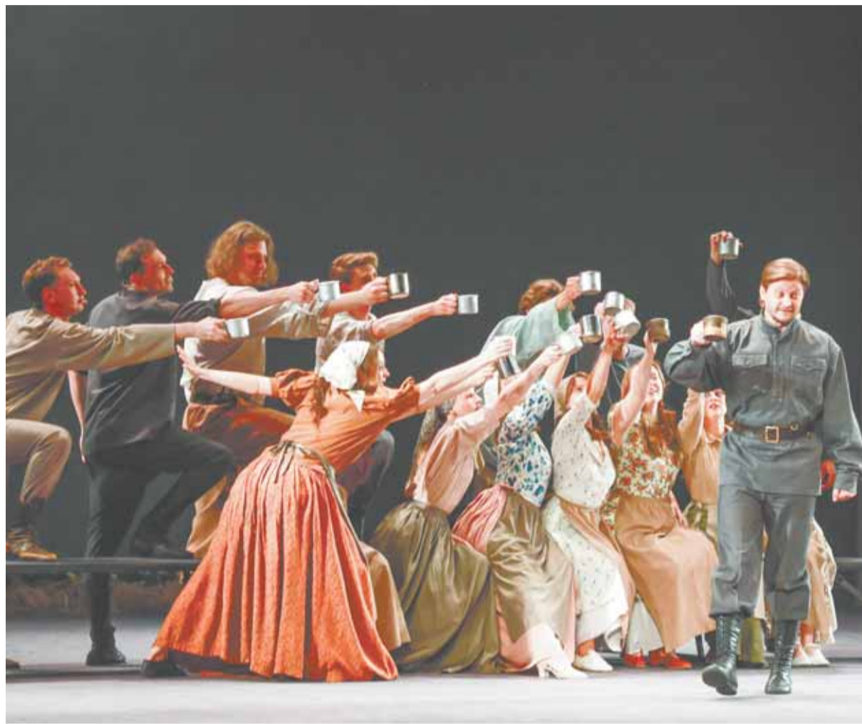
Сцены из спектаклей, связанных с Валерием Золотухиным, представили артисты МТА.

– Сегодня мы снова собрались в Молодёжном театре Алтая, чтобы отдать дань памяти и уважения нашему земляку, восхититься его талантами и творческой судьбой, – обратился к гостям и участникам губернатор Алтайского края Виктор Томенко. – В эти дни будем говорить о том, что Валерий Сергеевич оставил нам в наследство, что связывает его с нашим краем и каким был его вклад в развитие культуры нашего региона.