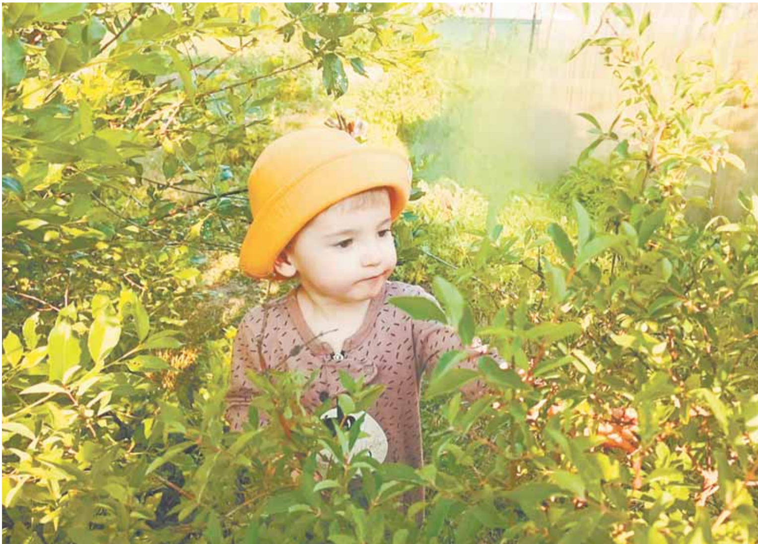
Ягоды и фрукты «прямо с ветки» всё равно нужно мыть перед едой.

важно хорошо мыть овощи, фрукты, ягоды, причём не только купленные, но и сорванные с ветки